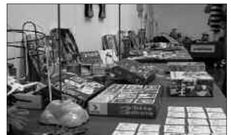
JOSTAILU AZOKA LARUNBATEAN EGINGO DA, GOIZEKO 11:00ETAN FRONTOIAN.

Gurasoei deialdi bat egin zaie, beraien seme-alabek erabiltzen edo behar ez dituzten jostailu, ipuin, liburu, DVD eta antzekoak eskatzu. Abenduaren 13ra arte, 17:00etatik 19:00etara Sutegiko erakusketa aretoan egongo dira Hitz Ahokoak material hori bildu ahal izateko. Biltzen dena, abenduaren 15eko azokan erakusgai jarriko da eta egun honetan umeek etxetik ekarriko dutena, azokan dagoen zerbaitengatik trukatu ahal izango dute.