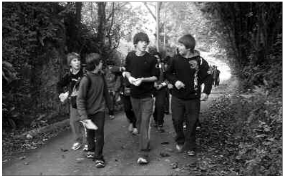
ATERPETXEAN BAZKALDU ETA GERO JOLASEAN IBILI GINEN.

nean jarri eta maketari, pintatu behar zen aldean, marrak egin genizkion.