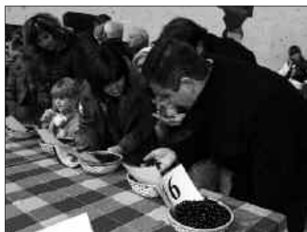
NOAUA!K ANTOLATZEN DU URTERO SANTO TOMAS AZOKA.

Babarrun zein sagardo lehiaketan, ondorengo sariak izango dira: