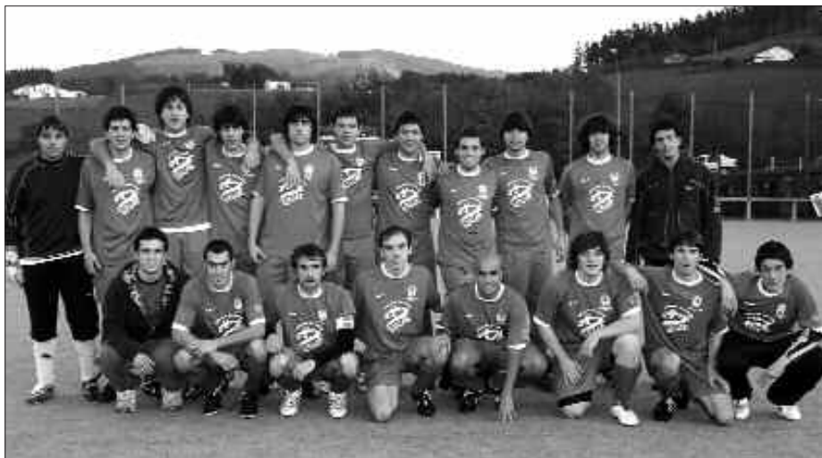
2. ERREJIONAL MAILAKOAK IGANDE ARRATSALDEAN JOKATUKO DUTE HARANEN.

Izan ere, lau jardunaldi daramatzate partidarik galdu gabe eta jokoan zeuden 12 puntuetatik 8 eskuratu ostean sailkapenaren erdialdean kokatu dira 16 punturekin. Hauxe izango da lehen itzulian etxean jokatuko duten azken neurketa, urte hasierarekin batera jokatuko baitute azkena Lesakan Beti Gazteren aurka, eta garaipena lortzea ezinbestekoa izango da 13 jardunaldi jokatu ostean usurbildarrek baino 5 puntu gutxiago dituen