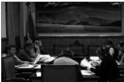
IRUDIAN, ASTELEHENEKO BATZORDEA.

Herritarrei ere aste hasieran jarritako hitzordura bertaratzeko deialdia egin zitzairen. Batzar irekia zen, eta ekarpenak egiteko aukera izan arren, saioa hasi zen unean ez zen inor hurbildu pleno aretora.