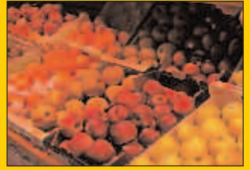
Fruta eta barazkiei buruzko erreportajea