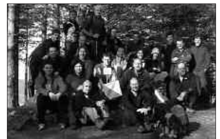
IAZ, ORIENTAZIO IKASTARDAN PARTE HARTU ZUTEN LAGUNAK.

Mendiko aseguru egiteko bi aukera eskaintzen ditu Andatza Mendi Elkarteak: asteartero 20:30ean, uda-