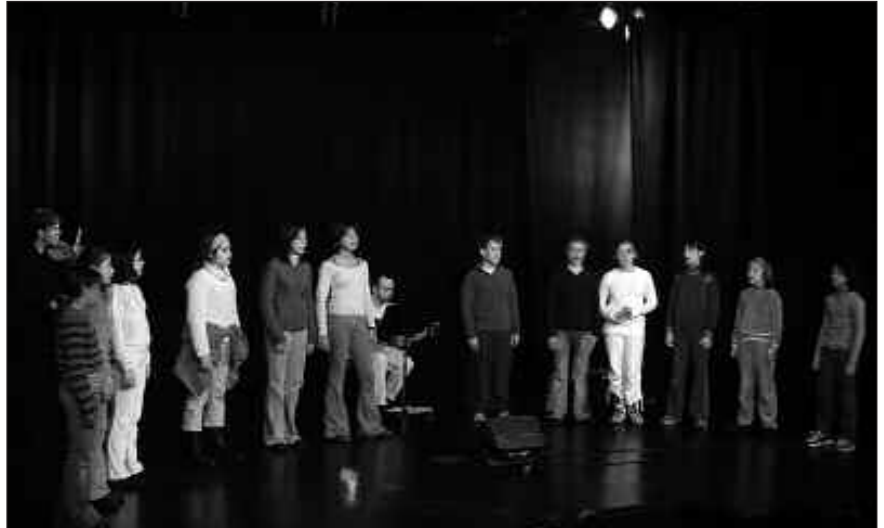
ARRATSALDEKO 19:00ETAN HASIKO DA KONZERTUA.

E guberrien atarian gaudela igartzen hasiak gara. Gabonetako ohiturak berritzeko garaia da, beraz. Batzuk hasi dira gabon eskeak prestatzeko entseguekin. Zumarte Musika Eskolakoak ez dira atzean geratu. Eguberrietako kantuekin osatutako errepertorioa eskainiko baitute datoren asteartean, abenduak 18, Sutegiko auditorioan. Arratsaldeko 19:00etan hasiko den saioan, Zumarte Musika Eskolako hiru abesbatzak entzuteko aukera izango dugu.