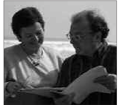
ADINDUAK DRAINIK GAUZA ASKO ESKAINI DIEZAIOTKE GIZARTEARI.