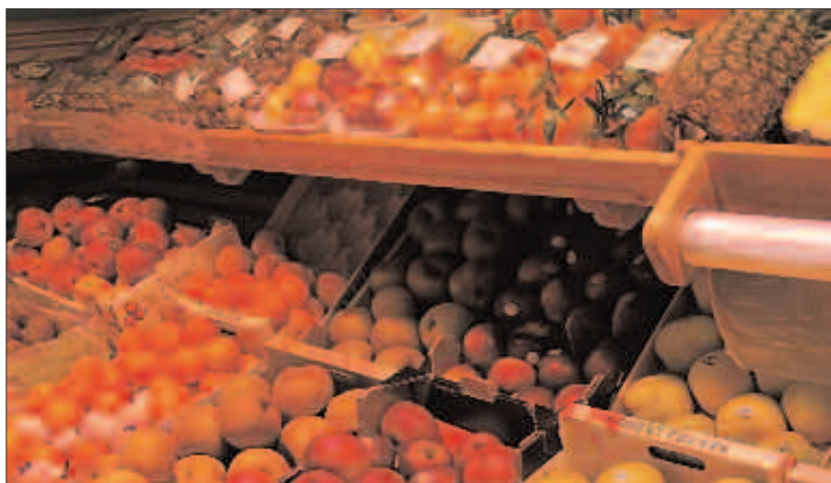
GEURE BURUARI ON EGITEN DIETE FRUTA ETA BARAZKIEK.

Bultzada horretan ere lagun ezinhobeak dira barazkiak. Elikagai arrastoei bultzada egin eta horiek desegiteko aipose-