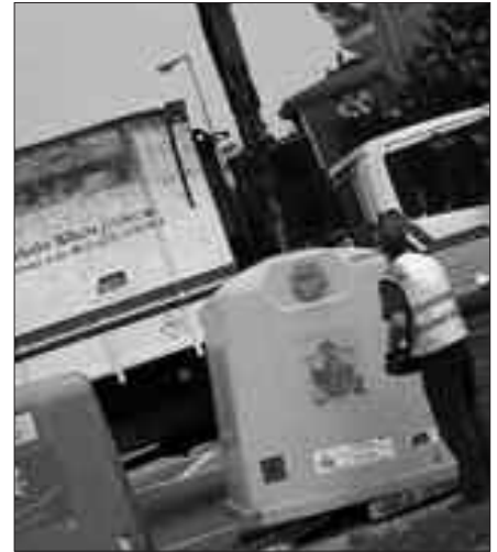
BEIRA, PAPERA ETA ONTZIAK DRAIN ARTE BEZALA BIRZIKLATZEN JARRAITUKO DUGU.

I. A. Argi eta garbi esan behar zaio jendeari, haiek zabaldu nahi duten mezua gezurra dela. Dena eginga dagoela eta alferrikakoa dela esaten dutenean, hemendik