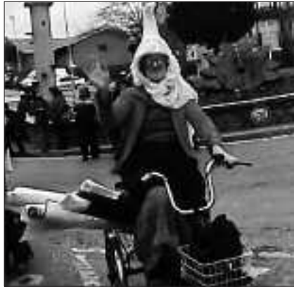
Asko gustatu zitzaigun guri bisitatzera etortzea!

Santo Tomasetan kantatzera atera ginenean, Lore etorri zen bizikletan eta gure eskutitz erraldoiak jaso zituen eta Ikatz bide osoan kantatu eta kantatu ibili zen.