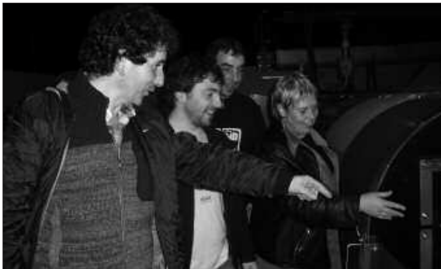
USURBILGO ORDEZKARITZA MALLORKAKO PUIGPUNYENT HERRIKO KONPOST PLANTAN.

atez ateko bilketa sistema martxan jarri duten herri horietako guztietako giltzarrietako bat, sentsibilizazio kanpaina izan da. Bertan izan diren herritarrek ere Usurbilen gauza bera egin beharra dagoela azpimarratzen dute. “Herritarrei arazoa zein den, zerk sortzen duen eta nola saihestu daitekeen azaldu behar zaie”, gogorarazi du Arrastoa.