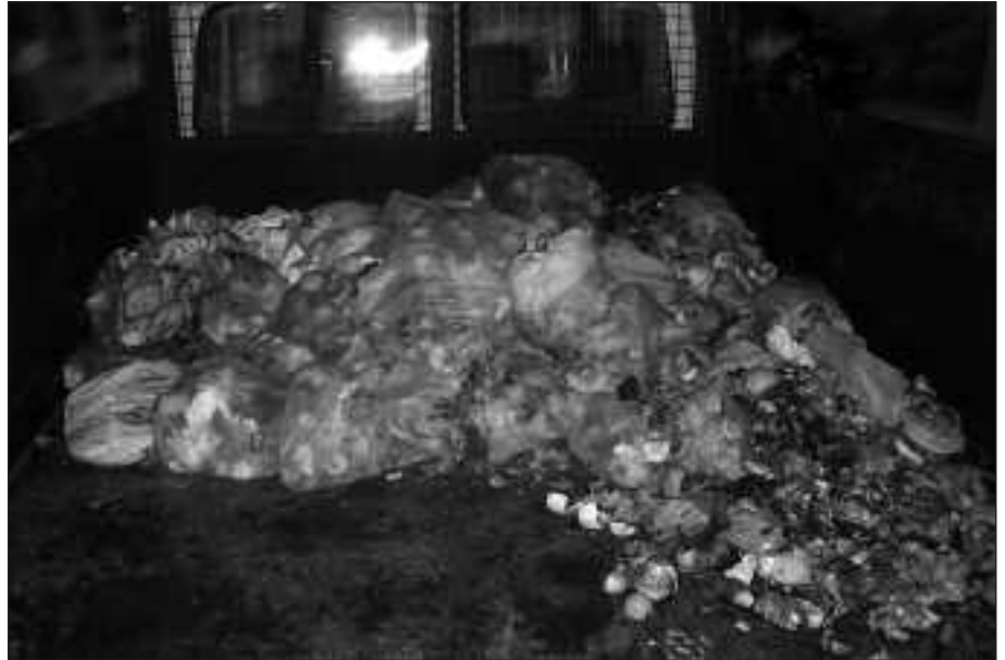
ZABOR ORGANIKOAREN BILKETA UNEA, MALLORKAKO PUIGPUNYENT HERRIAN.

Esperientzia berritzaile hauek abian jarri dituzten herrietan diotenez, ekimen horien arrakasta herritarren