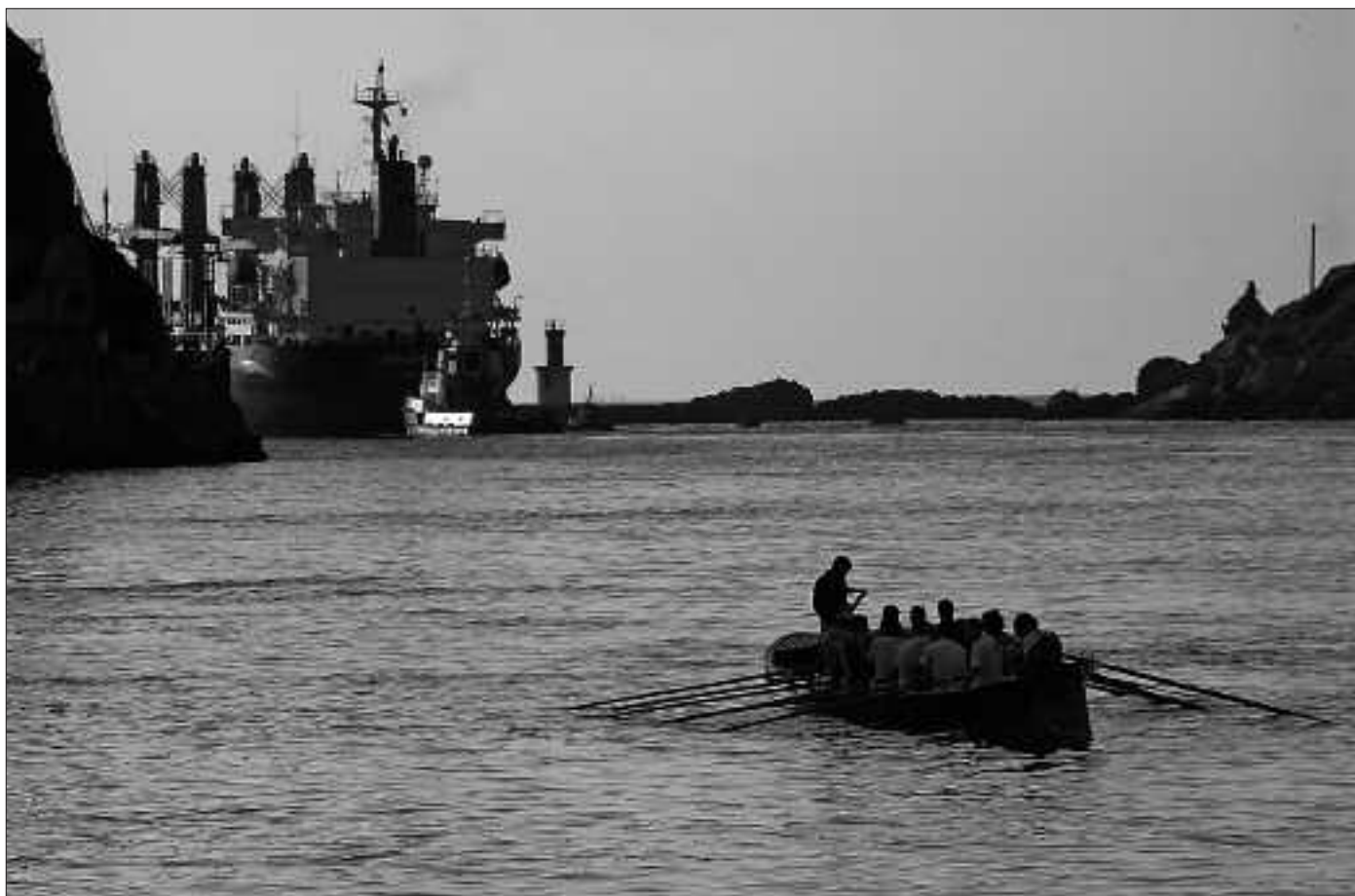
2005. URTEAN ATERA ZUEN ARGAZKI HAU, "DAVID ETA GOLIATH" IZENAREKIN BATAIATU ZUENA. LAN HONEKIN "EL DIARIO VASCOKO" IRAKURLEEN LEHEN SARIA JASO ZUEN. PASAIAN ATERATAKO IRUDIA DA.