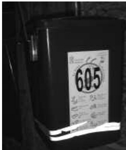
ONTZI HAUEK GARAI BATEKOAK ORDEZKATUKO DITUZTE.

Atez ateko sistema oso batekin elkarbizitzen hasiberriak dira Sant Feliukoak. Beira biltzeko ontzia izan ezik, gainerakoak pasa den azaroaren 19an kendu eta bi "emergentzia gune" jarri zituzten. Edozein kasutan, lehen urratsak 2004an hasi ziren ematen. Garai hartan, saltoki eta etxeetan sortzen ziren hondakinen zati bat atez ate biltzen hasi baitziren. Baina zati organikoan, hari ez zegozkion hondakinen tasa %7tik %8,5era igo zen. Herritarrek zaborra ez baitzuten behar bezala bereizten. Egoera horri informazio kanpaina batekin erantzun zioten. Une honetan, azken hilabeteetako pausoak baloratzen ari dira.