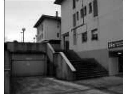
BERTAKO GARAJE ITXI BATEAN PIZTU ZEN SUTEA.

barruan zeuden beste zenbait gauza ere kaltetu zituen suteak. Suhiltzaileek goizeko 3:30ean amaitu zituzten garbiketa lanak.