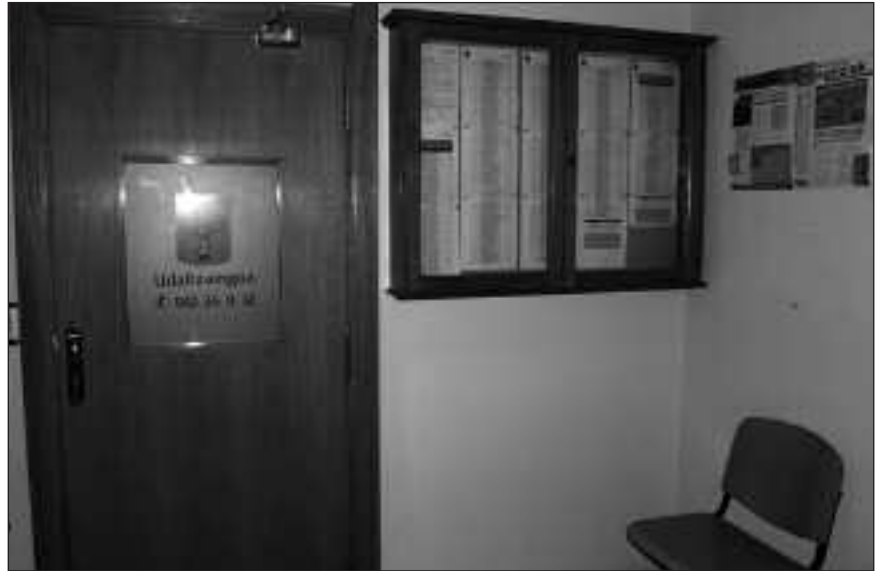
URTARRILAREN 24AN AMAITUKO DA ALEGAZIOAK AURKEZTEKO EPEA.

O larriondon eta Ugartondon eraikiko diren babes ofizialeko etxebizitzak 168 izango dira. Iazko udaberrian izena emateko epea zabaldu zenean, 420 eskari jaso ziren. Eskaera horietatik 362 izan dira onartuak eta 58 baztertuak. Izena eman zuen eskatzaile bakoitzak aste honetan bertan jasoko du jakinarazpena. Hortik aurrera, alegazioak egiteko hamar eguneko tartea izango da. Udal idazkaritzatik esan digutenez, alegazioak egiteko epeak urtarrilaren 14tik 24era iraungo du. Etxebizitzaren zozketa, aldiz, uda aurretik egin nahi du udal gobernuak.