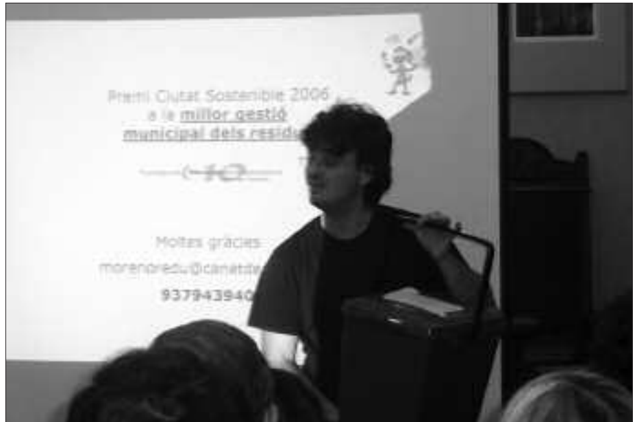
ATEZ ATEKO ZABOR BILKETA DHIKOA DA KATALUNIako HERRI ASKOTAN.

Proiektua jaio zenetik herritarrak izan dira hondakinaren kudeaketan egin beharreko aldaketen protagonista nagusiak. “Herriko Agenda 21” delakoan biltzen ziren zonalde ezberdinetako biztanleak eta udal ordezkariak. 2001etik egin dituzten inbertsio guztiak bilgune horretan kontsultatuak izan dira; hala nola, zer hiri hondakin bildu, horiek jasotzeko egutegia zehaztu edota informazio kanpainak nolakoak izan behar zuen ere eztabaidatu zuten, astero antolatzen zituzten bilera