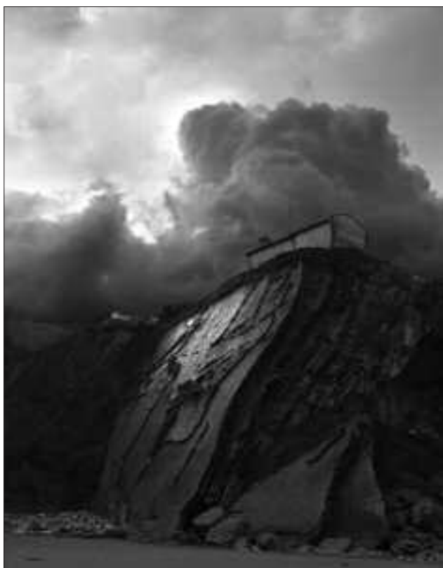
ZUMAIAKO SAN TELMO, ITZURUN HONDARTZATIK ATERATAKO IRUDIA.