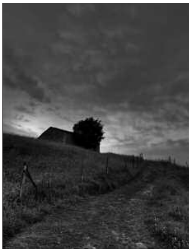
UDARREGI BASERRIA. DENA DEN, KOLORETAN INDAR GEHIAGO DU.