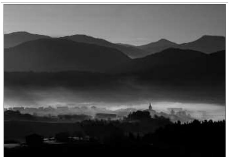
URTARRILAREN LEHENEAN ATERA ZUEN USURBILGO ERRETRATU HAU. GOIZEAN GOIZ ATERATA DAGO.