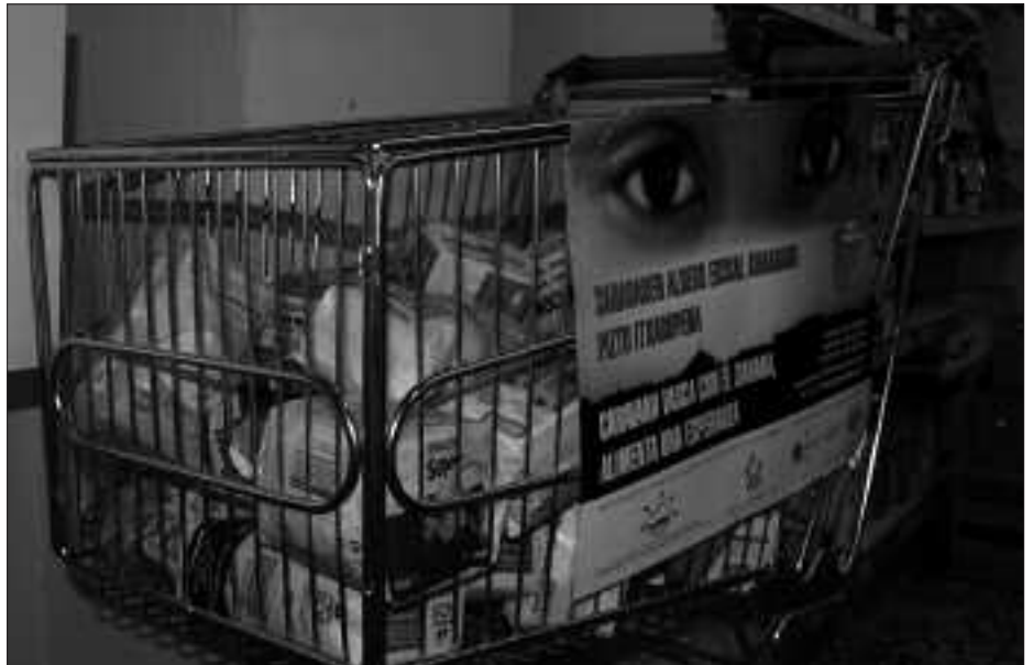
ALIPROXEN ETA DIAN, SALTOKIEN ATARIAN DAUDE JANARIAK UZTEKO KARROTXOAK. AGINAGAKO EIZAN, ARITZETA DENDAN ETA UDARREGI IKASTOLAN ERE BADIRA.

Ibilgailu horiek kanpalekuetara iritsitakoan, bertan geldituko dira, kanpalekuetara heltzen den giza laguntza-