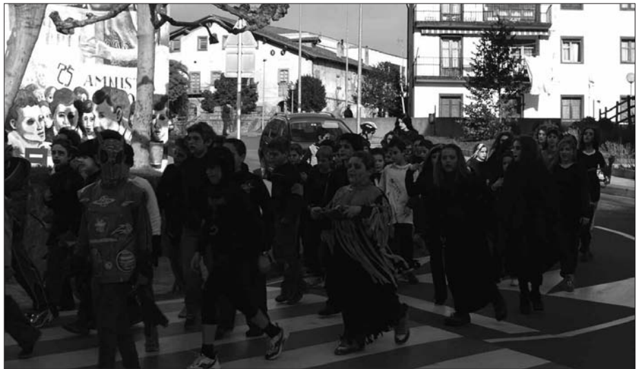
UDARREGI IKASTOLAKOAK OTSAILAREN 1EAN ATERAKO DIRA KALEJIRAN, BAINA INAUTERI JAIA OTSAILAREN 2AN LARUNBATEAN OSPATUKO DA.

Hollywoodeko izarrak edota marrazki bizidunetako pertsonaia ezagunenak, ikus-entzuleen gustukoena bildu zituzten aurreko urteetako inauterietan. Munduan diren kultura ezberdinek ere bere tartea izan zuten orain urte batzuk. Antolatzaileek pare bat ideia zituzten buruan aurtengorako. Azkenean, urtero parte hartzen duten beste koadrilekin hitz egin ostean, zomorroen gaiak jaso ditu aldeko bozka gehien. “Ideia polita iruditzen zitzaigun, baina hasiera batean zaila. Gero, ordea, egin daitekeela kontura-