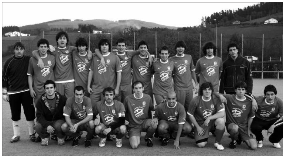
EZ DUTE IGOERA FASEA JOKATZEKO TXARTELA ESKURATU.

Hala ere, Kopa txapelketa jokatu dute herriko jokalaria gazteek. Lehen bost sailkatuek lortuko dute igoera fasea jokatzeke txartela eta beste guztiek