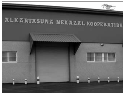
KOOPERATIBA SORTU ZELA 100 URTE BETE DIRA AURTENTZEN.

Saritutako logotipoaren egileak, Alkartasuna kooperatiban bertan