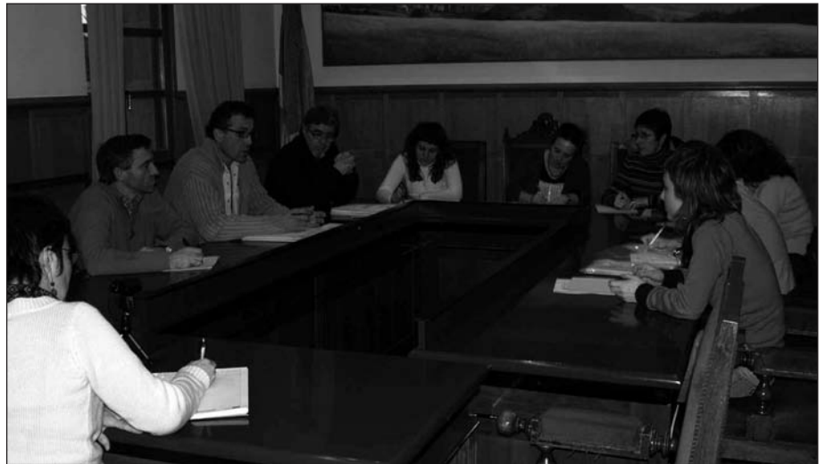
LEHENGO ASTEKO BILERAN, UDARREGI IKASTOLA, HAUR ESKOLA, IKASTOLAKO GURASOAK ETA UDAL ORDEZKARIAK BILDU ZIREN.