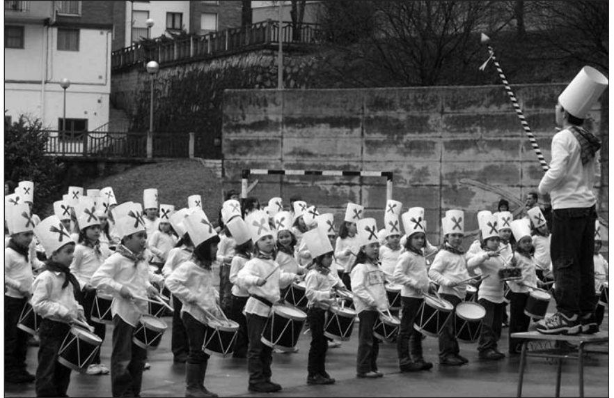
IKASLEAK GOGOTSU ARITU ZIREN DANBOR FESTAN.

A maitu dira San Sebastianak, han eta hemen. 24 ordu irauten duen etengabeko jai horren aurretik, ordea, ikastetxe askok eskaintzen dituzte danborrada saioak. Udarregi ikastolan bai behintzat. Urteroko hitzorduari eutsiz, San Sebastian bezperatan, pasa den urtarrilaren 18an ikasleen danborrada saioa izan zen patioan. Arratsaldeko 15:30ak pasatxotan hasi zen emanaldia. Danbor joleak ikustera joan ziren guraso eta irakasleez bete zen ikastola aurrea. Haur Hezkuntzakoek ere haien emanaldia eskaini zuten. Batean zein bestean, eguraldia lagun izan zuten.