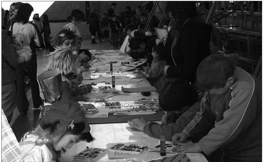
OTSAILAREN 2AN LARUNBATA, GAZTETXOEN JOLASEAN ARITZEKO AUKERA ASKO IZANGO DITUZTE.

Usurbilgo Antzerki Tailerreko kideek ere mozorroren desfilearekin lotutako emanaldia prestatu dute eta otsailaren 2an eskainiko dute. Erakustaldiak geroa ere jarraituko du. Animalia espezieka banatuta eta dantzen bidez, liztor eta erleak, euliek, harrek eta amona mantangorriek euren itxura gainerakoena baino politagoa dela garbi uzteko aukera izango baitute. Hitz Ahotik deialdi zabala egin nahi dute: "Gazteak hasi jantziak eta aurkezpen edo dantzaren