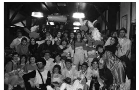
IAZ, SAIZAR SAGARDOTEGIAN BILDU ZIREN "BRASILDARRAK".

Sarrera kopuru hori saldutakoan, ez baita bertara joateko modurik izango. Gogoratu, afaria otsailaren 2an. Sarrerak eskuratzeko azken eguna: urtarrilak 31.