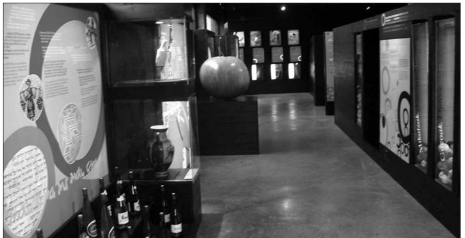
SAGARDOAREN EKOIZPEN PROZESUA NOLAKOA DEN EZAGUTZEKO AUKERA ESKAINTZEN DU ASTIGARRAGAN DEN MUSEO HONEK.

Orditik sagardoaren ekoizpenak gora beherak izan ditu. Beheraldia, bereziki, 60. hamarkada aldean. Arrazoiak beti interpretagarriak diren arren, aditu batek baino gehiagok urte haietan ekoizpenean izandako beherakada edari berrien agerpenekin lotzen dute; Kas edota Coca-Cola marka eza-gunekin adibidez.