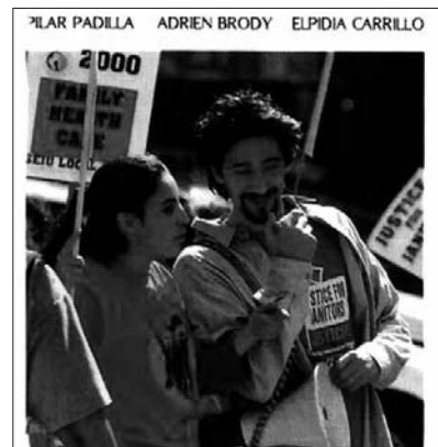
ADRIEN BRODY DA PELIKULAKO AKTOREETAKO BAT.