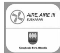
Gipuzkoako Foru Aldea