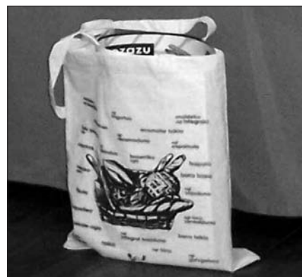
POLTSA HAUEK OPARITUKO DITUZTE.

Ez da soilik bere lanean edota erosketetan egunero euskara darabilten saltzaile eta bezeroei zuzendutako ekimena. Erdaraz mintzatzen direnengana ere iritsi nahi dute Buruntzaldeko ordezkariak. Haien produktuen euskal izenak jendaurrean erakusgai jartzea, aipatu hizkuntza normalizatzeko aurrerapausotzat jotzen baitute ekimenaren eragileek.