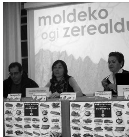
OGIEN EUSKAL IZENDAPENAK SUSTATZEKO KANPAINA IZANGO DA.

Ez da merkataritzaren alorrean egiten den lehen kanpaina, 2002. urteaz geroztik ugari egin baitituzte. Gogoan hartu adibide gisa, duela gutxi bailarako fruta dendatan egin zena, edota iaz, arrande-