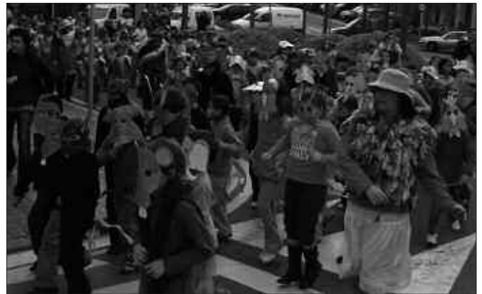
ADIN ETA MAILA EZBERDINETAKO IKASLE ETA IRAKASLEEK HARTU ZUTEN PARTE OSTIRALEKO KALEJIRAN.