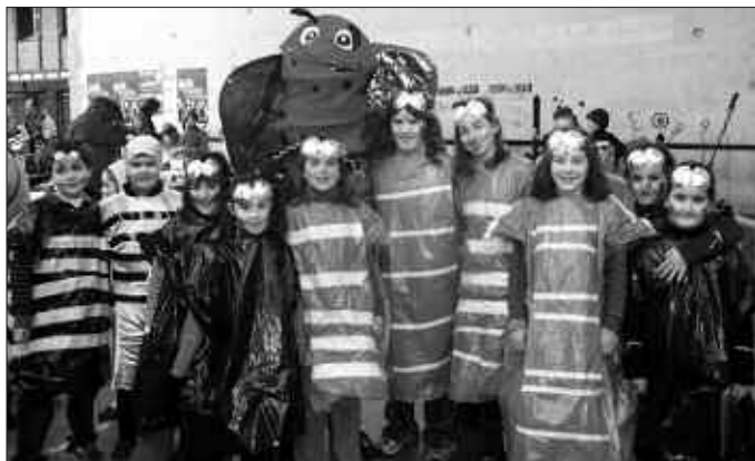
ERA GUZTIETAKO XOMORROAK IBILI ZIREN LARUNBATEAN; GOIZEAN, ARRATSEAN NAHIZ GAUEAN.