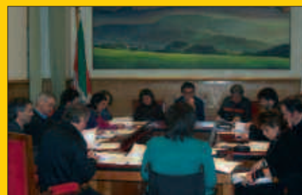
2008ko udal aurrekontu proposamenak aurrera egin du