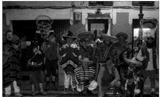
XOMORROEN GAIA ALDE BATERA UTZI ETA MEXIKARREZ ATERA ZEN KOADRILA HAU.