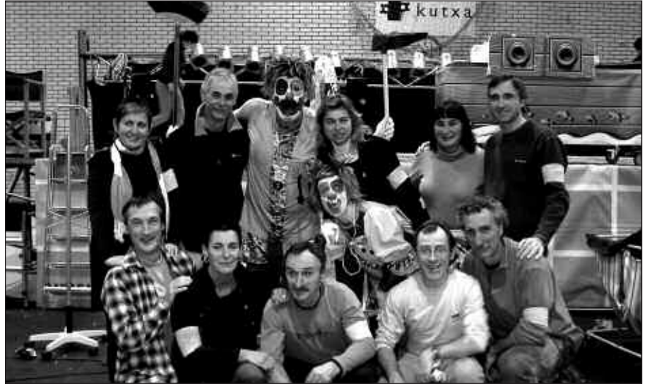
ABENDUAN IZAN ZIREN AZKENEKOZ USURBILEN PIRRITX ETA PORROTX. IRUDIAN DIRA ANTOLATZAILEEKIN BATERA, ARGIAREN LAGUNAK TALDEKO KIDEEKIN ALEGIA.