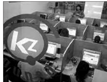
9.00ETATIK 13.00ERA IREKIKO DA KZGUNEA OTSAILEAN.

Otsailean, goizeko ordutegia- rekin irekiko dira KzGuneako ateak, ordutegi hone- kin: 9:00-13:00. Eskaintza, hona- koan ere, oparoa da.