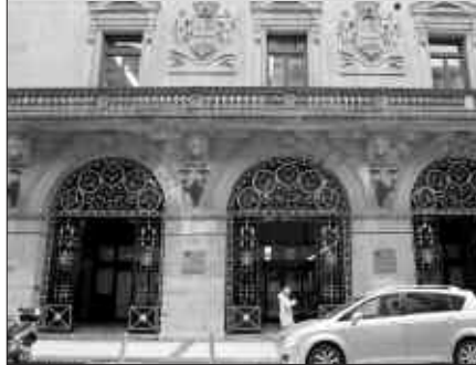
KUTXAKO EGOITZA NAGUSIA, DONOSTIA.

U surbilgo interesen alde egiteko aukera gisa aurkeztu zuen EAE-ANVk urtarrilaren 26ko plenoan, Kutxako Kontseilu Nagusian ordezkari izateko proposamena. Gaiak zatiketa eragin zuen alderdien artean. EAE-ANVko zinegotziek aurkeztutako proposamenarekin bat egin zuten, EAJ-PNVk eta EAK aurka bozkatu zuten eta PSE eta Aralarreko zinegotziak abstenitu ziren. Beraz, gehiengoz onartu zen. Aipatu ordezkari izateko gauzatzeko, Usurbil, Lezo, Oiartzun eta Bergarako