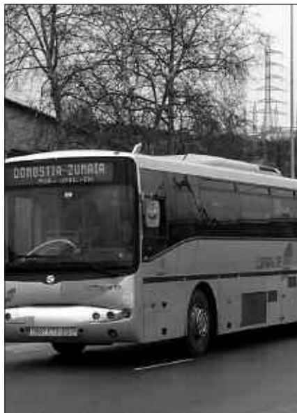
OTSAILAREN 1 EAN SARTU ZEN INDARREAN BUS TXARTELA MERKEAGO ESKURATZEKO ESKAINTZA.

Gipuzkoa zonaldeka banatua dauka Lurraldebus zerbitzuak, eta igaro behar diren eskualdeen arabera tarifa desberdinak daude. Donostialde barruan (Andoain, Astigarraga, Donostia, Errenteria, Hernani, Lasarte, Lezo, Oiartzun, Pasaia, Urnieta eta Usurbil), tarifa bera da. Oinarria 1,10 euro hartu dute eta horren arabera ezarri dute beherapena. Baina eskualde desberdinen artean oinarri desberdinak har-