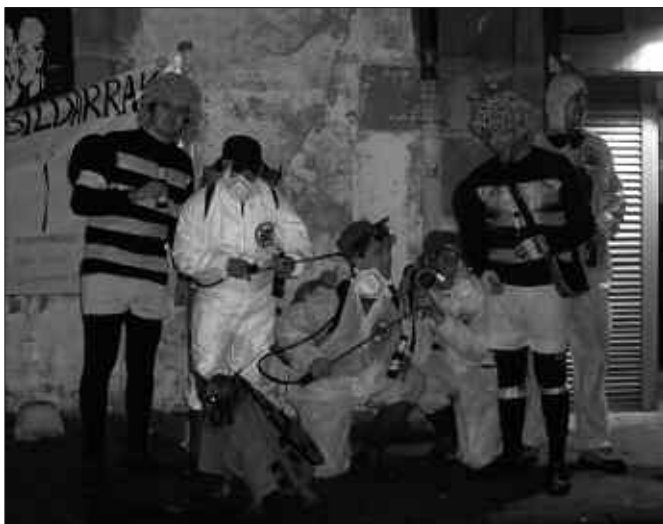
BESTE ERA BATEKOA IZAN ZEN PASA DEN LARUNBATEKO PARRANDA.