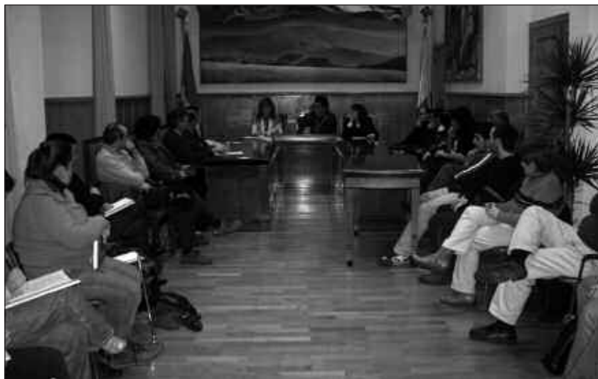
KULTUR TALDEEN ETA UDALETXEAREN ARTEKO BILGUNEAN BILAKATUKO DA KULTURA AHOAKU BATZORDEA.

Aurrerantzean, hilean behin bilduko da Kultura Aholku Batzordea, hilabetezko azken asteazkenean, arratsaldeko 19:00etan udaletxean. Beraz, otsailaren 27an egingo da batzorde honen bigarren bilera.