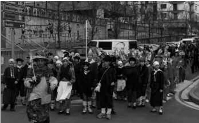
OSTIRALAREKIN ATERA ZIREN UDARREGI IKASTOLAKOAK KALEJIRAN. KIROLDEGIAN AMAITU ZEN FESTA.

larunbat arratsalde-gaua. Zoriontzekoa Hitz Aho guraso elkarteak goiz partean egin zuen ahalegina. Inauterietako irudi batzuk dituzue hemen, baina noaua.com webguneko "Argazkitegia", askoz gehiago aurkituko dituzue.