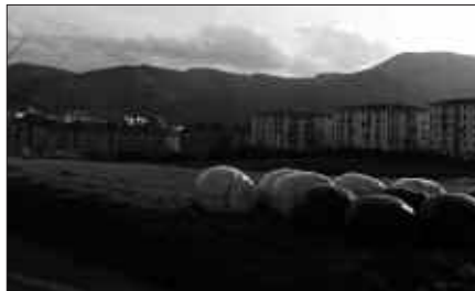
ERREKLAMAZIO GUZTIAK AZTERTU ETA ERANTZUNA BIDALI BEHAR DIE UDALAK.

Babes ofizialeko etxebizitzaren zozketari begira, azken asteetan behin behineko zerrendak kaleratu dira. Horrekin batera, alegazioetarako hamar eguneko tartea zabaldu zen. Zerrendatan agertzen ziren eskatzaile bakoitzari ere, gutun bidez jakinarazpena bidali zaio. Kasu horretan, urtarrilaren 26ko plenoan udal idazkariak argitu zuenez, jakinarazpena etxean jasota eskatzaileak hamar eguneko tartea du alegazioaren bat aurkezteko. Horregatik, oraindik zenbait herritarren alegazio posibleen