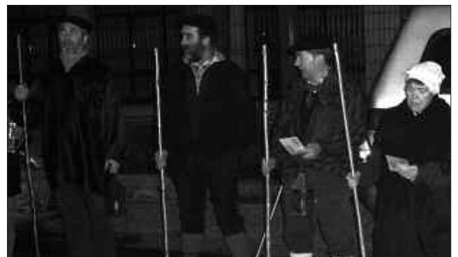
INAUTERIEK BETE-BETEAN HARRAPATU DUTE SANTA AGEDA BEZPERA BAINA EZ ZEN ERAGOZPENEA IZAN. ZUBIETAN ETA KAXKOAN BERDIN-BERDIN ENTZUN ZIREN SANTA AGEDAKO KOPLAK.