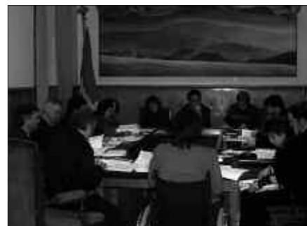
URTARRILAREN 26KO UDALBATZA PLENOA.

07/12/10-08/01/04: Talde politikoen-tzat ekarpenak egiteko aukera zabaldu zen.