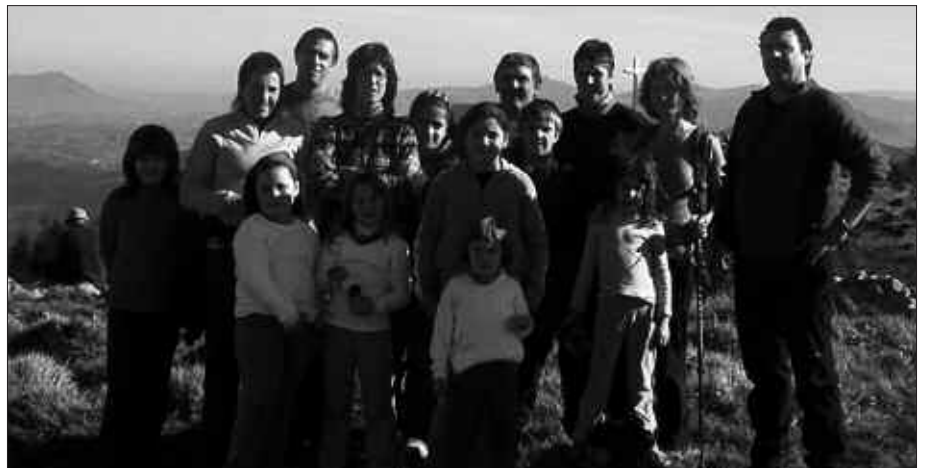
IRUDIAN DITUZUE AZKEN IBILALDIKO PARTEHARTZAILEAK.

Goizeko 8:50ean abiatuko dira Usurbilgo tren geltokitik. Zarautzera bitarteko joan etorria, trenaz egingo da. Goizeko mendi buelta izango denez, eguerdirako etxean izango dira. Beraz, mendi martxa honetan parte hartu nahi duenak erraza dauka, igandean goizeko 8:50ean tren geltokira hurbildu dadila.