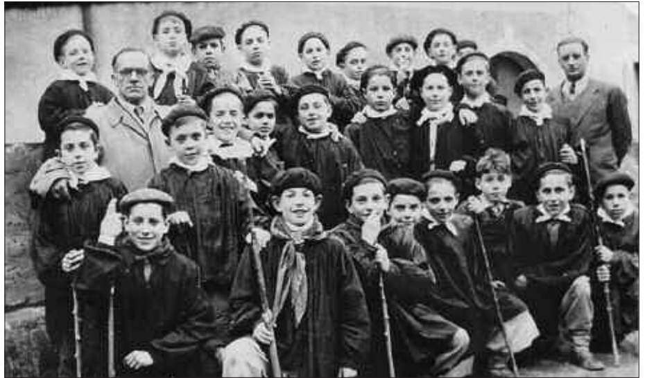
NAFARTARRAK KULTUR TALDEAK DVD BATEAN IRUDI BILDUMA OSATU ETA HERRIKO HISTORIAREN ERREPASOA EGIN DU.

Bilintx bonbardaketa batek Arratzainen harrapatu eta heriotzauria eragin zioneko, Santa Kruzko apaizaren ihesaldia, Pirinioetako azken harrespilak, Udarregi eta Atxega sendiaren bizitza eta eragina... Usurbilgo pasarte historiko asko irudikatzen dituzte, berriagoak diren beste hainbatek bezala. Nafartarrak Kultur Taldeak DVD batean irudi bilduma egin eta herriko historiaren errepassoa egiten du. Pisu handia