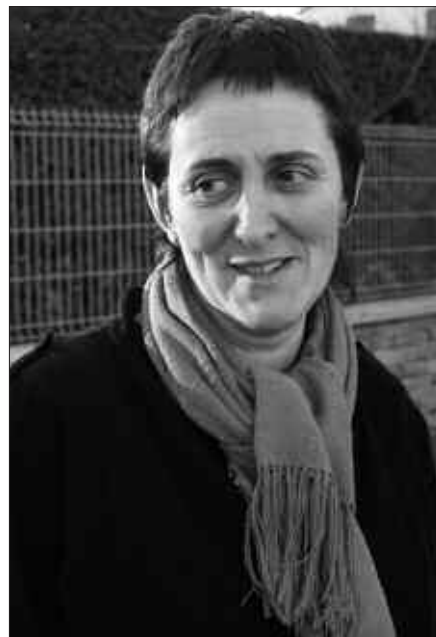
ALDERDIAREN JARDUERA ETEN DUTEN ARREN, PARLAMENTARI KARGUA MANTENDUKO DU ZUBIETARRAK.