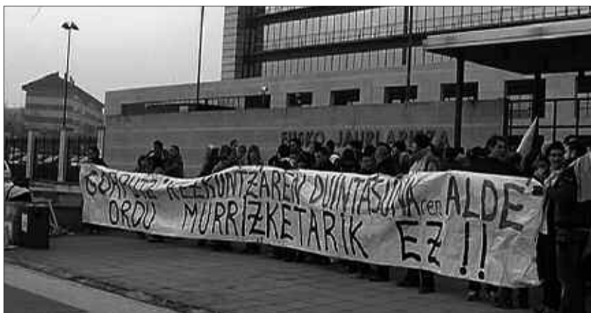
EUSKAL AUTONOMIA ERKIDEGOKO SOINKETA IRAKASLEAK PROTESTAN, AURREKO ASTELEHENEAN.

Eztabaida hasi behar zuen unean, kanpoan irakasleak, ikasleak, gurasoak, kirolariak, sindikatuak... bildu