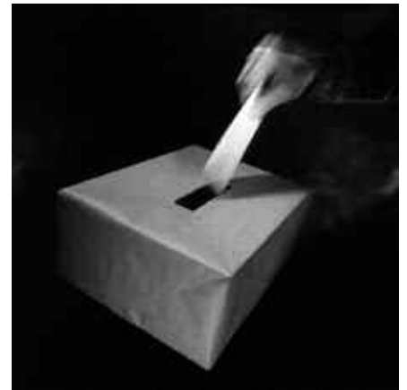
BOST HAUTESLEKU JARRIKO DIRA MARTXOAREN 9AN.