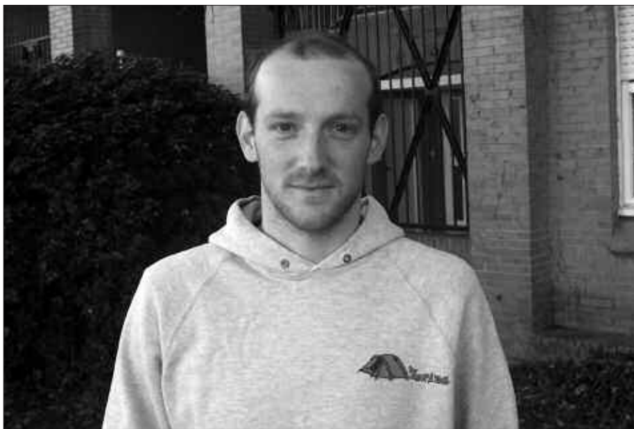
UDARREGI IKASTOLAKO SOIN HEZIKETAKO IRAKASLEEK ERE GREBA EGUNAREKIN BAT EGIN ZUTEN OTSAILAREN 11N.

U. L. Bestalde, kurrikulum berri honetan Eusko Jaurlaritzak ordu kopuru bat jarri nahi izan du; auto-