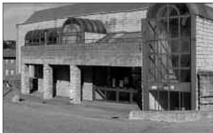
HERNANIKO UDALA EZ DAGO POZIK BURUNTZALDEKO KIROLDEGIEN ARTEKO HITZARMENAREKIN.

Hernaniko udalbatzaren erabakia dagoeneko Hernaniko Udalaren webgunean eskegita dago. Andoaingo Allurralde kiroldegiko arduradunek albistea baieztatu dute baina oraindik ere hartutako erabaki hori ez dela indarrean jarri gaineratu dute. Oraindik ere, beraz, usurbildarrek