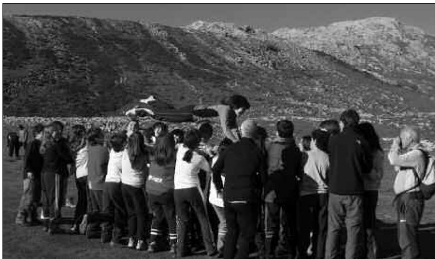
ARALARRERA EGINDAKO IRTEERAREN IRUDIAK.