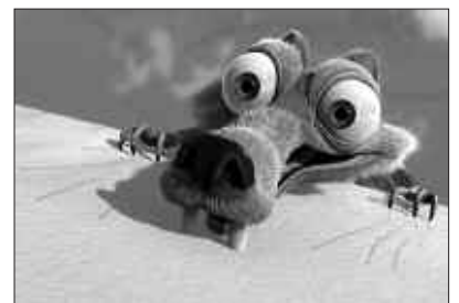
OTSAILAREN 17AN IGANDEA, 17:00ETAN HASIKO DA PELIKULA.

D uela hogeita mila urte, izoztuta ez hiltzearren, munduan bizi diren izaki guztiak hegoalderantz joko dute. Manfred mamuta, Sid hartza alferrontzia, Diego tigrea eta Scrat urtxintxa ezkur-zalea izan ezik. Hori da igande honetan Sutegin euskaraz ikus ahal izango den pelikularen mamia. Sarrerak egunean bertan jarriko dira salgai, 2 eurotan.