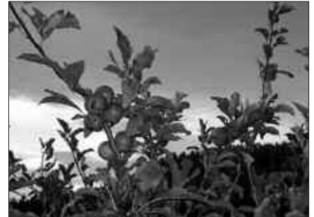
IKASTAROA OTSAILAREN 23AN EGINGO DA SUTEGIN.