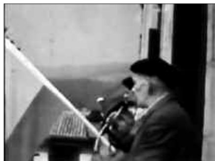
BIDEAN HIRU BERTSOLARI AZALTZEN DIRA KANTARI, UDALETXEKO BALKOIAN. ESPAINIAKO BANDERA DAGO ZINTZILIK.

Kuriosoa da, gaur egun bideoak grabatu eta ikusi daitezkeen arren, garai hartan ez ziren ugariak horrelako grabazioak egin eta izatea. Eta esan bezala, 70eko