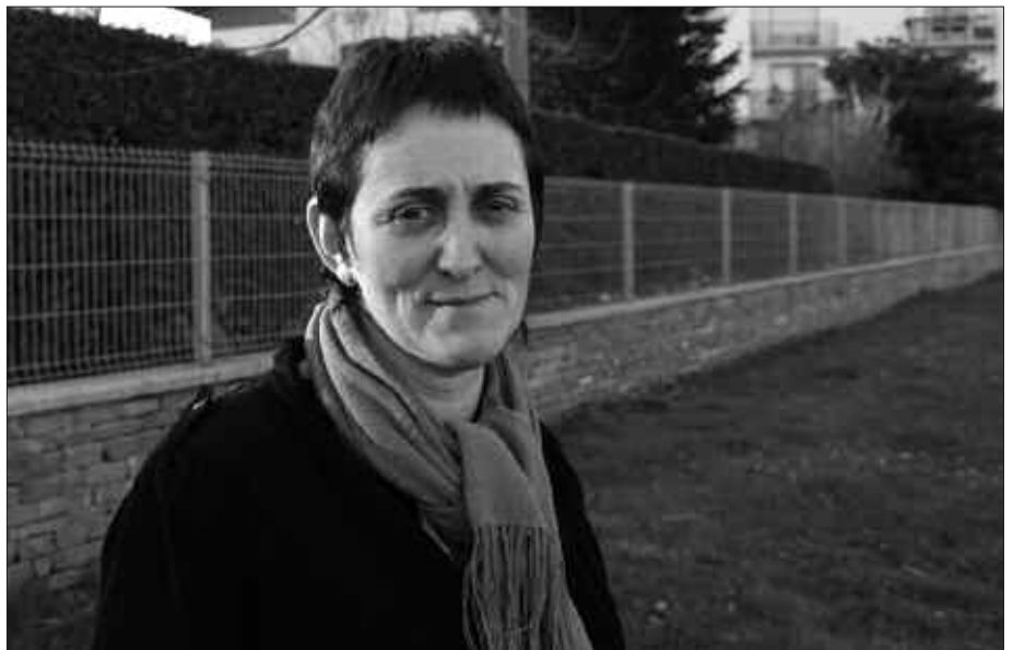
IRAKASLEA OGIBIDEZ, AZKEN URTEAK EUSKO LEGEBILTZARREAN EGINDITU, EHAKREN IZENEAN PARLAMENTARI HAUTATU ZUTENETIK.

juxtu, ilegalizazioaren aurkako ez-legezko proposamena aurkeztu duzue Eusko Legebiltzarrean.