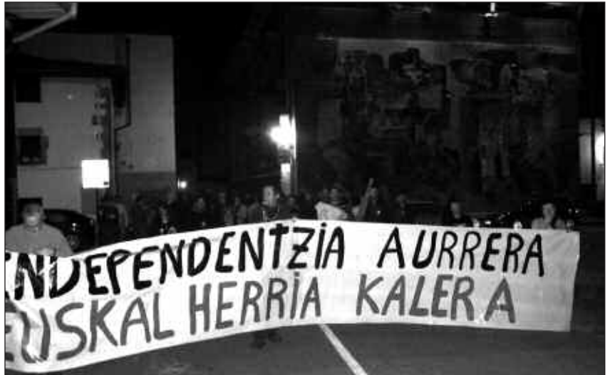
IRUDIAN, ABIAN DIREN ILEGALIZAZIO PROZESUAK SALATZEKO PASA DEN OTSAILAREN 8AN EGIN ZEN MANIFESTAZIO ZARATATSUA.

EAE-ANV eta EHAKren aurka abian diren ilegalizazio prozesuak salatzeako, elkarretaratze eta manifestazio jendetsu eta zaratatsua egin ziren pasa den otsailaren 8an kaxkoan, "Independentzia aurrera, Euskal Herria kalera" lemapean. Salatzeko antolatu diren ekitaldi sortan lehena izan zen. Asteburuko kotxe karabana-ekin eta Bilboko manifestazio nazionalarekin batera, asteazkenean, otsailaren 13an ez ohiko eta premiazko udalbatza plenoa egin zen. Ostegun honetarako greba eguna deituta dago, deitzaileen esanetan, "salbuespen egoera salatu eta independentziari eta marko demokratikoari baietza esateko".