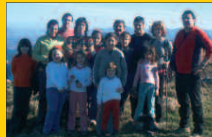
Igande honetan, Zarautz eta Zumaia arteko mendi ibilaldia