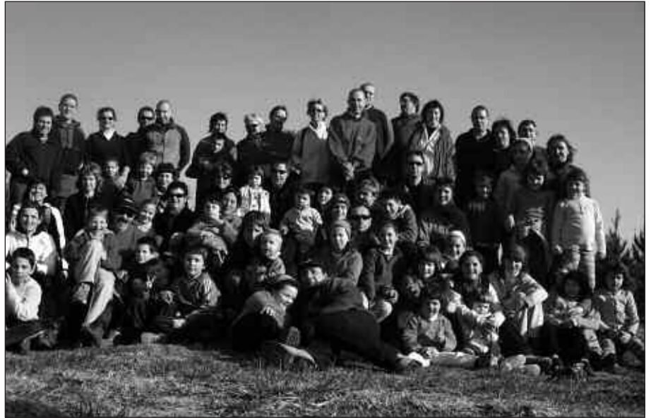
ARRIAUNDIN ATSEDEN HARTU ETA ARGAZKI HAU ATERA ZUTEN.

Bidean zegoen Arriaundi tumuluan hamaiketako jatera gelditu eta bide batez taldeko argazkia atera zuten.