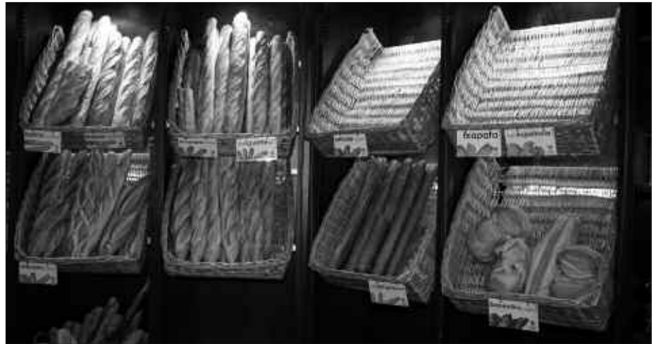
OKINDEGIEK JARRI DITUZTE JADANIK NOTATXOAK OGIEN IZENEKIN.

baitan desoreka latzak eragin ditzake, horregatik eta gauza guztiekin bezala ogia ere tamainan jabez gero osasun-garria da eta beharrezkoa.