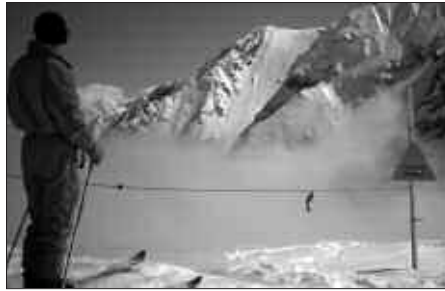
SAINT LARY ESKI ESTAZIORAKO BIDAIA MARTXOAREN 29AN EGINGO DA.

16-17 urtekoentzat: 113 euro (forfaita, albergea, pistetako aseguruua eta autobusa). 6 euro gehiago, eski materiala aloka-