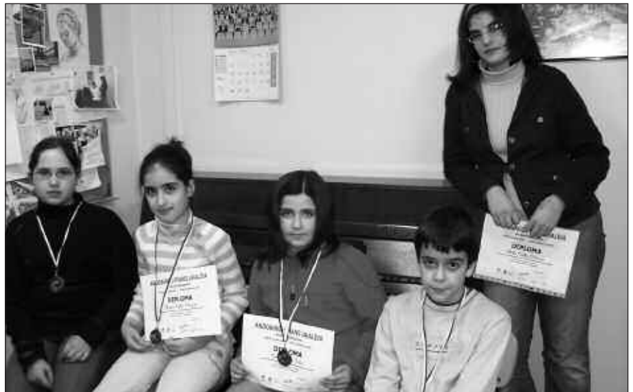
IAZ, ANDOAINGO PIANO JAIALDIA SARITUTAKO USURBILDARRAK.

C mailan (18 urte arte), Zumarteko ikasle hauek arituko dira: