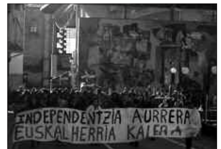
EGUERDIKO MANIFESTAZIOAN 350 HERRITAR ELKARTU ZIREN.

Industriari dagokionez, asko izan ziren greba egin zuten langileak, "Euskal Herriaren eskubideen alde, salbuespen egoera stop!" lelopean antolatutako protesta egunean. Baina hainbat lantokik lanean jarraitu zuten, Ingemarren adibidez. Ez zen lan egin zuen enpresa bakarra izan. Ezker Abertzaleak prentsa ohar bidez jakinarazi duenez, ordea, "grebaren eragina aurreko deialdietan baino askoz handiagoa izan dela garbi ikusi da. Lantegi batzuk zabalik izan ziren baina lantegi horietan zenbait langilek greba egin zuten". Greba, bereziki, eraikuntza sektorean nabarmendu zen.