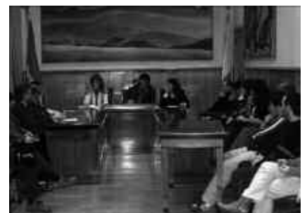
OTSAILAREN 27AN ASTEAZKENA, ARRATSALDEKO 19:00ETAN HASIKO DA BILERA.

Aurrerantzean, hilean behin bilduko da Kultura Aholku Batzordea, hilabeteko azken asteazkenean. Beraz, otsailaren 27an egingo da batzorde honen bigarren bilera.