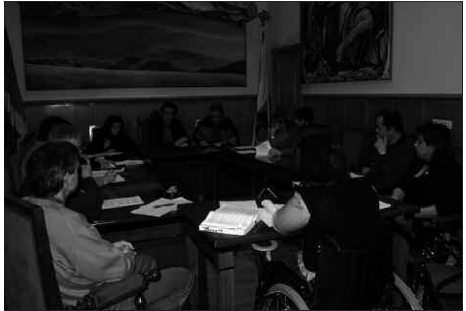
EAE-ANVREN SUSPENTSIOA SALATU ETA OTSAILAREN 14RAKO DEITUTA ZEGOEN GREBA EGUNAREKIN BAT EGITEN ZUEN ONARTUTAKO MOZIOAK.

Lehenengo astean onartu zen mozioan, oso larritzat jotzen da EAE-ANV hiru urtez suspentsioan utzi duen erabakia. Gatazka politikoari ateak itxeararekin batera, euskal herritarren eskubideen aurkako neurrien testuinguruan kokatzen dute suspentsioa, kriminalizazio prozesu baten barruan. Gauzak horrela, herritarrak aukeratutako udal ordezkarien eskubideak babestu, Udalean eta beste erakundeetan parte hartzeko eskubidea ziurtatu eta ordezkarien karguak bermatuta egotea aldarrikatzen da aipatu mozioan.