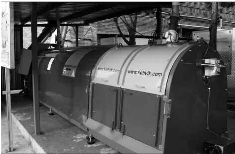
ARGAZKIKOA BEZALAKO KONPOST MAKINAK EKOIZTEN DITU IRUNEN KOKATUTA DAGOEN KOLLVIK ETXEAK.

A. B. Orain gorantz doaz, merkatal guneetan izugarri, baita zerbitzuguneetan ere. Araztegiatan sortzen den lokatza ere tratatzen da. Hori ere organikoa da eta konpost plantara eramaten da, inausketekin nahastuta. Hain zuzen, konposta egiteko beti karbonoaren (inausketak, kartoiak, paperak...) eta nitrogenoaren (produktu berdeak) nahasketa egokia behar da.