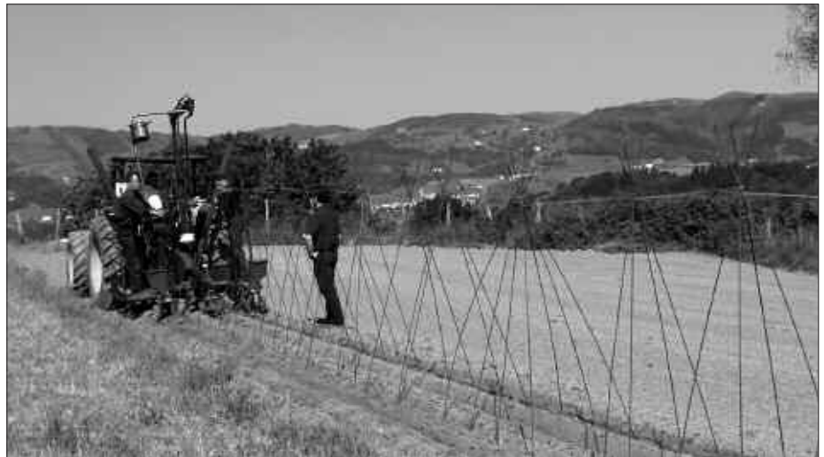
BABARRUN LANDAKETARI BURUZKO IKASTAROAN IZENA EMATEKO EPEA ZABALIK DAGO. MARTXOKO LEHEN BI ASTEETAN ESKAINIKO DA IKASTAROA.