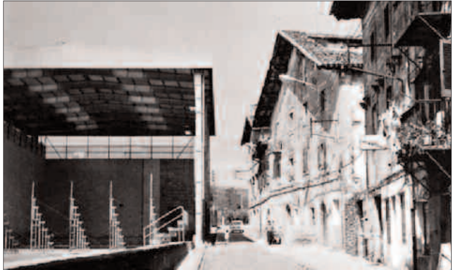
NAFARTARRAK KULTUR TALDEKOEK PRESTATUTAKO DVDA LIZARDIN ETA LAUROKEN ERDSI AHAL IZANGO DA, BOST EUROREN TRUKE.

Goza ekitaldiak izandako harrera eta interesa ikusita. Gazia, emanaldi unean bertan salgai jarri zituzten