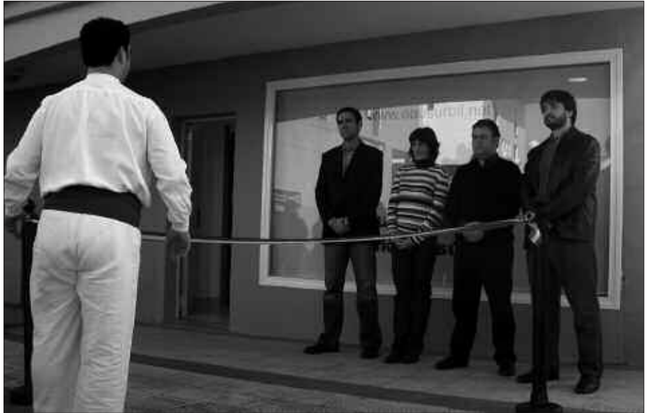
ALDERDIKO BURUAK HURBILDU ZIREN EGOITZA BERRIAREN INAUGURAZIORA. BIHARAMUNEAN, EZEZAGUN BATZUK ATARIKO KRISTALA APURTZEN SAIATU ZIREN.

Larunbat eguerdian egin zen Alkartetxearen inaugurazioa. Usurbilgo