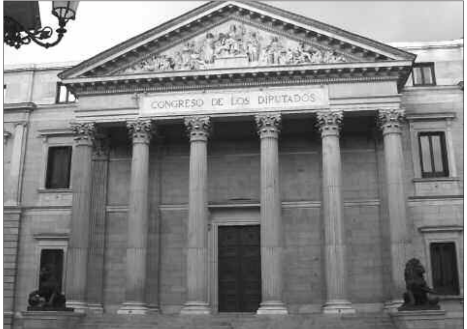
MARTXOAREN 9KO HAUTESKUNDEETAN, MADRILGO GORTEETAKO ORDEZKARIAK AUKERATUKO DIRA.

Segidan dituzue Usurbilgo udaletxean ordezkaturik dauden alderdiek idatzitako bidali dizkiguten balorazioak.