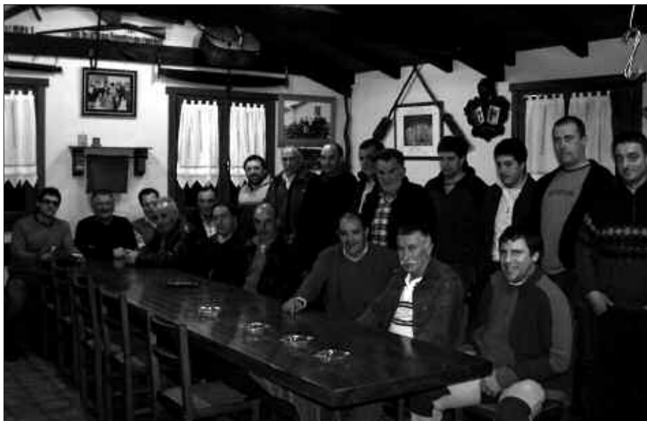
BURUNTZALDEKO EHIZTARIEK HAINBAT BILERA EGIN DITUZTE AZKEN ASTEOTAN. IRUDIAN, ANDOAINEN EGINDAKO BILKURA.

menduko da. Ingurugiroari kalte gutxiago eragiteko, orain arte erabili izan den beruna beste material batek ordezkatzeko ekar dezake. Ondorioz, baita eskopetaz aldatu beharra ere, material aldaketak horietako arma asko baliogabetuko litzuzke eta.