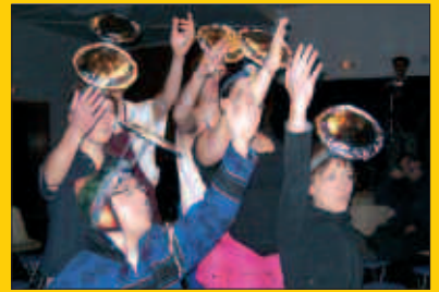
Ostiral honetan, antzerki saioa Udarregi ikastolan