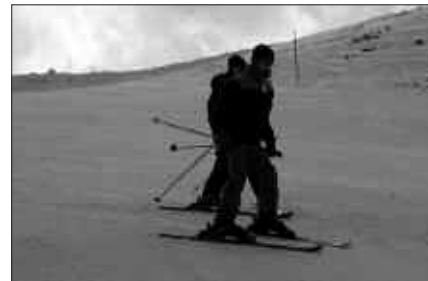
30 EURO ORDAINDU BEHAR DIRA ASTEBURU HONETAKO IRTEERAN PARTE HARTZEKO.

Aurreko astean iragarri genuen bezala, martxoaren bukaeran beste eski irteera bat egingo da. Baina hori Usurbil Futbol Taldekoek antolatu dute eta Frantziako Saint Lary eski estaziora joango dira. Irteera honetan parte hartzeko, gutxienez 16 urte izan behar dira. Martxoaren 29an larunbata, goizean irtengo da autobusa eta igande arratsalde-gauean bueltatuko da. Prezioak 16-17 urtekoentzat: 113 euro (forfaita, albergea, pistetako aseguruia eta autobusa). 6 euro gehiago, eski materiala alokatzeko; eta 14 euro gehiago, snow materiala alokatzeko.