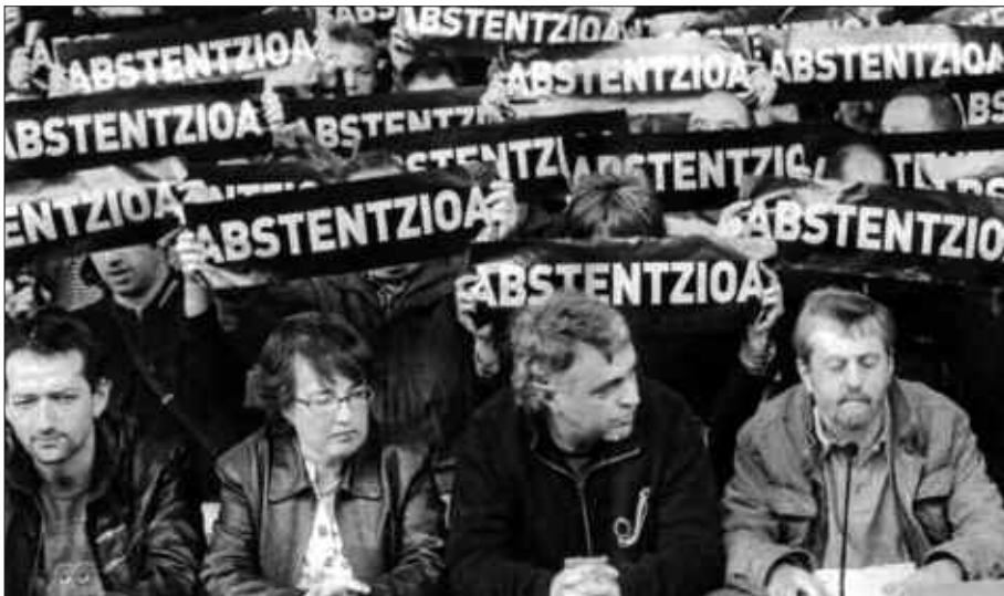
PASA DEN IGANDEAN, USURBILGO FRONTOIAN EGINDAKO AGERRALDIA.