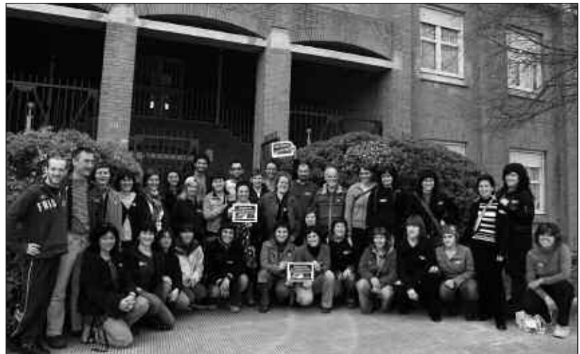
IRUDIAN, PASA DEN OTSAILAREN 20AN UDARREGI IKASTOLA ATARIAN ELKARRETARATU ZEN IRAKASLE TALDEA.

Otsailaren 20an eguneroko lanean etenaldi bat hartu zuten Udarregi ikastolako hainbat irakaslek. Euskaldunon Egunkaria itxi zuteneko bost urte betetzen ziren egun berean, ikastola atarian elkarretaratu ziren. Modu horretan salatu nahi izan zuten 2003.urtean itxitako euskara hutseko egunkaria. Eta auzipetuei elkertasuna adierazi, goiz berean, Andoaingo Martin Ugalde kultur parkean bildutako alor ezberdinetako eragileek egin bezala. Egunkaria auziko hamabi auziperatuek duten babes falta nabaria argi utzi zuten. Gertu den epaiketaren aurrean, berriz ere "Egunkaria libre!" aldarrikatu zuten.