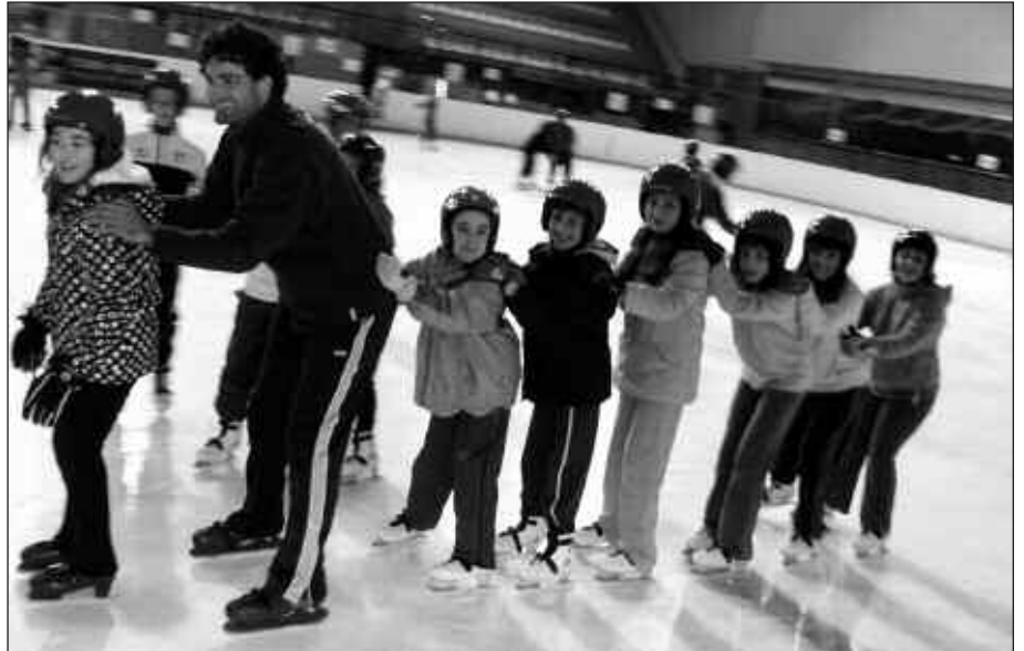
IKASLEEK ETA IRAKASLEEK EDERKI PASA ZUTEN TXURI URDINEN.

Saioaren bukaera aldera lasterketa bat egin genuen. 6. mailako neska batek irabazi zuen eta izan zen paretaren kontra frenatu zuenik ere. Eskerrak kaskoa jantzita ibiltzera behartzen gaituztela!