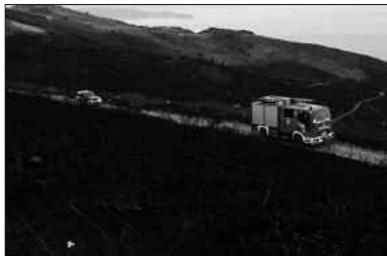
AGINAGAKO LURRETARAINO IRITSI ZEN PASA DEN OTSAILAREN 24AN PIZTUTAKO SUTEA.

Hain zuzen, ez zuen batere laguntzen hegoaldeko jotzen ari zen etengabeko haize bolada zakarrak. Guztira, 80 hektarea erre dira. Iaz Gipuzkoa osoan erretako lur sail kopurua baino hiru aldiz gehiago erre da egun batean Igeldon.