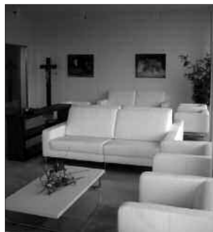
2005 URTEAN ZABALDU ZEN USURBILGO TANATORIO ZERBITZUA.

Aipatu bezala, bermatutako zerbitzua eskaini asmoz, lurperatzeak goizez egitea hobetsi da. Udal iturriek adierazi bezala, “egoera berrira moldatzeko guztion ahalegina eskatzen dugu”. Hartutako neurriak denon onerako direla gaineratzen dute.