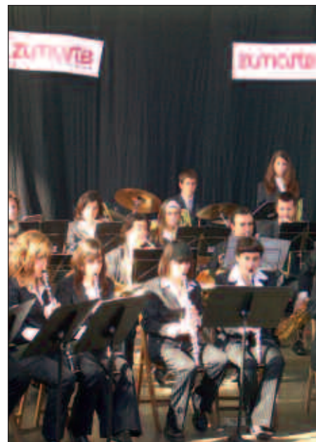
ZUMAIAKO UDAL MUSIKA BANDAREKIN HASI ZEN IGANDEAN SOINURBIL MUSIKA ZIKLOA.

Ostegun honetan, hilak 6, kontzertu pedagogikoaren txanda izango da. Zumarteko ikasleek bi saio eskainiko dizkiete Udarregiko ikasleei. Lehena, 14:45ean eta, bigarrena, 15:30ean. Biak Sutegin.