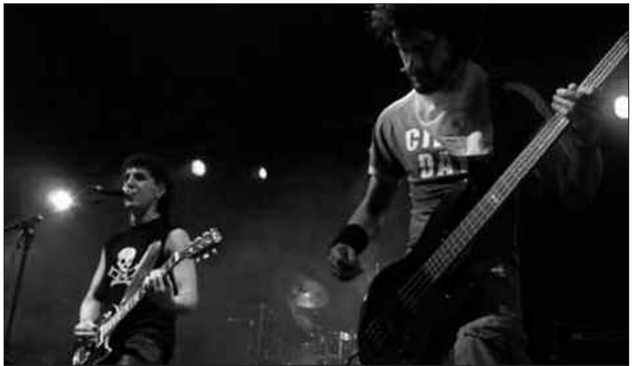
200 EUROREN TRUKE, BIRA AUTOBUSEAN EGITEKO AUKERA DAGO.

Aipatu bezala, bost eguneko bidaia autobusez egin eta Mendeku Itxuak Alemanian eskainiko dituen hiru kontzertuak ikusteko aukera izango da. Gutxi gorabehera, bidaia 200 euroko kostua izango du. Bidaian joateko beharrezkoa da, 18 urte beteta izatea. Autobusean izena emateko honako telefono zenbakira deitu behar da: 616 482 521. Bertan norbere izen abizenak eta harremanetarako telefono zenbaki