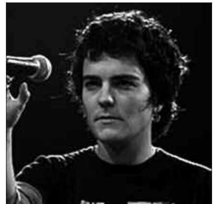
BERTSO-AFARIRAKO TXARTEL DENAK BUKATU EGIN DIRA.