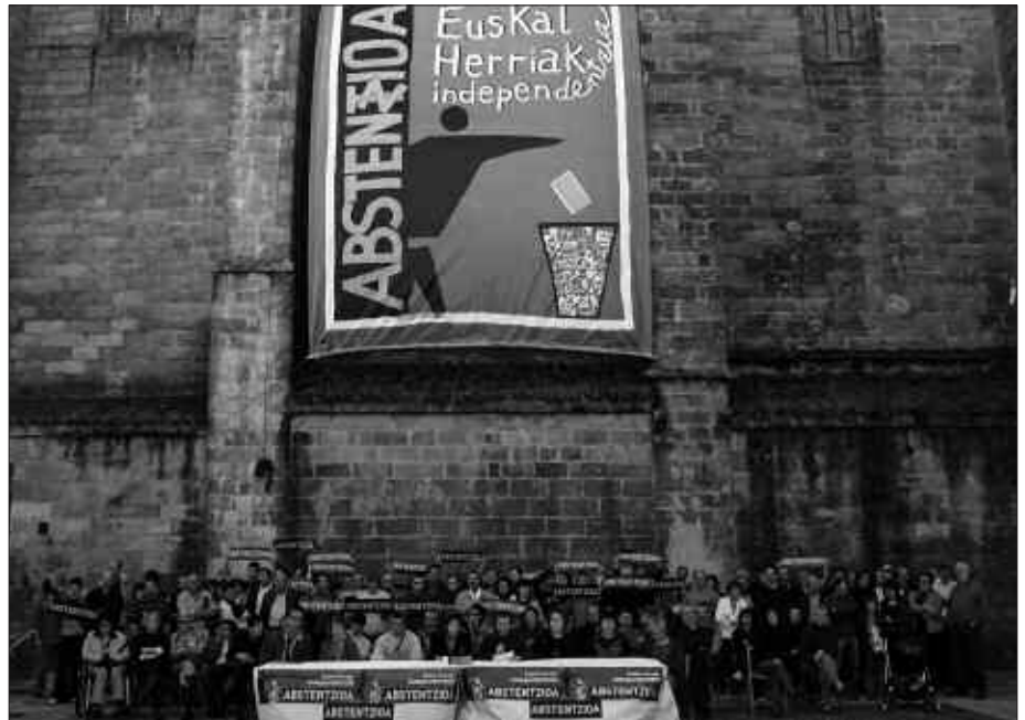
EZKER ABERTZALEAK MURAL BAT IPINI ETA ABSTENTZIOA ESKATZEKO EKITALDIA EGIN ZUEN AURREKO IGANDEAN.

Ezker Abertzalearen ustez, hauteskunde antidemokratikoenak izango dira