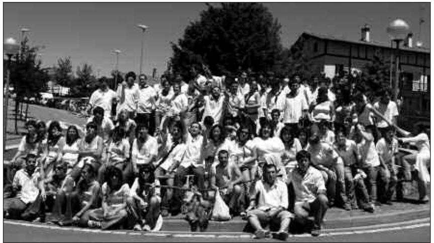
MARTXOAREN 12AN BILDUKO DA LEHEN ALDIZ JAI BATZORDEA.

Jaietan ekitaldiren bat antolatu nahi duenak, proposamenak egiteko aukera ederra dauka datorren astean egingo den bileran: martxoaren 12an asteazkena, 19:00etan udaletxean.