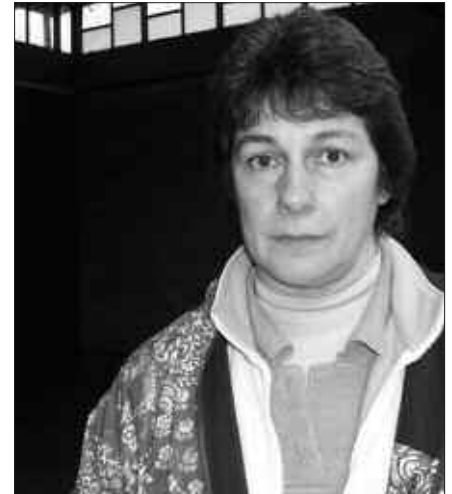
AGINAGAN JOKATUKO DEN FINALA GOGORRA IZANGO DELA DIO DOLO ERRASTIK.

N. Orduan, neska askorik ez zu beza kirol jardueratan?