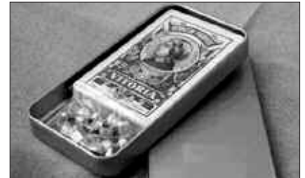
MARTXOAK 7, 22:00ETAN, AGINAGAKO ZAHAR EGOITZAN.

1. saria: bi arkume, mariskoa eta xanpaina.