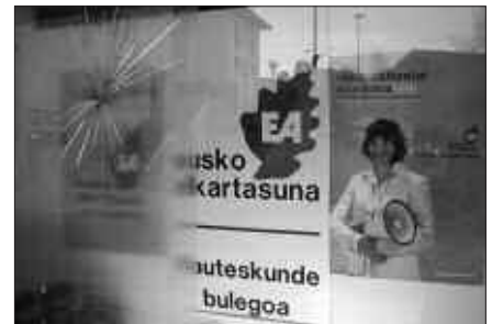
EGOITZAREN KRISTALA HAUSTEN SAIATU DIRA BEHIN BAINO GEHIAGOTAN.

EAE-ANVTik moziok aztertzeko arazorik ez zutela baino plenoko gai zerrendan ez zegoela gogorarazi zen. EAK gertakaria aztertzeko premiazotasuna adierazi zuen. Gainerako alderdiek EAri elkartasuna adierazi eta gaiak hitz egin beharra azpimarratu zuten. Azkenean,