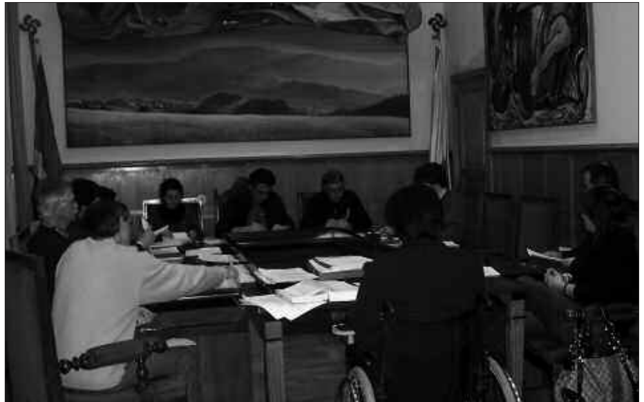
OTSAILAREN 26KO OHIKO PLENOAN AZTERTU ZIREN EAE-ANVK BATETIK ETA PSE-EEK BESTETIK AURKEZTUTAKO BI MOZIOAK.

PSE-EE-ko zinegotziak aurkeztu zuen bigarrena. Genero indarkeriaren aurka eta emakume eta gizonezkoen berdintasunaren aldeko borrokan, Udalak hartu beharreko zenbait konpromiso zehazten dira aipatu testuan: etxeko lanak partekatzea, emakumeek pairatzen dituzten enplegu arazoak konpondu, prebentzio eta kontzien-