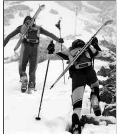
BINAKA EGITEN DA PIERRA MENTAKO MENDI LASTERKETA.

Berria egunkariak aurreko astean aipatzen zuenez, lasterketa aitzindarietako da Pierra Menta, luzeena eta gogorrena, lau egun eta 10.000 metrotik gorako desnibelarekin. Baina, gogorrena ez ezik, jendetsuena ere bada: 160 bikotek parte hartzen dute, baina mendi bazterretan milaka eta milaka ikusle biltzen dira. Hitz batean, benetako festa izaten da. Eta lau eguneko festa horretan, larunbata izaten da egun handia. Eski estazioak