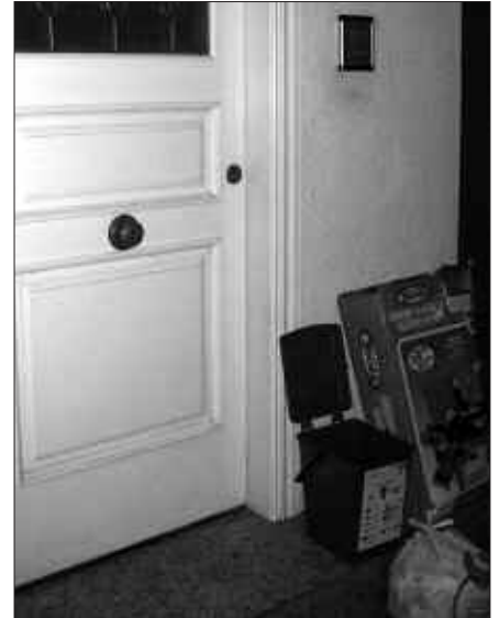
INSTRUKZIO LIBURUAK BANATU ETA TAILERRAK ANTOLATUKO DIRA ATEZ ATEKO BILKETA MARTXAN JARTZEN DENEAN.

J. C. Aztertzen gabiltza. Garrantzitsuenaz, helburua jarrita dagoela. Bide horretan lanean gabiltzala. Hobe azkarregi ez joatea. Aldaketa eguna iristerako herritarrek prozesu osoa ezagutu, bertan parte hartu eta ziur egonda hasi behar dute. Hartara, bilketa sistema berriarekin denak gustura egon gaitezen. Helburu nagusia, gogoratu, erreusa murriztea da. Astakeria bat da erraustegia planteatzea, bertara doan materialen gehiengoa berreskura eta birzikla daitekeenean.