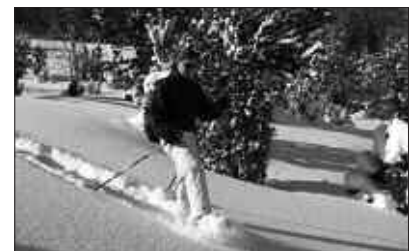
MARTXOAREN 29AN ATERA ETA 30EAN BUELTATUKO DA AUTOBUSA.

Edota honako telefono zenbakira deituz: 653 72 80 59