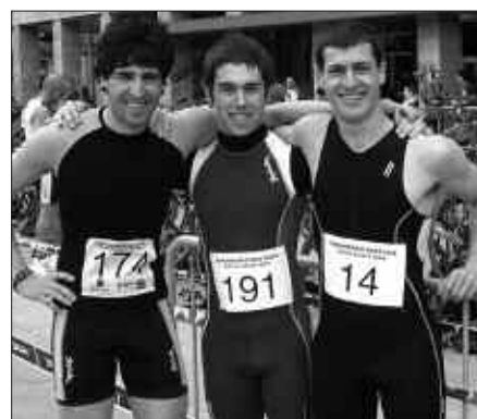
DURANGOKO PROBAREN ATARIAN, BAXURDE TXIKIKO KIDEEK IRUDIAN.

Saiora aurkeztu ziren hamabost taldeetatik, zortzigarren sailkatu zen Baxurde Txiki taldea. Parte hartze datua kontuan hartuta emaitz bikaina; 220 kirolari bildu zituen ekitaldiak. Hurrengo hitzordua Oñatin izango dute, larunbat honetan, martxoak 15.