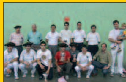
Asteburu honetan hasiko da Usurbilgo Pilota Txapelketa