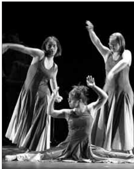
MARTXOAREN 29AN SUTEGIN ARITUKO DA VERDINI DANTZA TALDEA.

EGUNA: Martxoak 29 larunbata, 18:00ean Sutegin.