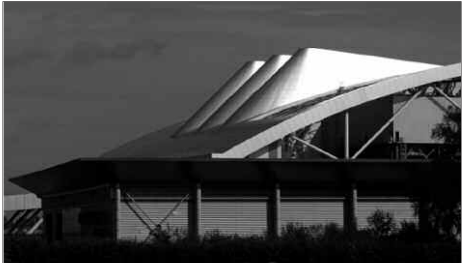
PARIS, ANDORRA EDOTA LILLEN (IRUDIAN) ERAIKI DIREN ERRAUSTEGIEN EREDUAK HARTU DITUZTE KONTUAN.

“Biolehortze” prozesuaren bidez, hondakinen hezetasunaren zati bat lurrundu-ko da. Hondakinak errauskailura iritsi