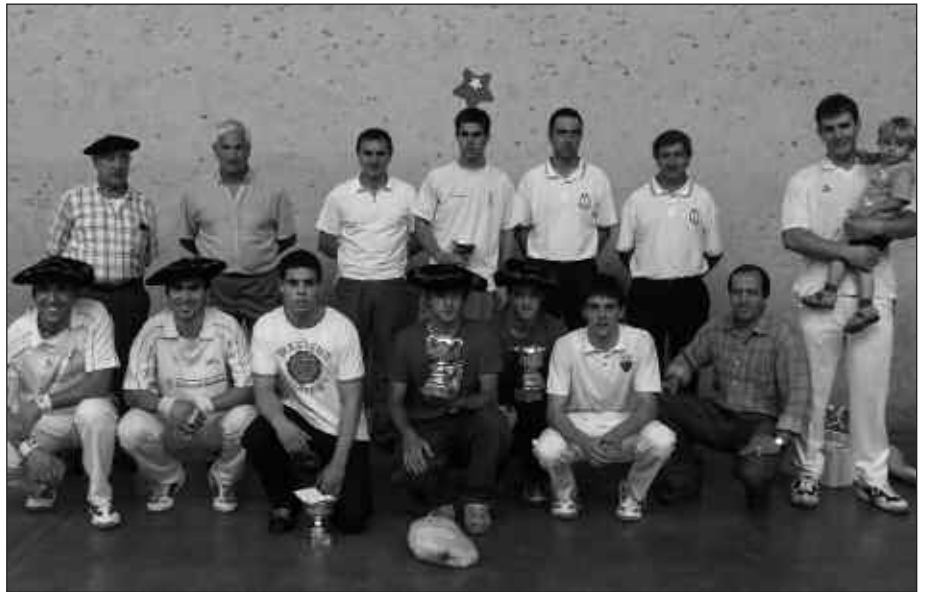
IRUDIAN, IAZ JOKATU ZEN TXAPELKETAKO IRABAZLEAK.

Andatzpe eta Peña Pagola elkarteek osatu duten Usurbilgo Pilota Elkartek antolatu du txapelketa, Kirol Patronatoaren laguntzaz.