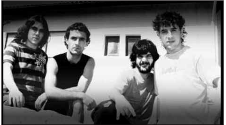
200 EUROREN TRUKE, BIRA OSOA AUTOBUSEAN EGITEKO AUKERA DAGO.

Bost eguneko bidaia autobusez egin eta Mendeku Itxuak Alemanian eskainiko dituen hiru kontzertuak ikusteko aukera izango da. Autobusean izena emateko honako telefono zenbakira deitu behar da: 616 482 521. Bertan norbere izen abizenak eta harremanetarako telefono zenbaki bat utzi behar dira. Behar beste lagunek izena emango ez balute, bidaia bertan behera gera liteke. Kasu horretan, erabakiaren berri emateko antolatzaileak autobusean joatekoak direnekin hartu emanetan jarriko dira.