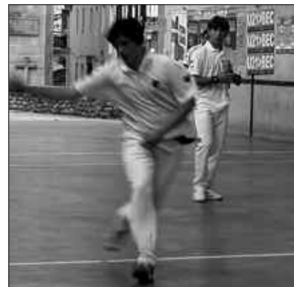
PILOTA TXAPELKETAKO PARTIDA DENAK USURBILEN JOKATUKO DIRA

E. H. Beti izan da horrela. Batzutan herrian ez dago, bestetan bikotea aldatzea ongi iruditu zaigu.