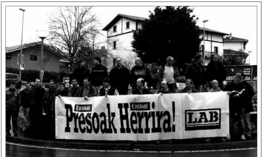
LAB SINDIKATUAREN ELKARRETARATZEA. Buruntzaldeko LABeko ordezkariak bilera egin zuten pasa den ostiralean Sutegin. Ondoren, euskal presoaren aldeko elkarretaratzea egin zuten Bordatxo pareko errotondan.

A urtengo festak antolatzen hasteko lehen hitzordua finkatu dute Jai Batzordekoek. Larunbat honetan, goizeko 11:00etan garai bateko auzo elkartearen egoitzan bilduko dira.