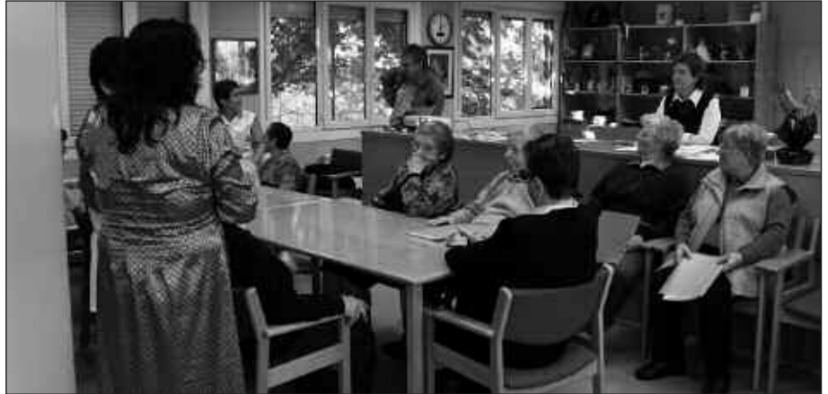
ASTEBURUETAN DRAINGOZ LAU DIRA EGUNEKO ZENTRORA JOATEN DIRENAK.

I. Z. Bai. Astegunetako dinamika ezin da zeharo aldatu. Orduegiak errespetatu behar dira. Baina horren barruan, haientzat egun ezberdinak izaten saiatzen gara. Hain talde txikia izanda, zerbitzua asko pertsonalizatu liteke. Asteburueta haiekin egotea lehenesten da.