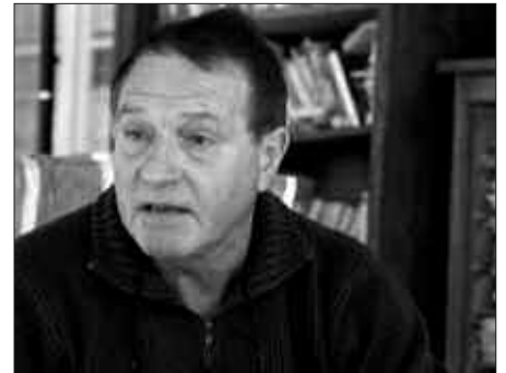
APIRILAREN 8AN ESKAINIKO DU HITZALDIA SUTEGIN.