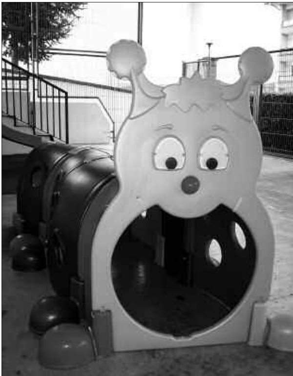
HAUR HEZKUNTZAKO JOLAS-TOKIAN DAGOEN HARRA.

Aldez aurretik, eskerrik asko zuen laguntzagatik.