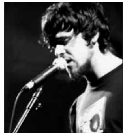
BERRI TXARRAK TALDEKO KANTARIAK HARTZEN DU PARTE KATAMALO IKUSKIZUNEAN.