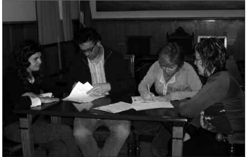
UDALETXEKO PLENO ARETOAN EGIN ZEN SINADURA EKITALDIA.

Hitzarmen berritu honetan, aldizkariak 2005. urte amaieran eman zuen pauso berria jasotzen da; hamabost egunean behin kaleratuzetik astekari izatera igaro zeneko aldaketa hain zuzen.