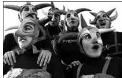
"12 K" IKUSKIZUNA ESKAINIKO DU HORTZMUGA TALDEAK.

Apirilaren 12a izango da egun seinatua. Eguerdian hasi eta ordu txikiak arte, antzerkia izango da nagusi Usurbilen. Klowen ikuskizunak, mimoak, kalejirak... Anitza da prestatu den egitaraua. Eta izenburuak dioten bezala, kalean egingo dira ekitaldi denak. Euria egingo balu, ordea, Dema plazako frontoi estalian egingo liriateke ekitaldiak.