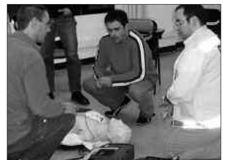
UDARREGI IKASTOLAN ESKAINIKO DUTE IKASTAROA.

Matrikularen prezioa: 75 euro (ikastaroko txostena barne). Ikasle kopurua mugatua da, ematen den ikastaroaren kalitatea bermatzearren. Izena emateko