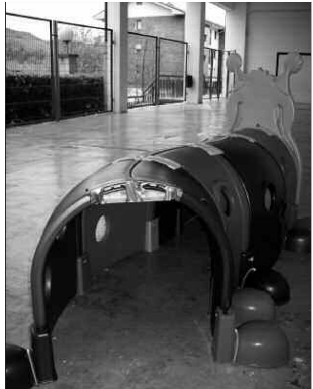
EZEZAGUNEK HARRAREN ATZEKALDEKO ZATIA ERAMAN DUTE.