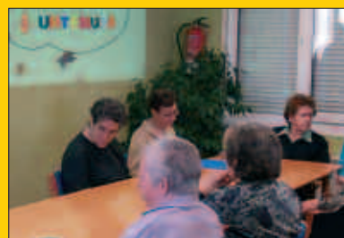
Eguneko Zentroa, asteburuetan ere zabalik