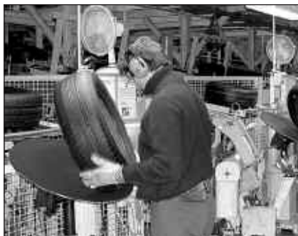
MICHELIN FUNDAZIOAK SUSTATU DU AHOULKULARI KONTSEILUA.