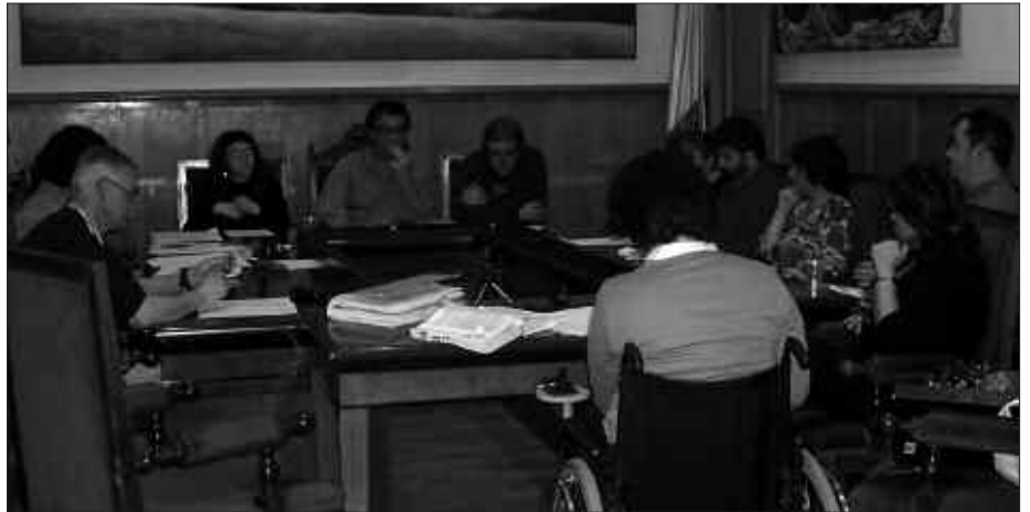
MARTXOAN BITAN BILDU DA UDALBATZA PLENOA. EZ-OHIKO BILKURA EGIN ZEN MARTXOAREN 14AN; OHIKO UDALBATZA PLENOA MARTXOAREN 25EAN.