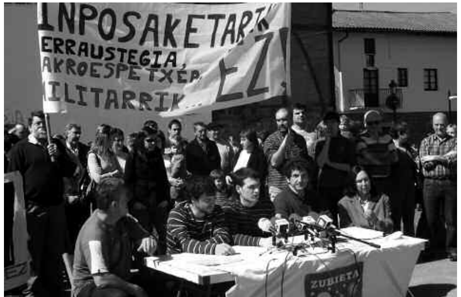
MARTXOAREN 29AN ESKAINI ZUTEN PRENTSAURREKOA ZUBIETAN.

Donostiako Udalarari Zubietan zer eta non den ere ez jakiteko interes falta