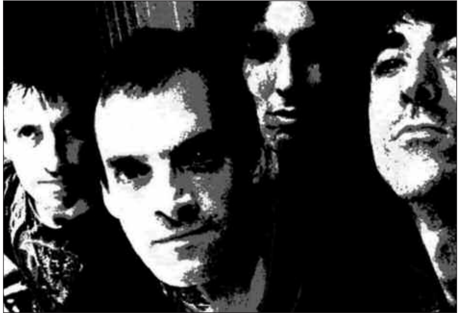
ANESTESIA (IRUDIAN), LURPE ETA METRAILETA TALDEAK ARITUKO DIRA.