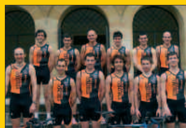
Baxurde Txiki triatloi taldea osatu da Usurbilen