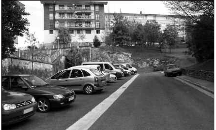
APARKATZEKO ERREFERENTZIA ARGIRIK EZ DAGO, HORREGATIK BIZILAGUN ASKOK LURREKO MARRAK MARGOTZEA ESKATU DUTE.