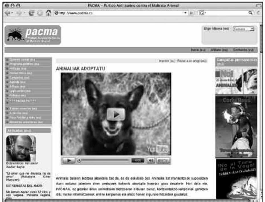
PACMA ZEZENKETEN AURKAKO ALDERDIAK ANIMALIEN ALDEKO KANPAINA EZBERDINAK BIDERATZEN DITU. ALDERDI HONEK USURBILLEN 7 BOZKA BILDU ZITUEN.

beteko dituztela diote. Alderdiaren arrastoak Gipuzkoan eta Nafarroan geratzen dira. Espainian 2.000 boto besterik ez.