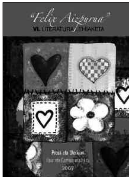
IAZKO LANEKIN OSATU DUTEN LIBURUA ERE BANATZEN HASI DA USURBILGO UDALA.

Gogoan izan 8 eta 16 urte bitarteko usurbildarrei zuzenduta dagoela Felix Aizpurua Literatura Lehiaketa. Lanak apirilaren 30a baino lehen bidali behar dira Udala Euskara Zerbitzura. Informazio gehiago honako telefono zenbakian: 943 371 999.