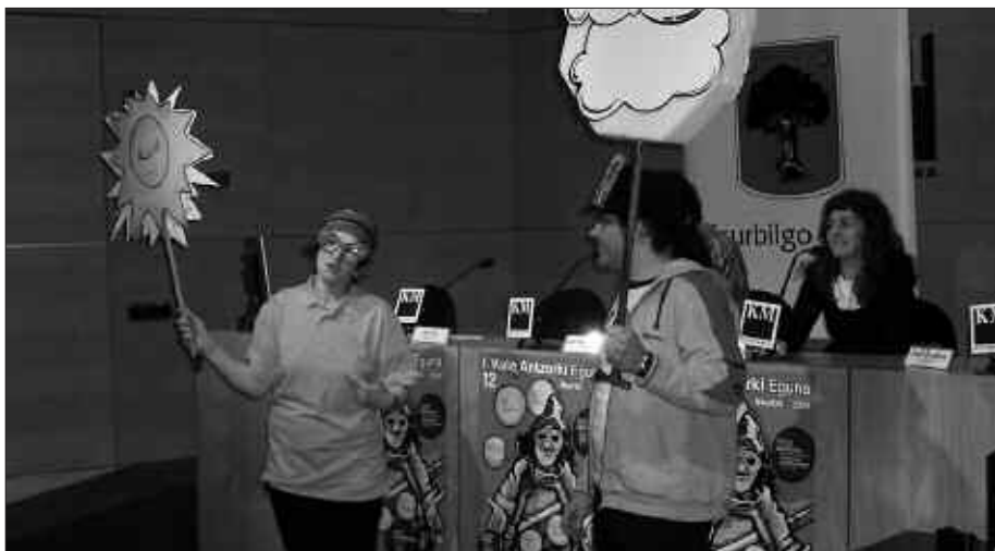
DONDSTIAKO KOLDO MITXELENAN AURKEZTU ZEN KALE ANTZERKI EGUNA.

pasatzen ikusten duenak, jendeak jarrai diezaioa. Zerbait esaten badizute, erantzun. Nornahik herrian zerbait egin nahi badu, kultur adierazpen bat, aurrera.