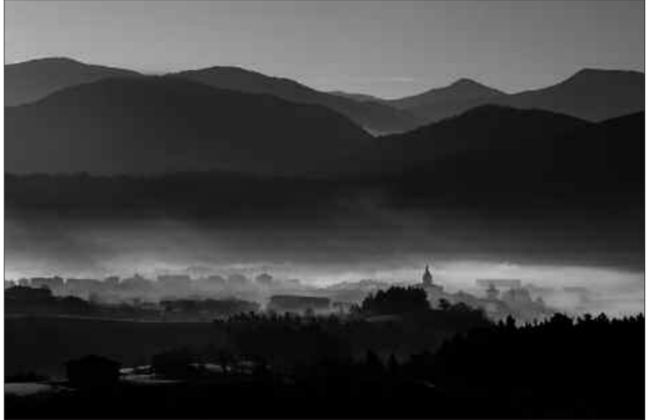
USURBILGO MUGAK EZAGUTZEKO AUKERA APARTA IZANGO DUGU APIRILAREN 20AN.

Izen ematea egun berean egingo da udaletxe aurrean, bertatik emango zaio