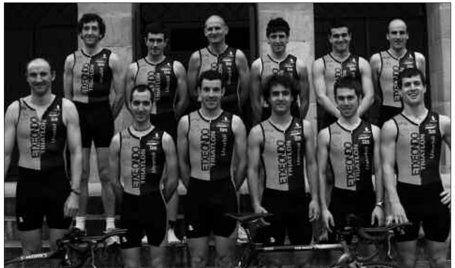
AURTENGOA LEHEN DENBORALDIA IZANGO DA BAXURDE TXIKI TALDEARENtzat.

N. Taldearen osaketari dagokionez, nola bildu zarete?