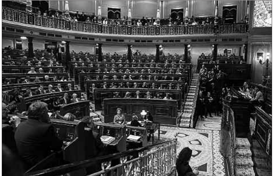
BABES TXIKIKO ALDERDI UGARIK JASO ZITUZTEN BOZKAK MARTXOAREN 9KO HAUTESKUNDEETAN.

Rosa Diezen alderdia da. Sozialisten buruzagi ohiak Madrilen lortu du ordezkaritza, denera 300.000 bozka