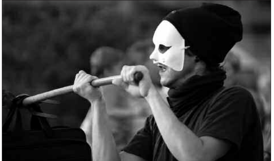
IKUSKIZUN EZBERDINEKIN GOZATZEKO AUKERA IZANGO DA LARUNBAT HONETAN.

Sinopsia: Aire ikuskizunari lotuta-ko akrobaziak egingo dituzte. Airean zein lurrean, ikuskizuneko bi protagonistak gorputz geometrikoekin