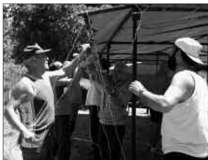
KANPALDIRA JOATEKO DEIA ZABALTZEAZ GAIN, BEGIRALEAK BILTZEKO DEIA ERE EGIN DU ZIORTZAK.

Edozein kasutan izena emateko deitu 638 524 710 telefono zenbakira edo bidali e-maila helbide honetara: ziortzage@gmail.com