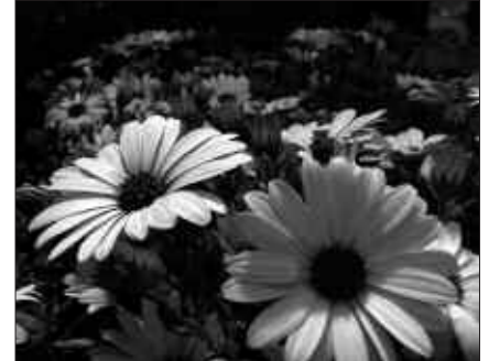
IAZKO LEHIAKETAN SARITUA IZAN ZEN ARGAZKIETAKO BAT.

matuan handituko du elkarteak. Handitutako argazki horiek prentsan argitaratuko dira eta ikusgai jarriko dira leku ezberdinetan.