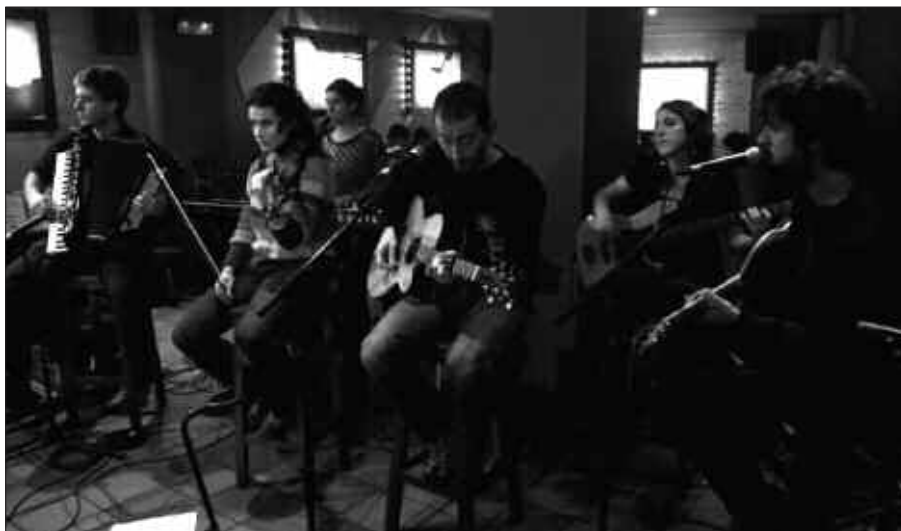
KATAMALOREN SAIOA IKUSTEKO SARRERAK SALGAI DAUDE TXIRRISTRAN ETA NOAUA!N.