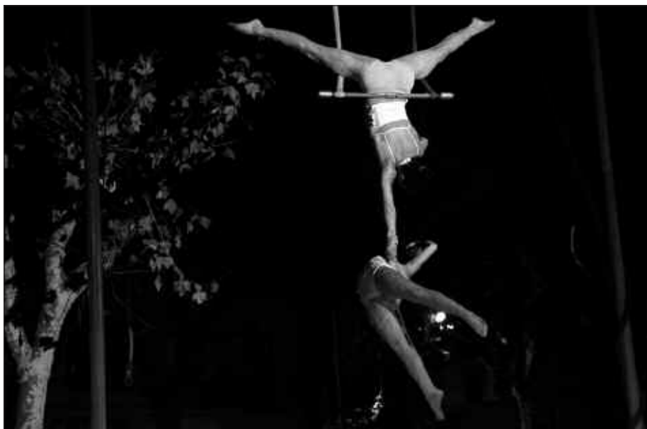
AKROBAZIAK EGITEN IAIOAK DIRA AZULKILLAS TALDEKOAK.

M. Y. Ez ditugu guztiak zenbatuta, baina ehunetik gora izango dira. Aurtengo denboraldiko lehen saioa, Usurbilen eskainiko dugu. Jendea animatu eta etor dadila, ikuskizun ederra izango baita.