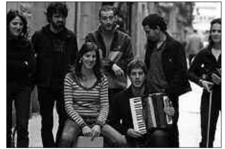
KATAMALO, DISKOAREN AURKEZPENEAN.

Sarrera: aldez aurretik 5 euro, Txirristran eta NOAUA!ko egoitzan. Egoinean bertan, 6 euro. NOAUA!ko