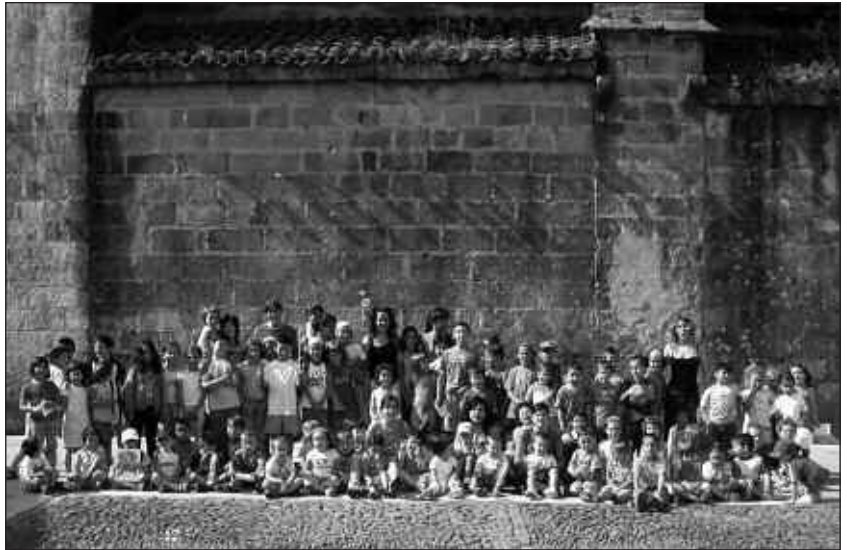
75 HAUR BILDU ZIREN 2006KO UDA JOLASEN.

Hilabete batzuk falta dira oraindik, baina udan arazo baten aurrean egon daitezke guraso asko. Aurten ez baita Uda Jolas txokoa antolatuko. Orain arte, ludoteka funtzioa egin du Uda Jolasek. Arrakasta handiarekin, gainera. 2006an, esate baterako, 75 haur bildu zituen. Baina begiraleak beste lan batzuetan daude eta ez dute uda honetakoa prestatzeko aukera izango. Beraz, beste begirale gazte batzuk ez badute antolatzen, haur asko kale gorrian ikusiko dira. Eta guraso asko, beraz, arazo baten aurrean. Bereziki, kaxkoan bizi direnak. Izan ere, Zubietan eta Aginagan ere ludotekak antolatzen dira baina ez dira Uda Jolasen ekimenak.