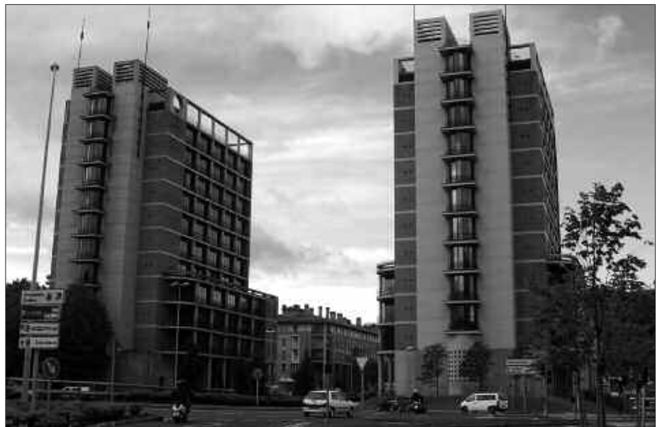
HERRITAR ASKO JOANGO DIRA ERRENTA AITORPENA EGITERA DONOSTIAKO FORU OGASUNEKO EGOITZARA.

Pasa hitz bat izanda, Ogasuneko informazioa ikusi eta gorde daiteke. Hartara, bildutakoa aitorpena egiteko frogagiri gisa balia liteke. Pasa hitza www.gipuzkoa.net atarian eskatu behar da eta zerga bulegoetan jaso.