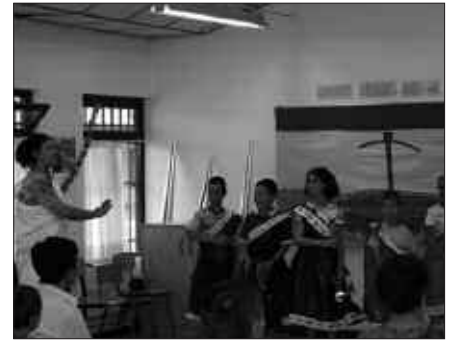
JOKOAK, ANTZERKIAK... MODU ATSEGINEAN IKASIKO DUTE INGELERA.

Izena emateko epea apirilaren 25ean amaituko da. Baina begiraleak hartzeko etxerik ez balego, udalekua bertan behera utziko lukete.