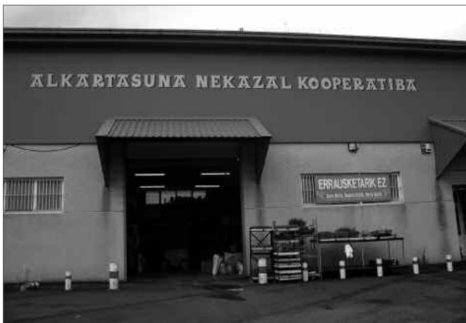
1908KO EKAINAREN 8AN JARRI ZUTEN MARTXAN ALKARTASUNA KOOPERATIBA. GAUR EGUN, EHUNDIK GORA BAZKIDE DITU.

Azken hogeita bost urte hauetan jasan ditu aldaketa gehien Alkartasuna Kooperatibak. Ordura arte izandako lehengaien hornitzaile funtziora mugatu ordez, zerbitzu eskaintza zabaltzen joan