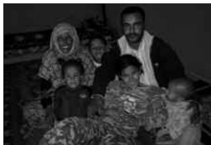
SAHARAKO EGOERA DU AZTERGAI MAIATZAREN 3KO DOKUMENTALAK.

Errefuxiatuek kontatzen dute nola antolatu duten kanpamenduan euren bizimodua: elikadura, ura, etxebizitzak, osasuna, hezkuntza, kultura... Bere lurra berreskuratzeko itxaropena duen eta autodeterminazio erreferenduma