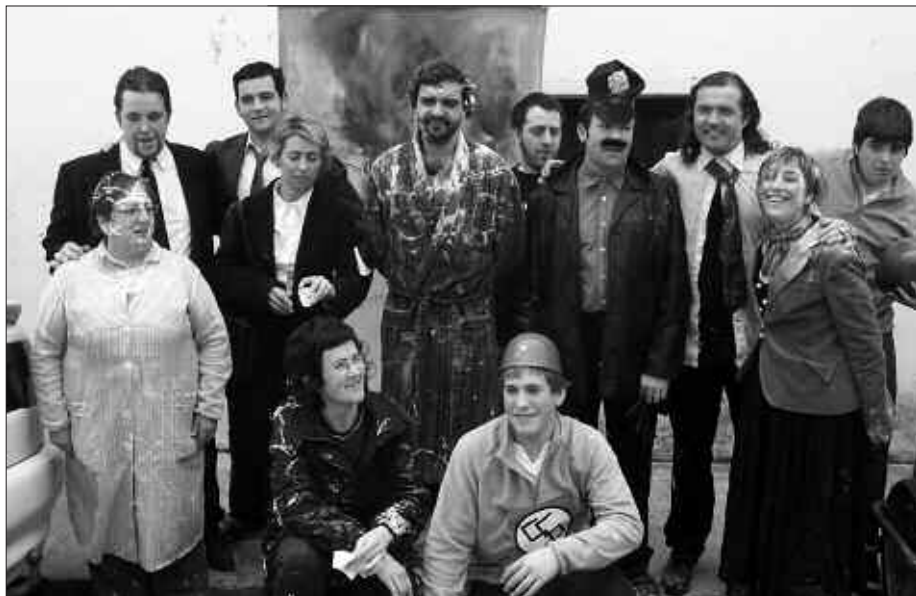
APIRILAREN 12AN OSPATU ZEN LEHEN KALE ANTZERKI EGUNA. TXERRIKI TALDEKOEK ESKAINI ZUTEN EMANALDIAREN ONDOREN ATERATAKOA DA ARGAZKIA.