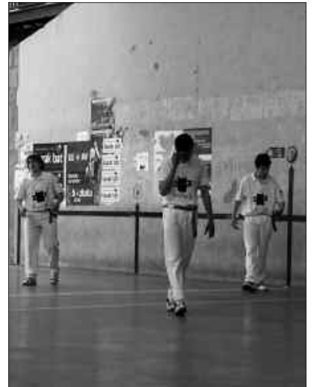
OSTIRAL HONETAN, ARRATSALDEKO 19:30EAN JOKATUKO DA USURBILEN JOANEKEO PARTIDA.