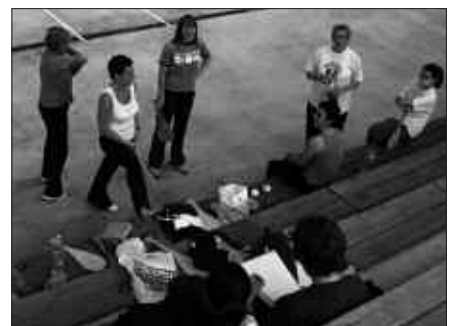
IAZ PALETA TXAPELKETAN PARTE HARTU ZUTEN IKASLEAK.

Ikastaro honetan oinarrizko ezagutzak irakatsiko ditu Usurbilgo Pilota Elkarteko begiraleak: beroketak, luzaketak, oinarrizko teknika lantzeko ariketak, oinarrizko taktika egiteko ariketak, araudia ezagutzeko ariketak eta oinarrizko gaitasun fisikoak.