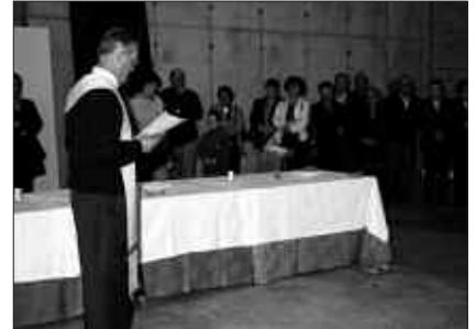
2001 ETIK HONA, UGARTONDON DAGO SINDIKATUA. IRUDIAN, ORDUKO INAUGURAZIO EKITALDIA.

Auzokako bazkide ordezkartza sistema antolatua dute Alkartasunan.