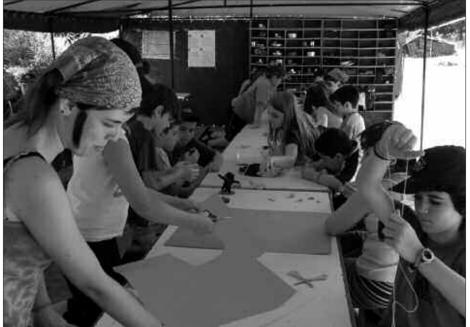
ZIORTZAREN UDAKO KANPALDIRA JOATEKO, 50 GAZTE ANIMATU DIRA.

Aldaketarik ez bada, Santixabelak amaituta, uztailaren 7tik 20ra bitartean joango dira Peñaloscintos (Errioxa) aldera. Hala ere, izena ema-