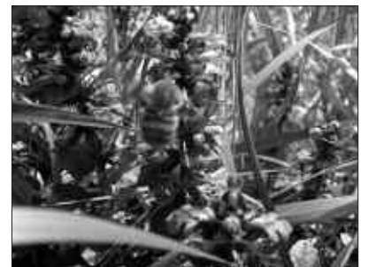
IAZ, OIHANA IBARRAK AURKEZTU ZUEN ARGAZKIA DA HAUXE.

Irabazleen izenak maiatzaren 13an jakinaraziko dira. Informazio gehiago, Santuenea Kultur Elkartean.