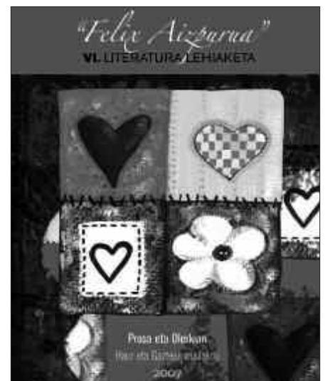
IAZKO LANEKIN OSATUTAKO LIBURUA ARGITARATU BERRI DU UDALAK.

Informazio gehiago, udal euskara batzordean: 943 371 999.