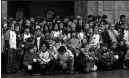
15:00ETAN HASIKO DA ESKOLARTEKO TXAPELKETA, UDARREGIN NAHIZ KIROLDEGIAN.

Eskolarteko Txapelketa honek hiru fase izango ditu. Lehenik, ikastetxe barruko aukeraketa egingo da. Bigarrenik, eskualdeko kanporaketak jokatu dira. Eta hirugarrenik, azken saioa edo finala, Irurako pilotalekuan. Apirilaren 25ean Usurbilen jokoan