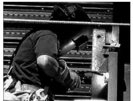
DATORREN ASTELEHENERAKO ORDUBETEKO LANUZTEA DEITU DUTE.

Ordutik, mundu osoko sindikatuek bat egiten dute lan baldintza duinen