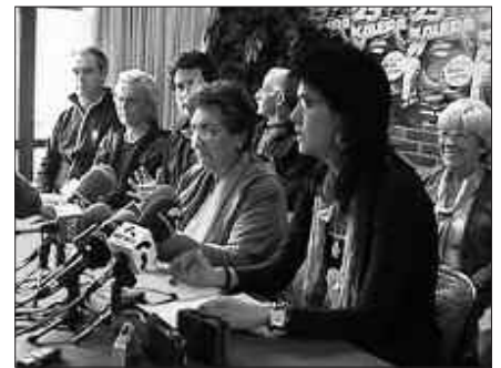
MANIFESTAZIOA ILUNTZEKO 20:00ETAN HASIKO DA. IRUDIAN DEITZAILEAK, PRENTSAURREKOAN.

Datorren astelehenean egingo dute epaiketaren bigarren saioa. Egun