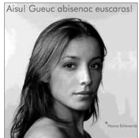
KANPAINA ESKUALDE OSOAN EGINGO DA.

Dena den, argibide gehiago Usurbilgo Euskara Zerbitzuan jasoko duzue, 943 371 999 telefono zenbakian, edota Bake Epaitegian bertan.