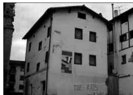
POTXOENEA HUTSIK DAGO ASPALDITIK.

Bestetik, Santixabeletako Jai Batzordeak ere hainbat bilera egin ditu. Datorrena maiatzaren 19an astelehena izango da, Sagardo Egunaren bihar-munean. Arratsaldeko 19:00etan udaleko areto nagusian.