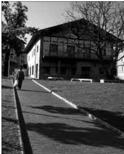
ARTZABALEN KOKATUKO DA JUBILATUEN EGOITZA BERRIA. ORAINDIK EZ DA IREKIERA EGUNA ZEHAZTU.

Zerbitzua kudeatzeko hitzarmenaren garapena, ihardunbidea eta esleipena eta lizitaziorako oinarri bezala erabiliko diren preskripzio teknikoak