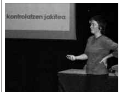
AURREKO ASTEKO HITZALDIAN, LURRAREN ONGARRITZEA ETA KONPOSTA AZTERTU ZIREN.