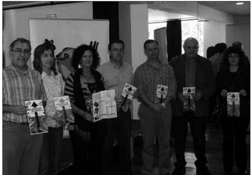
IRUDIAN, URNIETAKO ETA ASTIGARRAGAKO EUSKARA BATZORDEETAKO LEHENDAKARIAK ETA BURUNTZALDEKO IKASTETXEETAKO ORDEZKARIAK.

D errigorrezko Bigarren Hezkuntza bukatu eta ondorengo ikasketak euskaraz egitea sustatzeko kanpaina aurkeztu zuten maiatzaren 6an Buruntzaldeko Udaletako euskara batzordeek. DBHn ikasketak euskaraz burutu arren, ez baitago zeharo bermatua hizkuntza berean ikasten jarraitzeko aukera. Horretan ari dira, hezkuntza eskaintza eta lan mundua euskalduntzea bultzatzen. Gogoratu zutenez, euskara plana abian jarri duten hamaika enpresa daude. Buruntzaldeko ikastetxeetako ikasketa aukeren berri ematen duen triptikoa kaleratu dute, matrikulazio garaia iritsi baita. Batxilergoetako aurrematrikulazio-epaia maiatzaren 9an itxiko da. Zikloetakoa ekainaren 2tik 13ra izango da.