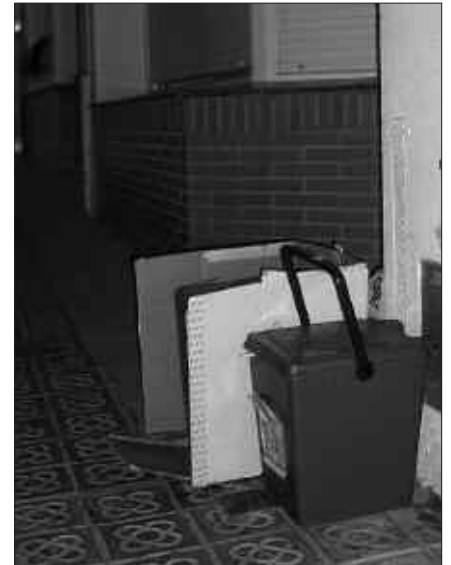
ATEZ ATEKO SISTEMA AHALIK ETA AZKARREN EZARTZEA ESKATU DU USURBIL BIZIRIK PLATAFORMAK.

Gipuzkoako udaletxeetan mozioak aurkeztu ari dira. Batzuetan denek bat egin dutela eta, Azpirozaren esanetan, "aurka bazaude saiatuko gara konbentzitzen hau dela bide egokiena" zioen. Usurbil Bizirik-eko kideak ziren pleno aretoan eta haietako batek hitza hartu zuen. Herrialde