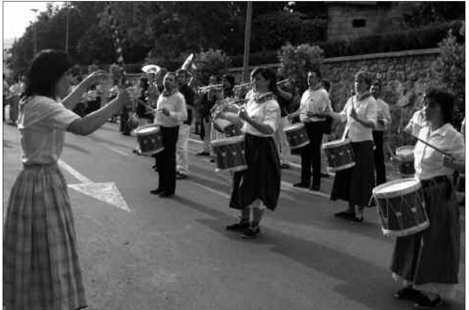
AURTEN, HAURREN DANBORRADA SANTIXABEL EGUNEAN IZANGO DA, ETA HELDUENA, ORDEA, UZTAILAREN 1EAN ARRATSALDEZ.

Helduen danborradan parte hartu nahi dutenek ere asteburu honetan eman beharko dute izena. Ostiral honetan zabalduko da izena emateko epea eta lehen entsegu saioa ere ostira-lean bertan egingo da. Aipatu bezala, hilaren 9an, 20:30etik aurrera Agerialdeko patioan. Informazio gehiago: 943 371 999.