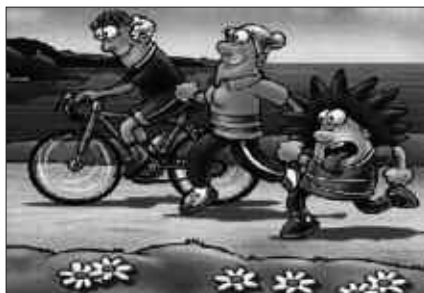
MAIATZAREN 12AN ARRATSALDEKO 16:00ETAN HASIKO DA HITZALDIA.