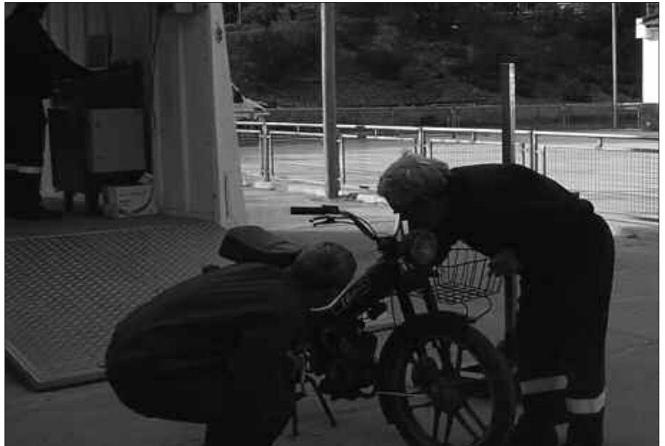
ITVA PASA AURRETIK, HITZORDUA HARTZEKO UDALTZAINGORA DEITU BEHAR DA, 943 361 112 TELEFONO ZENBAKIRA DEITUZ.

Eusko Jaurlaritzak Euskal Autonomia Erkidegoan (EAE) IAT-ITV pasatzeko eskumena duenez, 2007ko otsailaren 13ko aginduaren bidez, EAEko ziklomotorrek IAT-