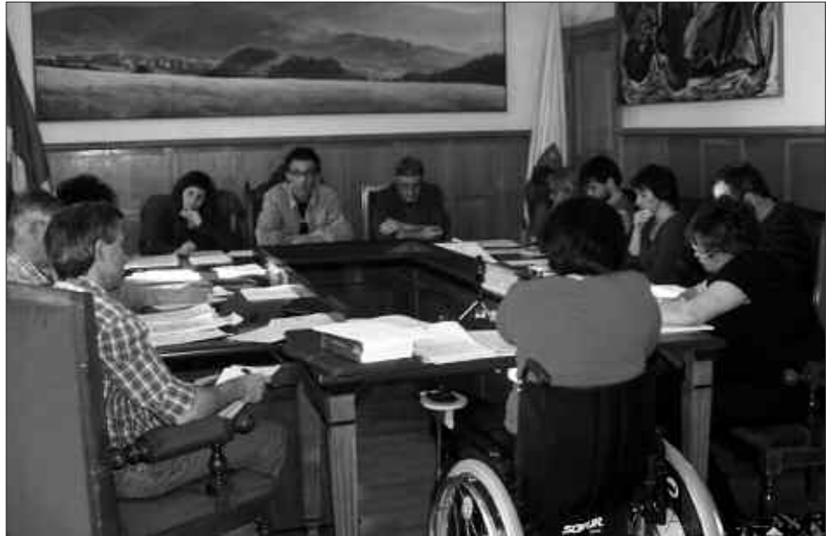
APIRILAREN 29KO UDALBATZA PLENOAN, BEHIN BETIKO IZAERA EMAN ZITZAION BABES OFIZIALEKO ETXEBIZITZEN ZOKKETARAKO OSATU ZEN ZERRENDARI.

Prozesua honaino iritsita, orain, etxebizitzaren zozketa noiz egingo den