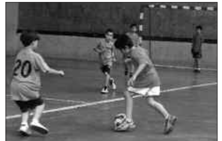
IZENA EMATEKO EPEA ASTE HONETAN AMAITUKO DA.