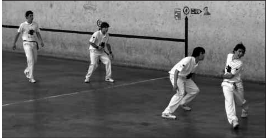
USURBIL ETA AZKOITIA ARTEKO PARTIDAK USURBILEN JOKATUKO DIRA OSTIRAL HONETAN; ETA SANTIXABEL TXAPELKETAKO PARTIDAK AGINAGAN.

Horri esker, Usurbilek aurrera egin du Herri Arteko Pilota Txapelketan. Azkoitia izango da hurrengo aurkaria. Eta ez da lan erraza izango. Azkoitiarrak txapeldunorde izan ziren 2005ean, eta txapeldunak 2006an.