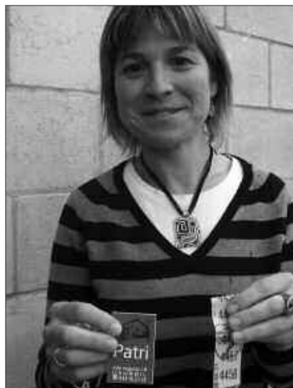
PATRIN BIRENTZAT AFARIA IRABAZI DU JOSUNE ARRUTIK, ESKUBALOI TALDEAK EGINDAKO ERRIFAN.

Menua sagardotegikoa izango da eta prezioak hauek: gazteak 19 euro (18 urtetik behera); eta helduek 25 euro (18 urtetik gora). Tiketak hartzeko epea ekainaren 7an amaituko da.