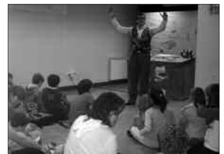
AURREKO ASTEAN IRRINTZI TALDEAK "ZUK, ZUK JAUNAREN ALFABETOA" ESKAINI ZUEN SANTUENEAN.

Datorren astean, ekainak 14, Potxin eta Patxin pailazoan txanda izango da. Zubietako frontoian arituko dira, 17:00etan hasita.