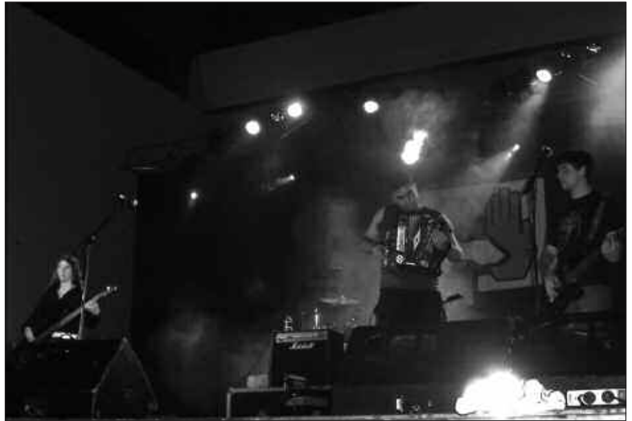
GARRAXI TALDEAREN SAIDAREKIN AMAITU ZEN LARUNBATEKO KONTZERTUA.

A HT Gelditu Elkarlanak antolatu- tutako Gelditour ekimen erral- doia Donostian eta Usurbilen amaitu zen pasa den larunbatean. Egunean zehar hiriburuan ekitaldi ugari izan ziren; tartean, arratsaldean erdiguneko kaleak zeharkatu zituen manifestaldi jendetsua. Gauetz, Sutagar, Kaotiko, Etsaiak, Naizroxa, Dj Bull eta Garraxi musika taldeen emanaldiak izan ziren Usurbilen. Euriteak ez zituen herrita- rrak etxean gerarazi. Eta frontoia eta Askatasuna plaza jendez bete ziren, goizaldeko ordu txikiak arte.