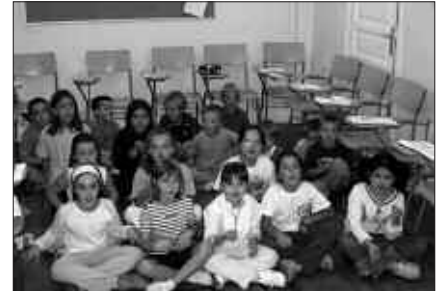
OSTIRAL HONETAN AMAITUKO DA MATRIKULATZEKO AUKERA.

IKASGAIK: Musika-Txokoa, musika mintzaira, helduentzako musika mintzaira, tronpeta, saxofoia, biolina, perkusioa, klarinetea, abesbatza, eskusoinua, alboka, pianoa, txistua, kitarra, flauta, alboka, talde instrumentalak.