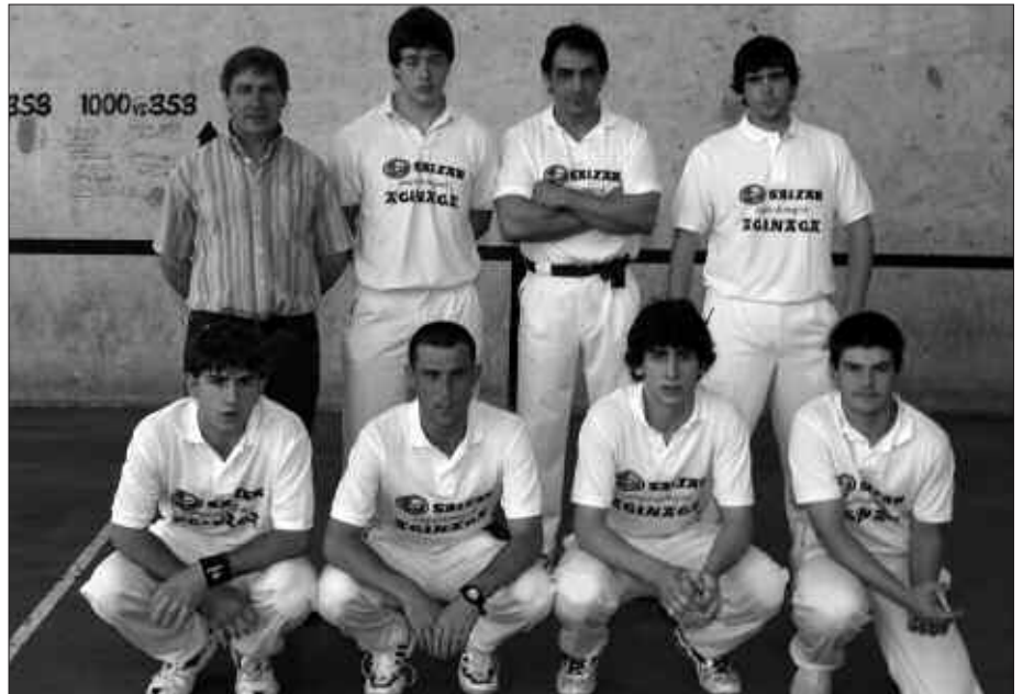
HERRIARTEKO TXAPELKETA, DONOSTIAREN AURKA ARITU ZIREN PILOTARIAK.

Kadete mailako partidaren, 22-14 galdu zuen Usurbilek eta jubenetan, 22-18. Jada Herriarteko kanporaketa erabakita zegoen. Nagusien partida ez zen erabakigarria baina partida polita eskaini zuten bi taldeek.