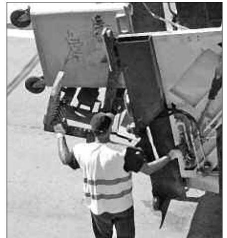
UDAL ZERBITZUEN KUDEAKETA JASANGARRIAGOA IZATEA DA ILDO ESTRATEGIKOETAKO BAT.

Aipatu bezala, oraingo udal gobernu taldeak egokitu egin du egitasmo hori. Epe laburrera, urtebetera eta lehentasun handiz gauzatu beharreko eginkizun gisa izendatu dute, edukiontzia lurperatu ez, baizik eta udalerrian atez ateko bilketa zerbitzua jartzeko egitasmoa. Asmoa gauzatzeko, lehen Udalaren parte hartzea soilik aurreikusten zen. Orain, moldaketak egin ostean, Udaleko Hirigintza,