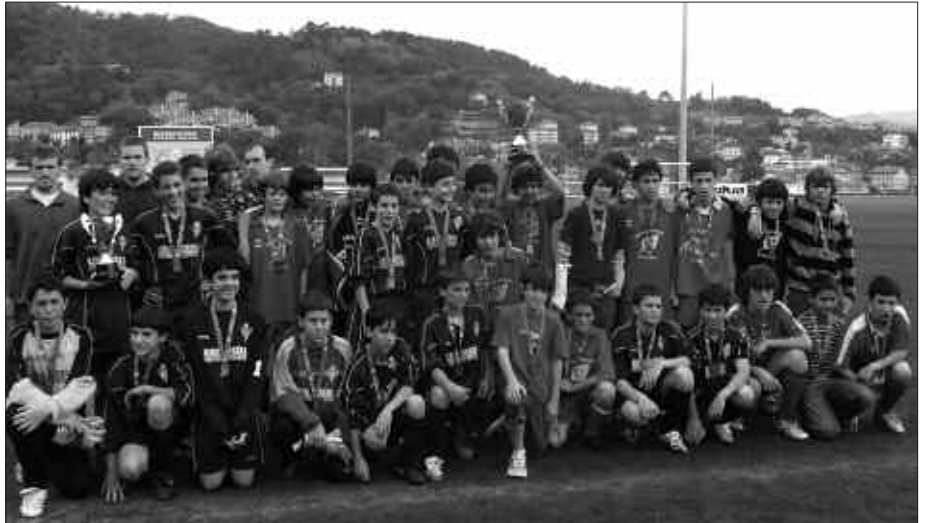
BERGARAREN AURKA IRABAZI ZUTEN GIPUZKOAKO TXAPELKETA. LARUNBATEAN, NAFARROAREN AURKA JOKATUKO DUTE BERIOKO (DONOSTIA) FUTBOL ZELAIAN.

Larunbat honetan, Berion jokatuko dute Nafarroaren aurkako partida.