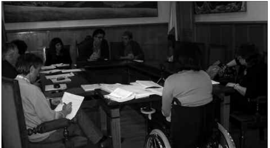
MAIATZAREN 27KO UDALBATZA PLENOAN, MOZIO EZBERDINAK AZTERTU ZIREN.

Indarkeria espresio ugari egonik eta gaitzespenek arazoa konponduko ez dutela adierazita, gatazka politikoa eta