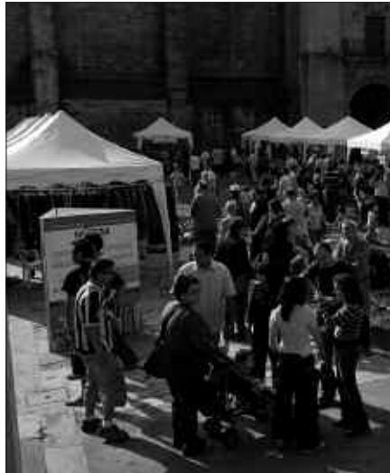
IAZ ERE EGIN ZEN ANTZEKO AZOKA USURBILÉN.

Azokan jarriko diren salmenta postuak erreserbatzeko aukera dute nor-