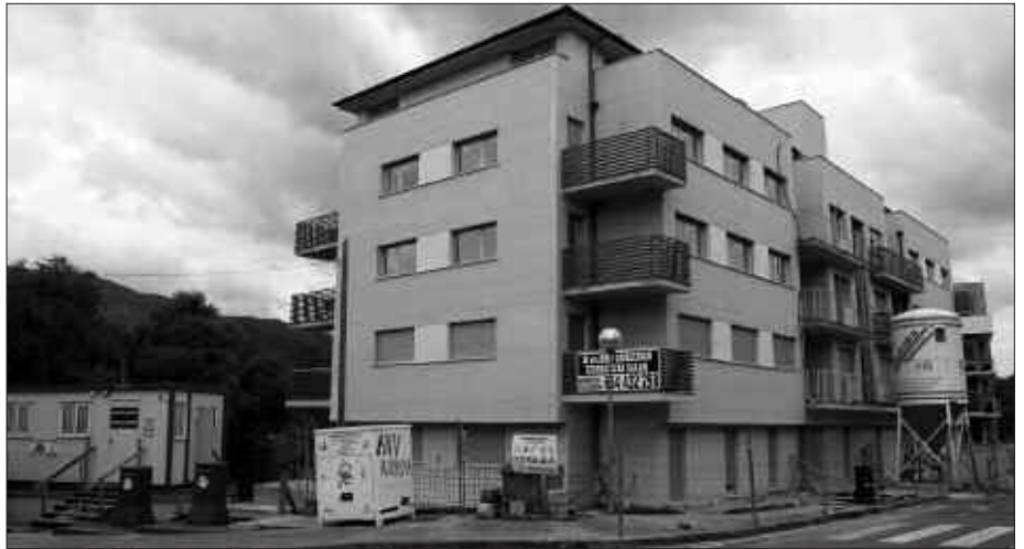
LURZORUAREN LEGEAK DIOENA BETETZEKO HILABETEKO EPEA EMAN ZAIE ENPRESA ERAIKITZAILEEI.

Hau da, arautua dagoena baino 616,72 metro koadro gehiago eraiki dituzte bertan. Martxotik jada horren zantzuak atzeman zituen udal gobernu taldeak. Apirilean egindako txosten tek-