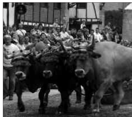
HIRU UZTARRIKO IDI-DEMAK ARRAKASTA HANDIA IZAN ZUEN IAZKO FESTETAN. IGANDEAN, ARRATSALDEZ IZANGO DIRA IDI-PROBAK.

Eguerdian, bestalde, Saizarren baz- karia antolatu dute Sindikatukoek. Kontuan izan, Alkartasuneko bazkide- ek erdi prezioan izango dute otordua; 18 eurotan. Gainerakoek, 37 euro ordaindu beharko dituzte. Txartelak dagoeneko Alkartasuna Nekazal Kooperatiban salgai daude. Bertara joanda eskura daitezke.