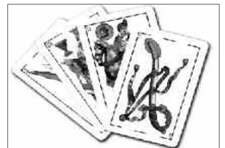
AZKENA IZANIK, PUNTU GEHIEN PILATU DITUZTEN MUSLARIK SARI BEREZIAK JASOKO DITUZTE.