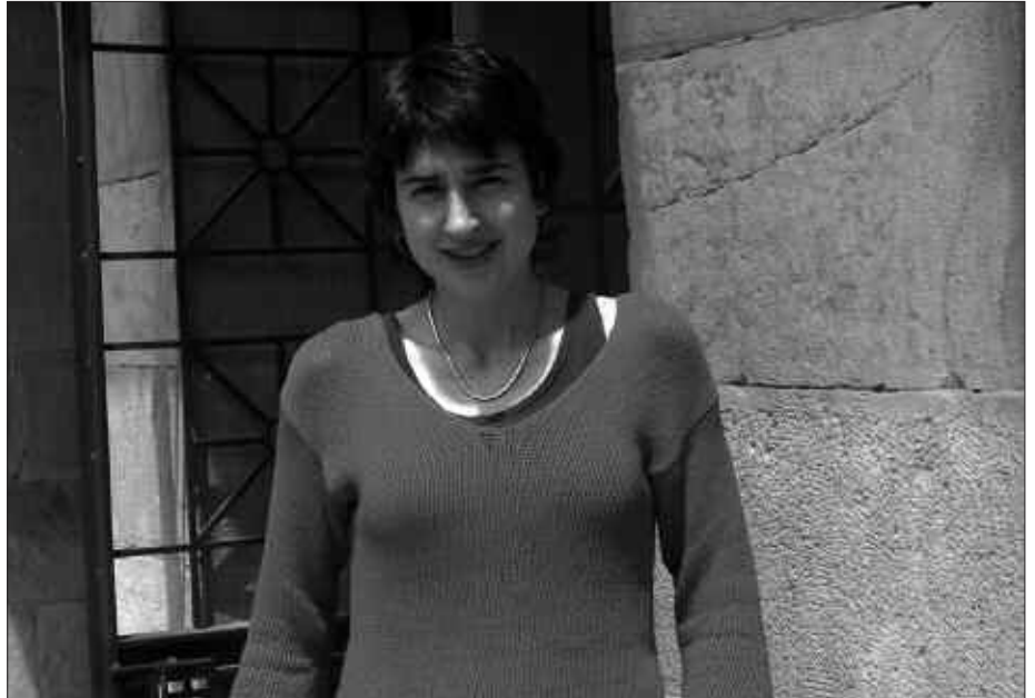
ATEZ ATEKO HONDAKINEN BILKETA SISTEMA BERRIA, URTE AMAIERARAKO JARRI NAHI DA MARTXAN. HORREGATIK, LASTER ABIARAZIKO DU UDALAK, ELKARTE ETA HERRITARREI ZUZENDUTAKO PROZESU PARTE HARTZAILEA.

Baina Nekazaritza eta Ingurumen Teknikaria beste gauza batzuetarako dago. Herri guztietan egon beharko luke. Gainera nekazal lur sailekin eta ingurugiroarekin zer gertatzen ari den ikusten ari gara.