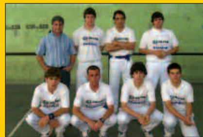
Lan txukuna osatu dute Herriarteko Txapelketan