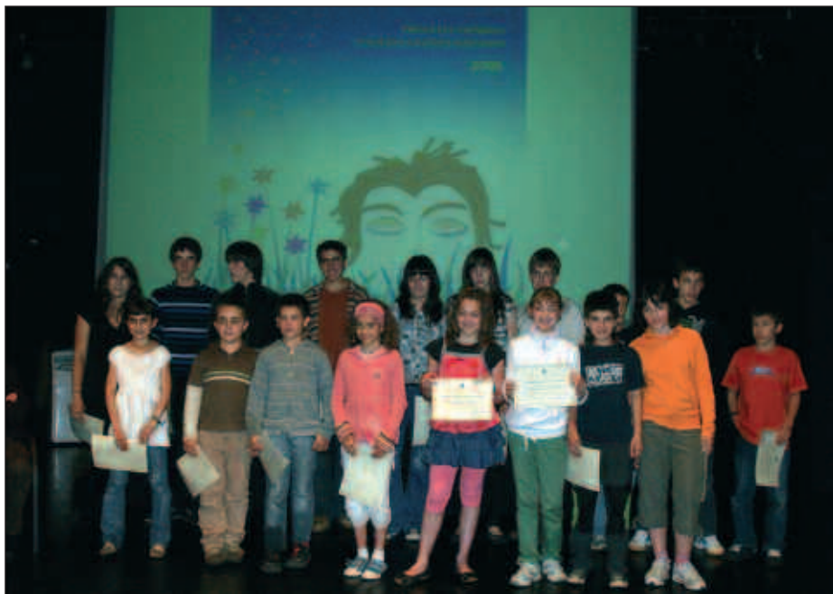
AURREKO ASTEAN EGIN ZEN SARI BANAKETA, SUTEGIKO AUDITORIOAN.