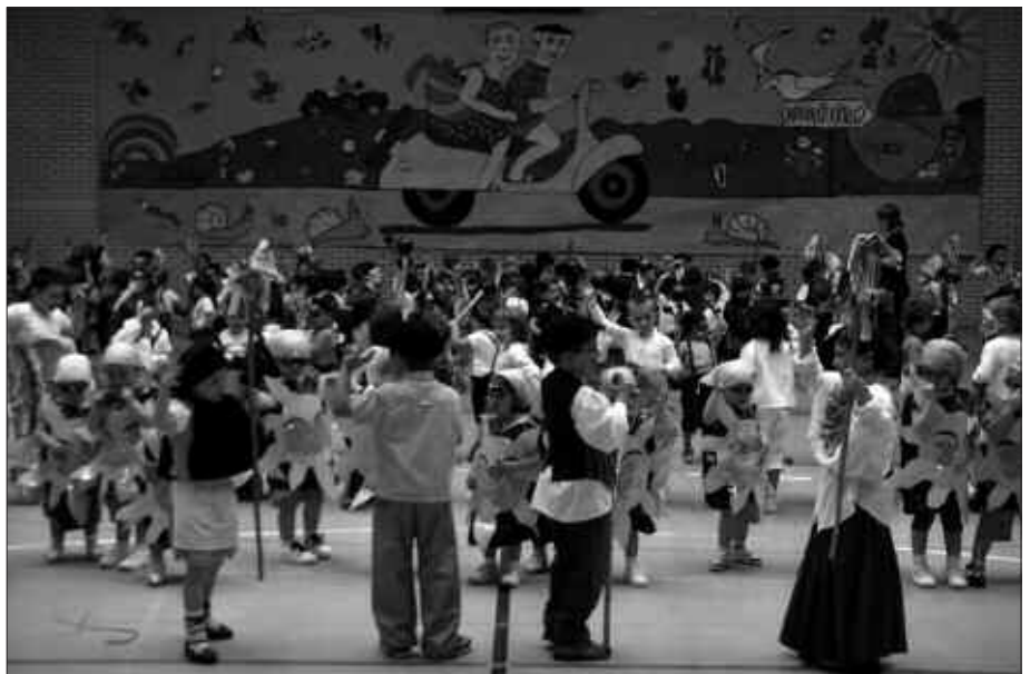
GUSTURA ARITU ZIREN HAUR HEZKUNTZAKO IKASLEAK IKASTOLAREN EGUNEAN ESKAINI ZUTEN EMANALDIAN.

Asko entseatzen dugu egun honetarako eta lan asko egiten dugu mozo-roak prestatzen eta horregatik atertzen da hain polita jaialdia. Hala ere, nahiz eta gogo handia izan dantza egiteko, batzuk oso urduri jartzen gara hainbeste jende guri begira ikustean.