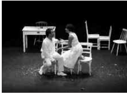
ERAKUSKETAREKIN BATERA, ANTZEZLANA ANTOLATU DU EINEAN GURASO ESKOLAK.