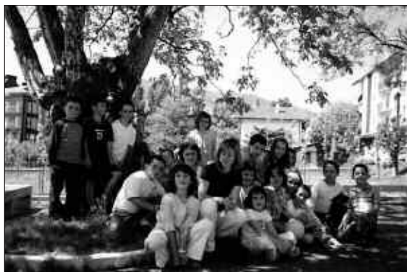
Udarregi Ikastola, Usurbil-5A

Natura hiltzeko era izango lizake, barazkirik jan gabe egun eta aste.