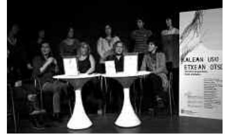
GUSTURA ARITU ZIREN HAUR HEZKUNTZAKO IKASLEAK

Antzerki emanaldirako aukeratutako esaera zaharrak, "Kalean uso, etxean otso", egoera mingarri hau ondo baino hobeto adierazten du.