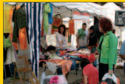
Bigarren eskuko azoka, igande honetan Dema plazan