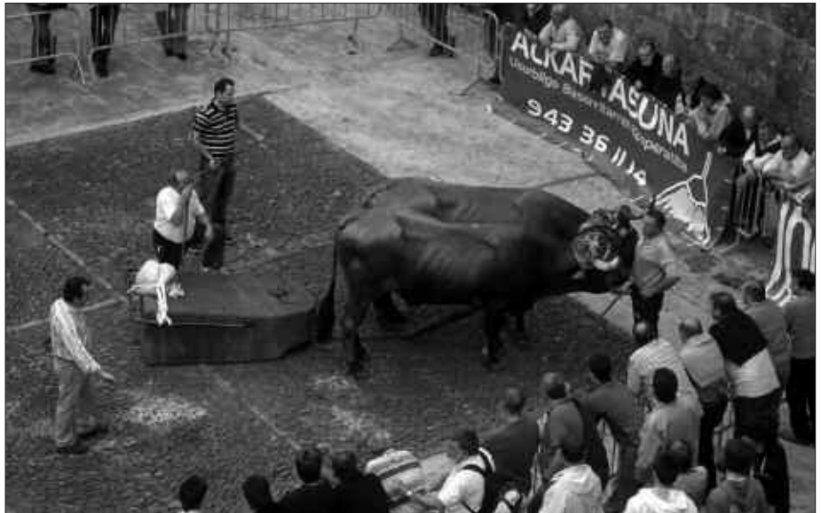
IRUDIAN, MENDEURRENEKO JAI EGUNEAN OSPATUTAKO IDI-DEMA PROBA. 46 PLAZA EGINDA, GARAILEA ITZIARKO IXAMA IZAN ZEN.

Bazkaltzeko antolatzaile, bazkide zein gonbidatuak Saizarren bildu ziren. Bertako mahai nagusia bete omen zuten, hirurogei lagunetik gora batu ziren eta. Goizean Igeldokoak txapel-dun izendatu bazituzten, arratsaldean ez ziren atzean geratu idi-dema saioa eskaini zuten hiru lehiakideak. Gutxienak 40 plaza egin zituen, gehienak 46. Garailea, Itziarko Ixama izan zen. Eta saioa ikustera hurbildutakoak goizean baino gutxiago izan arren, Alkartasuna Baserritar Kooperatibakoei helarazi dizkieten iritzien arabera, ikusleak gustura ziren, maila handiko lehia izan zela baitzioten.