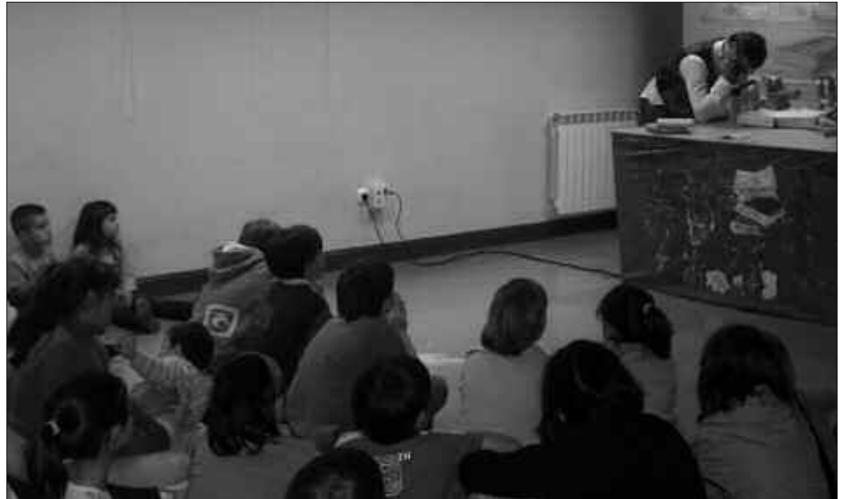
EGURALDIA TXARRA DENEAN, UДАРREGI IKASTOLA IZANGO DA UDAJOLASEKO LAGUNEN ATERPEA.

Aurten Tkakun elkartekoak arduratuko dira Zubietako Udako Txokoetaz. Usurbilen ez bezala, Zubietan bi hilabetez luzatuko da udako aisialdi eskaintza. Izen-ematea maiatzaren 27an bukatu zen eta, uztaileko, 21 haurrek eman dute izena. Abuzturako, 17 izan dira animatu direnak. Udako txokoak uztailearen 1an hasiko dira eta abuztuaren 29an bukatuko dira. Haurren zaintzaz bi begirale arduratuko dira.