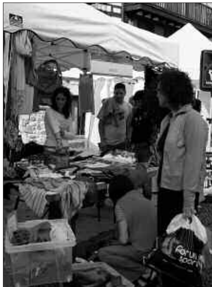
DEMA-PLAZAN EGINGO DA AZOKA, 10:00ETATIK 14:00ETARA.

Erosi eta saldu, biak egin daitezke igandeko azokan. Bigarren eskuko zerbait saldu nahi duenak, badu horretarako aukera. Hori bai, alde zuzenetik eman behar du izena. Telefonoz, 943 670 249 zenbakira deituz, astegunetan 9:00-18:00 artean deituta. Internet bidez, atari honetan: www.merka2sanmarcos.org