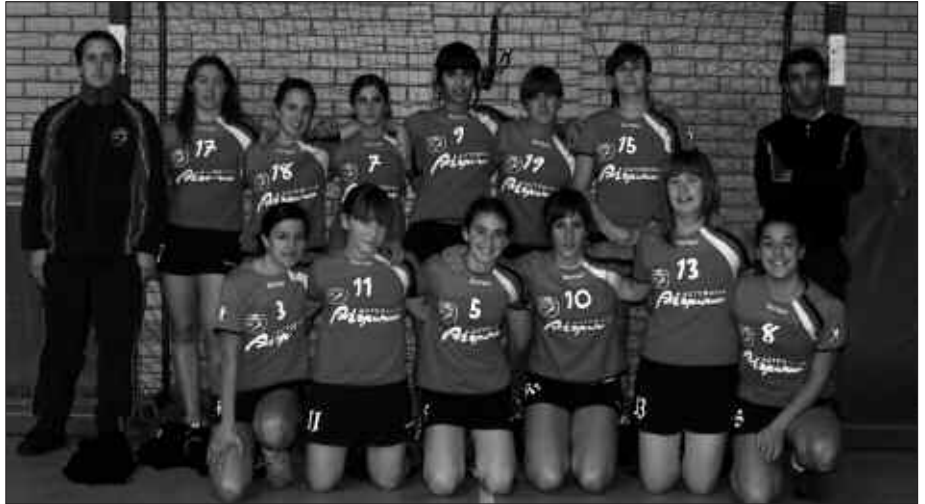
GIPUZKOAKO TXAPELKETAN HIRUGARREN ETA EUSKAL LIGAN LAUGARREN IZAN DIRA KADETE MAILAKO NESKAK.

Talde honek egindako lanarekin ere gustora daude Usurbil Kirol Elkartearen. Denboraldi hasieran zenbait zalantza zituzten, taldea osatzeko jendez juxtu. Honen ondorioz, taldea osatzeko inoiz eskubaloian ibili gabeko jokalaria hartu behar izan zituzten. Liga hasieran nahikoa maila juxtua eman zuten, baina goraka joan da talde honen jokoa eta zenbait partidatan maila oso ona ematera ere iritsi dira. Ligan 5. postua eskuratu dute. Aipatzekoa da talde honetan izan duten giro ona ere. Kopan, asistentzia