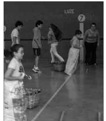
3-12 URTE ARTEKO GAZTETXOAK BILDUKO DITU AGINAGAKO UDAKO TXOKOAK.

3 -12 urte arteko haur eta gazte-txoei zuzendutako txokoak antolatu dituzte Aginagan datorren hilerako. Eskaintza uztailearen 1etik 30era luzatuko da eta ordutegia hauxe izango da, 9:00-13:00. Izen-ematea zabalik dago ekainaren 16ra arte, honako telefono zenbaki hauetan: 676 163 506 (Dolo) eta 600 484 948 (Manuel). Txokoetan parte hartuko duten egun kopuruaren arabera bi prezio mota finkatu dituzte antolatzaileek. Hilabete osoz, izena ematearen truke 70 euro ordaindu behar dira. Hamabostaldi batean bakarrik egoteagatik, 40 euro. Programatuko dituzten ekintzen artean, astero egun osoko irteerak egingo dituzte.