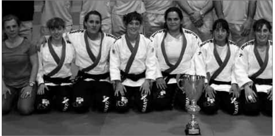
EKAINAREN 21EAN, EUSKADI-KUBA JUDO TXAPELKETA JOKATUKO DA.

Aipatu bezala, ekainaren 21ean, 18:00etik aurrera punta puntako bi selekzioen aurrez aurrekoa ikusi ahal izango da kiroldegian. Urte askotan txapelduna izan eta aurten, txapeldunorde postua eskuratu duen Kubako Selektzioa alde batetik. Bestetik, Euskadiko Selektzioa, ia erdia, Usurbilgo Judo Taldeko kideez osatua. Herriko kirol taldea Espainiako klubaren artean txapelduna izan dela ezin ahaztu. Inolako zalantzarik gabe, emakumezkoen bi selekzioek eskainiko duten judo saioa ikusgarria izango da.