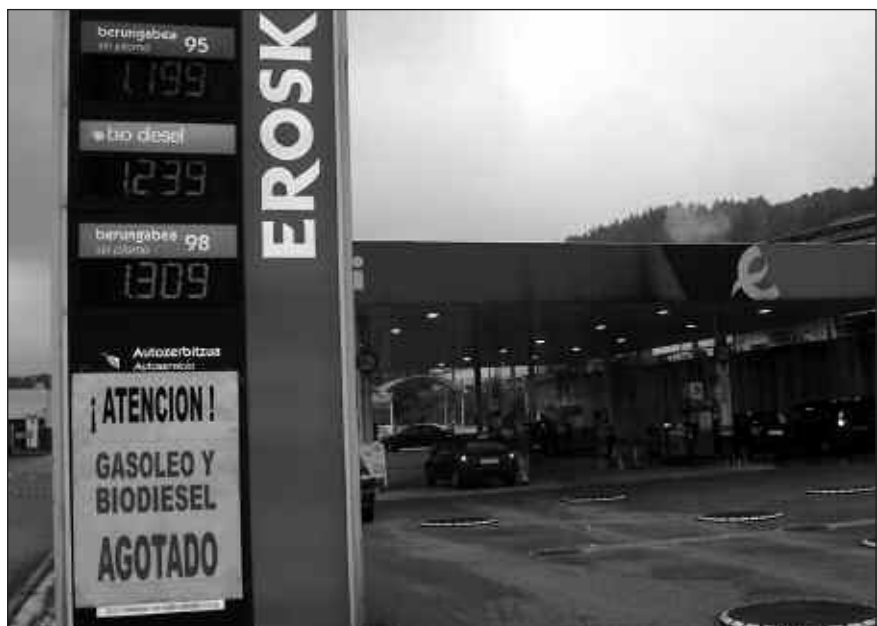
ASTELEHEN ARRATSALDEAN JARRI ZUTEN TXARTEL HAU URBILEN, KASTELLANAZ...

Igande gauerdian hasi zen garraiolarien grebaren eragina handik gutxira nabaritzen hasi zen. Bereziki, irudian agertzen den bezala, hainbat gasolindegietan. Urbil merkatalgunekoan esaterako, 98 zenbakidun berunik gabekoa izan ezik, postu guztietako gasolina amaitu zen astelehen arratsalderako. Ibilgailu mugimendua bazez inguru hartan, baina gasolindegi hartara joateko egindako ahalegina alferrikakoa zen. Askok buelta eman eta beste norabait joan behar izan zuten. Irudi bera errepikatu zen beste hainbat lekutan ere. Greba luzea eta gogorra izango dela iragartzen zuten.