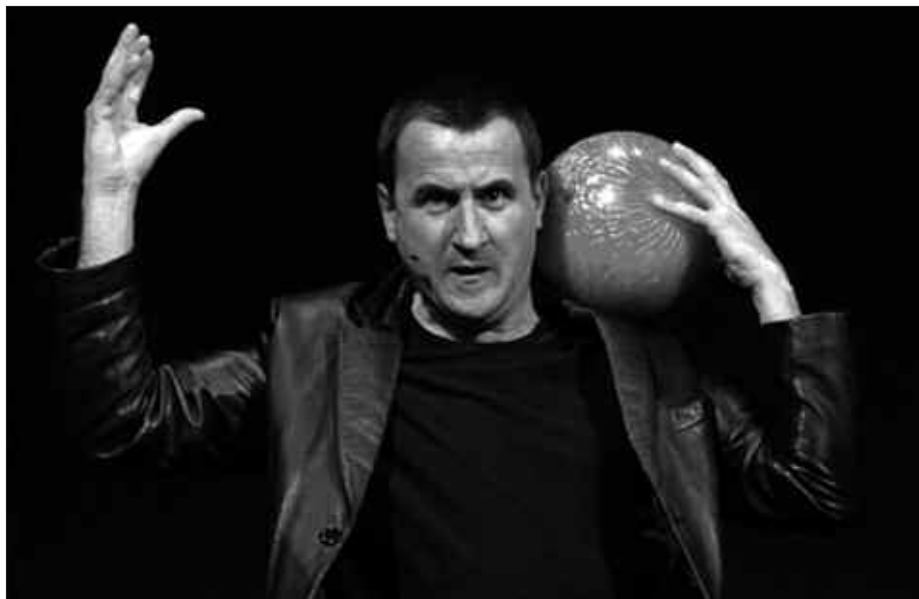
ADIN TARTE GUZTIENTZAKO EMANALDIAK ESKAINI ARREN, MAGIA HELDUEK SORTU ETA HELDUENTZAKO DELA IRIZTEN DIO TXAN MAGOAK.

Autodidakta izan naiz, ahalik eta koadrilan sagardotegi batera afaltzera joan, magia egiten hasi eta bezero ugari hurbildu ziren artean. Tartean bazen bat esan zidana etxean magia liburua zuela, emango zidala. Liburu dendatan egon ezin zuen liburua izan