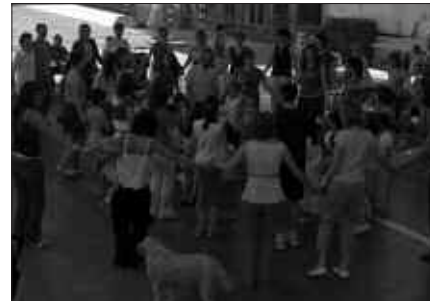
BATZARRA UDARREGI IKASTOLAN EGINGO DA, 18:00ETATIK AURRERA.

Webgunean, udarregi.com helbidean, deialdiaren idatzia ikus daiteke, baita Batzar Orokorreko txostena eta botoen ordezkapena egiteko beharrezkoa den agiria.