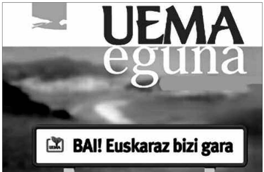
1991N OSATU ZEN UEMA, UDAL EUSKALDUNEN MANKOMUNITATEA. USURBIL 1997AN SARTU ZEN UEMAN.

Herritarren bizitza sozial zein pribatua euskalduntzeko urratsak ematea edota udalerrri euskaldunen garapen sozioekonomikoa eta soziokulturala bultzatzea dira aurrean dituen erronketako batzuk. UEMAtik honela laburbiltzen da aurrera begira dituzten erronkak: “Euskarak, biziko bada erdarek bezala nagusi izango den lur-gunea behar du”. Alde horretatik,