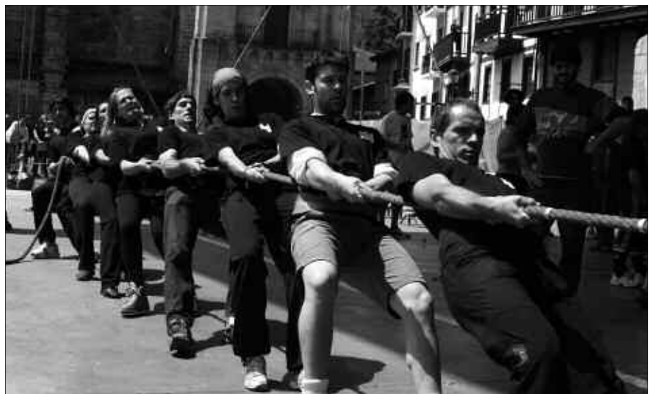
USURBILDARRAK, SOKATIRAN JO ETA FUEGO. BOSGARREN IZAN ZIREN GURE ORDEZKARIAK.

Ekainaren 27ko asteburuan jokatu-ko dira Xiba herri kirol lehiaketaren finalak Idauze Mendin (Zuberoa), Euskal Herria Zuzenean festibalarekin batera.