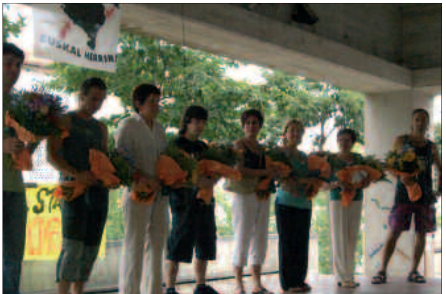
GOIZEAN KALEJIRA EGINGO ETA ARRATSALDEKO 19:30EAN EKITALDI POLITIKOA ASKATASUNA PLAZAN.