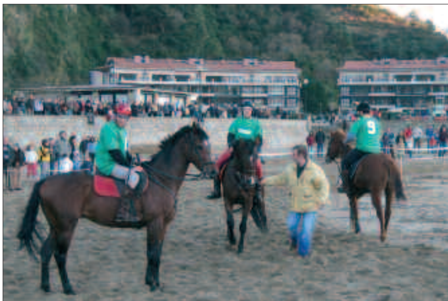
LAUNAKA LEHIATUKO DIRA ETA ONENAK FINALERA SAILKATUKO DIRA.