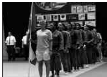
GUTXITAN IZANGO DA TANKERAKO IKUSKIZUNAZ GOZATZEKO AUKERA. ANTOLAKETA ERE, PRIMERAKOA IZAN ZEN.