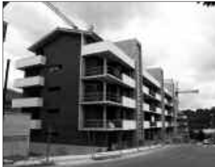
ASTE HONETAN KONPONDU NAHI DA SEKAÑOAKO ETXEEN ARAZOA.

Birpartzelazio proiektuak eta Iberdrolaren subestazioak Udalak nahi