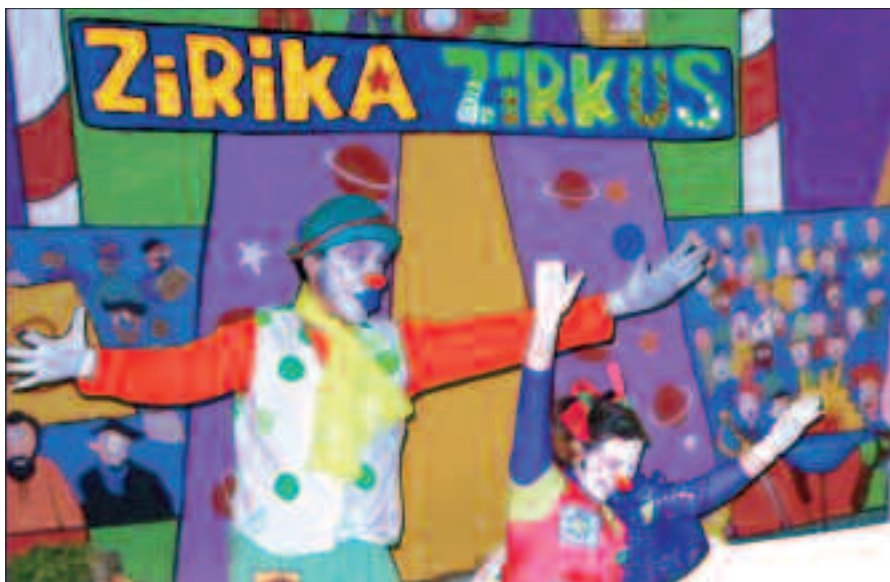
17.00ETAN FRONTOIAN IZANGO DIRA ZIRIKA ZIRKUS-eko PAILAZOAK.

Txikienek bisita berezi bezain gustukoa izango dute bazkalostean, Zirika Zirkus pailazoena. Txokolate gozoa