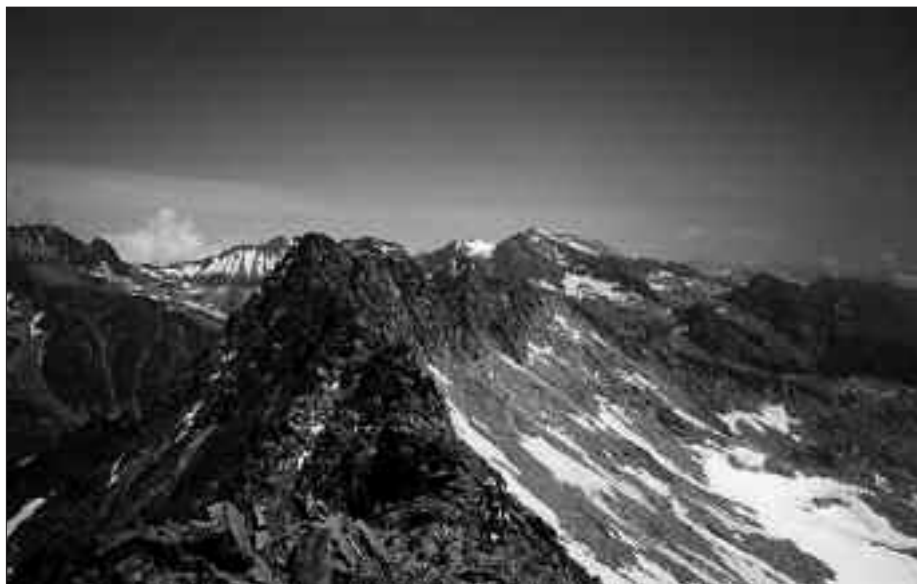
PIRINIOETAN DAGO BARDAMINA, 3.079 METRO GARAIERA DUEN MENDIA. UZTAILAREN 12AN ABIATUKO DA HARA ANDATZA MENDI TALDEA.

Lanean arituko direnentzat hamaiketako izango da, Zubietako Herri Batzarrak eskainia.