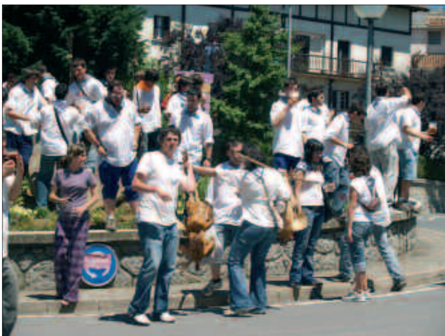
GOIZEKO 6:00ETAN TXOKOLATE JANA HASIKO DA ETA SEGIDAN ATERAKO DIRA OILASKO BILTZERA. BAZKALOSTEAN HASIKO DIRA JOKOAK.

U surbilen bizirik dirau goizean goizetik hasten den usadio zaharrak; oilasko biltzearenak alegia. Urtero, gazte asko biltzen ditu etxez etxe igarotzen den irteerak. Eguna libre duten askok ez dute hutsik egiten, baina badira egun horretarako espreski lantokian jai eskatzen dutenak ere. Batzuek zein besteek, uztailaren 4an esnatzeko iratzargailua oso goiz jarri beharko dute. 6:00etan txokolate jana egingo dute eta ondoren, irten-go da herriko txoko ezberdinetatik igaroko den oilasko biltzaile taldea. Hainbat etxeetako ateak jo, kantatu eta dantzatu ondoren, bazkaltzerako itzuliko dira berriz ere kaxkora. Indartu eta gero, jokoetan ondo pasatzera. Oilasko biltzen aterako direnek hala amaituko dute goizeko ordu txikietan hasitako jai eguna. Ez ahaztu alkandora zuria, ezta lepora-zapia ere.