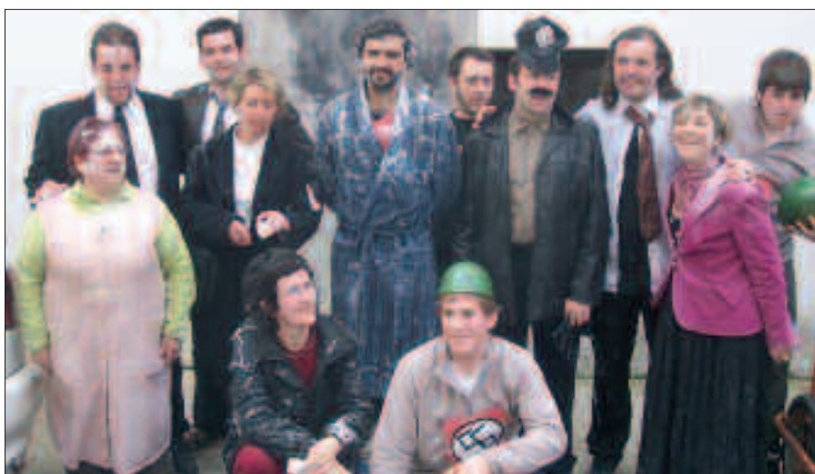
KALEKO GIROA PIZTEKO SORTU ZEN TXERRIKI ANTZERKI TALDEA.