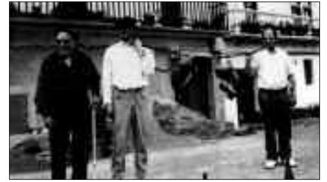
BERRITZA BARRENAKO MUJIKATARRAK, 1996AN NOAUA!RAKO EGINDAKO ERRETRATUAN.

tzera eta beste egun batean afaltzeko aprobetxatzen dira”, Ikerrek esandakoaren arabera. Beraz, jan gabe ez ziren gelditzen ez lehen eta ezta orain ere.