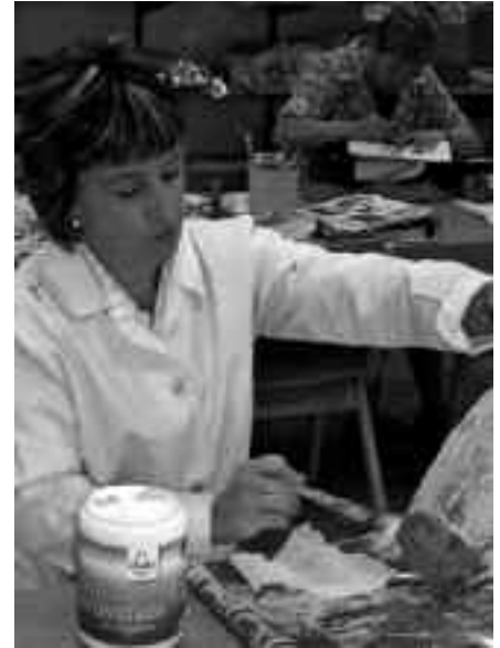
ZIRRIBORRO TAILERRAREN ERAKUSKETA SUTEGIN AURKITUKO DUGU EGUNOTAN.

Margotu beharreko orriaren azpial- dean jartzeko karpeta edo euskarria norberak eramatea gomendatzen da. Eta nahi bada, baita margoak ere. Sariketa egunaren amaieran izango da, baina lanek nahikoa kalitate ez badute, sariak banatu gabe gera daitezke.