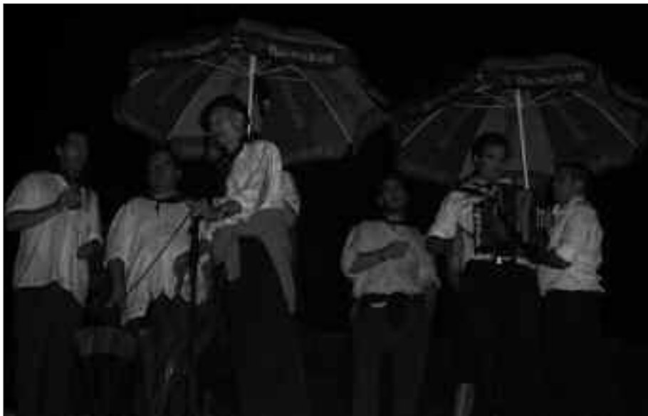
EGURALDIA KASKARRA IZAN ZEN BAINA ESKEAN IBILI ZIRENEK EZ ZUTEN HUTSIK EGIN.