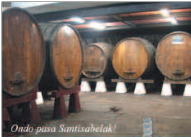
Ondo pasa Santixelak!

Tradiziozko sarraskia santixelak osatzen du.