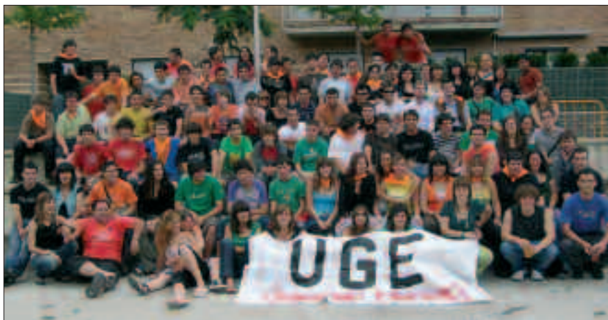
GAZTEEK KUDEATZEN DUTE ARTZABALGO FESTA-GUNEA.

Proiektore batean, aipatu taldeen eta beste askoren abestirik onenen bideoklipak ikusi eta entzun ahal izango dira. Baina musika eskaintza askoz gehiago zabal daiteke. Horregatik, antolatzaileek gau hartan norberak etxean dituen musika talde gogokoen ikus-entzunezkoak edo bideoklipak proiektatzeko aukera eman nahi dute.