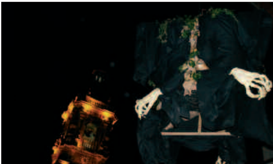
IAZKO MASKOTA HAU IZAN ZEN.

Uztailaren batean igoko dute maskota, 19:00ak aldera, petardoan zaratapean. Jaitsi eta erre, uztailaren 6an gauerdian. Baina mural erraldoia margotzen lagundu nahi duenak, adi; uztailaren 1ean du hitzordua, 14:00etan frontoian.