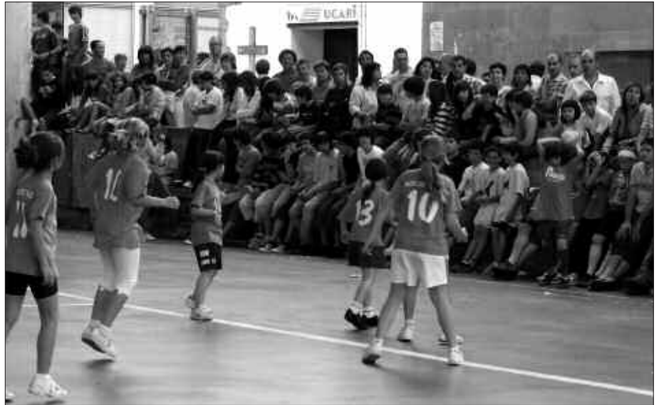
PASA DEN IGANDEAN JOKATU ZIREN FINALAK.

Azken asteotan, futbolean indarrak neurtu dituzte herriko gaztetxo taldeek. Bakoitzak bere bidea egin ostean, helmuga pasa den igandean finkatua zuten. Herritar askoren arreta bereganatu zuten final saioak jokatu ziren frontoian. Eta amaieran, sari banaketa. Denak ere pozik, ederki merezita jasotako koparekin. Datorren urteko txapelketarako jada gutxiago geratzen da. Ordura arte, hona hemen aurrengo finalak utzitako irudiak.