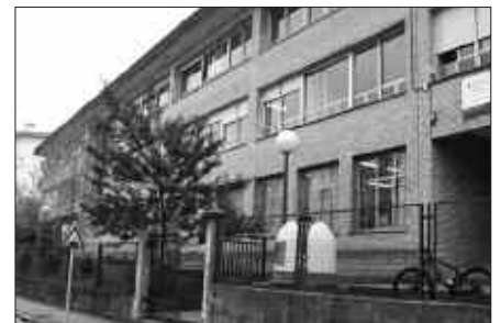
UZTAILAREN 4AN AMAITUKO DA MATRIKULAZIO GARAIA.

E kainaren 26an hasi eta uztailearen 4an amaituko da Lasarte-Usurbil institutuan matrikulatzeko garaia. Dena den, ekainaren 30ean itxita egongo da institutua. Matrikulazioa osatzeko, ikastetxeko idazkaritzan matrikula orria jaso behar da eta eskatzen duten dokumentazioarekin batera entregatu behar da.