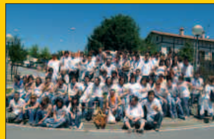
Oilasko biltzaileen txanda