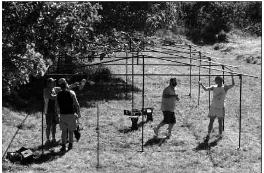
HERRITAR TALDE BAT PEÑALOSCINTOSEN IZAN ZEN AURREKO ASTEBURUAN ETA KANPALDIA PREST UTZI ZUTEN.

Hainbat jolas eta ekintzekin primeran pasatzeko aukera izango dute. Aipatzekoak dira, horien artean, lakura egingo dituzten irteerak edota Errioxako aipatu herrian egon ahal izateagatik Peñaloscintoseko herritarrekin egingo duten eskerrak emateko