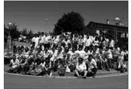
15 EUROTAN JARRI DITUZTE BAZKARIRAKO TXARTELAK SALGAI.

Oilasko biltzaileen bazkarirako txartelak jada salgai dira: 15 eurotan, Irrati eta Ardi Beltz tabernetan. Txartelak ezingo dira egunean bertan eskuratu. Aldez aurretik hartu beharko da txartela. Bazkarian parte