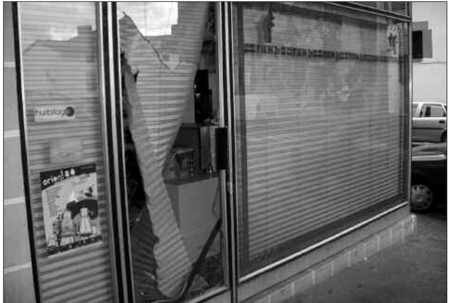
ATEKO KRISTALA APURTU ETA GERO LAPURTU ZUTEN ARGILANEN.

Bi egun beranduago, gizonetako bat atxilotu zuten Urbilen, 34 urtekoa eta Kantabriako bizilaguna. Identifikatu ondoren, atxilotu eta poliziaren egoitzara eramán zuten, ustez zenbait kirol jantzi lapurtzen saiatzeagatik.