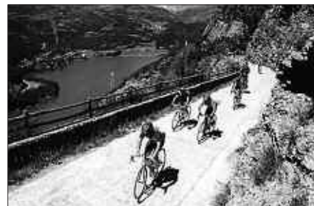
205 KILOMETRO EGIN ETA MENDATE ZAILAK IGO BEHAR DIRA.

Ia 20 urte bete ditu Quebrantahuesos zikloturista lasterketak, eta urtea joan eta urtea etorri, gero eta parte-hartzaile eta ikusle gehiago biltzen ditu. Antolatzaileen webgunean, usurbildar hauen denborak topatu ditugu. Akaso izango zen besterik.