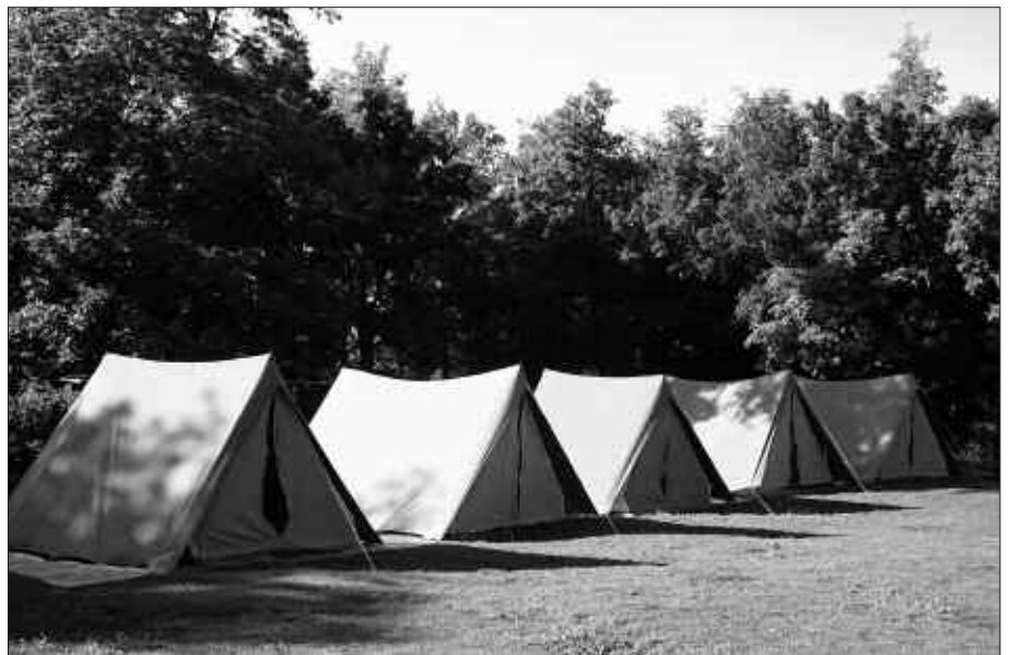
PARAJE EDERREAN PASAKO DUTE UDALEKUA ZIORTZAREKIN BATERA BIDAIA TUKO DUTEN GAZTEEK.

afaria. Pare bat egunetarako irteerak ere egingo dituzte.