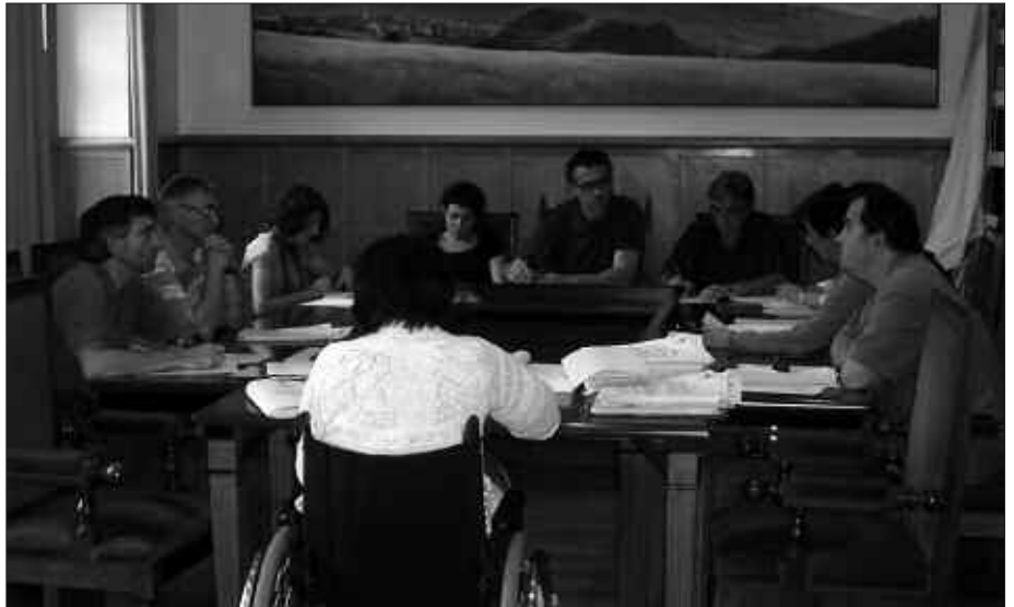
EKAINAREN 24AN EGINDAKO UDALBATZA PLENOKO IRUDIA.

Gogoratu, araudiak dioenez, hilerri berri lurperatzeko aukera izango dute, jatorriz Usurbilgoak direnek, gutxienez hamabost urtez herrian erroldatuta egon direnek edota hiltzeko unean herrian erroldaturik daudenak.