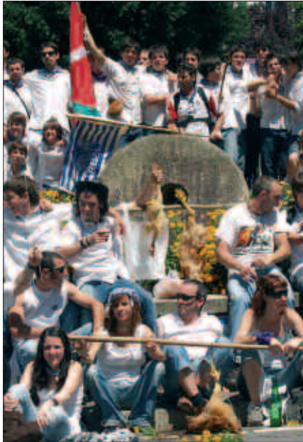
UZTAILAREN 4AN AURPEGIA GORRITUA ZUENAK OILASKO BILTZERA ATERA ZEN SINTOMA GARBIA ZUEN. PRIMERAN PASA ZUTEN.

Parrandarekin jarraitzeko prest zegoena, etxera joan, arropaz aldatu eta jaietz gozatzen jarraitu zuen.