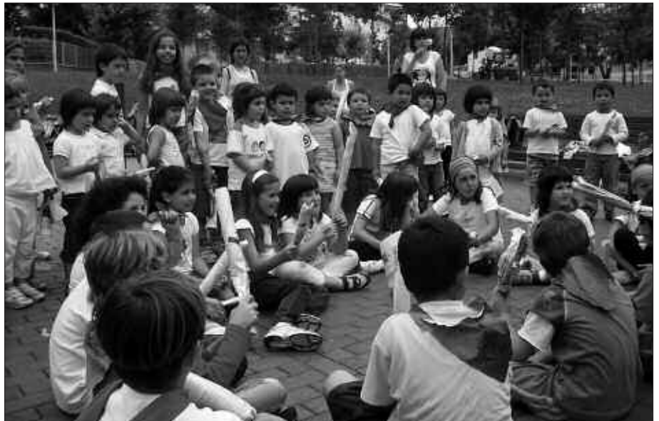
UZTAILAREN 7AN, "ENTZIERROAN" IBILI ZIREN UDAJOLASEKO GAZTETXOAK ETA BEGIRALEAK.

Herriko jaiak eta San Fermin eguna igaro ostean, ondo pasatzeko asmoak aurrera jarraituko du datozen asteetan. Herrian egingo dituzten ekintzak kanpora burututako irteerekin tartekatuko