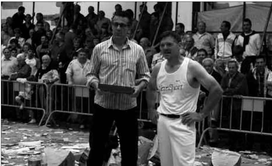
ALKATEAREN ESKUTIK OROIGARRI BAT JASO ZUEN PEÑAGARIKANOK.

igandean, Aizkolarien 2. Mailako Euskadiko finalurrekoaren saioa amaitu berrian, erakustaldi ederra eman zuen. Oraindik sasoi onean dagoen seinale. Agurreko saioa irabazi eta gero, oroigarri bat jaso zuen alkatearen eskutik. Eta bertaratutakoekin txalo zaparrada.