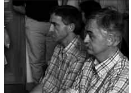
ARALARREKO BI ZINEGOTZIAK, KARGUA HARTU ZUTEN EGUNEAN.