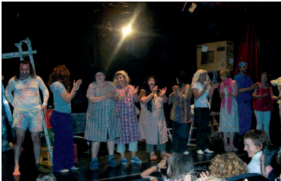
EGURALDI TXARRAGATIK, TXERRIKI ANTZERKI TALDEKOEK SUTEGIN SAID BIKOITZA ESKAINI ZUTEN, ETA BITAN BETE ZUTEN ARETOA.

Haien ateraldiek barre ugari eragin zuten, ikus-entzuleengan eta une batzuetan baita aktoreengan ere. Oinarrizko dekoratu batetik abiatuta, aktoreen lan bikainak azalerazi zuen nolakoa den “Etxe-Berri”. Eta zer modutakoa baita, Txerriki antzerki taldea bera ere. Ikus-entzuleak oso