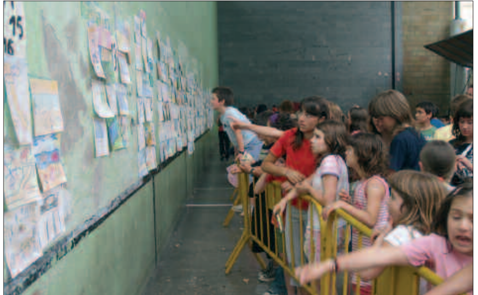
PARTEHARTZE ZABALA IZAN DU AURTENGO PINTURA LEHIAKETAK. GUZTIRA HERRIKO 2-16 URTE ARTEKO 400 GAZTETXO ARITU ZIREN, HERRIAN FALTAN BOTATZEN DUTENA MARRAZTEN.