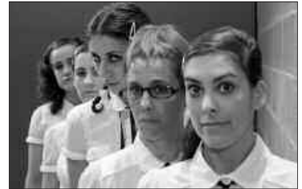
20:00ETAN HASIKO DA TRASTORNOS SAIDA, SARRERA 3 EURO.