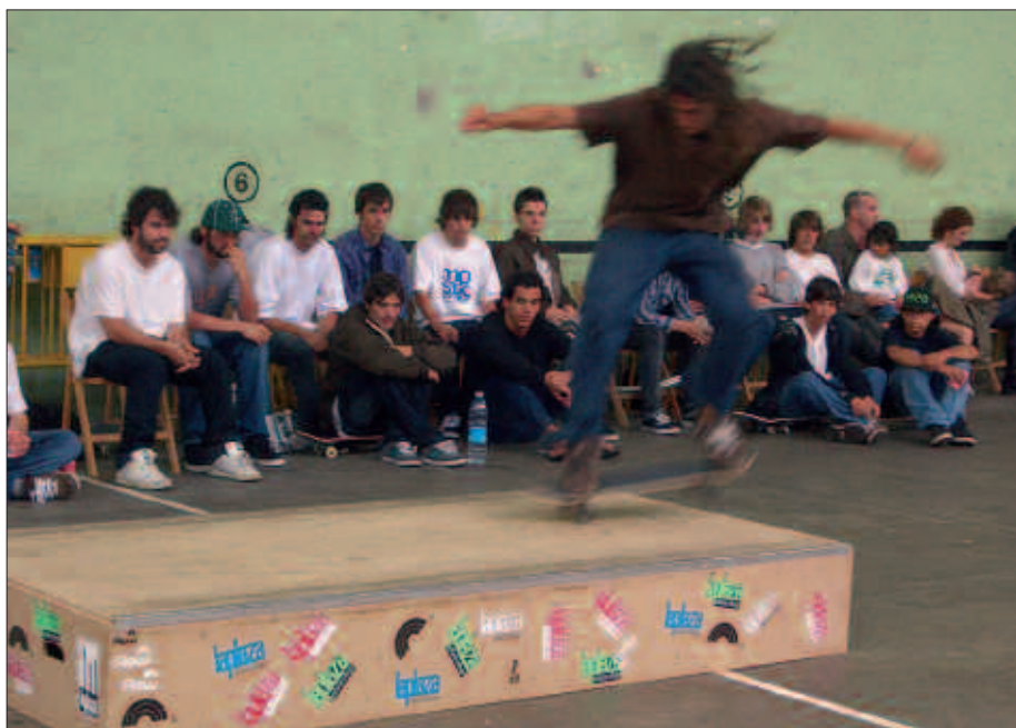
SKATE ETA ANTZEKO KIROLEK JARRAITZAILE ASKO DITUZTE. LARUNBATEAN JENDE ASKO BILDU ZEN FRONTOIAN.

Jai Batzordeak aditzera eman duenez, "garrantzitsua iruditzen zaigu jaien balorazioa egitea ondo egindakoak mantendu eta hobetu beharrekoak bideratzeko". Urtean zehar Jai Batzordean izan diren herritar eta taldeen artean ebaluazio-orria banatu dute. Orri hori uztailearen 14an aurkeztu beharko dute, arratsaldeko 19:00etan Sutegiko erakusketa aretoan egingo den bileran. Aipatzekoa da bilera hau irekia dela, Jai Batzordeko kideez gain herritar guztiak ere gonbidatuta daudela.