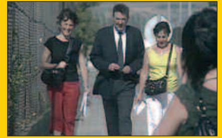
Etxean dira Bruño ahizpak

Datorren urteko jaietarako gutxiago falta da