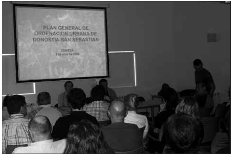
ZUBIETAKO FRONTOI ATZEKO LOKALEAN BURUTU ZEN AURKEZPENAK INTERES HANDIA PIZTU ZUEN.

Herritarrak haserre eta kexu ziren, gero, galderen tartean, behar besteko erantzunak ez zituztelako jasotzen. Kexu, Plan Orokorrean irudikatzen den Zubieta nahi ez dutelako. Bertan kokatu nahi dituzten makroartzela edota erraustegiaren aurkako aldarrikapen guñe bihurtu zen ekitaldia.