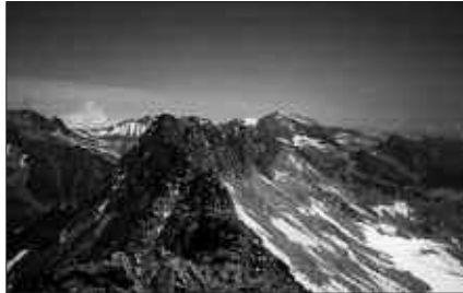
LARUNBAT HONETAN, GOIZEKO 6:00ETAN ABIATUKO DA KIROLDEGI AURRETIK MENDI MARTXA.

aterpean bertan egingo dituzte. Norberak lotarako zakua eta bi egunetarako bazkaria eraman beharko ditu.