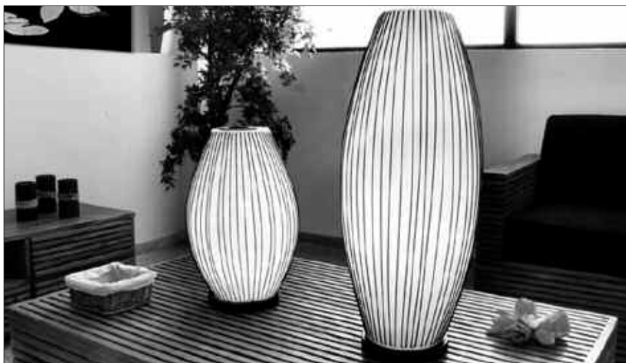
ARGIAREN PREZIOA %8,9 IGO DA AURTEN.

Tarifa soziala. Kontratututako potentzia doakoa izango da eta kontsumitzen dutenagatik soilik ordain-