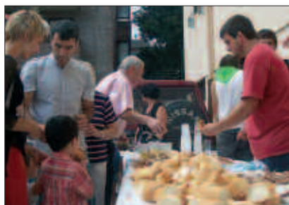
USAIN EDERRA ETA ZAPORE HOBEAGOKO HAMAIKETAKOA.

A ntzerki emanaldia ikusi ostean, Alkorta Autozerbitzuak en eskutik prestatutako txorizo eta haragi egosia dastatzeko ilara luzea zegoen. Arratsaldean ere irudi bera errepikatu zen, piper dastaketan ere. Sabela ederki zaintzen dugu.