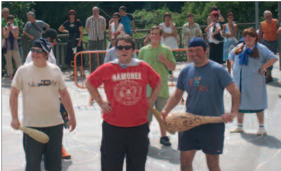
TXERRIKI ANTZERKI TALDEKOEK EMANALDI BERRIA ESKAINI ZUTEN ATXEGALDEKO JAIETAKO AZKEN EGUNEAN.

Adin tarte desberdinetako aktoreak izan arren, denok omen dugu barruan haur izaerari dagokion nortasunaren zati bat, eta antzerki emanaldirako primeran irudikatu zituzten euren paperak. Barre algarak, negarrak... denetik izan zuten emanaldiak iraun zuen artean.