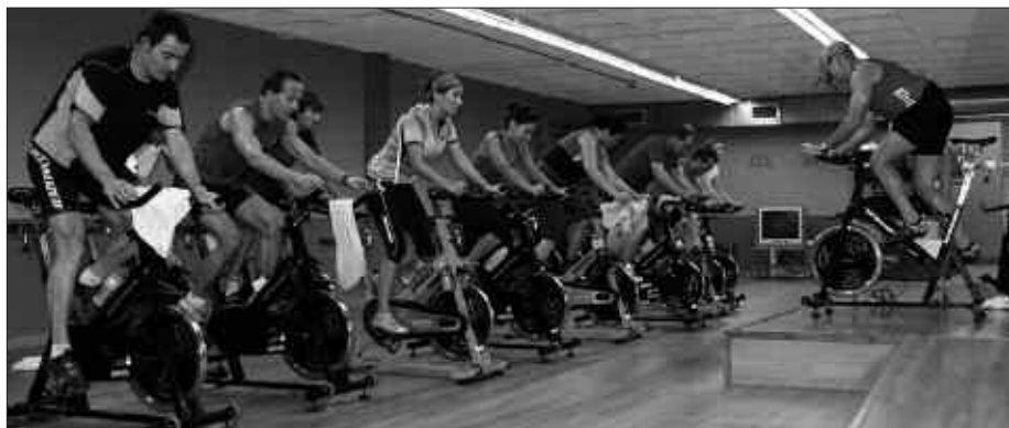
SPINNING, PILATES, AEROBIK... AUKERA ZABALA IZANGO DA AURTEN ERE.

Astelehenetik ostiralera: 7:00-22:00 (igerilekua 21:00ak arte).