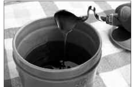
IKASTAROA IRAILAREN 5EAN IZANGO DA, 17:00ETATIK AURRERA SUTEGIN.

Gipuzkoako Erlezain Elkartearen eskutik, erlezaintzako elikagaien ekoizpenerako beharrezkoa den txartela eskuratu ahal izango da ostiral honetan, irailak 5. Horretarako, 17:00etik aurrera Sutegin, elikagaien higienerari eta segurtasunari buruzko informazioa jasoko dute ikastarora bertaratzen diren herritarrek. Amaieran egingo zaaien azterketa txiki batekin, eskuratu ahal izango dute aipatu txartela. Horretarako, saiora bertara, nortasun agiriaren kopia eraman behar da. Baita norbere argazki txiki bat, atzean izen abizenak idatzita dituela. Ikastarorako aldeztatik matriku-