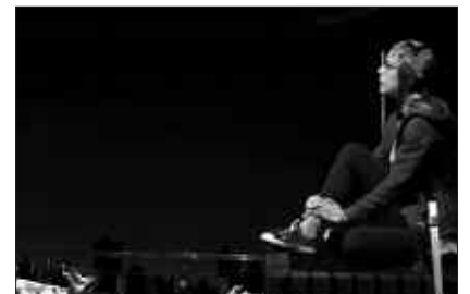
IRAILAREN 28AN IZANGO DA ANTZERKIA.

Zer ezkutatu da teilatuetan? Erantzuna Sutegin topatuko dugu, irailaren 28an egingo den antzerki saioan. 5 urtetik aurrerako gaztetxoek zuzendutako antzerki emanaldia arratsaldeko 17:30ean hasiko da. Udalak eta Kutxak antolatu dute iraileko azken igandeko saioa.