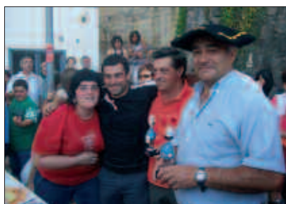
IRUDIAN, PATATA TORTILLA LEHIAKETAKO IRABAZLEAK.

J aietarako prestatu zuten karpaxtura sukalde inprobisatuan bihurtu zen jaietako azken arratsaldean. Parte hartzaile asko, beste hainbeste patata tortilla eder, baina epaimahaiaren erabakia, bakarra izan zen.