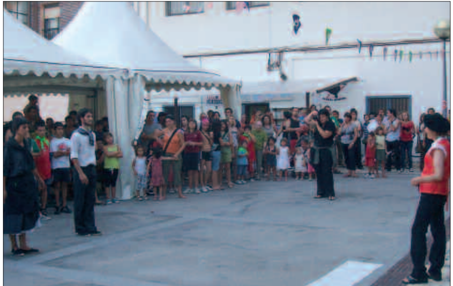
JAI BATZORDEKO BI KIDEK AURRESKUA DANTZATU ZIOTEN OMENDUARI. AMAIERAN, LORE-SORTA EDERRA JASO ZUEN, BERTARATU ZIRENEN TXALDEKIN BATERA. TXUPINAZO JAURTIKETAREKIN, JAIK OFIZIALKI HASI ZIREN.

Omenaldi sentikorrarekin batera jaurtitako txupinazoak eta The Txortains txarangaren doinuek alaitu zituzten jaietako lehen orduak.