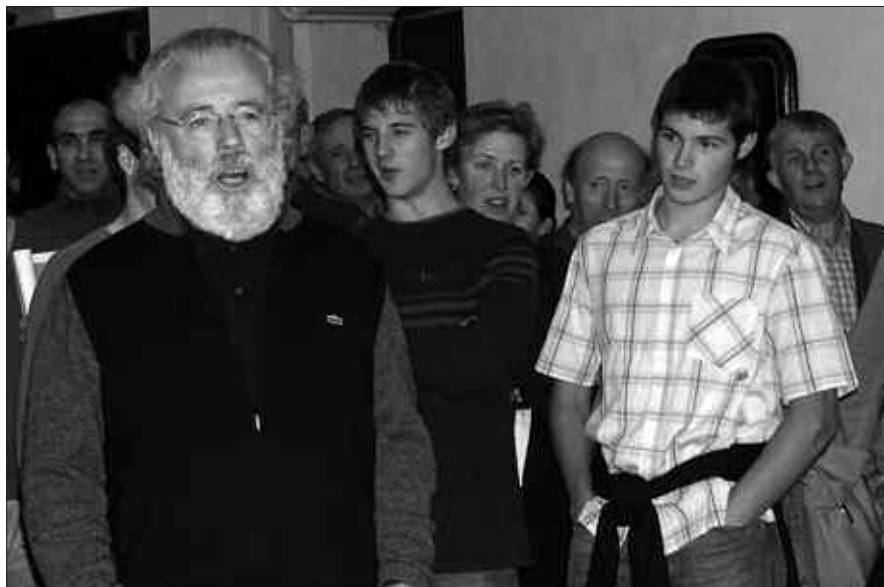
IRAILAREN 26AN EGINGO DA BERTSO-AFARIA OLARRONDO JATETXEAN.

Nafartarrak taldeak antolatu du irailaren 26ko bertso-saioa, baina txartelak erosteko azken eguna irailaren 22a izango da. Olarrondon bertan, Txiribogan, Aginagako Arraten, Zubietako Barazarren, Añorgako Jolas Etxean, Lasarte-Oriako Jalgin eta Orioko Kolon Txikin aurkituko dituzue txartelak salgai, 30 eurotan.