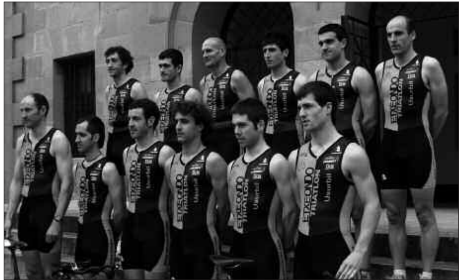
BAXURDE TXIKI TRIATLOI TALDEAK ANTOLATU DU IRAILAREN 21EKO HERRI LASTERKETA. IZEN-EMATEA IREKITA DAGO.

U surbilgo Baxurde Txiki Triatloi Taldeak lehen herri lasterketa antolatu du, datorren irailaren 21erako. Goizeko hamaitan jarri dute hitzordua. Korrikalariak herria zeharkatuko duen 10,5 kilometrotako ibilbidea osatu beharko dute. Izen ematea jada zabalik dago, herrikrosa.com atarian edota 661 258 977 telefono zenbakian. Aldez aurretik 5 eurotan eta egunean bertan 8 eurotan. Parte hartzaileak ez dira esku hutsik etxeratu. Lehen hiru gizon eta emakumeek sari bana jasoko dute, korrikalari guztiak kamisetak. Zozketarik ez da faltako eta antolatzaileek gogorazten dutenez, giro bikaina izango da.