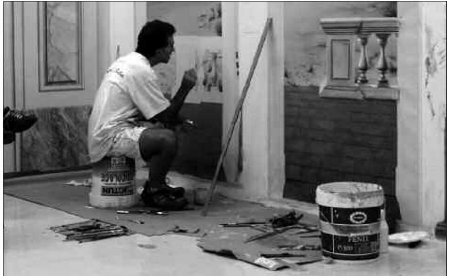
PINTORE IKASTAROA AGINAGAKO PINTURA TAILERREAN ESKAINIKO DA. LANGABETUEK BAINA BAITA LANEAN DIRENEK ERE EMAN DEZAKETE IZENA.

Lanbidearekiko motibazioa eduki eta lana lanbide horietan lortu nahi izatea.