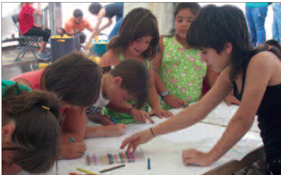
ZORTE HANDIA IZAN DUTE ATXEGALDEN, EGURALDIA ERE LAGUN IZAN BAITUTE ASTEBURU OSOAN. HAUR JOKOETAN ADIBIDEZ.

Eta garrantzitsuena, primeran pasa zutela denek. Antolatzaileen deialdiari kasu eginez, etxetik eramandako bazkaria jai gunean bertan dastatu zuten