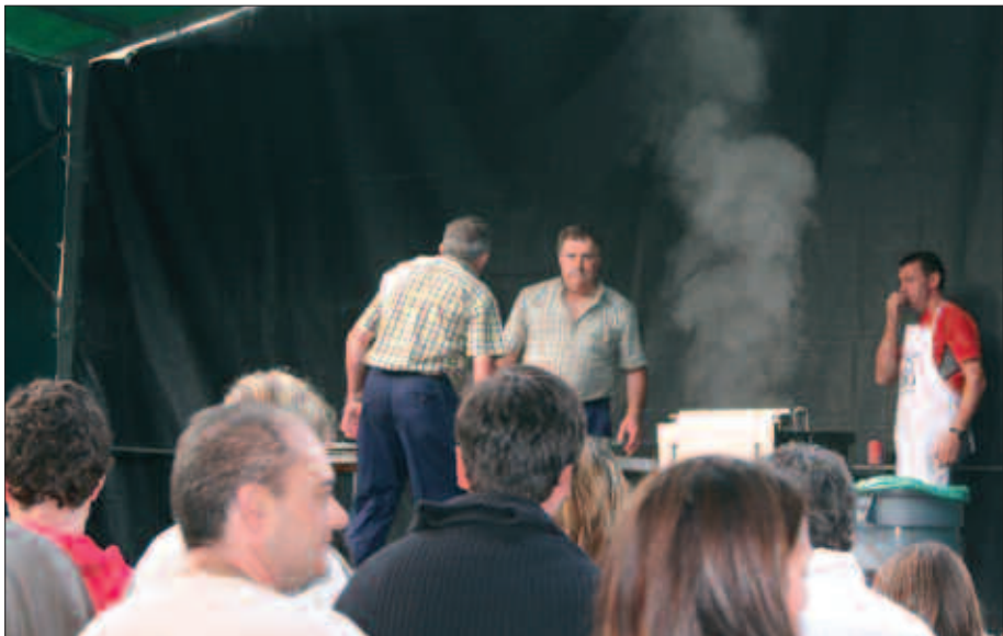
BI ASTE BARRU JAI GIROA NAGUSITUKO DA SANTUENEAN. IRAILAREN 19TIK 21ERA FESTETAN MURGILDUKO DIRA SANTUENeko AUZOKIDEAK.