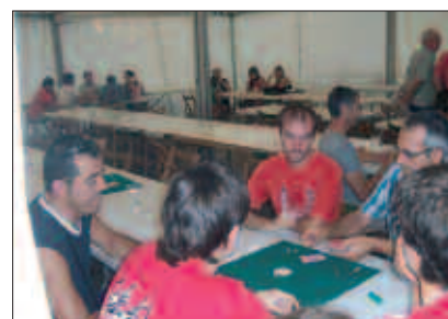
IRUDIAN, MUS JOKALARIAK TXAPELKETAKO AZKEN TXANPAN.

M us txapelketek zaletu ugari bildu ohi dituzte, baita Atxegalden ere. Dezente luzatu da aurtengoan ere, ez baita laburra karta joko honetan izena ematen duten iaio edo jokalaria zaletuen zerrenda.