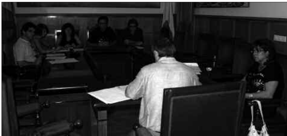
EAE-ANVko LAU ZINEGOTZI, PSE-EEko ZINEGOTZIA ETA ALKATEA BAINO EZ ZIREN BERTARATU ABUZTUAREN 28ko EZOHIKO UDALBATZA PLENOA.

Udal erabakiari jarraituz, uztailaren 14an GAOn argitaratu zen lizitazioaren