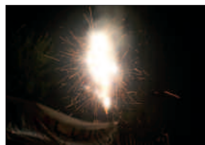
AUZOKO PLAZA ONDOAN ERRE ZITUZTEN AZKEN KARTUTXOAK.

I kusgarria eta entzuteko modukoa izan zen, Udarregi ikastolako plazan, aurtengo jaiak agurtzeko antolatzaileek prestatu zuten azken traka, zezen suzko eta guzti. Lurrean eta airean, kolorea, mugimendua eta argitasuna nagusitu zen.