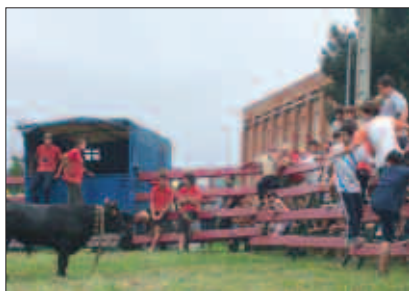
XEXENAK ETA PONIAK EKARRI ZITUZTEN ABUZTUAREN 30EAN.

A rrizabalagarren xexenekin adi-adi ibili behar izan zuten Udarregi ikastola atzeko belardiko itxitura barrura salto egin zuten korrikalariek. Bizi askoak ziren denak. Hala ere, gazte ausartik ez zen falta izan.