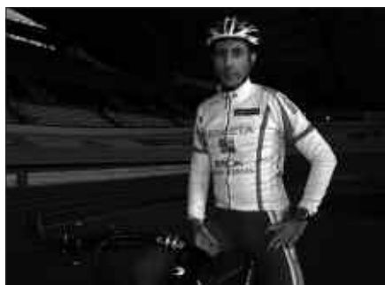
BIGARRIN ALDIZ PARTE HARTUKO DU USURBILDARRAK JOKOTAN.

bada akaso beste urtebetez luzatuko du bere kirol ibilbidea. 2009an Sevillan jokatuko da txirrindularitzako Munduko Txapelketa eta bertako belodromo oso ondo ezagutzen du. Lagunak eta etxeokak gertu izango lituzke bere azken lasterketan. Baina hori, Txinatik bueltan erabakiko du ziurrenik. Orain, jokoetan du burua.