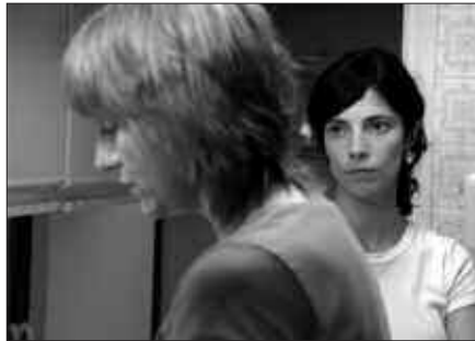
ASTELEHENEAN 18:00ETAN HASIKO DA PELIKULA.

D atorren astelehenean, "Siete mesas de billar francés" pelikula botako dute Sutegin, arratsaldeko 18:00etatik aurrera. Sarrera ez da ordaindu behar, baina Kutxako bulegoan eskuratu behar da alde aurretik. Lan honengatik, Gracia Querejeta zuzendariak gidoi onenaren saria irabazi zuen iazko Donostiako Zinemaldian.