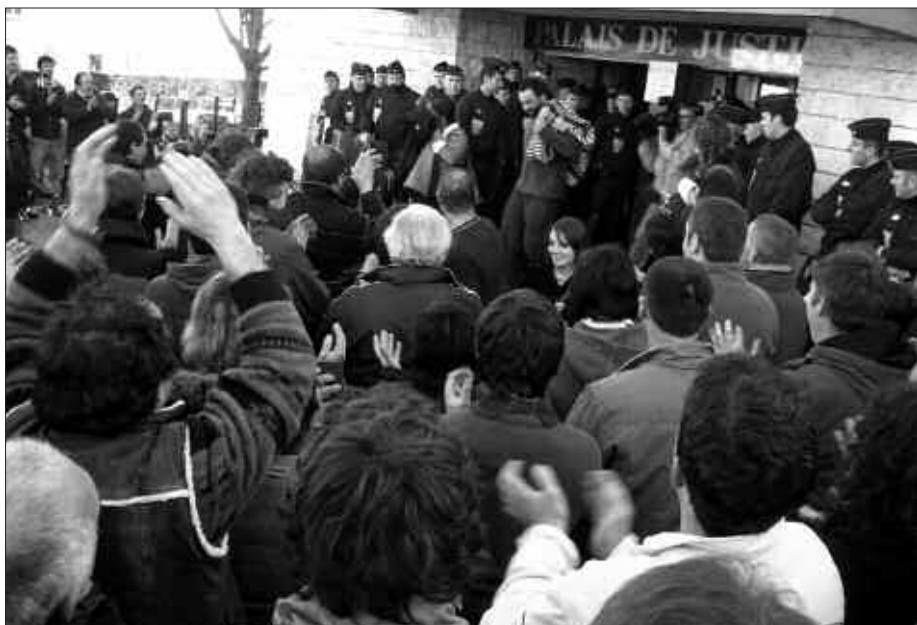
KAKO BASERRIAK ZERESAN HANDIA EMAN ZUEN URTE HASIERAN. HAINBAT LABORARI ATXILOTUAK IZAN ZIREN EUREN LANTOKIA DEFENDATZEKO EGINDAKO EKITALDI BATEAN.

Laborariak, erosketari aurre egiteko, Bizitegia elkartea osatu dute. Hala ere, laguntzaren premian dira. Gauzak horrela, Nazio Eztatbaida Guneak baserriaren erosketan laguntzeko kanpaina jarri du martxan. 1.000 euroko