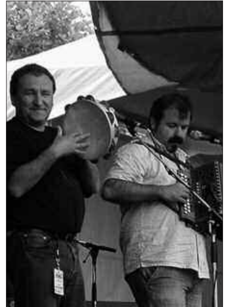
TAPIA TA LETURIAREKIN ARRATSALDEKO ERROMERIA GIROTUKO DUTE.

Igandeko Euskal Jaian partehartzeko gonbita jaso dute dagoeneko zubietarrek. Hala nola, baserritarrez jantzita azaltzeko deia ere egin dute antolatzaileek.