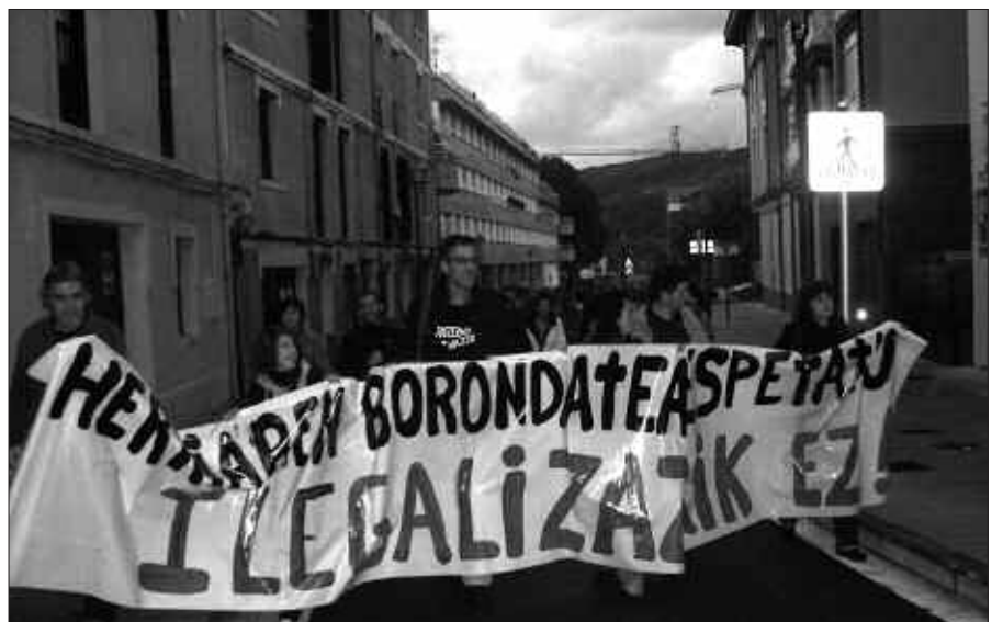
IRUDIAN, BI EGUNEKO ITXIALDIAREN ONDOREN, UDAL GOBERNU TALDEKO ORDEZKARIAK BURU ZITUEN MANIFESTALDIA.

“Herriaren borondatea errespetatu. Ilegalizazioarik ez” zioen udal gobernu taldeko kideak buru zituen mobilizazioko aldarriak. Atzetik segidan zetozen, deialdiari erantzunez, hitzorduarekin bat egin zuten herritarrek.