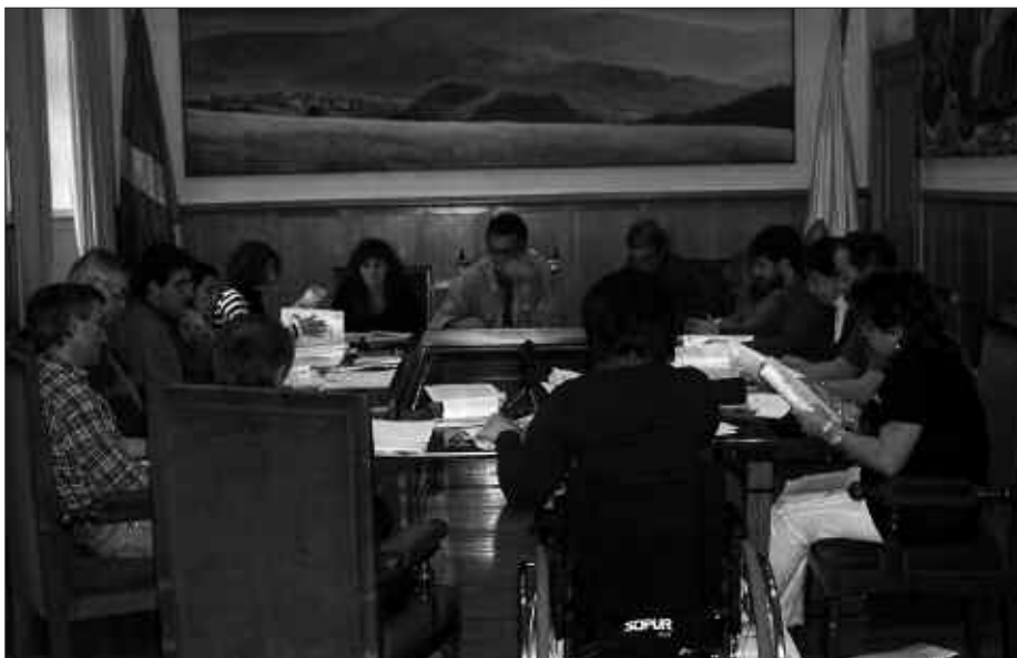
UDAL GOBERNU TALDEAREN PROPOSAMENAK ARALAR, PSE-EE ETA EAJ-PNV TALDEEN BABESA JASO ZUEN.