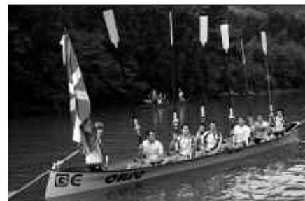
ORIO IZAN ZEN NAGUSI, 5 SEGUNDUKO ALDEAREKIN.