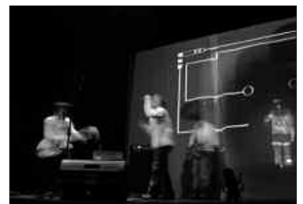
URRIAREN 17AN SUTEGIN, MOKAUA IKUSKIZUNA.

Antolatzailea: Nafartarrak Kultur Elkarteak.