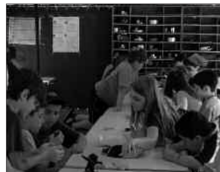
DBH LEHEN MAILAKO IKASLEAK URRIAREN 17AN BILDUKO DIRA ZIORTZAKO GELETAN.

Gainontzeko ikasleak ere laster hasiko dira. Ziortzakoek adierazi dutenez, "pasa den urtean gurekin ibili zinetenoi, gutuna iritsiko zaizue etxera eta bertan azalduko da bakoitzari noiz dagokion saioa".