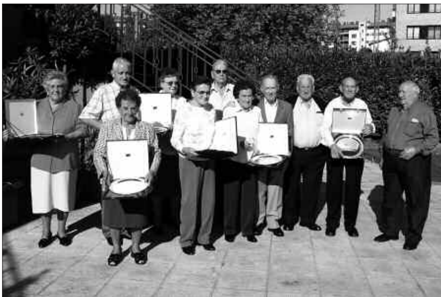
AURTEN 80 URTE BETE DITUZTENAK, OPARIAK ESQUETAN.

Gure Pakea elkarteak kideek eskerrak eman nahi dizkiote Usurbilgo Udalari, Kutxari eta Euskadiko Kutxari, eskainitako laguntzarengatik.