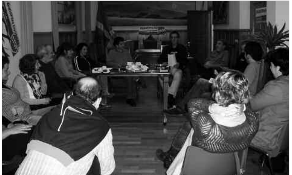
URRIAREN 2AN ETA 3AN ITXIALDIA EGIN ZUTEN UDALETXEAN, KALERATU DIREN ILEGALIZAZIO EPAIEI ERANTZUTEKO. HAUSNARKETA POLITIKORAKO TARTEA HARTU ZUTEN UDALBATZA ARETOAN BILDUTAKO UDAL ORDEZKARI, ERAGILE ETA HERRITARREK.

Usurbilgo udal gobernu taldetik, “estatu proiektua zalantzan jartzen duen oro kriminalizatzen dela aipatzen da, kezka, zalantza eta beldurra eraginez udal ordezkariet”. Baina gogorarazten denez, udal gobernu