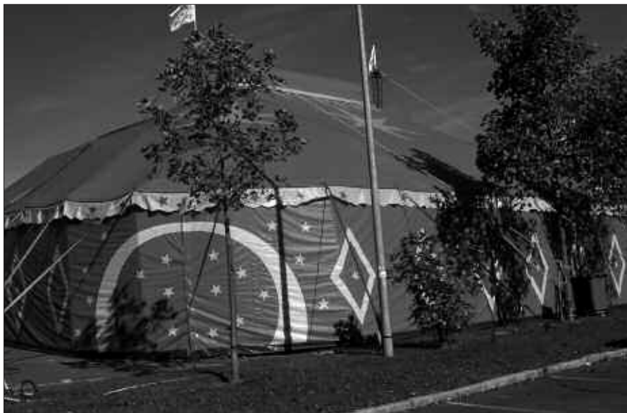
AURREKO ASTEBURUAN IZAN ZIREN GURE ARTEAN CIRQUE FISCHER-EKOAK.

Aipatzekoa, azpiegitura guztia prestatzeko erakutsi duten azkartasuna. Herri guneko hainbat farolatan zirkoa izango zela iragartzen zuten kartelak egun batzuk lehenagotik jarrita izan arren, emanaldi bezperan, oraindik, zirkoko langileen arrastorik ez zegoen.