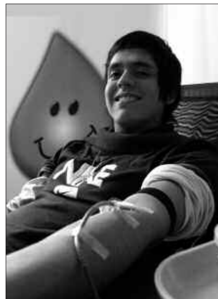
19:00ETATIK 21:00ETARA IZANGO DA ODOLA EMATEKO GARAIA.

Informazio gehiago e-posta honetan: odolausurbil@begira.com