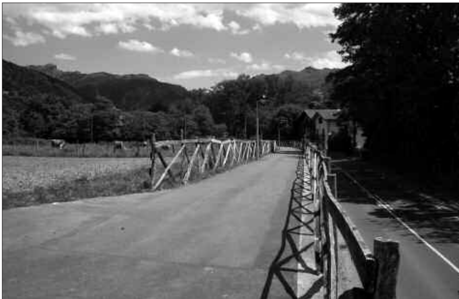
OIARTZUN ALDEKO ARDITURRIKO PASEDA DA "GIPUZKOAN ZEHAR" LIBURUAN JASO DEN IBILBIDEETAKO BAT.

Bidasoa, Oiartzun eta Urumea inguruetan egindakoak jasotzen dira bildumako lehenengo liburuxkan; Oriagoierri eta Oriabarrenakoak bigarrenen; hirugarrenean, Ori-Tolosaldeko paseoak; Urolagoiena, Urolabarrena eta Kostaldekoak laugarrenean, eta Debagoiena eta Debabarrenakoak bosgarren eta azken liburuxkan.