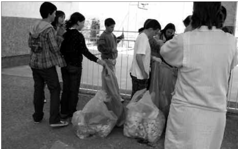
ATEZ ATEKO BILKETA SISTEMA EKONOMIKOKI BIDERAGARRIA IZANGO DELA AURREIKUSTEN DUTE HAREN ALDEKO ERAGILEEK.

Orain arte, zabor biltzaileek egiten zuten ibilbidean kontainerrak zeuden lekuetan gelditzen ziren soilik. Atez ateko sistema berriarekin, ordea, ibilbideko geltokiak gehitu egingo dira, langileek etxe atari bakoitzeko hondakinak bildu beharko baitituzte.