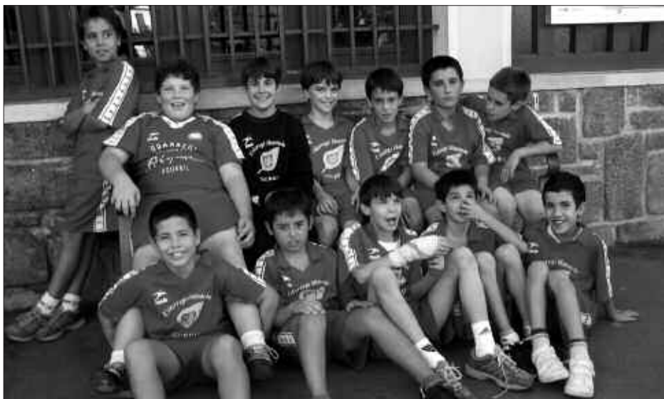
ANDOAINEN IRABAZI ETA GERO, POZIK ZEUDEN UDARREGIKO JOKALARIAK.

Ondo hasi dute denboraldia iru- dian ageri diren eskubaloi jokalariek. Ea datozen asteetan ere horrela jarraitzen duten. Ondo pasatzea da kontua eta argazkiari erreparatuta behintzat, gustura dabiltzala esan daiteke. Zorionak mutilak!