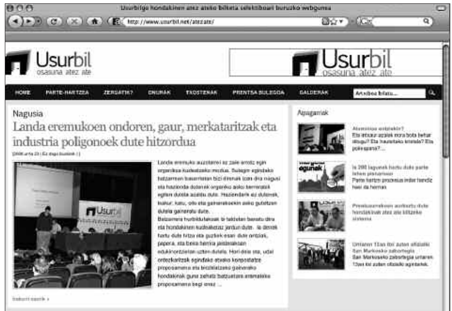
ATEZ ATEKO BILKETA SISTEMARI BURUZKO INFORMAZIOA, ZALANTZAK ARGITZEKO TARTEA, DOKUMENTAZIOA... AURKI DAITEZKE ATARI BERRIAN.

Parte hartze prozesuari lotutako bilera erronda hasi zenetik, herritarrek argitu nahi dituzten zalantza asko dituztela garbi geratu da. Udalak zabaldu duen web orria, maiz