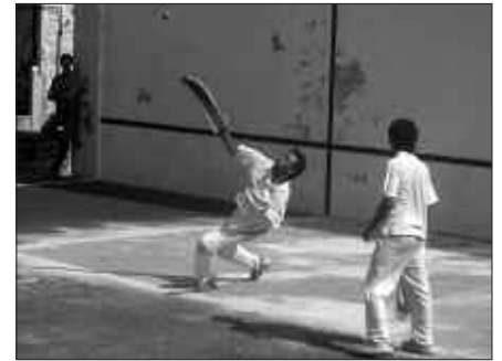
FINALA AZAROAREN 9AN JOKATUKO DA OIARTZUNEN.