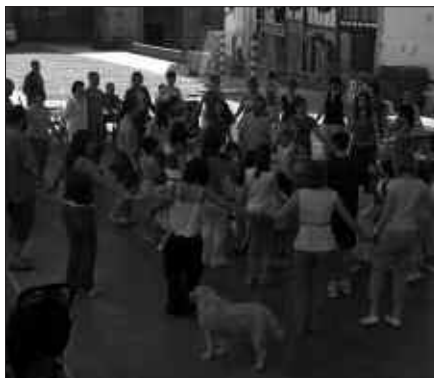
BILERA 19:30EAN HASIKO DA, BEHEKO IKASTOLAN.

Udarregi ikastolako webgunean ipini duten oharrean, parte hartzera animatu nahi dituzte gurasoak.