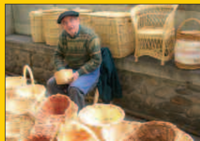
Larunbat honetan, XIII. Artisau Azoka