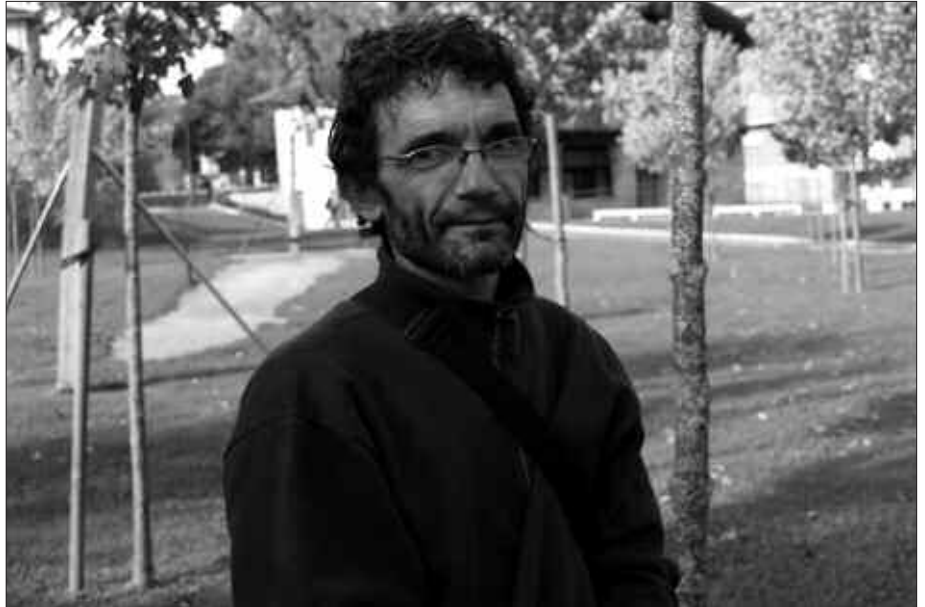
EBAKUNTZA EGIN ZIOTEN ETA MEDIKUAK OINEZ IBILTZEKO AHOLKATU. HORI IZAN ZEN LIBURUAREN ABIAPUNTUA. LIBURUAN JASO DITUEN PASEO ASKO BI MAKULUEKIN EGIN BEHAR IZAN ZITUEN.

P. J. A. Oinez ibiltzea beti gustuko izan dut. Hirian, mendian ibiltzea bezala ez da, baina azken finean, ahal duzun lekura moldatzen zara; une hartan, makulu bidez leku lauetara. Ezin geldirik egon, zerbait egin beharra nuen. Ibilbideak bilatzen hasi nintzen, hasieran hurbilean. Baina gero, egunean