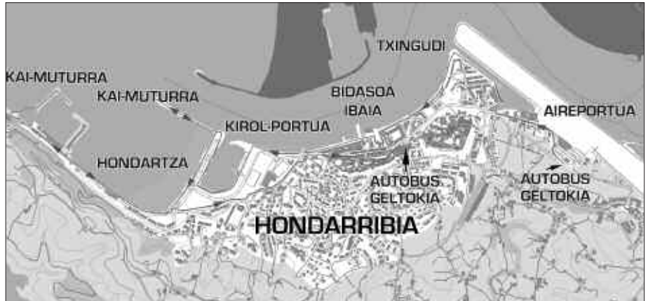
IBILBIDE BAKOITZAREKIN FITXA MODUKOA OSATU DA BERE ARGAZKI, MAPA ETA PRAKTIKOA IZAN DAITEKEEN INFORMAZIOAREKIN.

P. J. A. Biltzen dira baita tren ordu-tegiak ere. EuskoTren eta Renfe tren sareak ardatz hartuta, ingurune desberdinetara ailegatu nintzen. Beste lekuetara iristeko, trenaz gain ere autobusa hartu beharra dago. Lagun