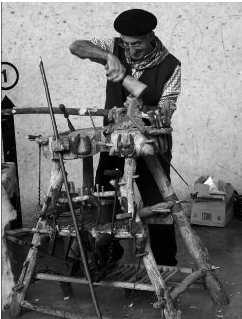
LARUNBATEAN, GOIZEKO 11:00ETAN ZABALDUKO DA AZOKA.

Janaria aipatu edota usaintze hutsarekin, asko gosetuta izango dira. Antolatzaileek sabela betetzeko tarte erreserbatu dute pilotalekuan. Txorizo eta talo ederrak dastatzeko aukera izango baita.