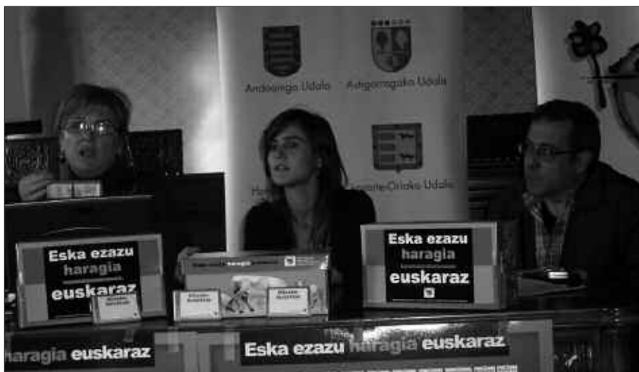
ASTELEHENEAN EGIN ZEN KANPAINAREN AURKEZPENA. IRUDIAN, HERNANI ETA LASARTE-ORIAKO UDAL ORDEZKARIAK.

Saltoki parte hartzaileetako batera sartuta, begietara segituan jotzen duen paisaia linguistikoa euskaldunduta ageriko zaigu datozen asteotan. Harategietan aurkitu eta ohikotasunez erosi ahal ditza-kegun produktuen euskal izenak biltzen dituen kartelak esekiko dituzte. Guztira 80 bat banatuko dira Buruntzalde osoan. Baita txartelak ere. Euskarri horiek guztiek, Buruntzaldeko kanpainan murgildu diren saltokiak zeintzuk diren identifikatzen lagunduko digute.