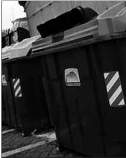
GAIKAKO BILKETA ONDO EGITEKO, BEHARREZKOA DA HONDAKIN ZATIAK ELKARREN ARTEAN EZ NAHASTEA.

Horregatik diotenez, “atez atekoak ontzien sistemak baino emaitza hobek ematen ditu”. Herritarrak