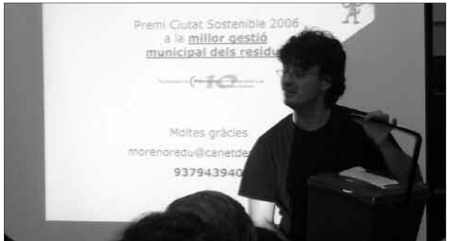
HERRIALDE KATALANETAN EGITEN DA ATEZ ATEKO BILKETA, HAINBAT HERRITAN.

Hizlari lanetan aritu diren udal ordezkari edota teknikariak guztiak erantzuten saiatu dira. Udalak gai honi buruz zabaldu duen atari berrian ere, maiz errepikatu ohi diren zalantzak argitzen dira; www.usurbil.net/atezate web orrialdean hain zuzen. Hona hemen, bigarren bilera erronda hasi