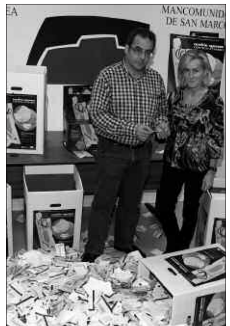
IRUDIAN, SAN MARKOS-EKO LEHENDAKARIA ETA SARIAREN IRABAZLEA.