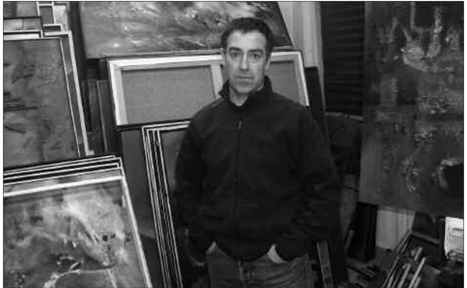
OSTEGUNETIK IKUSGAI DIRA BERE LANAK BARRENKALEKO UDAL LOKALEAN.