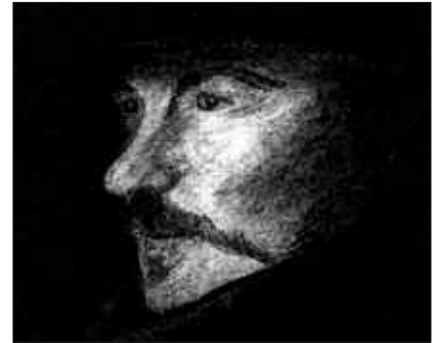
MAITASUN ISTORIO BATEAN DINARRITZEN DA CYRANO IKUSKIZUNA.

"Cyrano" maitasun istorio bat da. Ezinezko maitasun istorioa. Itsusi eta sentibera, eder eta ergel... Istorio poetikoa, askatasun aldarrian bilaka- tu dena. Zinean maiz antzeztu dena. Igande honetan, ordea, ez da Gerard Depardieu aktorea Sutegin taularatuko dena.