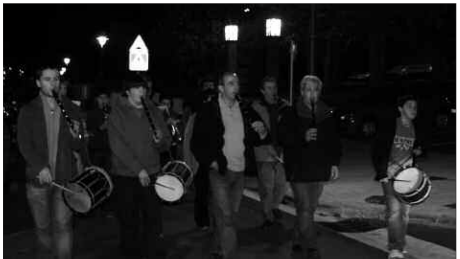
EUSKAL HERRIKO MUSIKA ESKOLEN ELKARTEKO KIDEEK AZAROAREN 20AN OSPATUKO DUTE SANTA ZEZILI EGUNA, TARTEAN, ZUMARTE MUSIKA ESKOLAK.

M usikarien eguna Santa Zezili Megunean ospatu ohi da, azaroa- ren 22an. Zumarte Musika Eskolak, ordea, bi egun aurreratu ditu ospakizu- nak. Azaroaren 20an osteguna, kalejira bat egingo dute Zumarteko partaideek. Arratsaldeko 18:00etan abiatuko dira eskolatik haizezko instrumentu taldea eta trikitixa taldea. Kalejira hori Sutegira iri- tsiko da 19:00etan. Ordu horretan, Musika Eskolako talde ezberdinak kon- zertua eskainiko dute Sutegiko eskenato- kian bertan.