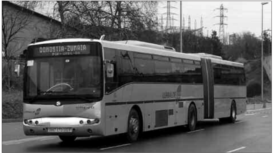
10-25 URTEKO GAZTEENTZAT TXARTEL BEREZIA JARRI DA MARTXAN.

GAZTEAK: 10 eta 25 urte bitarteko gazteentzat. Txartela errekaratzerakoan, sartutakoaren %20 eskuratuko da bonifikaziotan. Hau da, 10 euro sartu, eta %20ko bonifikazioarekin 12 euro errekaratuko zaie.