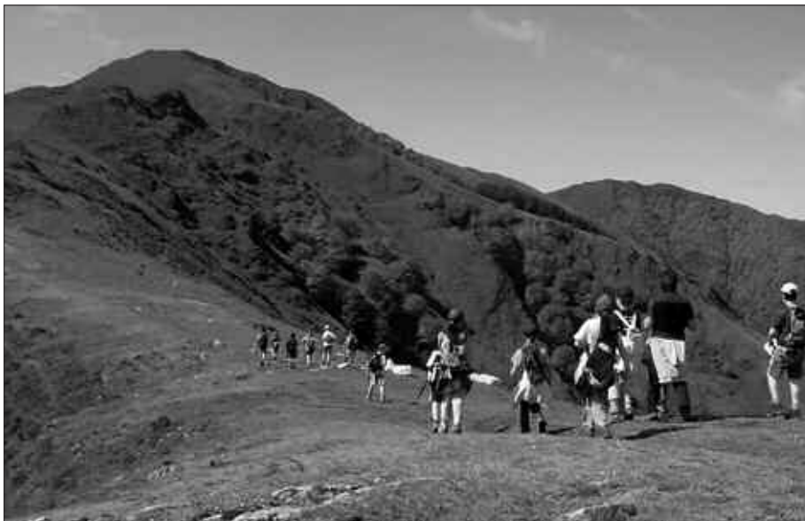
ABENDUAREN 9TIK 14RA MENDI ASTEA ANTOLATUKO DU ANDATZA ELKARTEAK. BESTEAK BESTE, LEHIAKETAN IZAN DIREN LANAK ERAKUTSIKO DITUZTE SUTEGIN.

GOARDIAKO FARMAZIA, GAUEZ Correa Farmazia (22:00-09:00), Perkaiztegi kalea, 8 Hernani Telefono zenbakia: 943 33 60 22 *Usurbilen, soilik eguerdira arte