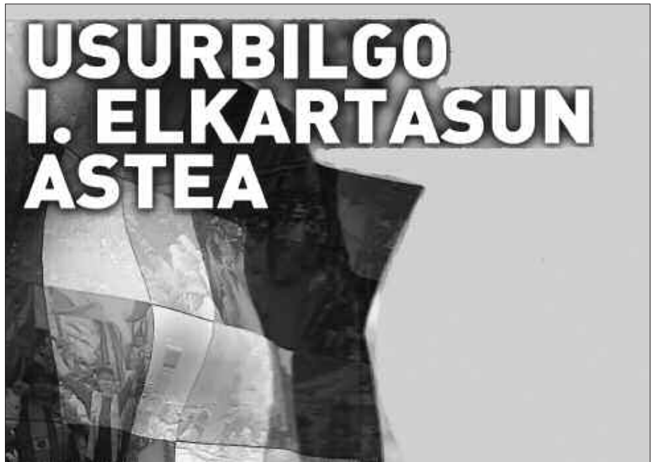
ELKARTASUN ASTEA IRAGARTZEKO OSATU DEN KARTELA.

elkartasun arloekiko interesa duen herritar talde bat osatu da azken hilabeteotan eta egindako lanaren emaitza datorren astean ikusi ahal izango da; Lehen Elkartasun Astea.