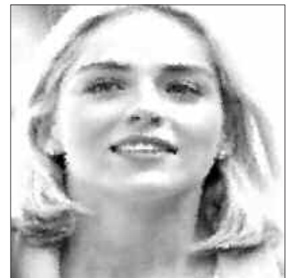
ASTEARTEKO SAIDAK, GENERO INDARKERIAREN AURKAKO EGUNAREKIN BAT EGINGO DU.

Adin guzti-guztietako emakume eta gizon, gizon eta emakumeentzat osatutako obra datorren asteartean eskainiko dute kaxkoan, arratsaldeko 18:00etan.