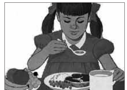
HITZALDIA SUTEGIN EGINGO DA, ARRATSALDEZ.

Sutegin egingo da hitzaldia, azaroaren 27an osteguna, arratsaldeko 17:30ean.