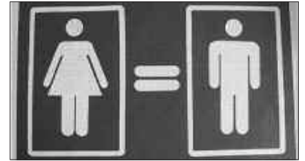
HERRITARREK DIAGNOSTIKOAN PARTE HARTZEKO AUKERA IZANGO DUTE.

U surbilgo Udalak emakume eta gizonen aukera-berdintasunaren inguruan diagnostikoa egitea erabakia du usurbildarren parte-hartzearekin eta horretarako Elhuyar Aholkularitzaren laguntza izango du.