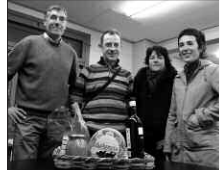
IAZ BEZALA, HAINBAT HERRITARARI DIRA KANPAINA BIDERATZEN.

Bigarren otarrean, 47 euroren truke, haxe aurkituko du erosleak: kilo bateko ardi gazta, ahate gibelarekin egindako pate (200 gramo), txa-