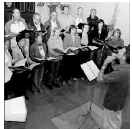
20 BAT ABESLARIK OSATZEN DUTE LEZKARRI ABESBATZA.

Bigarren zatian lau abesti afrikar kantatuko dituzte; horien artean "Nkosi Sikelel'i Afrika" (Jaunak Afrika bedeinkatu dezala), Hego Afrikako ereserkia (Hego Afrikan apartheid arauekin bukatu ondorengo) eta "The lion sleeps tonight" kantua. Abesti afrikarretan, laguntzaile bezala, Igeldoko perkusio taldea ari-tuko da.