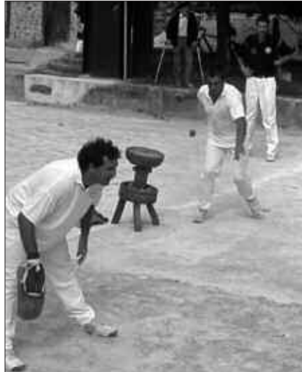
IGANDE HONETAN JOKATUKO DA FINALA OIARTZUNEN.

Zubietak, aurten bi talde jarri ditu lehian. Lehen fasean bikain aritu zen Zubieta 1 taldea, bigarren izan zen sailkapenean. Baina 2. fasean, Villabona izan zen finalerako txartela lortu zuena.