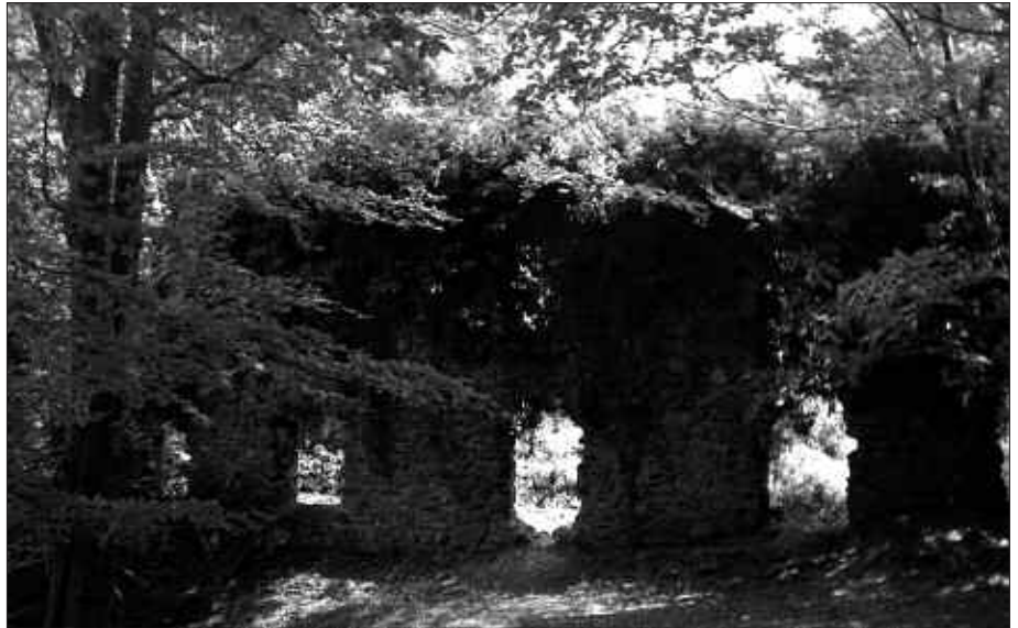
ERLAITZEKO MEATEGIETAKO TRENBIDEA GURUTZATUKO DA IGANDE HONETAKO IBILBIDEAN.

Eguraldiak baldintzatuko du ibilbidea. Giro ona bada, Aritxulegitik ubidea gurutzatu eta Erlaitz pareko meategietako trenbide zaharretara jaisteko asmoa dago. Eguraldi txarrarekin Arditurrira joango dira parte hartzaileak. Ibilaldiaren inguruko informazioa Azpirotzek berak idatzitako "Gipuzkoan zehar, paseo moduan egiteko 161 ibilbide lauak edo nahiko lauak" bildumatik hartu du usurbildarrak. Bera izango da gainera, igande honetan irteerako gidari lanak egingo dituen.