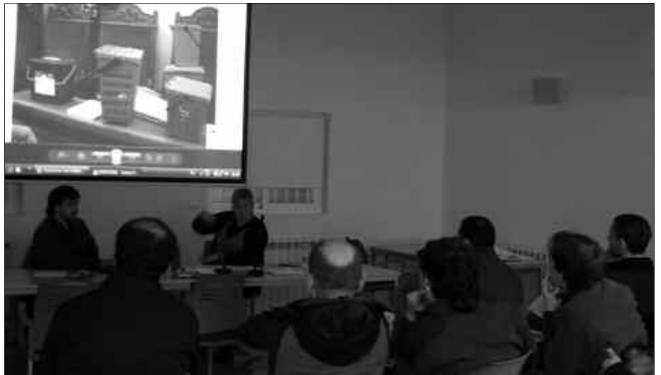
KOORDINAKUNDEAREN ESANETAN, HERRIALDE KATALANETAKO HERRI ASKOTAN DA MARTXAN ATEZ ATEKO BILKETA SISTEMA.

Legebiltzarreko Mahaiak hilabete du herri ekimen legegilea tramiterako onartzeko. Hortik aurrera, koordinakundeak lau hilabete izango ditu 30.000 sinadura biltzeko. Sinadura