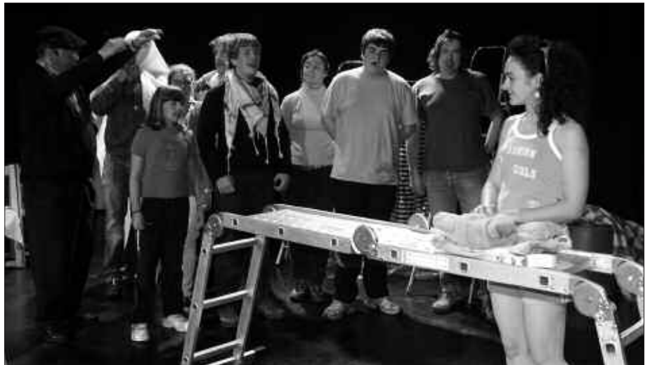
NOAUA!KO BAZKIDEEK 3 EUROTAN ESKURA DEZAKETE SARRERA, BAINA ALDEZ AURRETIK NOAUA!TIK PASA BEHAR DUTE.

Orduetik hona, antzezlan hobetu egin dute eta larunbat honetako saioan, nobe-