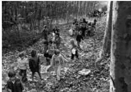
ANERREKAN IBILI GINEN HOSTOAK BILTZEN.

TXAPEL TXAPEL TXAPELA TXAPEL BURUA DAGO EPEL EPEL