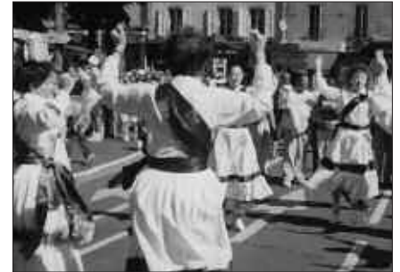
URTARRILAREN 16AN BILERA BAT ANTOLATU DA.

Bilera datorren astean egingo da, urtarrilaren 16an ostirala, arratsalde- ko 18:30ean Harane futbol zelai ondoko parkingaren aldamenean dagoen lokalean. Ezin duenak azaldu