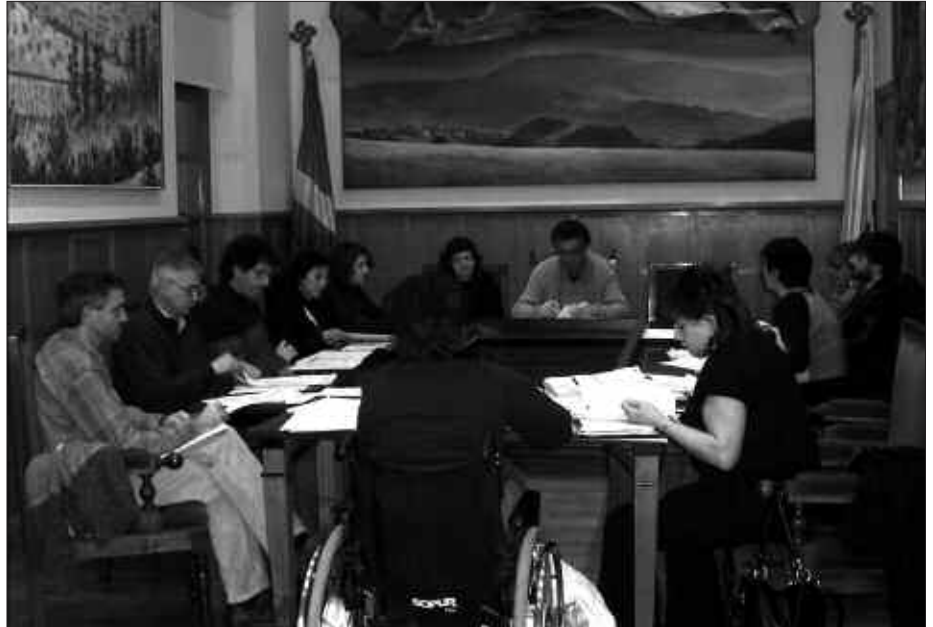
HIRU ALEGAZIO AURKEZTU ZIREN ETA HORIETAKO BAT ONARTUA IZAN ZEN.

U dal jabetzako 12 etxebizitza kokatuko dira Txaramunton. Abenduaren 30eko osoko ohiko bilkuran esleipen baldintzak aho batez onartu ziren. Udalbatzak azken erabaki hori hartu aurretik, jendaurrean erakusgai jarri eta hiru alegazio aurkeztu zituzten beste hainbeste herritarrek. Bat onartu, bestea baztertu eta hirugarrena partzialki babestu zuen udalbatzak. Baiezkoa eman zitzaion herritar batek erroldatzeari lotuta egindako eskaerari; Donostiako lur eremuan bizi diren zubietarrek usurbildarrek in alderatuta, etxebizitzetako bat eskuratzeko aukera berdina izateari hain zuzen. Partzialki aho batez onartu zen bestalde, pertsonako15 metro karratu erabilgarritik beherako ratioa izateko aukera eskaera orrietatik kentzea.