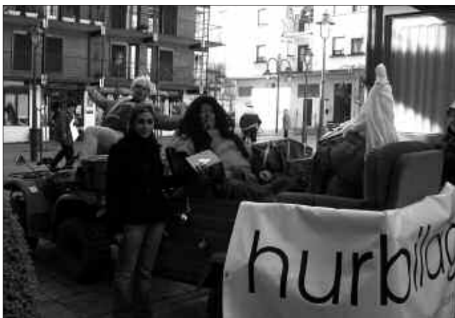
ABENDUAREN 23AN, HURBILAGOREN EKIMENEZ, OLENTZERO ETA MARIDOMINGI DENDAZ DENDA IBILI ZIREN, JOSTAILUAK BILTZEN.