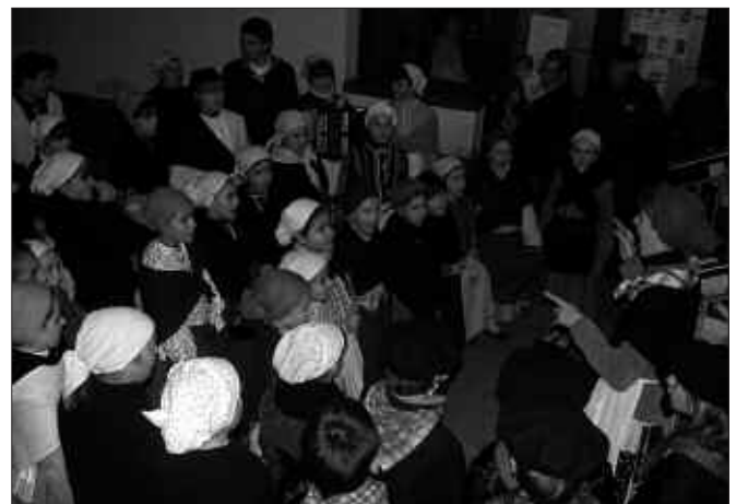
ABENDUAREN 23AN, ZUMARTE MUSIKA ESKOLAKO IKASLEAK KANTUAN IBILI ZIREN KALEZ KALE. ONDO IRAKATSIK DAUDELA ESAN DAITEKE, EDERKI ARITU BAITZIREN.