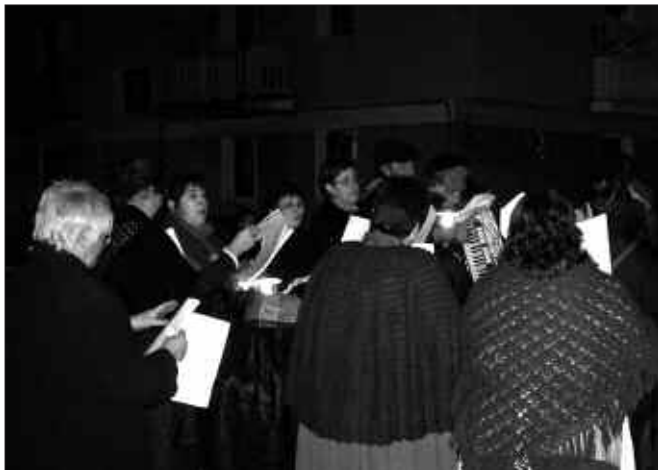
ABENDUAREN 24AN, TALDE POLITA OSATU ZEN SANTUENEAN. OLENTZEROREN BISITA ALAITU ZUTEN IRUDIAN DIREN HERRITARREK.