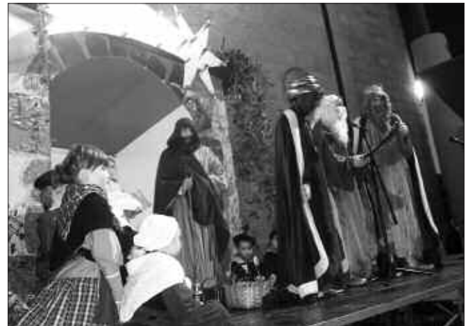
ZIORTZA AISIALDI TALDEKOEI ESKER IRITSI ZIREN GURE ARTERA HIRU ERREGE MAGOAK. SAN ESTEBANDIK BARRENA IRITSI ZIREN.