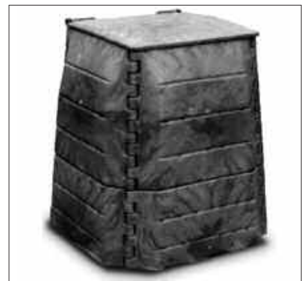
KONPOSTAGAILUA UDALAK EMATEN DU DOAN.

Beraz, arazo honi modu natural eta osasuntsu batez heldu nahi dionak eta baratza edota lorategi txikiren bat duenak urtarrilaren amaiera arteko epea du autokonpostatzeko egitasmoan izena emateko. Informazio gehiago Sutegin,