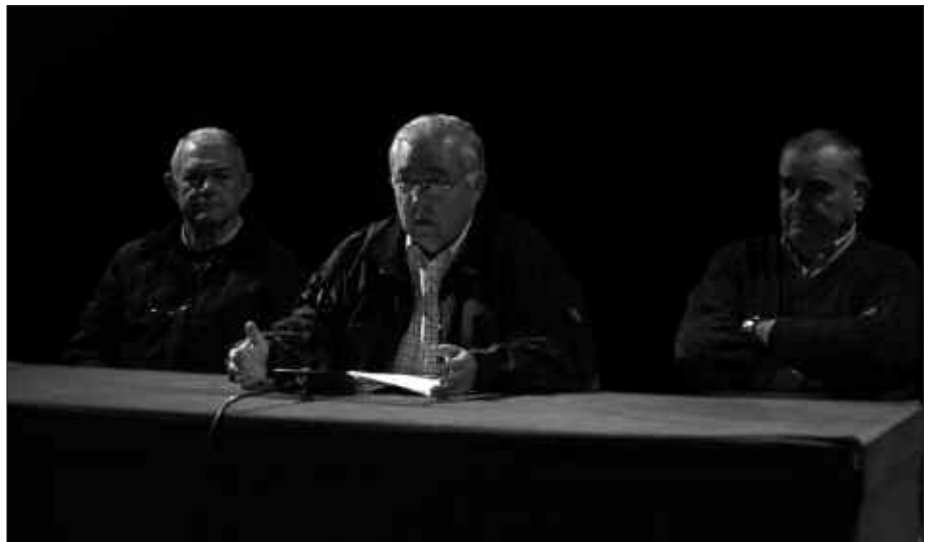
PRENTSAN ARGITARA EMAN ZUTEN IDATZIAZ ARITU ZIREN HIZKETAN ABENDUAREN 18AN SUTEGIN EGIN ZUTEN ABERRALDIAN.

P. I. Herritar askok irakurri dutela uste dugu, eta orain arte hondakinak bereiztu