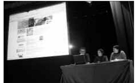
SUTEGIN EGIN ZEN USURBIL.NET WEBGUNEAREN AURKEZPENA.

Orrialde dinamikoa izango da usurbil.net.