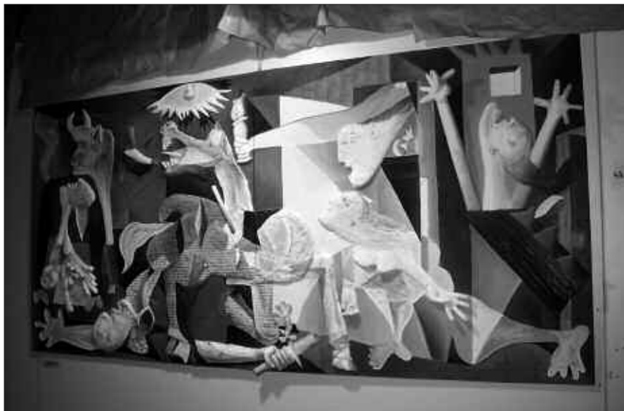
BARRENKALEN IKUSGAI EGON DIRA HERRIKO PRESOK EGINDAKO LANAK.

Eguberrietan ere presoak gogoan izateko hainbat ekintza burutu dira; gabonetako kantekin antolatutako kalejira, gudari hilen omeneko ekitaldia edota pasa den larunbatean Bilbon burutu zen nazio mailako manifestaldia.