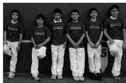
USURBILDARREK HIRU PARTIDAK IRABAZI ZITUZTEN.

dez beteta zela, profesional mailako pilota partidak jokatu ziren. Aurreneko partidaren, Aratz Mendizabal eta Argotek 22 eta 10 irabazi zuten Saralegi eta Oteizaren kontra. Bigarren partidaren, Oier Mendizabal eta Aimar Olaizolak irabazi zuten, 22 eta 16, Berasaluze VIII eta Belokiren kontra. Partida luzea izan zen, borrokatua eta landua.