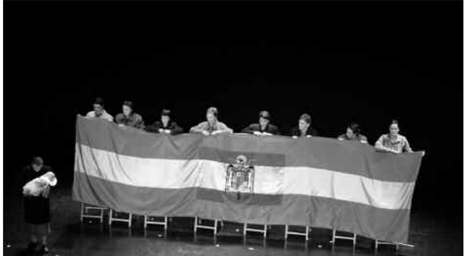
ANTZERKI SAIDA 20:00ETAN HASIKO DA. SARRERAK JADA SALGAI DAUDE KIROLDEGIAN. EGUNEAN BERTAN, SUTEGIN IZANGO DIRA SALGAI.

Bi fusilatu andoaindarrek hil aurretik idatzitako gutunak irakurriko dira. Bertako bi emakume udaletxera laguntza eskatzera joandako pasarteak ere gogoraziko dituzte. “Zer gertatu zen jakin behar da, berriro errepika ez dadin”,