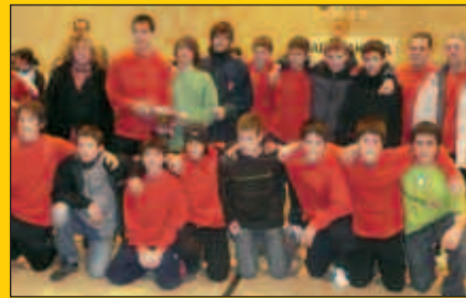
Ederra izan zen gabonetako eskubaloia festa