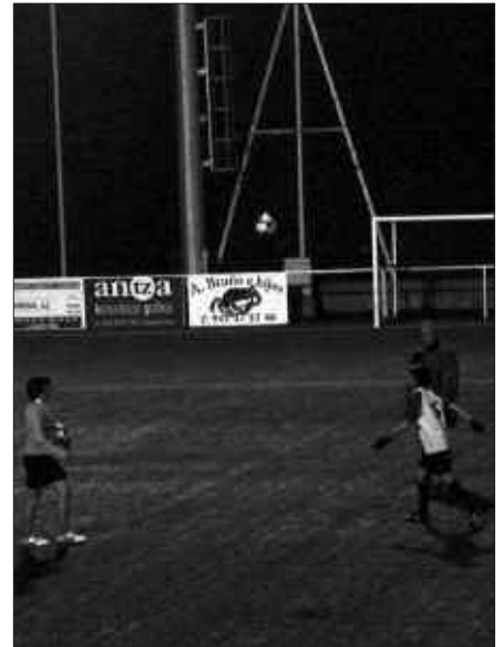
LAU TALDE DITU BERE BAITAN USURBIL FT TALDEAK: BI ERREGIONALAK, NESKEN TALDEA ETA KADETEAK.