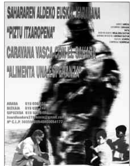
TINDOUFEN BIZI DIREN ERREFUXIATUEK GURE LAGUNTZAREN BEHARRA DUTE.

laren 31n amaituko da. Eta otsailean, Euskal Herrian biltzen dituzten gainontzeko osagaiekin batera, Tindouf aldera abiatuko da Sahararen aldeko euskal karabana.