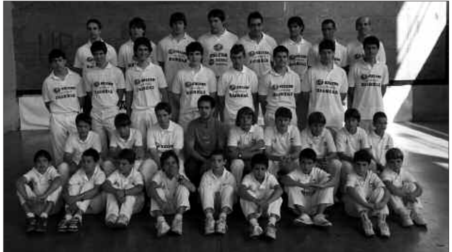
IGORREKOEN AURKA LEHIATUKO DIRA URTARRILAREN 30EKO ASTEBURUAN. ARGAZKIA, IKASTURTE HASIERAKO DA.