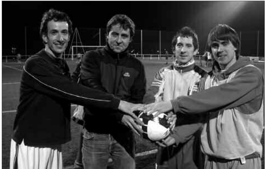
GIRO ONA NAGUSI DA USURBIL FT TALDEKO ALDAGELAN.

N. Jokalaria izan zara duela gutxi arte. Ez al duzu zelaira ateratzeko tentatiorik izan?