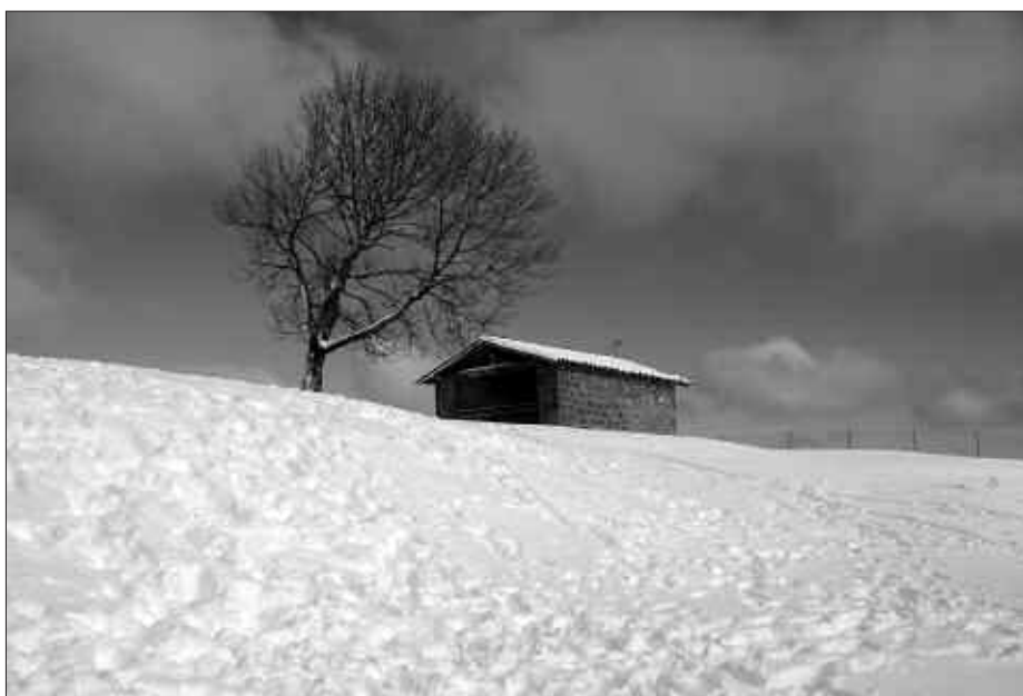
ARALARREKO INGURUETAN IBILI ZIREN ELURRETAN DBH2KO IKASLEAK.