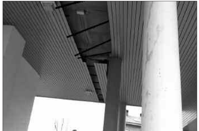
ARTZABALEN, PASABIDEKO SABAIAKO XAFLAK ALTXA ZITUEN HAIZEAK.