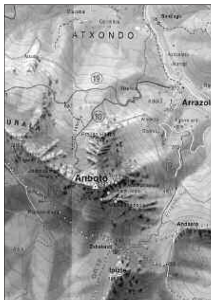
ANDATZA MENDI TALDEKOAK ANBOTO MENDIRA JOANEZ HASIKO DUTE URTEA.

Gainerako lurraldeetara joko dute Andatzakoek aurren, zeharkaldi, mendi eta bizikleta irteerak egiteko.