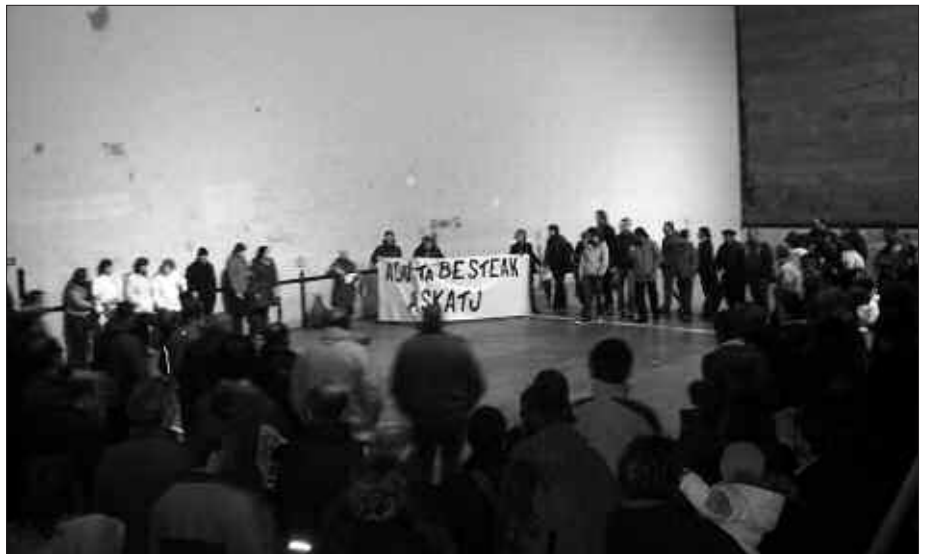
ATXILOTU ZUTEN EGUNEAN ELKARRETARATZE JENDETSUA EGIN ZEN.

Epailak autoa kaleratu zuenerako goizaldeko bostak jo zituzten. Bitarte horretan guztian, egun eta gau osoan, herritarrak bertan egon ziren. Auzitegi