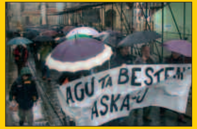
Soto del Real espetxean da Agurtzane Solaberrieta