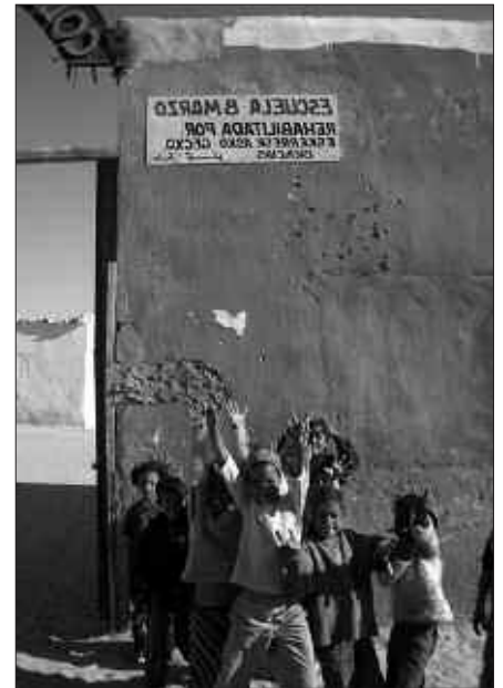
700 KILO BILDU NAHI DIRA USURBILBIL. ORAINGOZ, ERDIA BAINO GEHIAGO JASO DA.