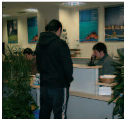
BURUNTZALDEKO UDALEK ETA KUTXAK HITZARMENA SINATUA DUTE, EUSKARA ZABALTZEKO.

Gu garatzen ari garen estrategia eta biltzen ari garen jakinduria hori akaso esportagarria izango da. Oso aurrerakoiak izan daitezkeen prozesuak ari gara bideratzen.