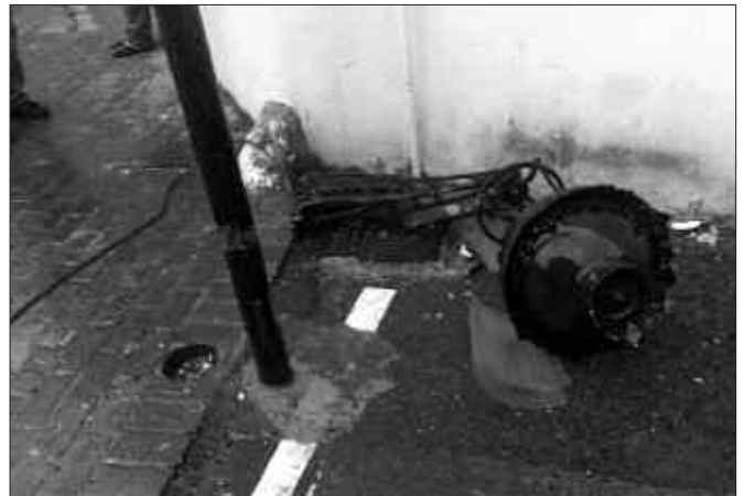
KONTSEJUZARRA KALEAN, FAROLA ERORI ETA KOTXE BATI KALTEAK ERAGIN ZIZKION.