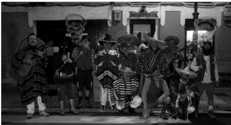
IAZKO INAUTERIETAN EDERKI ASKO PASA ZUTEN LAGUN HAUEK.

Txaranga doinuak eguerdian, eta harekin batera, kalejira arratsaldean. Eta gero, joko olinpiar zaletuentzat desfilea, BTK taldeak girotuta. Amaitzeko, afaria. Bertara joateko baldintza bakarra; mozorrotuta egotea. Laster jarriko dira afarirako txartelak salgai.