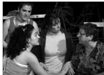
"ETXE BERRI DE LUXE" ESKAINIKO DUTE ABADIÑON.

Txerrikikoak gaztetxean bazkalduko dute baina eurekin doazen herri-tarrek, bere kasa egin beharko dute.