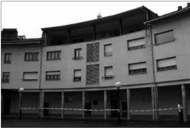
TEILA UGARI MUGITU ZITUEN HAIZEAK. GALTZARAGAINAN, ANTENA ERORTZEKO ARRISKUAN.