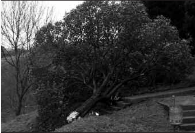
ASKO IZAN ZIREN HAIZEAK ERAMAN ZITUEN ZUHAITZAK.