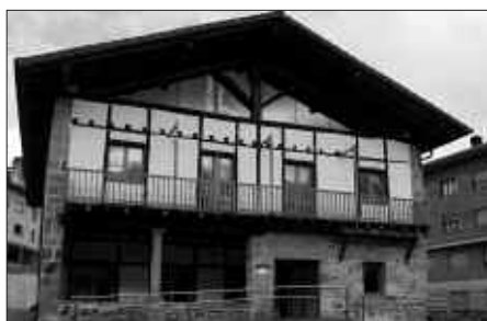
ARTZABALEN DAGO GURE PAKEAREN EGOITZA.

Jada bazkide direnen kuotak ordaintzeko egunak ere finkatu dira: urtarri-