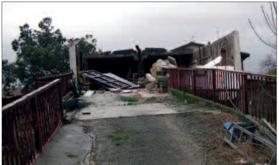
IBARROLAN, UKUILU ZAHARRAREN GAINA ETA PARETAK BOTA ZITUEN.