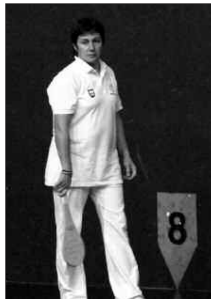
LARUNBATEAN 16:00ETAN, ERRASTIK AGINAGAN JOKATUKO DU.

Pilotari Txapelketari jarraipena helbide honetan egingo zaio: www.blogak.com/emakumeapilotari