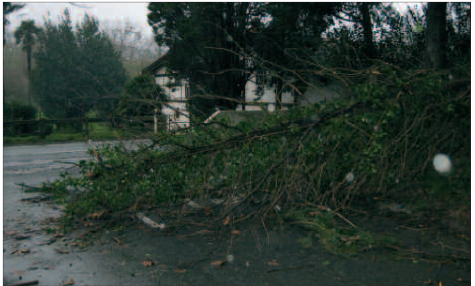
KAPAROTZEN, URKAMENDI BIDEA ITXITA EGON ZEN HAINBAT ORDUZ HAIZEAK BI ZUHAITZ BOTA ZITUELAKO. ARGAZKIAK: UDALTZAINGOA.

Santuenean , telefono-harien hainbat enbor edo poste kaltetuak izan ziren. Teilak ere altxa zituen haizeak Santuenean.