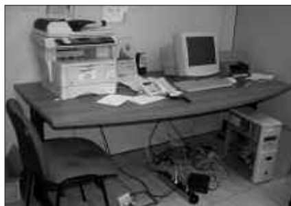
URTARRILAREN 23AN SARTU ZEN POLIZIA AEK-REN EGOITZAN.

O stiralean, goizeko 7:30ak aldera, Udalak Kale Nagusian dituen lokalak miatzen hasi zen poliziak. Bertan da, besteak beste, AEK euskaltegiaren egoitza. AEK-ko bulegoetan sartu ziren eta ordenagailuetako disko gogorak eraman zituzten. AEK-tik esan digutenez, gutxienez 6 hilabete pasako dira disko gogorak berreskuratu arte. Bien bitartean, oztopoak oztopo, klaseen dinamika berdin mantendu dute.