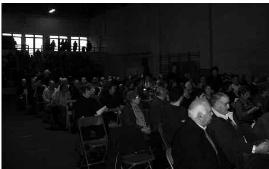
ATEZ ATEKODARI BURUZKO BATZAR IREKIAN JENDE ASKOK HARTU ZUEN PARTE.

herritarrei zuzendutako prozesu parte hartzailea. Helburua argia izan da hasieratik; elkarlana bultzatuz, udal ordezkari eta herritarren artean hondakin kudeaketa berriari forma eta itxura ematea. Pasa den udazkenean auzoz auzo eta sektoreka hainbat bilkura antolatu zituen Udalak.