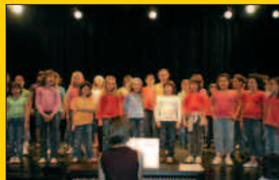
Asteartean hasiko da Soinurbil Musika Astea

Martxoaren 16an hasiko da atez ateko bilketa