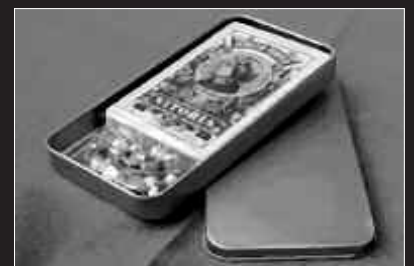
OSTIRAL HONETAN 22:00ETAN, TXOKOALDEKO ERROIZPEN.

Hilean behin jokatzen da Aitzaga Mus Txapelketa, azkena ekainean izango da. Sailkapen orokorrean, lehen lau postuetan geratzen diren bikoteek sari bereziak jasoko dituzte.