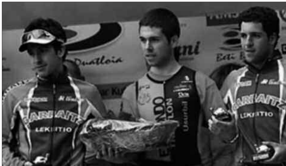
“AURTEN, DUATLOI PROBA GEHIENETAN PARTE HARTUKO DUT”.

M. O. Bai. Denboraldi hasieran, lasterketaren batean podiumera iristeko gai ikusten nuen neure burua. Denok irudikatzen ditugu halako egoerak. Izandako emaitzekin oso gustura nago. Aurten