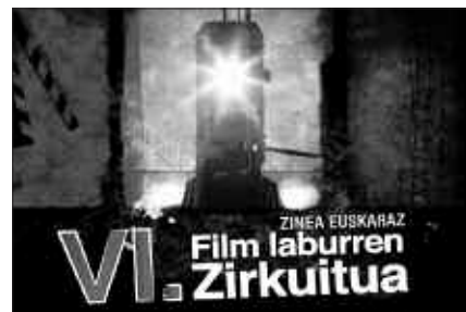
ZORTZI FILM PROIEKTATUKO DIRA.

F ilm Laburren VI. Zirkuitua jarri du martxan Topaguneak. Ostiral honetan, euskaraz egindako zortzi istorio labur ikus ahal izango dira Sutegin. Gaueko 22:00etan hasiko da proiektzioa eta ordubetekoa izango da. Sarrera, doan.