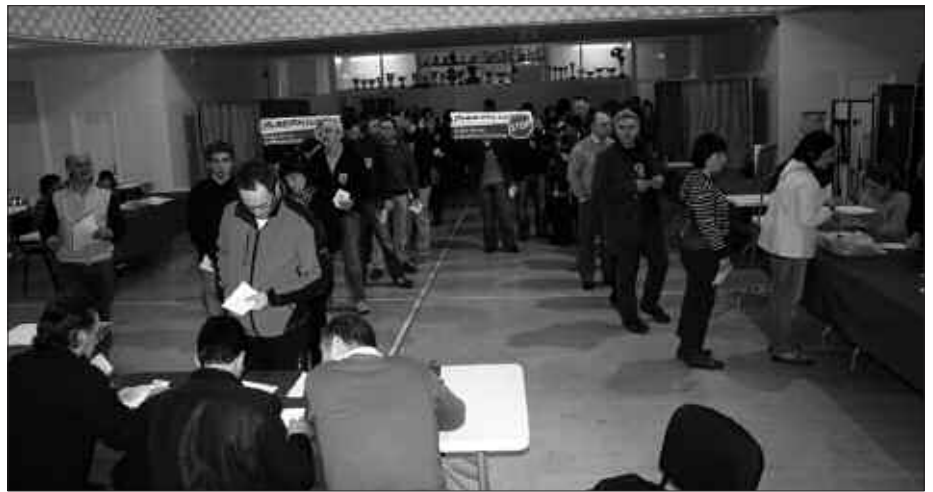
UDARREGI IKASTOLAKO HAUTES-MAHAIETAN, HERRITAR BATZUEK "SALBUESPEN EGOERARI STOP" KARTELAK ERAKUTSI ZITUZTEN.

PSE-EE alderdiak gora, PP eta EB alderdiak behera 2005eko Eusko Legebiltzarreko hau-