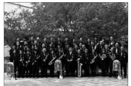
TOLOSAKO MUSIKA BANDA.