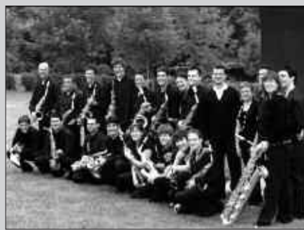
HERNANIKO SAXOFOI TALDEA.

Ekitaldiaren asmoa, musika instrumentuak ezagutu, entzun, bereiztu eta ze familiakoak diren jakitea da. 4-7 urte arteko ikasleei zuzendua.