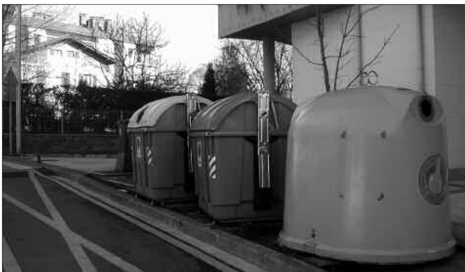
KONTAINERRAK MARTXOAREN 14KO ASTEBURUAN KENDUKO DITUZTE (BEIRAKOAK IZAN EZIK). MARTXOAREN 16AN HASIKO DA ATEZ ATEKO BILKETA.

Bizilagun bakoitzaren ontzi marroiak identifikagarri bat izango du. Baita zintzilikagarriek ere. Hartara, nor bere ontzia zer zintzilikagarritan jarri jakin ahal izango du. Ontzi marroietako identifikagarriak,