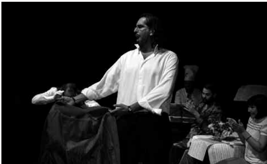
ASTEARTEAN HASIKO DA SOINURBIL "BAZEN BEHIN... OPERA" LANAREKIN.

A. A. Ikasturtean zehar prestatzen goaz. Hasieran Santa Zeziliko eta gabonetako emanaldiak izan genituen.