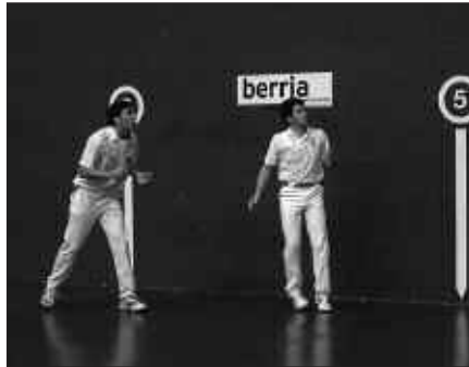
BERRIA TXAPELKETA HERNANIK EGIN DU AURRERA.

Jubeniletan, ordea, 22-15 irabazi zuen Urbietan-Aizpitarte Hernaniko bikoteak. Santxo-Ostolaza bikote usurbildarrak ahalegin handia egin zuen, hala ere. Nagusietan erabaki zen kanporaketa.