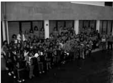
ORIOKO DANBOLIN IKASLEAK.

Partaideak: dantzariak, esku-soinu taldea, Zumarteko piano bikotea, Zumarteko trikitilari taldea, biolin taldea, alboka taldea, banda.