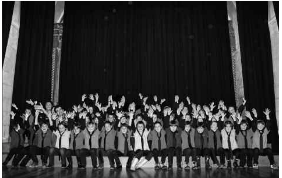
OÑATI ETA USURBILGO ABESBATZAK LARUNBAT HONETAN ARITUKO DIRA SUTEGIN KANTUAN. ARRATSALDEKO 18:30EAN HASIKO DA KANTALDIA.

Igandean, aldiz, Tolosako Musika Banda kalejiran ibiliko da.