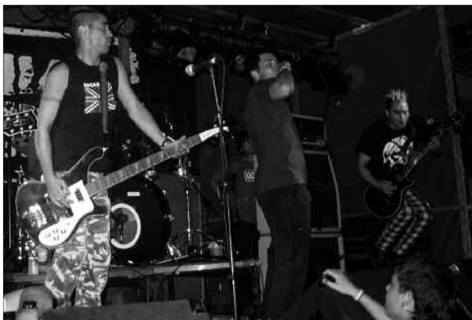
IRUDIAN, KAOTIKO TALDEKOAK. SARRERAK IRRATIN ETA ARRATEN DAUDE SALGAI.

Kaotiko taldekoak "Adrenalina" diskoa ari dira aurkezten egunotan.