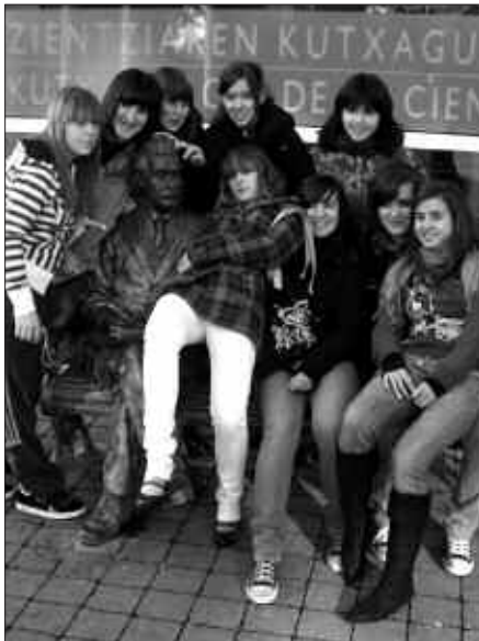
DBH 3. MAILAKO IKASLEAK GUSTURA IBILI ZIREN KUTXA ESPAZIOAN.

Ludotekako bazkideek astelehenean jasoko dituzte lokaleko giltzak