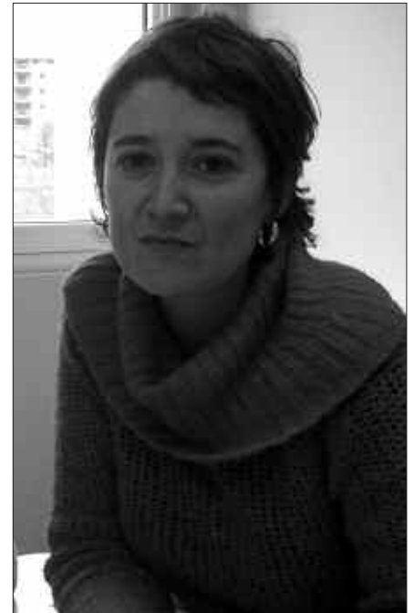
AIZPEA OTAEGI ARITU DA DIAGNOSIA OSATZEN.

A. O. Hori da asmoa. Diagnostikoa parte-hartzean oinarritu dugu, besteak beste, horrela egin, berdintasunaren inguruan saretze-lan bat egin nahi genuelako. Diagnostikoa eta Plana herritarren eta eragileen parte-hartzerik gabe egiteak ez du zentzu handirik, Plana errealitateari lotuta egin nahi badugu eta Planaren garapenean eragileek eta herritarrek inplikatzeko nahi badugu, behintzat. Diagnostiko fasean bezalaxe, Plana diseinatzeko fasean ere herritarrekin lanean jarraitu nahiko genuke, herriko eragileekin, ordezkari politikoekin, langileekin, herritarrekin... Oro har, berdintasunaren aldeko eragileek eta herritarrek osatutako sarea egituratzen. Aurrerantzean egin beharrek lanetan, beraz, aukera izango da parte hartzeko, bai orain arte parte hartu dutenek, baita parte hartu ez