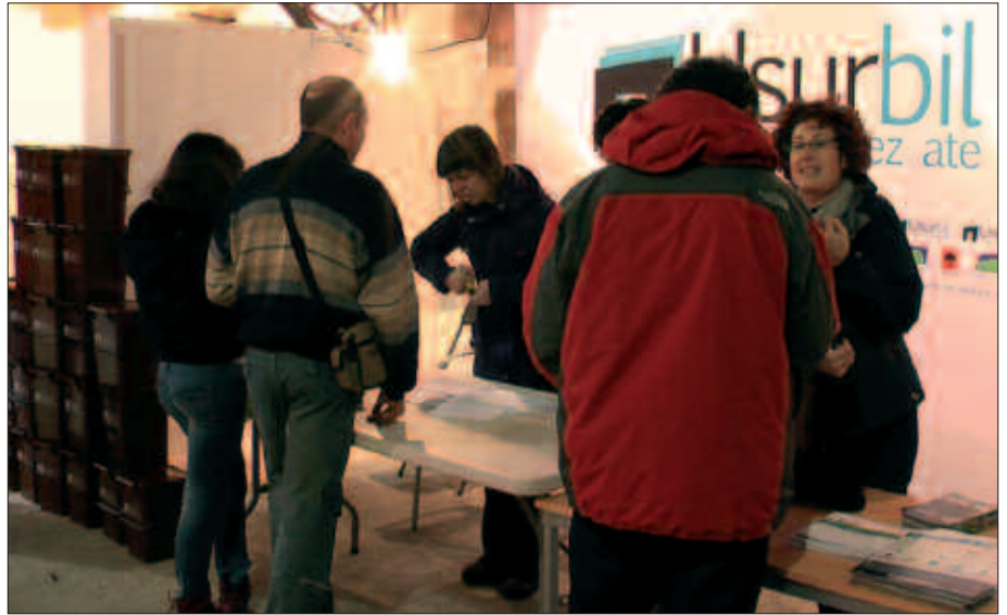
UDALAK PREST DU GUZTIA. HERRITARREK ERE BEHARREZKO MATERIALA ETXEAN DUTE. LANGILEAK ETA BILKETA KAMIDIA KALERA ATERATZEKO PREST. ATEZ ATEKOA HASTEA BAINO EZ DA FALTA JADA. MARTXOAREN 16A ATE JOKA DUGU.

Edozein zalantza argitzeko, 900 776 776 telefono zenbakia, atezate@usurbil.net e-posta edota Sutegiko informazio bulegoa hor daude.