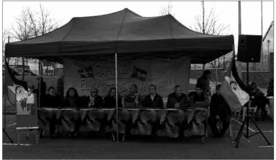
URTARRILEAN HASI ZEN SAHARAREN ALDEKO BILKETA. KRISIAK ERAGINDA, AURTEN ELIKAGAI ETA OSASUNGAI GUTXIAGO BILDU DIRA.

G uztira 400 elikagai tona bildu dira Sahararen aldeko elkartasun kanpainan; errefuxiatu kanpamenduetan bizi diren herritarrengana iritsiko diren tonak. Kopuru horretatik 670 kilo Usurbilen bildu ziren urtarrilean zehar, Udarregi ikastolan eta Aliprox eta Dia saltokietan egokitutako guneeetan. Krisialdi ekonomikoa bete-betea batetik eta aurtentzen egiteko epea laburragoa izanik, espero zen jaitsiera (beste urte batzuetan gehiago bildu da gure artean). Kanpainako eragileek eskerrak eman nahi dizkiete, urteroko ekimean parte hartu duten herritarrei, baita Udarregiri eta saltokiei ere.