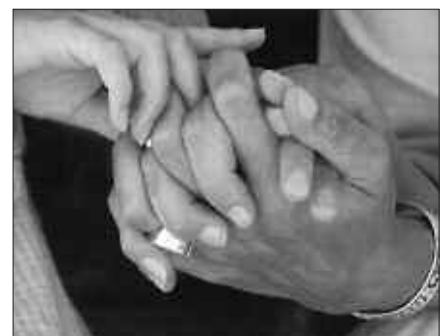
IKASTAROA MARTXOAREN 31N HASIKO DA, ETUMETA EUSKALTEGIAN.

S endian izeneko programa Gipuzkoako Foru Aldundiak koordinatutako ikastaroa da. Adineko ezinduak zaintzen dituzten familiei laguntzeko bereziki prestatutako programa. Usurbilen, adineko ezinduak zaintzen dituzten familiei laguntzeko ikastaroak martxoaren 31an eta apirilaren 1, 2 eta 3an egingo dira, 15:00etatik 17:00etara Etumeta Euskaltegian. Izen ematea, Udal Gizarte Zerbitzuetan. Telefono zenbakia: 943 377 110.