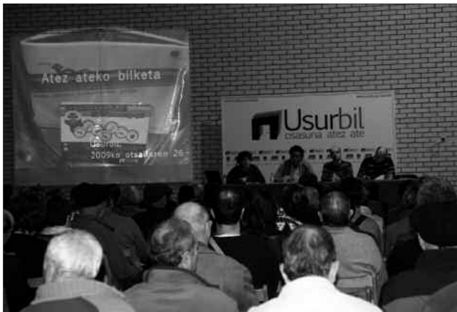
UDALAK INFORMAZIOA ZABALTZEKO HAINBAT BILERA ANTOLATU DITU. AZKEN BATZAR IREKIA DUELA BI ASTE EGIN ZEN KIROLDEGIAN.

Udal aurrekontuetan, hain zuzen, herri kontsulta ez jaso izana kritikatzeko da EAren web orrialdean: "martxoaren 16an atez-ate zabor bilketa sistema