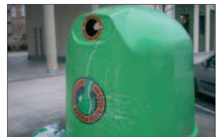
DRAIN ARTE BEZALA, BEIRA ZABOR ONTZI BERDEETARA BOTA BEHAR DA.

Bestalde, gogoan izan, geure kaleetatik eduki ontzi guztiak ez direla desagertu. Beira biltzen dutenak hor jarraituko dute aurrerantzean ere. Gainerakoak ordea bai, desagertu dira jada.