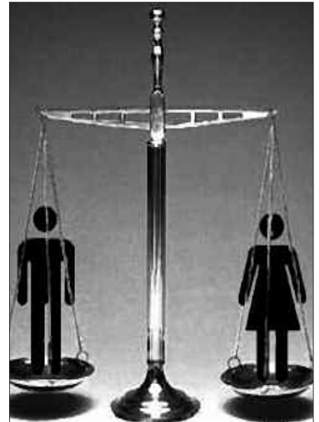
BEHIN DIAGNOSTIKOA OSATUTA, BERDINTASUN PLANA OSATU NAHI DU UDALAK.

2006 eta 2007an, bosna salaketa sexu indarkeriagatik. 2007an bi sexu eraso.