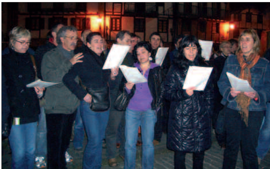
USURBILGO EUSKAL KANTU TALDEAK ANTOLATUTAKO AFARIA GAUEKO 21:00ETAN HASIKO DA. TXARTELAK JADA SALGAI ARTZABALEN BERTAN ETA TXIRIBOGA TABERNAN.

Eta afalostean, edo sabela bete artean ere, euskal kantuei errepasso ederra emateko aukera egongo da. Txartelak