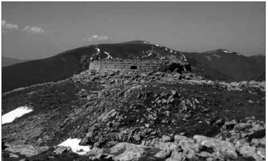
IRUDIAN, URKULU MENDIKO TONTORREKO DORREAREN ARRASTOAK.

Behin Behe Nafarroara iritsita, Orbaizetako fabrikatik (800 m) abiatuko dira Urkulu mendira. Baina ibilbidearen iraupena, hala ere, 5-6 ordukoa izango da.