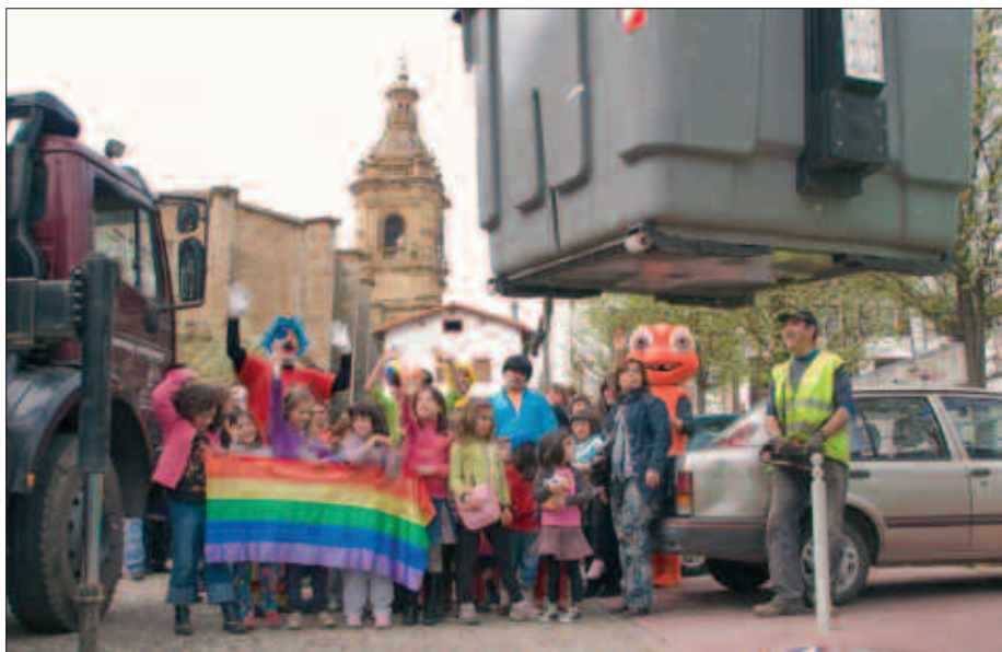
EZKER ESKATEZ ATEKOA AURKEZTEKO EKITALDI NAGUSIAN, BESTEAK BESTE UDALEKO ETA MANKOMUNITATEKO ORDEZKARIEK PARTE HARTU ZUTEN. ANIMO ETA ZORTE ONA OPATZEKO HITZAK ENTZUN ZIREN.

Pasa den asteburuaz geroztik etxeko ohiko zabor poltsa kalean uzteko etxetik orain arte bilketa gune izan direnara doan bidea ezin da egin. Hondakinak atez ate biltzen hasteko 48 ordu eskas falta zirela Udalak presatatu zuen jaialdi batekin, herritarrek eduki ontziak agurtzeko aukera izan zuten. Eguerdiko hamabietan hastekoa zen antolatua zegoen ekitaldi sorta. Ordurako frontoiko harmailak guraso eta gaztetxo betea zegoen. Haurrek hainbeste maite dituzten Porrotx eta Marimototsek emanaldi berezia eskaini zuten. Martxoaren 14rako a proposa goa izan ezin zitekeen atez ateko hondakin bilketa sistema ardatz hartuta eskaini zuten saioa pilotalekuan.