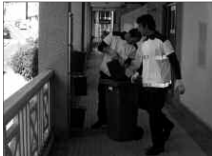
ASTELEHENEAN HASI ZIREN BILTZAILEAK KUBOAK JASOTZEN.

Atez atekoak abian jarri duen parte hartze prozesua beste gaietara hedatze-