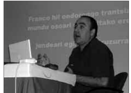
FLOREN AOIZ IZANGO DA IKASTAROAN ARITUKO DEN HIZLARIETAKO BAT.

30era, dirua kontu-zenbaki honetan sartuta: 3035 0140 30 1400900017.