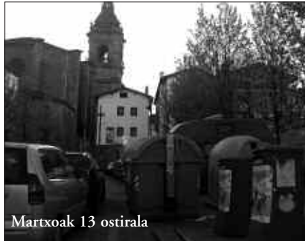
Martxoak 13 ostirala