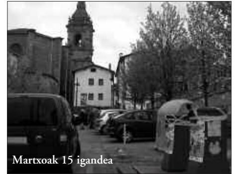
Martxoak 15 igandea

AURREKO ASTEAN KENDU ZIREN ZABOR ONTZIAK. BEIRAKOAK HALA ERE, ZEUDEN TOKIAN JARRITZEN DUTE. PAISAIAN ALDAKETA NABARIA DA.