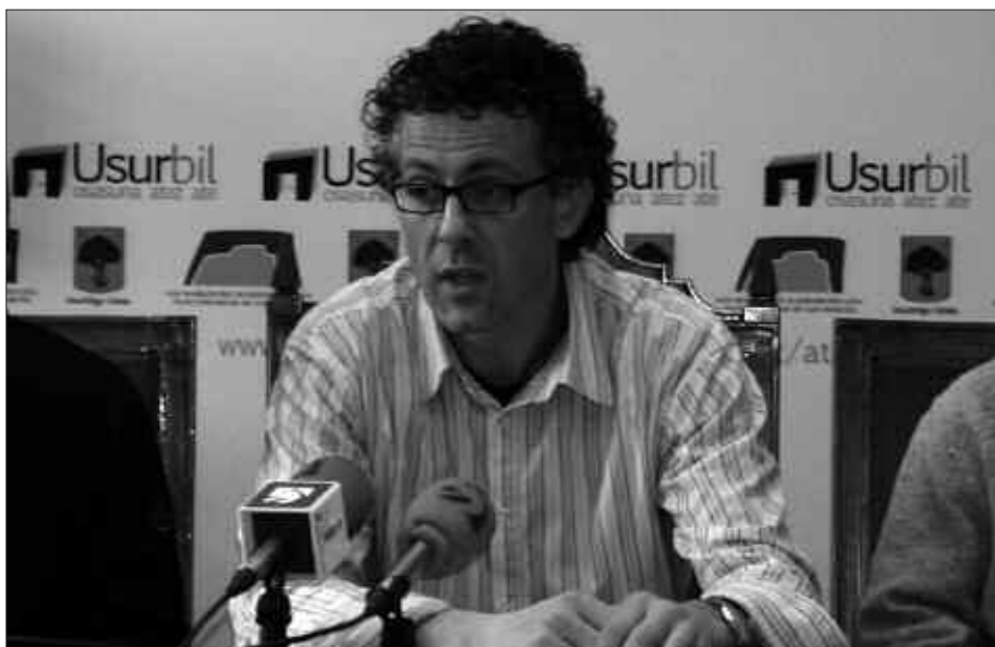
URTEBETEKO LANA EMAN DU ATEZ ATEKO SISTEMA PRESTATZEAK.

N. Lehen egun hauek nolakoak izango direla aurreikusten duzu?