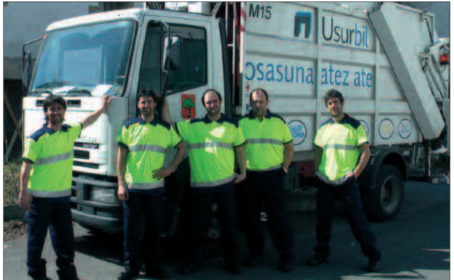
BOST BILTZAILE BERRIAK, ATEZ ATEKORAKO ERABILIKO DEN KAMIOIAREN ONDOAN. ATEZ ATEKO AURPEGIAN BILAKATUKO DIRA AURRERANTZEAN.

Udal langile berriak, txandaka, goizez zein arratsaldez atez atekoa egingo den eremuan, eta komertzioetan sortzen diren hondakin zatiak jasoko dituzte.