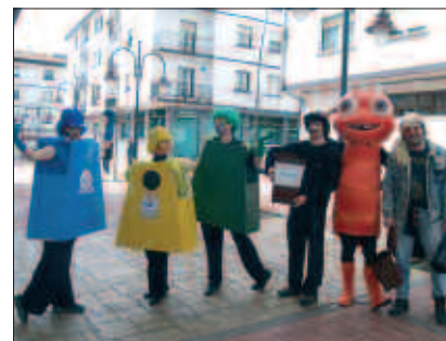
PASA DEN LARUNBATEKO FESTA KALE ANTZERKI BATEN BIDEZ IRAGARTZEN ARITU ZIREN AKTORE HAUEK.

Usurbilgo esperientzia eredu garri jo zuen gainerako udalerrientzat: "Zortea opa dizuet. Zuen arrakastagu guztion arrakasta izango delako".