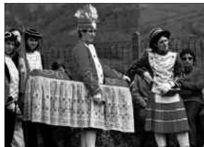
MARTXOAREN 29AN, GOIZEKO 8:30EAN ABIATUKO DIRA.

Bidaiaren prezioa 6 eurokoa izango da. Hala ere, izena aldeztatik eman behar da Txerriboga tabernan.