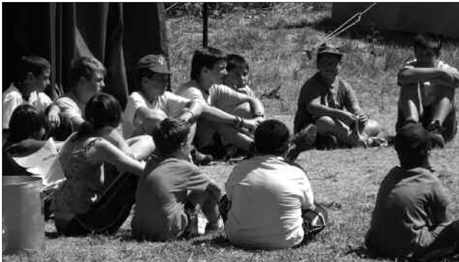
BIGARREN TXANDA OSO BETEA DAGO BAINA LEHENENGORAKO ORAINDIK BADA LEKURIK.

Bi txanda antolatu ditu Ziortza Gazte Elkartek. Lehen txanda, DBHko ikasleekin osatuko dute. Bigarrena, lehen hezkuntzako ikasleekin.