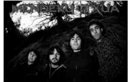
"INDARRAK BATUZ" DU IZENA MENDEKU ITXUAKEN DISKO BERRIAK.

D enbora luzez aritu dira disko berria prestatzen. Baina itzalean egindako lana jendurrean aurkezteko garaia iritsi da. Martxoaren 26an, "Indarrak batuz" izeneko diskoa aurkeztuko dute Sutegin. Sarrerak aldez aurretik eros daitezke kiroldegian, 2 eurotan. Egunean bertan ere salduko dira, Sutegin bertan, 3 eurotan.