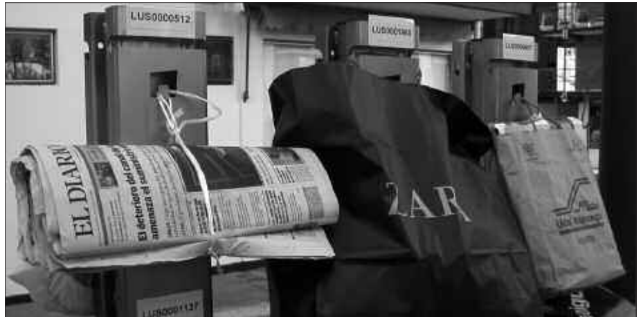
PAPERA SOKAZ LOTUTA, KARTOIZKO KUTXAN EDO PAPEREZKO POLTSAN ATERA BEHAR DA, EZ PLASTIKOZKO POLTSA BATEAN.

Labur esanda, astebetean 11 tona organiko zabortegira eramatea saihestu da.