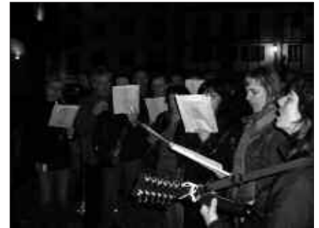
LARUNBAT HONETAN, KANTU AFARIA EGINGO DA ARTZABAL JATETXEAN.

Larunbat honetako menua hauxe izango da: txipiroi entsalada, baraxuri fresko eta gula nahaskia habian, erreboilo eta txangurro milorria, entrekot puska roquefort saltsarekin, postre dastatzea eta kafea.