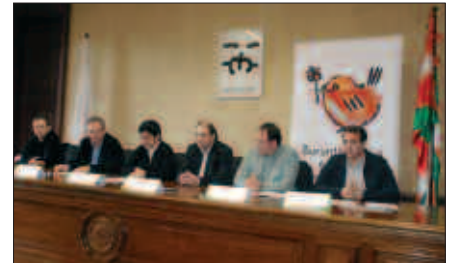
UDALETAKO ETA ENPRESETAKO ORDEZKARIAK HITZARMENA SINATZEKO EKITALDIAN.

Asko dira euskararen erabilera normalizatzeko arrazoiak. Baita horretaz jabetuta erronka berriari aurre egin dioten gure inguruko establezimendu eta enpresak.