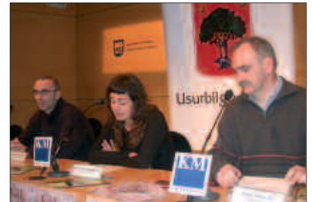
DONOSTIAKO KOLDO MITXELENAN EGIN ZEN IKASTAROAREN AURKEZPENA.

Martxoaren 31n hasiko da eta 10 hitzaldiz osatuko da ikastaroa. Hitzaldiak astelehenez egingo dira