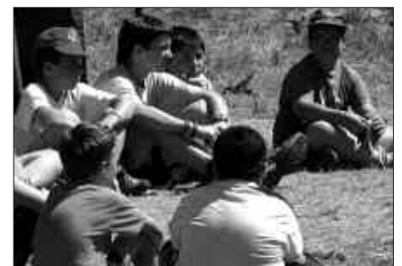
UZTAILEAN EGINGO DIRA ZIORTZAKO KANPALDIAK.

Ziortza Gazte Elkarteak aditzera eman duenez, izena emateko epea martxoaren 31n amaituko da. Nola izena eman? Ba telefonoz, 638 524 710 zen-