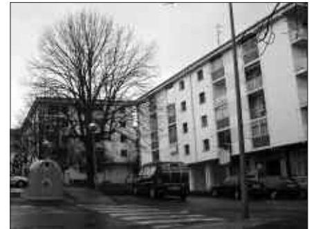
URTEA AMAITZERAKO OLARRIONDOK ERABERRITUTA EGON BEHAR LUKE.

Gehiengo osoz onartu du udalbatzak Olarriondo berrurbanizatzeko obretarako proiektua. EAko udal ordezkariak soilik jo zuten abstentziora bozkatzeko unean, pasa den martxoaren 16ko ezohiko osoko bilkuran. Emaizta berarekin, gehiengo osoz, onartu ziren aipatu eremuko obren esleipena eta lizitaziorako oinarri gisa erabiliko diren baldintza juridiko, ekonomiko, tekniko eta administratiboak. Gipuzkoako