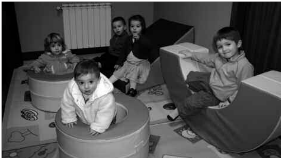
IRUDIAN, BIHURRI LUDOTEKAKO HAURRAK.

Informazio gehiago, ludotekan bertan edota udaletxean jaso daiteke. Irudian, ludotekako haurrak jolasean.