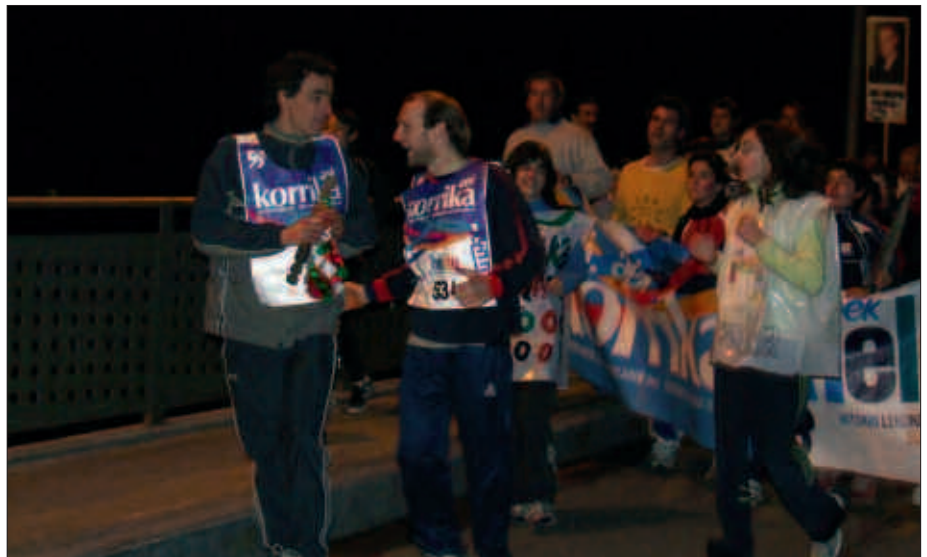
KORRIKA APIRILAREN 2AN IRITSIKO DA ARRATSALDEKO 16:00AK ALDERA.

aurretik eta ondorenean, kalea giroten arituko dira. Antolatzaileek parte hartza deitzen dituzte herritarrak.