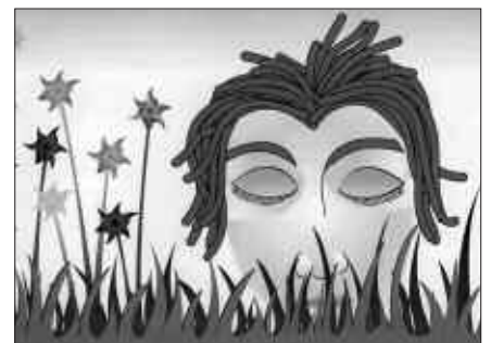
APIRILAREN 30EAN AMAITUKO DA LANAK AURKEZTEKO EPEA.