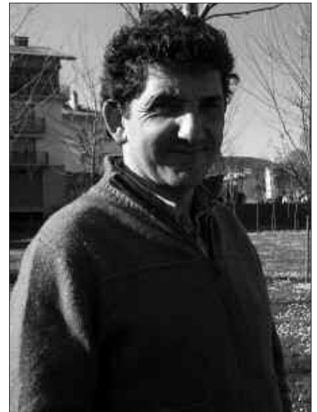
“ATEZ ATEKO BILKETA EGITEN DUTEN BESTE HERRIETAN BAINO HASIERA HOBEA IZAN DU HEMEN”.

I. A. Atez atekoa eta konpostatze gunea bateratsu jartzea nahi genuen. Bestela, atez atekoa lehenago jarria izan-