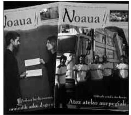
ASTEKARIAREN DISEINUA BERRITU NAHI DA 2009AN.

Batzarrera etorri ez ziren bazkideek NOAUA!ko bulegoan bertan jaso ditzakete 2008ko balantzeak eta 2009ko egitasmoei buruzko txostenak. E-postaz ere eska daitezke, honako helbidera idatziz: elkartea@noaua.com