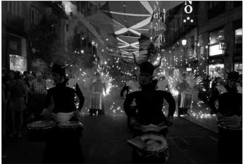
DEABRU BELTZAK TALDEAREN IKUSKIZUNAK BETI DIRA IKUSGARRIAK. II. KALE ANTZERKIAN "TAMBORES DE FEU" SAIDA ESKAINIKO DUTE GAUERDIAN.