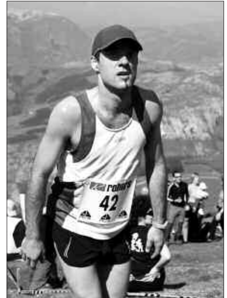
MENDI LASTERKETAK UGARITU EGIN DIRA EUSKAL HERRIAN.

Parte hartzaileen artean sari sorta ederra zozketatuko da. Lehen lau gizonezko zein emakumezko sailkatuentzat, trofeoekin batera, 150 euro, ehun euro edota 50 euro hurrenez hurren. Berrogei urtetik gorako zein Aginagako gizonezko zein emakumezko beteranoek ere trofeo bana jasoko dute. Gainerakoan zozketa ugari burutuko dira, lasterketa amaitu ostean.