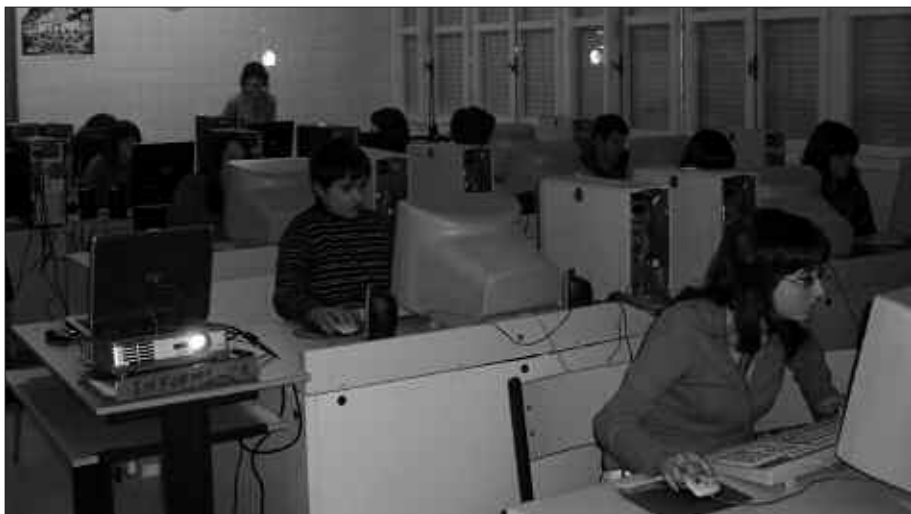
IKASLE TALDEETAKO BAT, INFORMATIKA GELAN EDUKIAK SAREAN ZINTZILIKATZEN.

arlotan landutako materiala aprobetxagarria bihurtu eta bateratzeko aukera izan dute. Ikus-entzunezko eta informatikako klaseetan landutako edukiak hain zuzen.