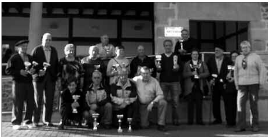
AURREKO ASTEAN EGIN ZEN SARI-BANAKETA ARTZABALEN.