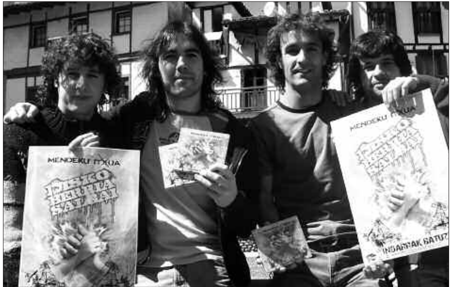
LIZARDIN JARRI DUTE DISKO BERRIA SALGAI.