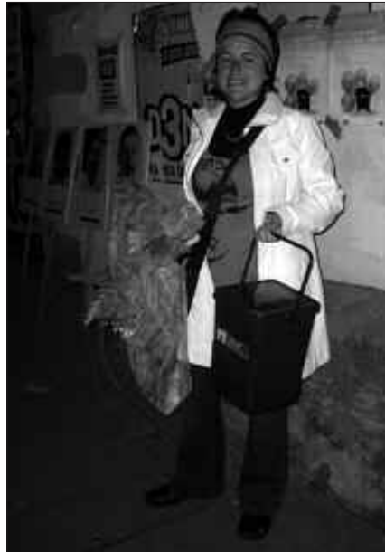
ONGI ETORRI EKITALDIAN, KUBO MARROI BAT JASO ZUEN OPARI MODUAN.