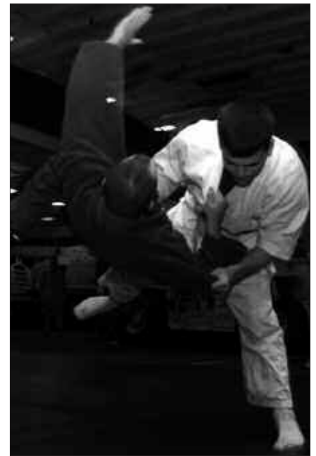
IKUSGARRIAK DIRA JUDO BORROKAK,

Aitzol. Judoaren aitzakiarekin bidaiatu dugu bai gustura. Alde onetako bat da. Hemen judoan jende gehiago arituko balitz, nahiko gerra izango genuen. Hemen ez dugunez, kanpora joan beharra dugu horren bila.