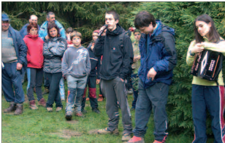
DUELA BI URTE, BEÑAT GAZTELUMENDI BERTSOLARIAK ETA HERRIKO TRIKITILARIEK ALAITU ZUTEN ANDATZA EGUNeko ERROMERIA.

Erromeria giroan, egun eder bat igarotzeko aukera izango da igande honetan Andatzan. Iritsi orduko, hamaiketako zain izango dugu: salda, txorizoa, haragi egosia eta edaria. 12:00etan, herri kirolak eta jokoak hasiko dira eta 14:00etan bazkaria (norberak berea eramanda). Kafea eta kopa, ordea, antolatzaileek banatuko dute. Horretan arituko dira Zizurkilgo Ziotza Elkartea eta Andatza taldea.