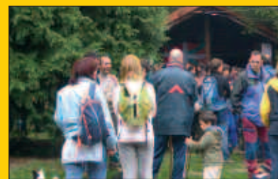
Igandean, Andatza Eguna