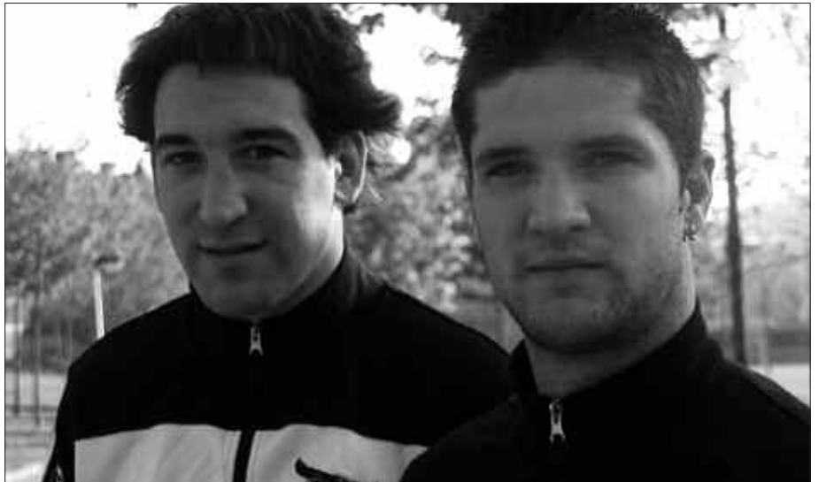
ONENEN ARTEAN DAUDE; MAILA GUZTIAN LEHIAKOR AZALDU DIRA.