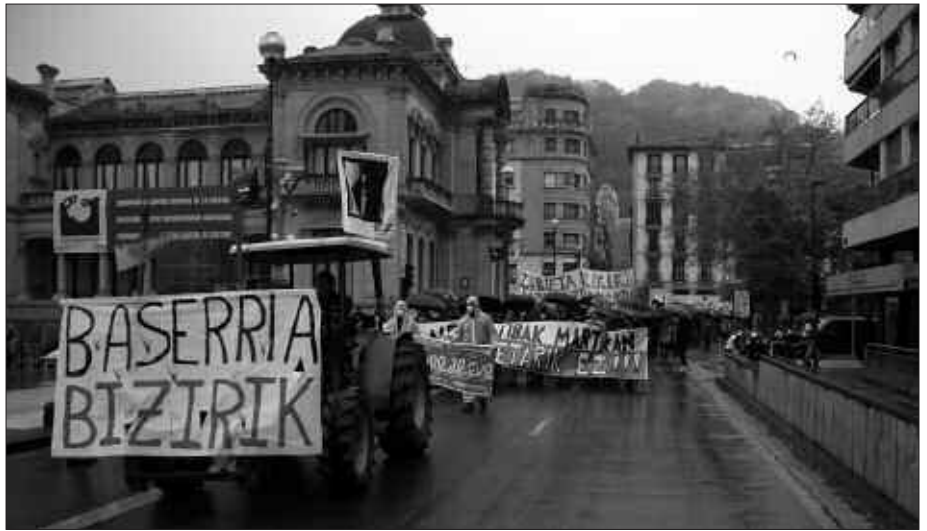
"ZUBIETA BIZIRIK" LEMAPEAN BATU ZIREN MANIFESTAZIORA ZUBIETARRAK.

Errausketaren aurka eta alternatiben aldeko oihuak nagusitu ziren Donostiako manifestaziora batutako lagunaren artean. Traktore batek ireki zuen bidea, "Baserrria bizirik" lema agerian zuela. Atzetik, "Zubieta Bizirik" zioen pankarta nabarmendu zen.