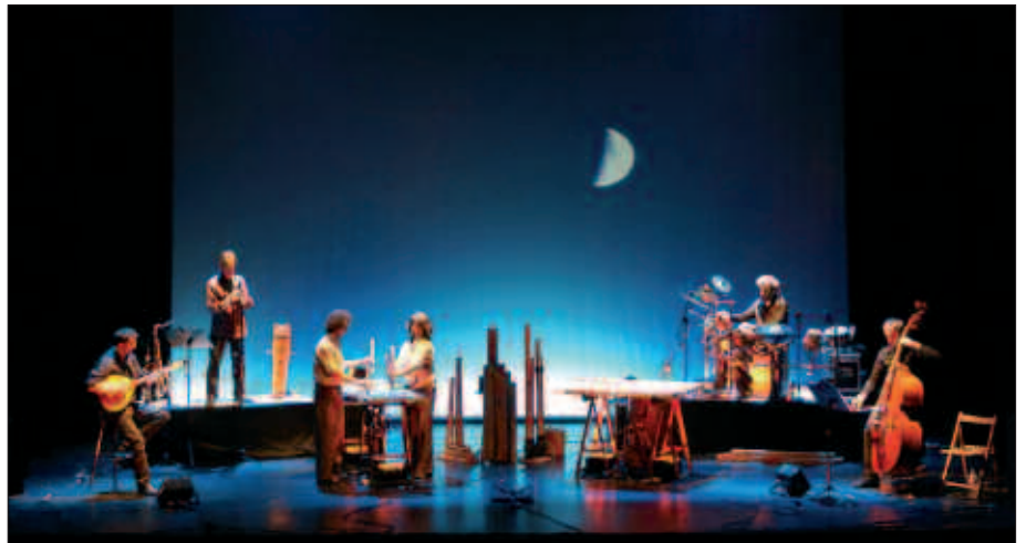
OREKA TX TALDEAK “NOMADAK TX” IKUSKIZUNA ESKAINIKO DU MAIATZAREN 9AN OIARDO KIROLDEGIAN.

Oreka Tx-en ikuskizunean “Ez Dok Amairu” taldeko bi kide izango dituz-