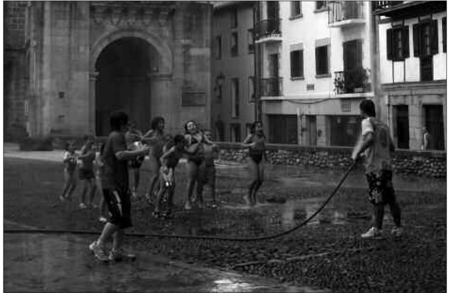
BEGIRALEAK ETA ZUZENDARIA BEHAR DIRA UDAJOLAS MARTXAN JARTZEKO. GAZTETXOAK APUNTATZEKO EPEA, ORDEA, MAIATZA BUKAERAN HASIKO DA.

Izen-ematea, maiatza bukaeran Begiraleak eta zuzendaria aukeratzeko garaia da honakoa. Umeen edo gaz-