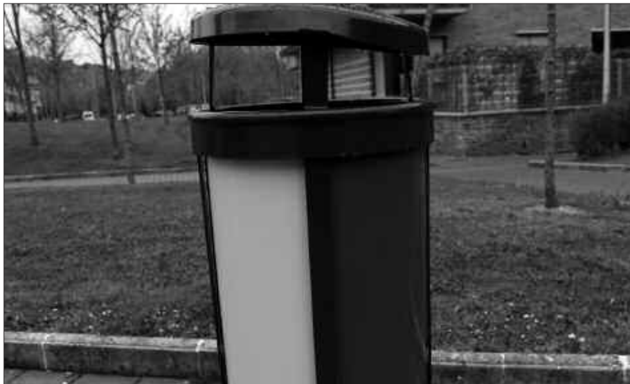
IRUDIAN, ARTZABAL PARKEAN DAGOEN EDUKI ONTZI BERRIA.

Kaleetan jartzen ari diren ontziak lau zati desberdinetan zatitua daude, herritar bakoitzak hondakinak egoki bota ditzan; plastikoa batetik, organikoa bestetik... Atez ate eta kalez kale, hondakinak gaika bildu eta birziklatzeko.