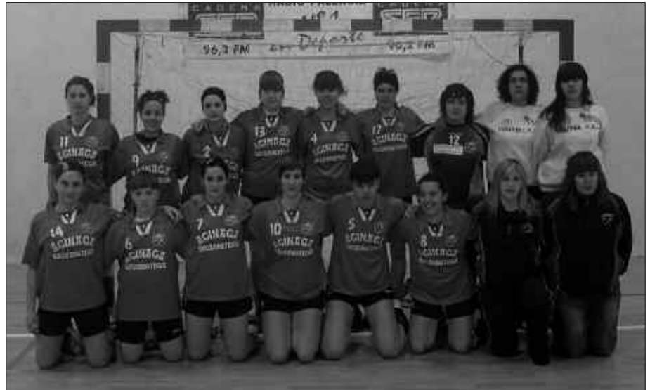
MAIATZAREN 6TIK 10ERA JOKATUKO DA ESPAINIAKO TXAPELKETAKO AZKEN FASEA. ZARAUTZEN JOKATUKO DA, FEDERAZIOAK IRAGARRI BERRI DUENEZ.

Palentziako fasean, Andaluziako Dos Hermanas izan zen nagusi, gol average hobea lortu zuelako. Bigarren