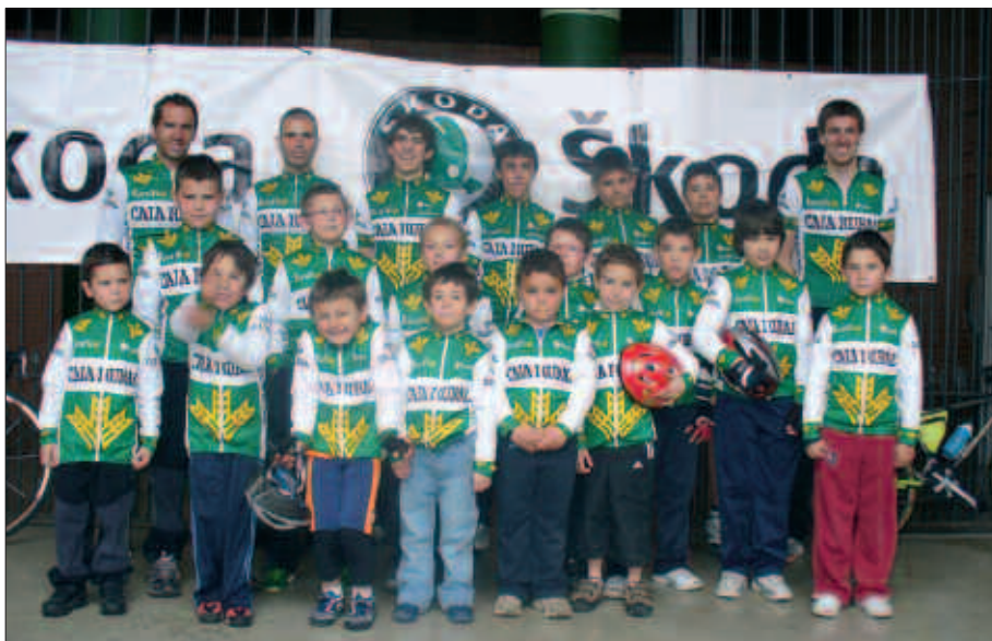
AURTEN OSATU DA BURUNTZAZPI ESKOLA. MAIATZAREN 9AN GIPUZKOAKO TXAPELKETAN ARITUKO DIRA, ZUMARTEGI INDUSTRIALDEAN.

Aurten abian jarri den Buruntzazpi Txirrindulari Eskolako kideak ere bertan izango dira. Maiatzaren 9ko hitzordua igaro ondoren, eta udako oporraldia gertu dela aintzakotzat hartuta, eskolako arduradunek Usurbil eta Lasarte-Oriako kirolariak bildu nahi dituzte, ikasturte amaiera elkarrekin ospatzeko.