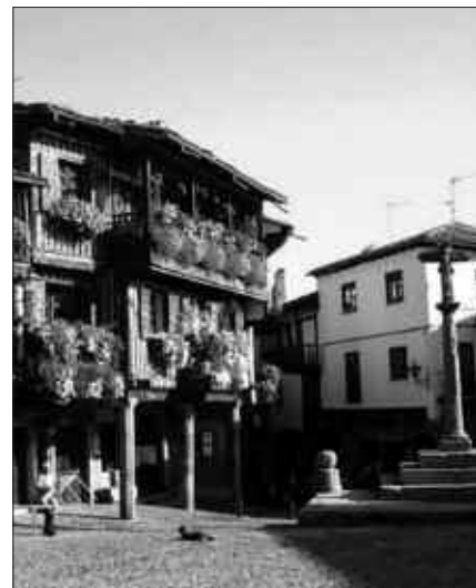
PARAJE EDERRAK DAUDE BISITATUKO DUTEN ZONALDEAN.

oraindik. Informazio gehiago Artzabalen, 9:30etik 12:30era.