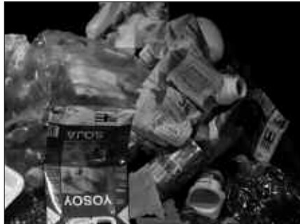
ONTZI ARINAK PLASTIKOZKO POLTSAN ATERA BEHAR DIRA.

Egunez egun, hondakin zati desberdin bat atera behar da etxe atarira. Gaia eta estalkia material berekoak izatea komenigarria da. Adibidez, ontzi arinak plastikozko poltsan atera behar dira.