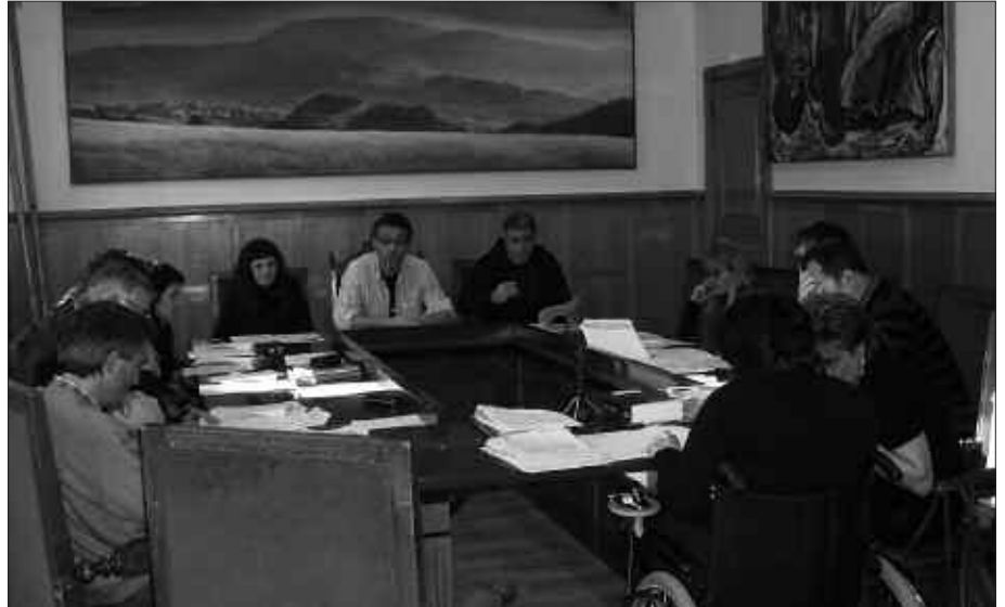
DUELA BI URTE, 125 IZAN ZIREN ISTRIPUZ HILDAKO LANGILEAK EUSKAL HERRIAN. IAZ, 112. MOZIOAN ONARTEZINTZAT JOTZEN DIRA DATUOK.

Gainera, Udalak lan arriskuen prebentzio alorreratik zigortu duten enpresaren zerbitzurik ez du kontratatuko, onartutako testuaren arabera. Lan istripuen arazoari aurre egiteko