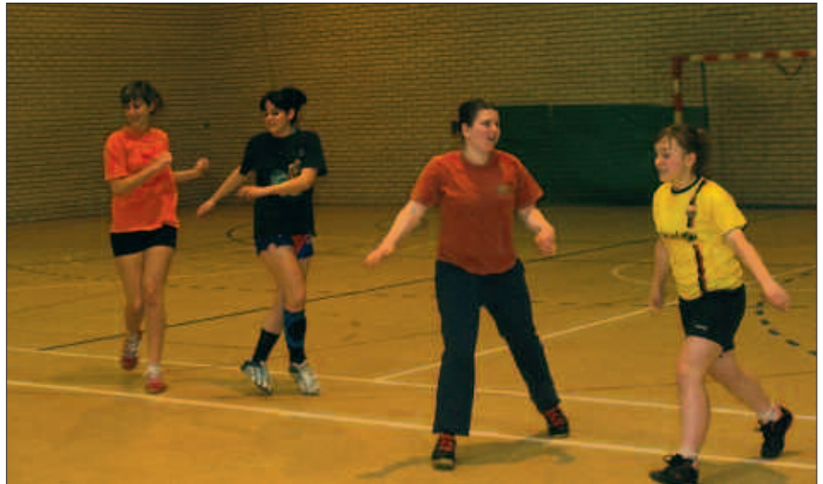
EGUN HAUETAN AZTERKETAK DITUZTE BAINA MAILA TXUKUNA EMATEN SAIATUKO DIRA JUBENIL MAILAKO NESKAK.

N. A. Barruan eta kanpoan bizi dut, baina barruan egotea nahiago nuke. Aurten helburu batzuk finkatu nizkion neure buruari. Orain, lortu direla eta jokalaria batzuk zituzten akats txikiak