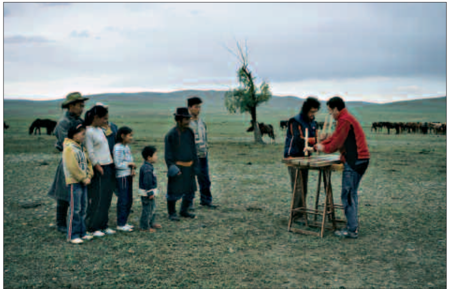
HERRIALDE ASKO BISITATU DITUZTE ETA TOKIAN TOKIKO MUSIKARIEKIN BATU DIRA, TXALAPARTARI EKARPEN BERRIAK EGINEZ.

Ibilbide luze horretan ezagutu dituzten musikarien presentzia bermatzeko, pantaila handi bat erabiliko dute Oiardo kiroldegian: “agertokiko pantaila, mundura irekitako leiho erraldoi