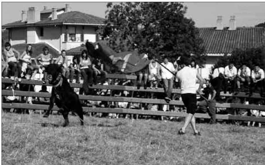
LANAK MAIATZAREN 29A BAINO LEHEN ENTREGATU BEHAR DIRA UDALETXEAN.

Lanetan ez da egilearen inolako seinalerik agertuko. Datu pertsonalak (izen-abizenak, helbidea eta telefonozenbakia) gutunazal itxi batean adie-