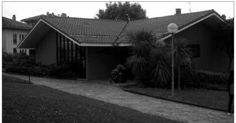
BETEKIZUN BAKARRA, DATORREN URTE AMAIERAN 2. HIZKUNTZ ESKAKIZUNA EGIAZTATZEA IZANGO DA; ORDURA ARTE EZ DU EUSKARAZ JAKIN BEHAR IZANGO.

Beste herri batzuetan ere eman daiteke antzeko kasurik Mozioaren bidez, Udalak Osakidetzari eta EAEko hizkuntz politikaren arduradunei gogorarazi diete udalerrri eta eskualde euskaldunetan osasun zerbitzua ematen duten langile guztiak euskaldunak izan behar dutela, eta eskatu diete eskura