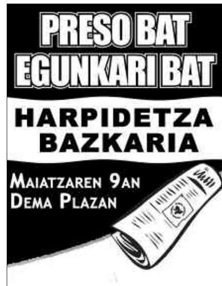
BAZKARIRAKO TXARTELAK TXIRIBOGA TABERNAN DAUDE SALGAI, 23 EUROREN TRUKE.