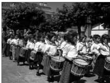
UMEEN DANBORRADAKOAK LARUNBATEAN EGINGO DUTE LEHEN ENTSEGUA.

Aurten bost urteko umeak aurrean joango dira eta sei urtetik aurrerakoak jotzen. Antza denez, desfilatzeko garaian nahiz eta danbor txikiak eraman, ez dira gustura ibiltzen. Umeen danborrada uztailaren 2an izango da eguerdiko 12:00etatik aurrera.