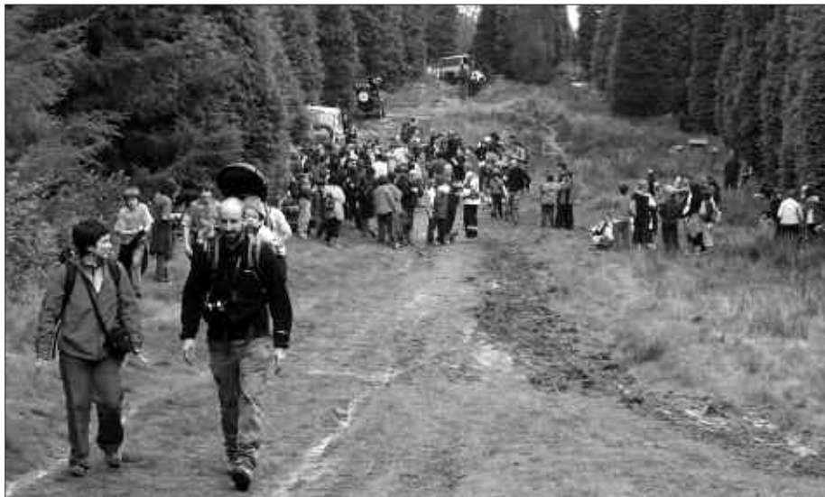
ANDATZAKO ATERPE PAREAN BILDU ZIREN ANDATZARA IGO-TAKOAK.

Mendi buelta horretako geraleku nagusia, aterpe pareak izan zen. Andatza mendi taldeko kideek jan edana prest zuten, jendea bertaratu ahala zerbitzatzeko. Hondakinen kudeaketan Usurbilen izandako aldaketa ere nabari zen Andatzean. Hondakinak gaika biltzeko ontziak jarri zituzten eta.