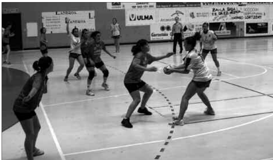
GOGOR LAN EGIN DUTE DENBORALDI OSOAN. ASTEBURU HONETAN KOPAKO BI PARTIDA JOKATUKO DITUZTE, ELGOIBARREN ETA ZARAUTZEN.