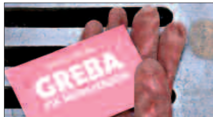
EGUERDIAN DONOSTIAN ETA ARRATSALDEAN HERNANIN ELKARTUKO DIRA GREBALARIAK.