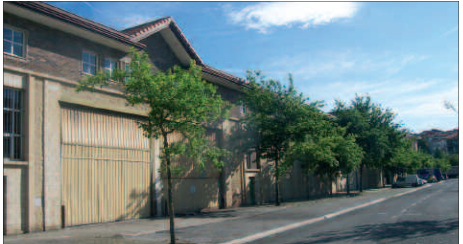
INGURUKO ENPRESETAN ERE NABARMEN IGARRI DIRA KRISIAREN ONDORIOAK. ERREGULAZIO ESPEDIENTEAK ZABALDU DIRA, EKOIZPENA ETEN, ALDI BATERAKO LAN KONTRATUAK ETEN...

-Akaba (Lasarte-Oria): 63 langile ditu. Abenduko eta uztaileko aparteko soldatak ez dituzte kobratuko. Soldatetan %5eko jaitsiera aplikatuko zaie. Aldi baterako langileak kalean daude.