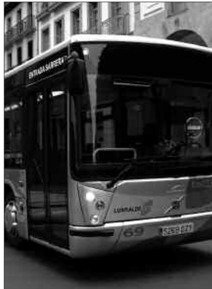
TSST AUTOBUS KONPAINIAK OSATUKO DU FORU ALDUNDIAK MARTXAN JARRI DUEN LINEA BERRIA.

Ostiral honetan, maiatzak 15, sartuko da indarrean zerbitzu berria. Usurbilen, Bordatxo parean geratuko da autobusa. Zerbitzua TSST enpresak eskainiko du (www.tsst.info, 943 361 741). Azpian dituzue ordutegiak. Larunbat eta igandeetan, aldiz, orain arteko ordutegia izango du Zubietara hurbiltzen den autobusak.