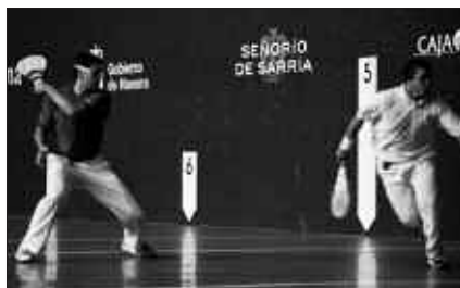
MAIATZAREN 25EAN BILERA EGINGO DA, 20:00ETAN SUTEGIN.