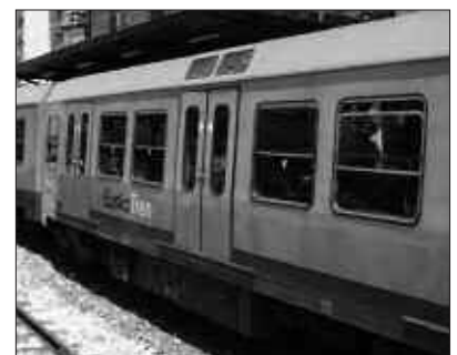
ALDAKETAK USURBIL ETA ORIOKO GELDIALDIEI ERAGITEN DIE, ETA ZUMAIARAKO NORABIDEAN BAKARRIK.

Aurkako noranzkoan, Donostiarantz, indarrean zeuden orduetan ateratzen jarraituko dute trenak. Aldaketa horren arrazoia EuskoTrenek Aia/Orión eraikiko duen trenbide saihebidetaren berriaren lanak.