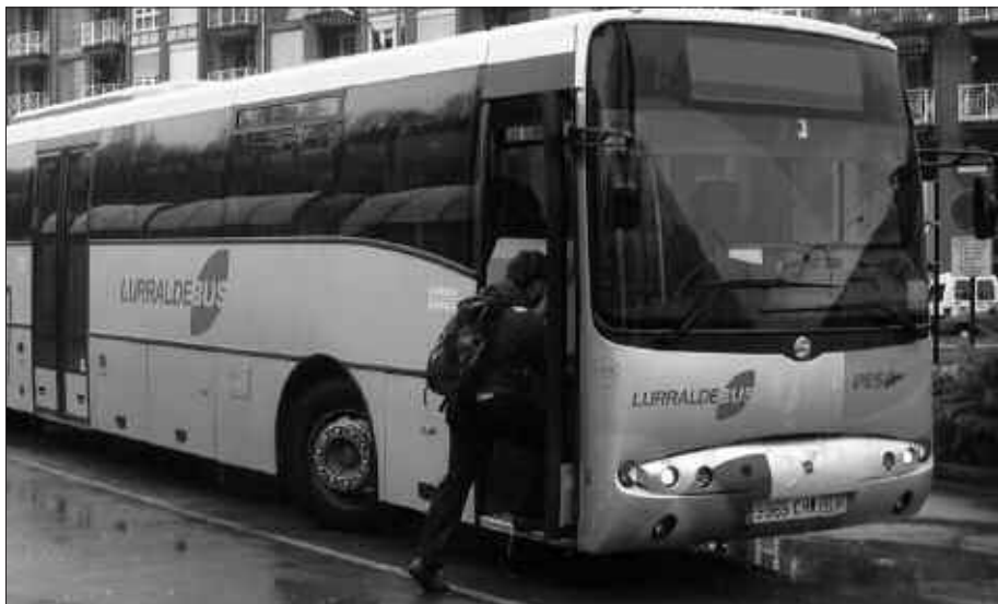
408.707 EUROKO INBERTSIOA EGINGO DU FORU ALDUNDIAK.

Usurbil-Astigarraga artekoa, era honetan: Usurbil-Txikiardi-Urbil-Belartzako errotonda-Lasarte-Oriako errotonda nagusia- Errekalde-