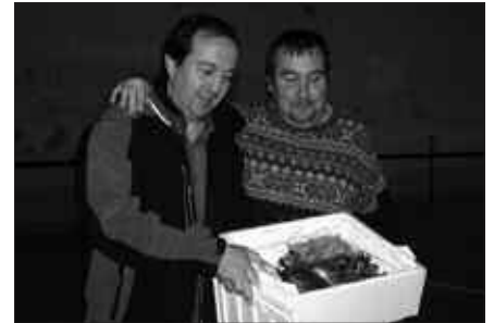
949 ZENBAKIDUNA, ANTTON EGILETA SARITUA.

Santxo-Lopetegi bikoteak 22-10 irabazi zuen Zaramagako taldearen aurka. Portu-Urruzola bikoteak, ordea, galdu egin zuen Orioren aurka; 22-17 azken emaitza.