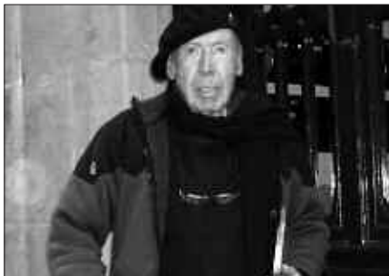
MIKEL LABOAK HARREMAN ESTUA ZUEN USURBILGO HERRIAREKIN.

Aurreko astean Kultura Aholku Batzordea bildu zen udaletxean. Alkatzaren ekimenez, Mikel Laboa omentzeko proposamena aztertu zen. Ekitaldia aurrera eramateko hainbat egitasmo azaldu ziren eta batzarrak begi onez ikusi zuen proposamena. Mikel Laboaren senideek ere hartuko