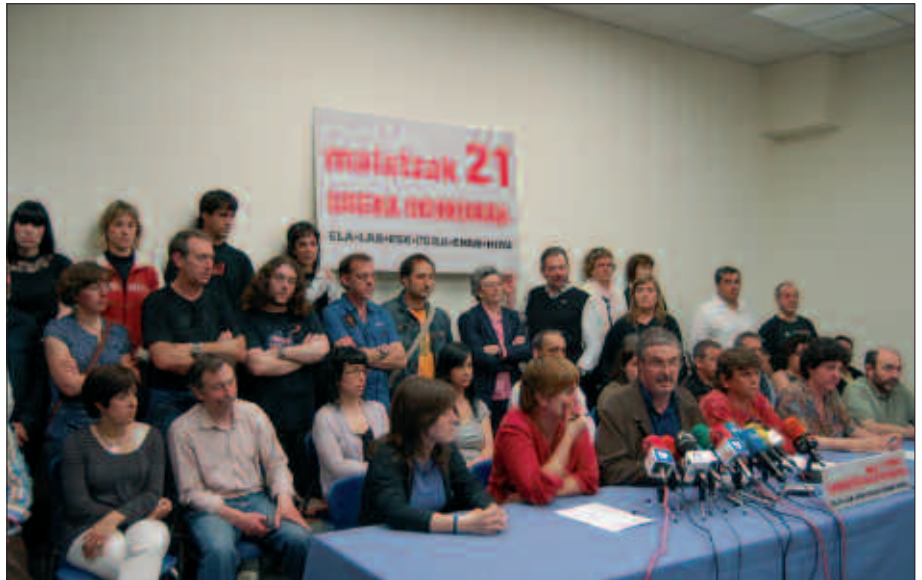
ELA, LAB, ESK, STEE-EILAS, EHNE ETA HIRU SINDIKATUEK EGIN DUTE MAIATZAREN 21 EKO GREBA DEIALDIA.

Aurreko hilabeteko zifrekin alderatuta, igoera apur bat baretu dela esan liteke, %0,7-an gehitu baita langabezia-tasa. Aldiz, duela urtebeteko egoeraren pare jarrita, igoera ezin nabar-menagoa da. Hain zuzen, 2008an egun baino 55.897 langabetu gutxia-