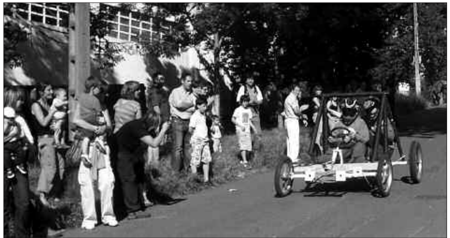
GAZTE EKIMENAREN DEIALDIA. GOITIBEHERA SAIOA ANTOLATZEKO ASMOA DUTE. JAITSIERAN PARTE HARTZERA GONBIDATU NAHI DITUZTE HERRITARRAK. AURRERAGO AZALDUKO DUTE ZEIN EGUNETAN EGINGO DEN JAITSIERA.

- Sariak: lehenak, 200 euro eta txapela. Bigarrenak, 150 euro. Hirugarrenak, 100 euro.