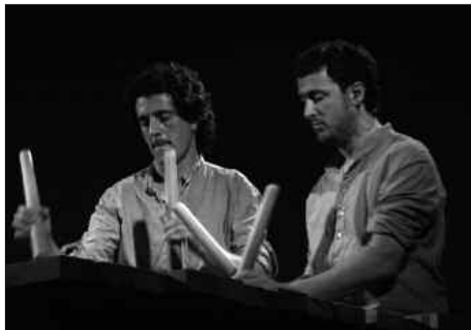
OREKA TX TALDEKOAK “NÖMADAK TX” IKUSKIZUNA ESKAINI ZUTEN DIARDO KIROLDEGIAN.

ri izandakoak goreseteko balio izan zuen. Saio amaieran, Mikel Laboa eta Jean Paul Harreguyren senideek oroigarri bana jaso zuten. Ez Dok Amairu taldeko sortzaileak izan ziren biak eta iaz zendu ziren.