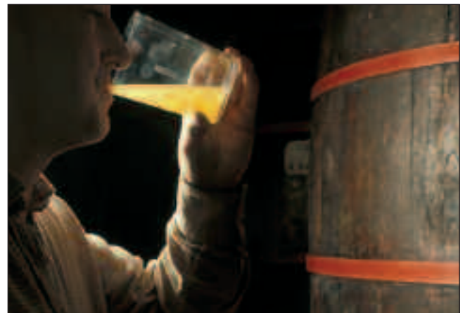
DASTAKETA OSTIRAL HONETAN EGINGO DA, MAIATZAK 22.

Honako menua dastatuko dute afarian: ahate "mousse"-a, onddo nahasia, legatza saltsa berdean, saiheskia patata eta piperrekin, postrea. Edaria eta kafea barne, guztia, 25 euroren truke.