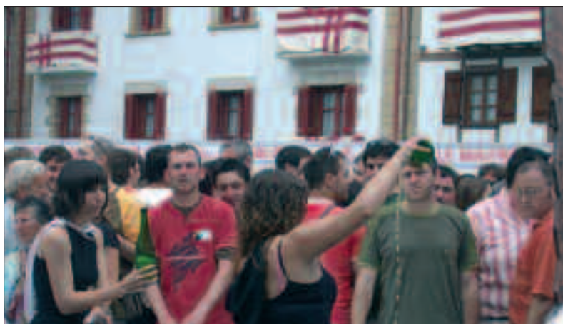
45 IZANGO DIRA IGANDEAN BILDUKO DIREN SAGARDOGILEAK.

H ogeita zortzigarren edizioa ailegatuko da igandean, Sagardo Eguna. Urteetan aurrera doa bai, baina beste behin, betiko indarrarekin eta bertaratzen direnei ahalik eta harrera onena egiteko prest dator maiatzaren 24an. Pilotaleku zein Dema plazan kokatuko diren 45 sagardogileren postuetatik barrena osteratxo ederra egin ahal izango da. Zentzumen guztien gozamerako.