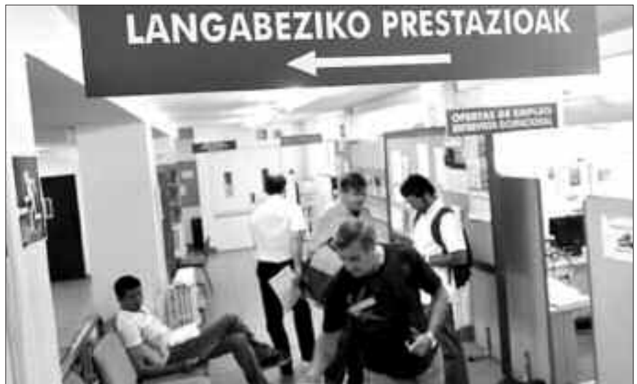
2009KO MARTXOAREN 31N, INEM BULEGOETAN 275 USURBILDAR ZEUDEN IZENA EMANDA. HONEK, %10EKO LANGABEZIA TASA SUPOSATZEN DU.

N. Une honetan, zenbateko langabezia tasa dago Usurbilen?