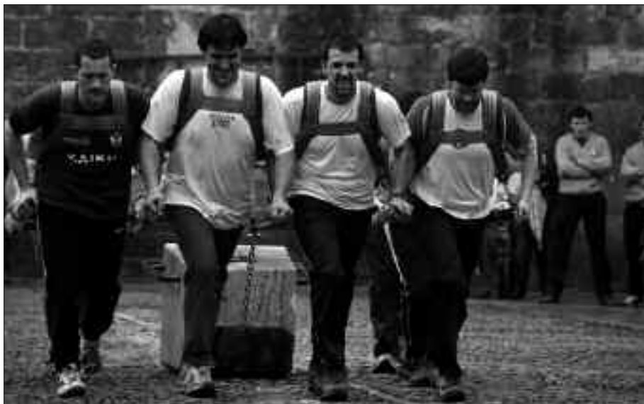
EKAINAREN BUKAERAN BERRIZ EGINGO DA GIZON-DEMA SAIDA.

Pilota partidak ere izan ziren maiatzaren 15eko ospakizunetan. Eta ohi bezala, meza nagusia eta gero Andatzpekoak hamaiketakoak banatu zuten frontoi inguruan bildu zirenen artean.