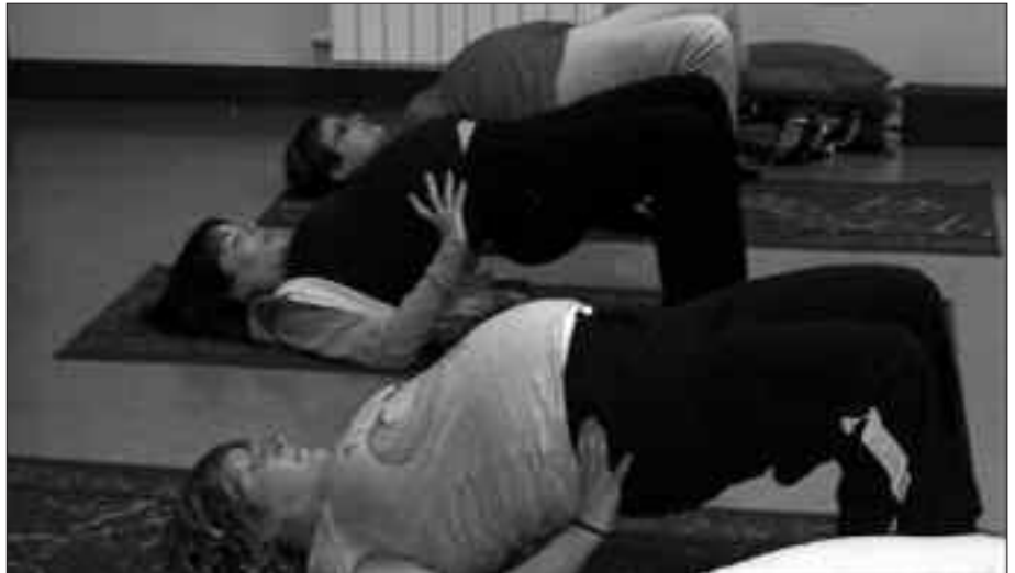
ARNASKETA EDOA ARIKETA FISIKOA DIRA YOGA IKASTARO HONETAN LANTZEN DIREN JARDUERAK.

A. L. Guretzat oso ona da. Beti erditze aurreko klaseen zain daude. Nire esperientzia pertsonalaren arabera, ordu eta erdiz haurdunaldiaz hitz egiten eta agerian dauden gorputzeko aldaketek aritzen gara. Ez dakit zer ekarpen egiten didaten. Ez dizute erditze unerako prestatzen. Ez ditugu arnasketa saioak egiten, ez ditugu posturak lantzen, hitz