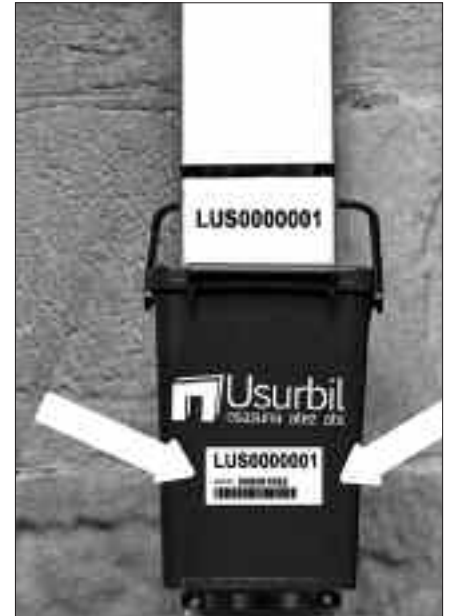
GUTUN BIDEZ, BI PEGATINA BANATUKO DIRA. PEGATINAK BI KUBO MARROIETAN ITSATSI BEHAR DIRA.

Zorion mezua herritarrentzat %28tik %76ra igo da birziklatzearen ehunekoa Usurbilen, lau asteren buruan. Etxebizitzetara bidaliko den eskutitzean, herritarrek burututako lana eskertu nahi du Udalak, eta emaitzagarri zoriandu.