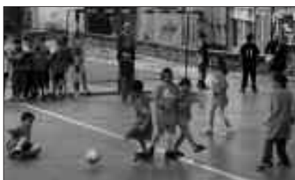
TALDE BAKOITZAK 40 EURO JARRI BEHARKO DITU, GASTUEI AURRE EGITEKO.

Txapelketako gastuei aurre egiteko, talde bakoitzak 40 euro jarri beharko ditu.