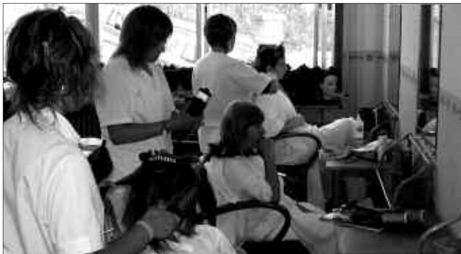
USURBILLEN BI ESPEZIALITATE ESKAINIKO DIRA: SUKALDARI-ZERBITZARI LAGUNTZAILEA ETA ILE-APAINKETA-EDERGINTZA LAGUNTZAILEA.

Bigarren ikasturtea, sakontze ikastaroa, 2010eko urrian hasi eta 2011ko apirilean amaitu. Guztira: 700 ordu.