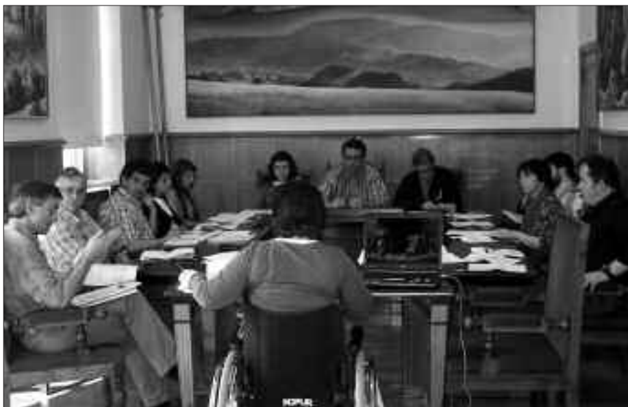
AZKEN OSOKO BILKURAN ONARTU ZIREN ZOZKETA GARAIAK KONTUAN HARTU DIREN ZERRENDAK.

M aiatzaren 12ko ezohiko osoko bilkuran datorren ekainaren 7an burutuko diren europar parlamenturako hauteskunde egunerako mahaikideen zozketa egin zen. Martxoaren 1ean, EAEko hauteskunde eguneko mahaian egotea egokitu zitzaizen herritarrek zozketatik kanpo utzi ditu Udalak.