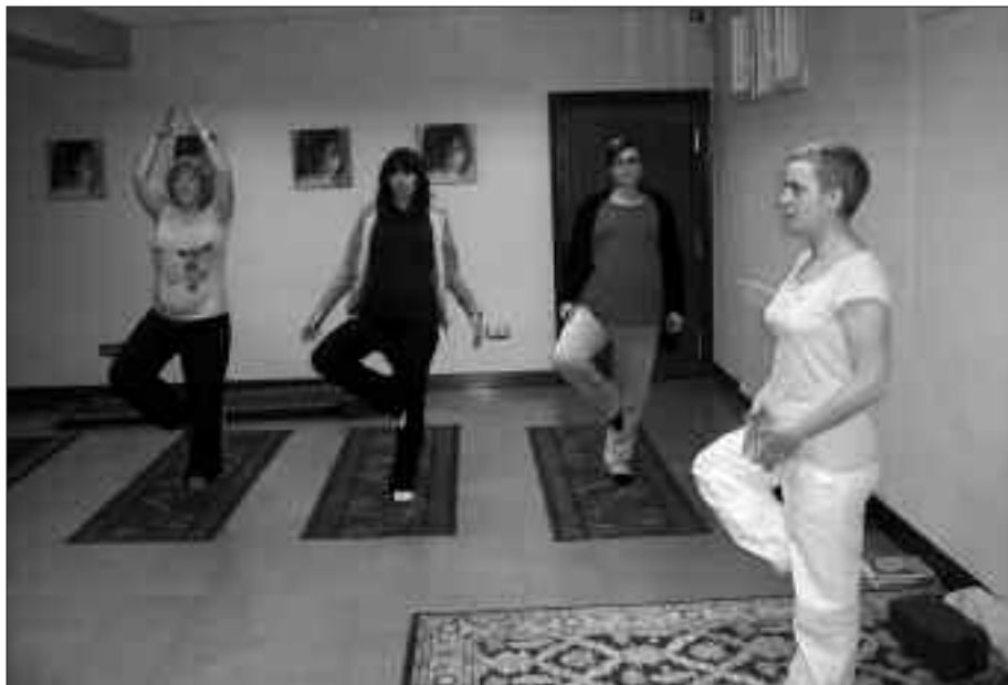
SANTUENENKO ELKARTEAN BILTZEN DA YOGA TALDE HAU. HAURDUN DIREN HAINBAT HERRITAR YOGA EGITEN HASI ZIREN URTARRILEAN.

I. O. Gutxi gorabehera haurdunaldiaren hirugarren hilabetetik aurrera, une ona da. Haurdunaldiaren hasieran, goragaleak izan ditzakezu. Halakorik