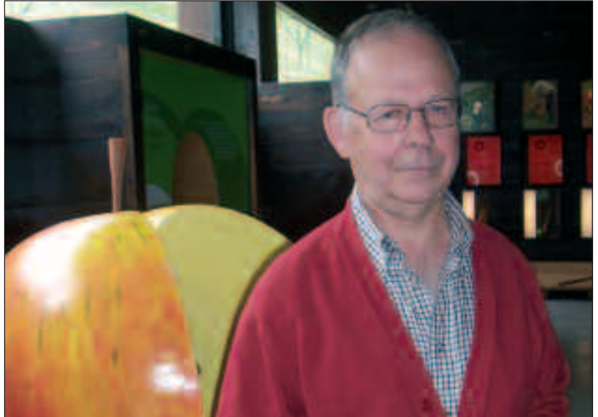
ASTIGARRAGAKO MUSEOAK ARGITARATU DU SAGARDOAREN HIZTEGIA.