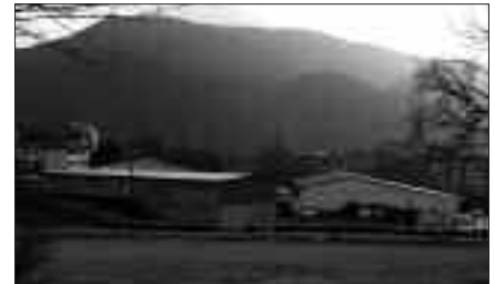
OLARRIONDO ETA UGARTONDOKO (IRUDIAN) EREMUE TAN AURREIKUSI DIRA ETXE BERRIAK.

350etik gora dira Olarriondo eta Ugartondo eremuetan eraikitzeke dauden etxebizitzetako zerrendetan izena emana duten herritarrak. Udaletik jakinarazi dutenez, egin beharreko datu bilketa guztia egin ondoren iritsi da informazioa publikoki helarazteko unea. Datorren maiatzaren 28an, osteguna, kiroldegian bilkura irekia deitu du, herritarrei gaiak orain arte izan duen ibilbidearen eta egungo egoeraren berri, ahalik eta modu argienean emateko. Gutun bidez jakinaraziko zaie zerrendatan izena eman zuten herritarrei.