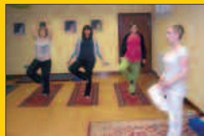
Yoga, erditzea prestatzeko ariketa gomendagarria