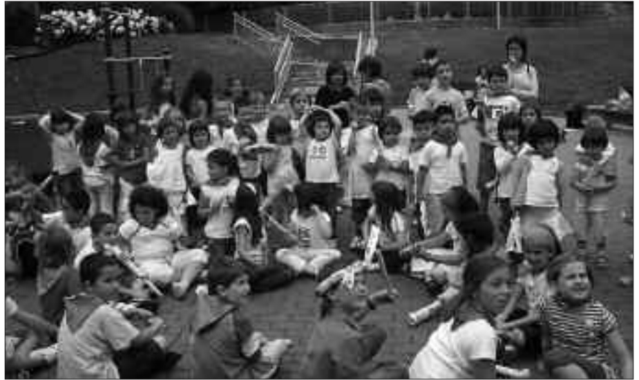
MAIATZAREN 29AN AMAITUKO DA IZENA EMATEKO EPEA. UDAJOLAS, ORDEA, UZTAILAREN 6AN HASI ETA 30EAN AMAITUKO DA.

Izen emateko ordutegia: astelehenetik ostiralera: 17:00-19:00.