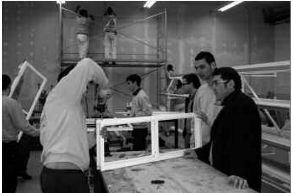
IKASTAROETAN HASI AURRETIK, ORIENTAZIO ZENTRO BATERA JOAN BEHAR DA.

momentu honetan galdaragile-tuberoa lanbidea dago langile premian.