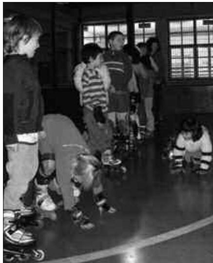
PATINATZEN IKASTEKO AUKERA DAGO LARUNBATEAN ZUBIETAN.

9:00etatik 11:00etara: hastapena 11:30etatik 13:30etara: hobekuntza (ekarri patinak, kaskoa eta babesak).