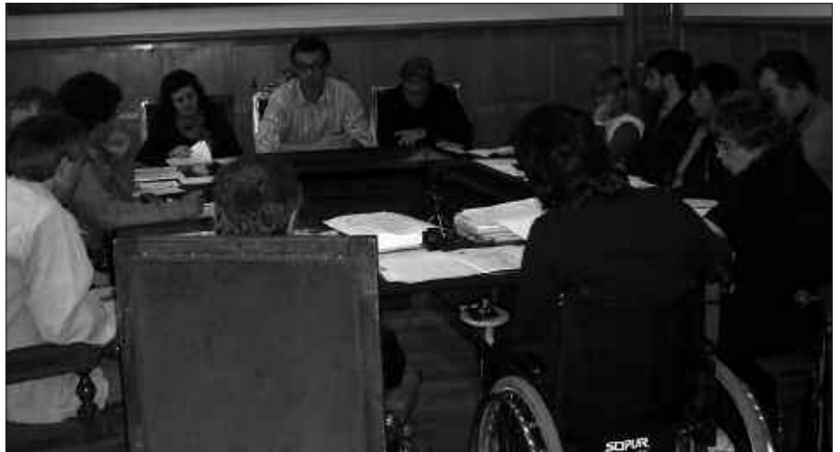
MAIATZAREN 26AN EGIN ZEN AZKEN OSOKO BILKURA.

P asa den maiatzaren 29an gobernu taldeak ingurumen alorreko eragileekin hitzordua zuen Sutegin. Hiri hondakinen kudeaketari lotuta burutuko den galdeketa itxura ematen hastea zen helburua. Hiru egun lehenago egin zen ohiko osoko bilkuran, herritarrei egingo zaien aipatu galdeketa horretako zenbait irizpide finkatu eta onartu zituen udalbatzak; batetik, galdeketa emaitza loteslea izatea eta bigarrenik, herritarrek hartutako erabakia aldatzeko ere bide eta pauso berak erabiltzea, hots, dagokion galdeketa egitea.