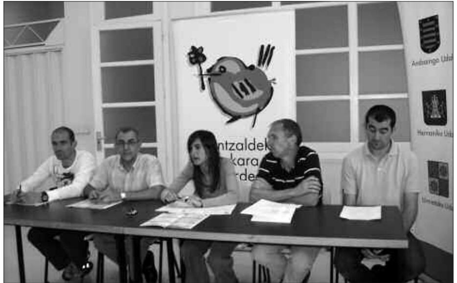
BAILARAKO IKASTETXEETAKO ORDEZKARIAK BILDU ZIREN, HERNANIKO BITERI KULTUR ETXEAN BURUTU ZEN AURKEZPEN EKITALDIAN.

E rdi eta goi mailako heziketa zikloetan aurre matrikulatzeko aukera dago, ekainaren 12ra arte. Epea zabaldu zen egun berean, hilaren 1ean prentsaurrean, Buruntzaldeko udalek DBH-ko ikasketak burutu ondorengo heziketa zikloetan bailaran dagoen ikasketen euskarazko eskaintza aurkeztu zuten. Gertuenetik hasita, Zubietako Lanbide Heziketako eskolan, erdi-mailako bost heziketa ziklotan euskaraz matrikula daiteke. Beste seitan goi-mailari dagokionez. Hezkuntzan euskara bultzatzeko dagoen beharra azpimarratu zen ekitaldian. DBH eta Batxilergoetan ez bezala, Heziketako Zikloetako ikasleen %30-35 artean matrikulatzen baita egun D ereduan.