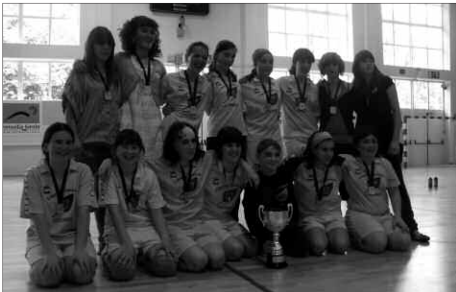
IGANDEAN, FINALA IRABAZI ETA GERO POZ-POZIK ZEUDEN JOKALARIAK.

U surbil KE eskubaloit taldeko neskek protagonistak izan dira ikasturte honetan. Baina atzetik datozenak ere oso ondo ari dira. Harrobia, beraz, ziurtatuta dago. Izan ere, Udarregi ikastolako alebinak denboraldi ederra osatu dute. Pasa den igandean, alebin mailako Gipuzkoako finala jokatu zen Bidebieta kiroldegian, Donostian. Aurrez aurre, Urnieta eta Usurbilgo Udarregi taldea. Bertan izan zirenek azaldu digutenez, partida bikaina jokatu zuten usurbildar gazteek eta horri esker urrezko domina eskuratu zuten. Beraz Gipuzkoako Txapelketa irabazi eta gero, denboraldi bikaina osatu dute Udarregiko neskek. Zorionak!