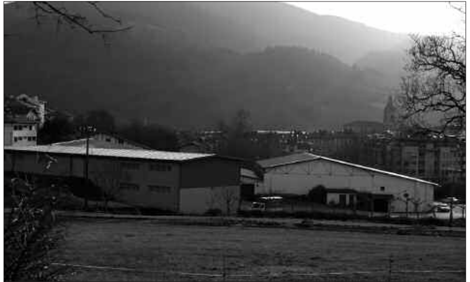
UGARTONDOKO EREMUAN AURREIKUSITA DAUDE HAINBAT ETXE.

K risia gainditzea, lurjabeak diren promotoreek euren artean edo Udala aipatu sustatzailerekin adostasunen batera ailegatzea, horiek dira egungo egoera gainditu eta aurrera egiteko etxebizitza egitasmoei buruzko bileran mahai gainean jarri ziren irtenbideak. Egoera zaila izan, eta honenbestez, gaur egun aipatu hiru alternatiba horiek gauzatzea erraza izango ez dela aitortu ostean, esperantza puntu bat ematen dien laugarren irtenbide bat ere mahai gaineratu zuten hizlariak maiatzaren 28ko bilkuran; egoera bideratzeko inizatiba bere gain hartuko lukeen agente urbanizatzaile bat jartzea.