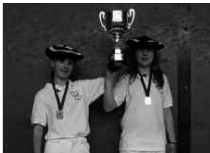
USURBILGO BI NESKA GAZTEAK, FINALA IRABAZI BERRITAN.