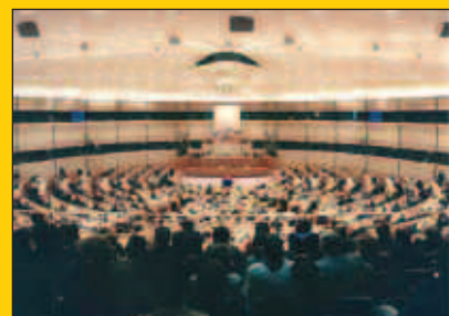
Europako Legebiltzarra aukeratzeko hauteskundeak