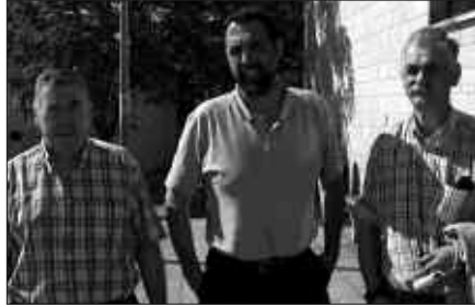
GURE PAKEA ETA KIROL PATRONATUKO KIDEAK, EKIMENAREN AURKEZPENEAN.

Ekainaren 14an Ikastolaren Eguna ospatuko da. Baina baita "Kirolari atek zabalik" izeneko eguna ere. Hala ere, biak osagarri egin asmoz, Kirol Patronatuak goizez egingo du ekitaldia; Txokoaldeko paseoa. 9:00etan abiatu kiroldegitik eta 11:00etarako Artzabalen izango dira bueltan. Hartara, animatzen direnek, Ikastolaren Egunean ere parte hartzeko aukera izan dezaten.