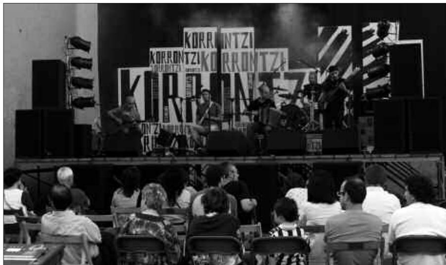
PASA DEN LARUNBATEAN FRONTOIAN ARITU ZIREN KORRONTZI TALDEKOAK.

Aurretik, Kantu Taldekoak aritu ziren kalejiran. Eta 20:00ak aldera hasi zen Korrontziren saioa.