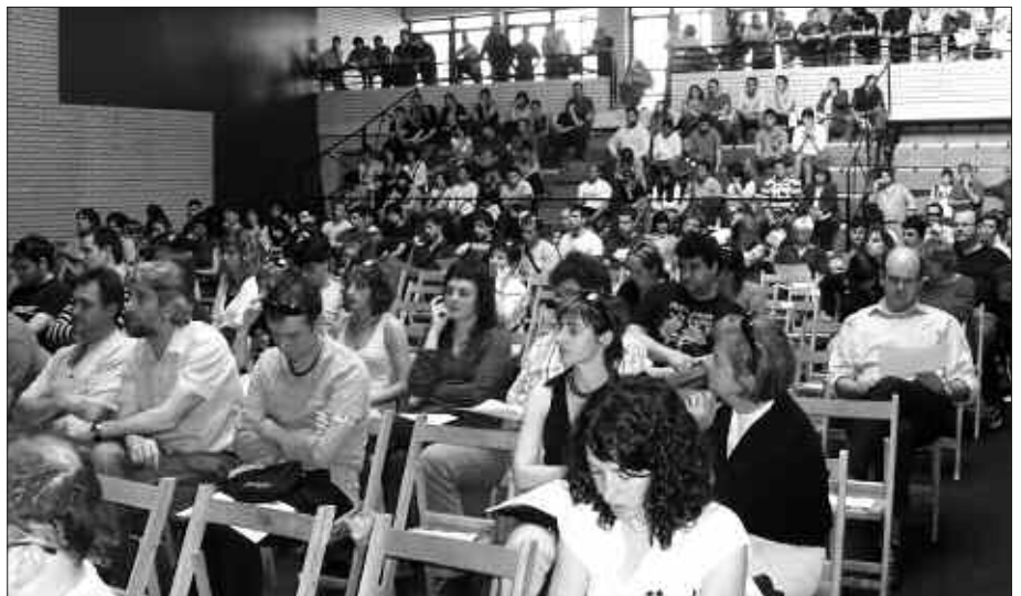
KIROLDEGIAN EGIN ZEN BATZARREAN JENDE ASKO BILDU ZEN. EUREN ZALANTZAK AZALTZEKO AUKERA IZAN ZUTEN.