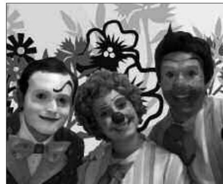
LARUNBAT HONETAN, 17:30EAN FRONTOIAN ARITUKO DIRA PAILAZOAK.

Bederatzi esketx dibertigarritz osatzen da "Bihurrikeriak" ikuskizuna. Eta esketx horiekin tartekatuta, abesti ezagunak eskainiko dituzte: "Txirri, Mirri eta Txiribiton", "Sudur gorria", "Paristik natorren" ... Emanaldiaren amaieran, "Zapi zuria" eta "Altza Pelipe!" kantuak abestuko dituzte.