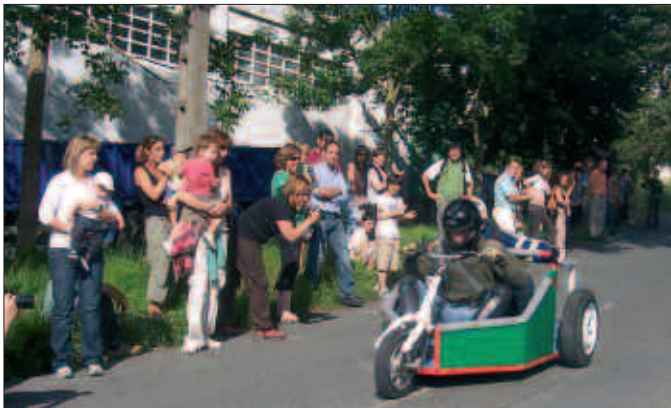
UZTAILAREN 2AN, SANTIXABEL EGUNEAN, ORGANDAREN INAUGURAZIOA EGINGO DA MEZA NAGUSIA ETA GERO. GARAI HORRETAN ABIATUKO DA UMEEN DANBORRADA. ARRATSALDEZ EGINGO DA II GOITIBEHERA LEHIAKETA.