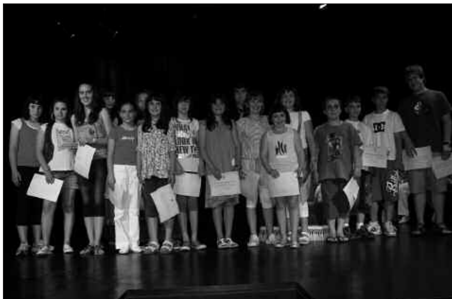
LEHIAKETAN SARITUTAKO GUZTIAK, SUTEGIKO OHOLTZA GAINEAN.

Sarituak zeregin bikoitza izan zuten; Sutegiko auditorioiko oholtza gainera igo, zegokion saria jaso eta saioko aurkezleak sarituak prestatutako idazlanari buruz egindako galderei erantzutea. Zenbait egileek, euren testuak ere errezitatu zituzten. Lan guztiak, gerora bilduma batean jasoko dira. Iazko literatur