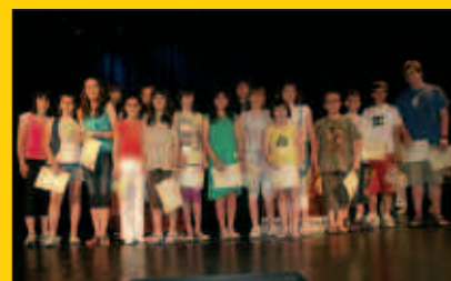
Felix Aizpurua literatura lehiaketako sari banaketa