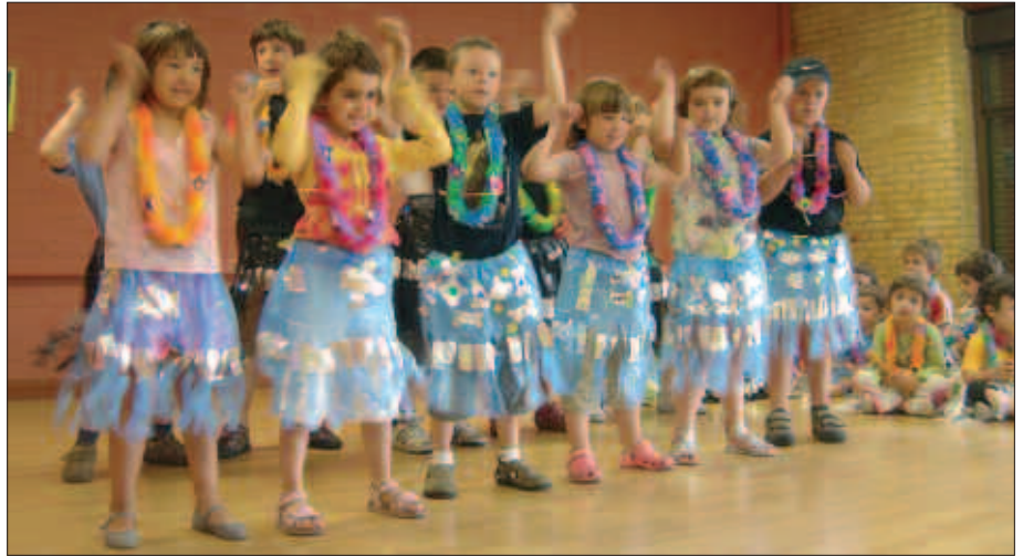
ZUBIETAKOEK DANTZA AFRIKARRA ESKAINI ZUTEN.

Aginagako Eskola Txikiak esan digutenez, "oso giro ederrean eta alaiean ospatu ziren topaketak eta ikasle eta ira-