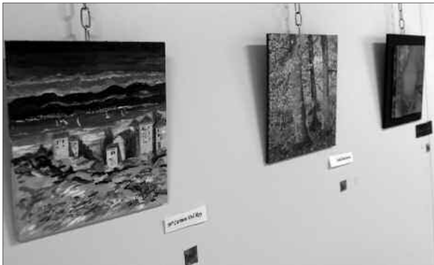
BI ARTELAN EURO BATEAN ESKURA DAITEZKE. HORRETTARAKO TONBOLA MODUKO BATEAN PARTE HARTU BEHAR DA. ZOZKETA, IGANDEAN.

Igandera arte zabalik egongo da, Barrenkalen udaletxe ondoko erakusketa aretoan: ostiralera arte, 18:30-20:30 artean, larunbatean 12:00etatik 14:00etara eta 18:30-20:30 artean. Igandean goizez, 12:00-14:00 artean.