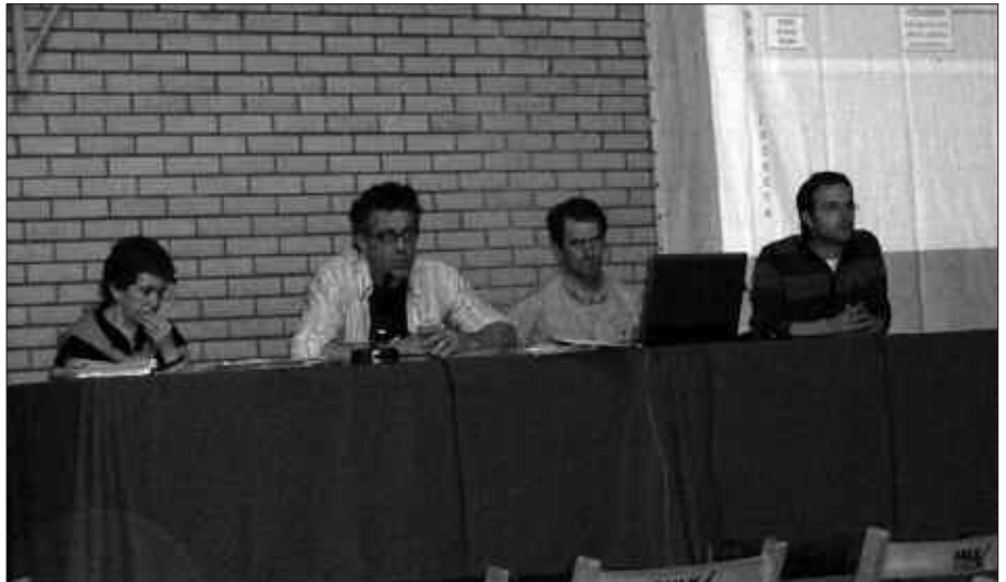
KIROLDEGIAN EGIN ZEN BILKURAN HERRITARREK EUREN ZALANTZAK ARGITZEKO AUKERA IZAN ZUTEN.

Bide posible bat zein zen argitu zuen alkateak: “gastuak sortzea”. Edozein kasutan, egungo egoera gainditzeko esperantza apur bat eman dezakeen irtenbide bakarra, hirigintza alorreko agentea jartzea litzateke alkatearen ustez (Eusko Jaurlaritzako Etxebizitza Sailarekin elkarlanean, egitasmoa aurrera eramateko ardura bere gain hartuko lukeen agente urbanizatzailer bat jartzea).