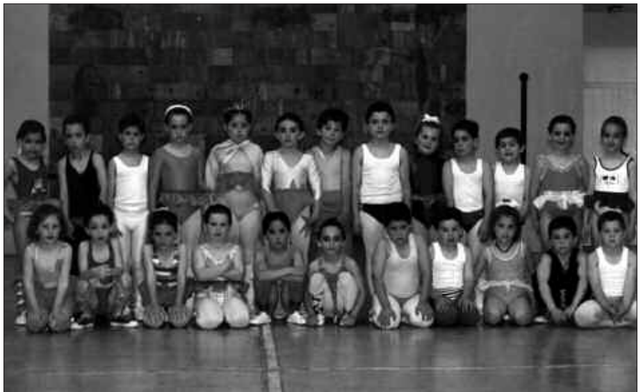
1996AN, ZIRKOA IZAN ZEN IKASTOLAREN EGUNERAKO IKASLEEK PRESTATU ZUTEN JAIALDIA.

Igandeko emanaldia berezia izango da ordea. Aipatu jaialdia antolatzen hasi zirenetik hogeitau urte beteko baitira aurten. “Urte guztietako onena hartuta osatu dugu aurtengoa”, diote emanaldi hau buru-belarri prestatzen