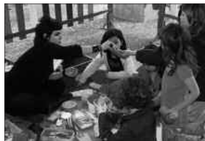
EKAINAREN 5EAN OSPATU ZEN INGURUMENAREN NAZIOARTEKO EGUNA.

Irtenbide gisa planteatu ohi diren energia berriztagarriek ere bere tartea izan zuten. Tailer baten bidez, berote-