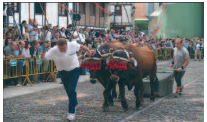
UZTAILAREN 5EAN, HERRI KIROL UGARI IRAGARRI DIRA: BINAKAKO AIZKOLARI TXAPELKETA, EMAKUME HARRIJASOTZAILE TXAPELKETA, HARRI HANDIEN GIZONEZKO TXAPELKETA, IDI-DEMA... ETA IAZ BEZALA, ZALDI LASTERKETA.