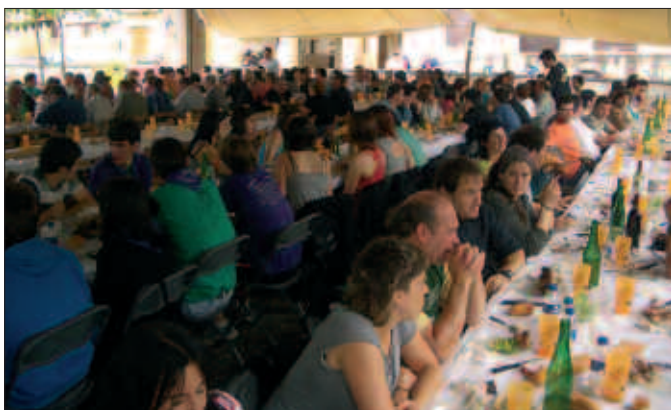
UZTAILAREN 4AN, GOIZETIK JOLASAK GAZTETXOENTZAT DEMA PLAZAN, KIROLDEGIAN ETA DEMA PLAZAN. EGUERDIAN, ZIKIRO JANA TXOSNETAN. EGUNEAN ZEHAR ETA BERTSO SAIDAN ERE, ERREPRESALITUAK IZANGO DITUZTE GOGOAN.