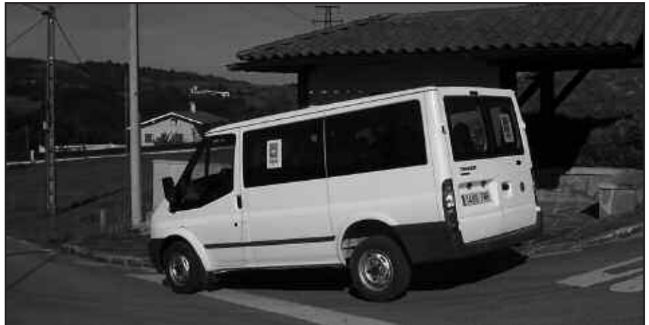
ABUZTUAN ZERBITZUA ETEN EGINGO DA, EZ DA BUS-TAXIRIK IZANGO. ETA UZTAILEAN, GOIZEZ IBILIKO DA SOILIK; AZKEN ZERBITZUA, 13:00ETAN ESKAINIKO DA. ARRATSALDEETAN EZ DA BUS-TAXI ZERBITZURIK IZANGO.

eta Behemendik elkarlanean martxan jarritako garraiabidea baliatzen dutenen artean, 50-80 urte arteko emakumezkoak daude, baita gizonezko batzuk ere. Oro har, astean behin edo bitan erosketak egin, medikua bisitatu, bankura joan edota beste zeregin batzuetarako tarte hartzen dutenak izango liriteke. Halako kasuetan zamarekin egin behar izaten dute joan etorria, eta batzuk euren etxeetara bila joateko eskaera egin izan dute.