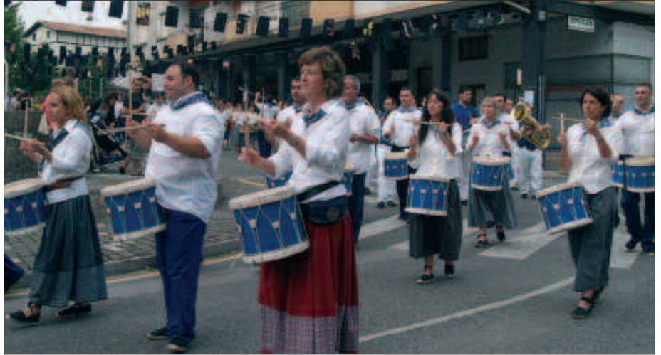
UZTAILAREN 1EAN. BURUHANDIEKIN ETA MASKOTA IGBTZEAREKIN BATERA HASIKO DIRA FESTAK 19:00AK ALDERA. ORDU BEREAN, HELDUEN DANBORRADA ABIATUKO DA ETA ASKATASUNA ETA ARTZABALGO TXOSNAK ZABALDUKO DIRA.