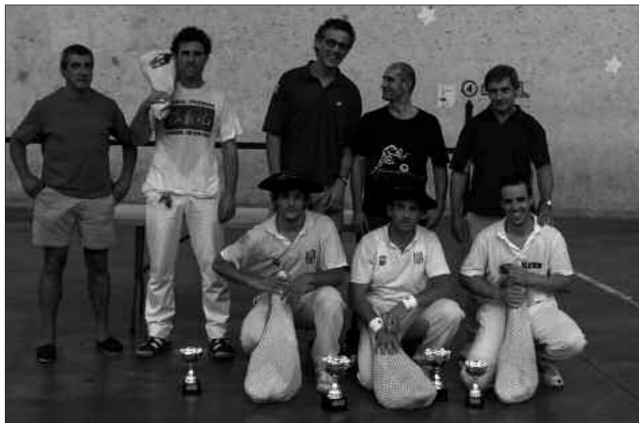
FINALEAN LEHIATU ZIREN BI BIKOTEAK, SARIK ESKUETAN DITUZTELA.

Nesken arteko partidak jokatu ziren eta, lehen aldiz, ezinduen arteko erakustaldiaz gozatzeko aukera izan zuten frontoian bildu zirenek.