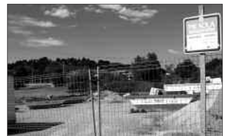
TAMAINA HANDIKO GAIAK UZTEKO BALIATU DAITEKE PIKAOLAKO EREMUA.

Pikaolako gunea tamaina handiko gaiak uzteko balia daitekeela; hala nola, etxetresna elektrikoak, altzariak, lanetako hondakinak, inausketak... Aipatu materialak hara eramateaz gain, behar duenak bertatik ere zer hartua izango du. Etxean konpostajea egiten ari diren herritarrari organikoari nahasteko gai lehorrik falta bazaio, Pikaolatik har dezake.