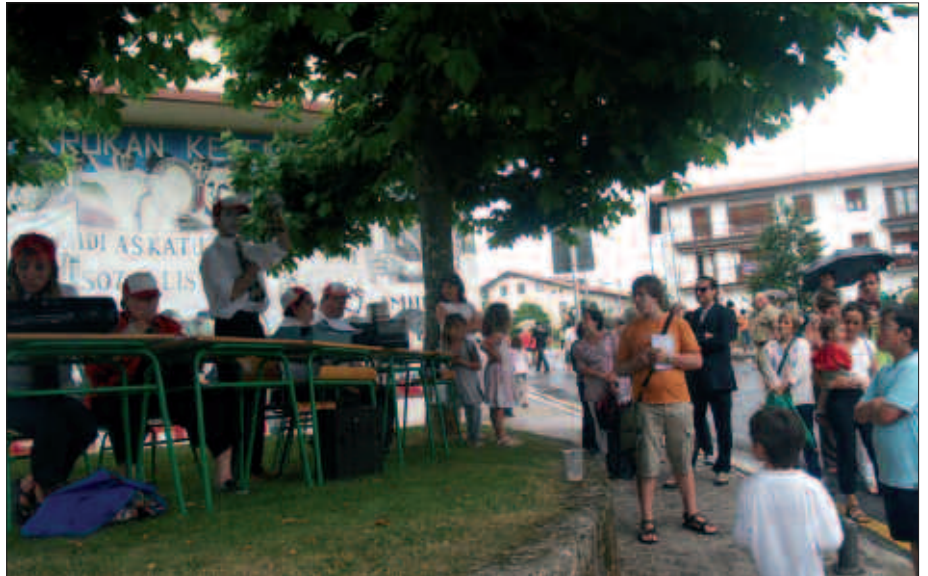
TXERRIKIKOEK HERRIKO ALBISTEEN BERRI EMAN ZUTEN, MIMO BATEN LAGUNTZAZ.

Inork gutxi zekien zer gertatuko zen kalejiran zehar. Egia esan, ez zen espero