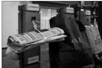
AZKEN OSOKO BILKURAN ONARTU ZEN HERRI GALDEKETARAKO GALDERA.

Hala ere, herri galdeketa proposamena, mantso bada ere, aurrera doa. Nekazaritza eta Ingurumen batzordean landu zen duela aste batzuk eta, azken