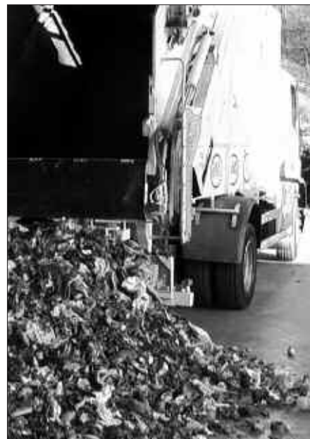
ATEZ ATEKO INFORMATZAILEENA BEZALA, BILTZAILEEN LANA ERE GARRANTZITSUA IZATEN ARI DA.

A. M. Atez atekoaren egitasmoaren barruan zati garrantzitsuak daude;