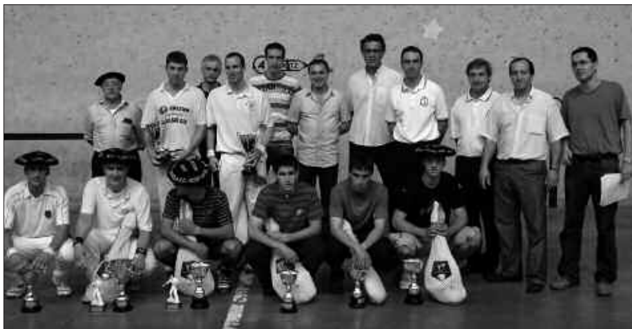
FINALETAKO JOKALARIAK, ANTOLATZAILEAK ETA UDAL ORDEZKARIAK, SARI BANAKETAKO EKITALDIA ETA GERO.