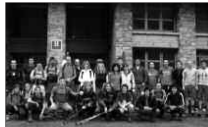
IAZ, ANDATZAKOAK EGINDAKO IRTEERAREN ARGAZKIA.

Irteerara joan nahi duen orok 50 euro jarri beharko ditu (autobusa, ostatuan gaua pasatzea, afaria eta gosaria ordaintzeko).