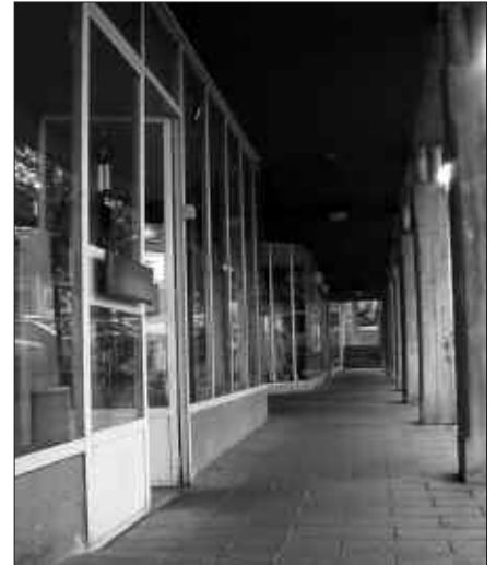
MERKATARITZARI BURUZKO DATU BERRIAK EMANGO DIRA UZTAILAREN 16AN EGINGO DEN BILERAN.

Bilera garrantzitsua izango da, orain arte ezagunak ez ziren merkataritzaren egoerari buruzko datu berriak emango direlako eta plangintza honen diagnostiko fasea guztiz bukatua uzteko, bilerara bertaraten direnen iritziak eta proposamenak ere kontuan hartuko direlako.