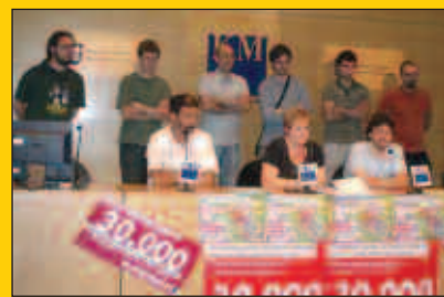
Sinadura bilketa ospatzeko, jaia Zubietan