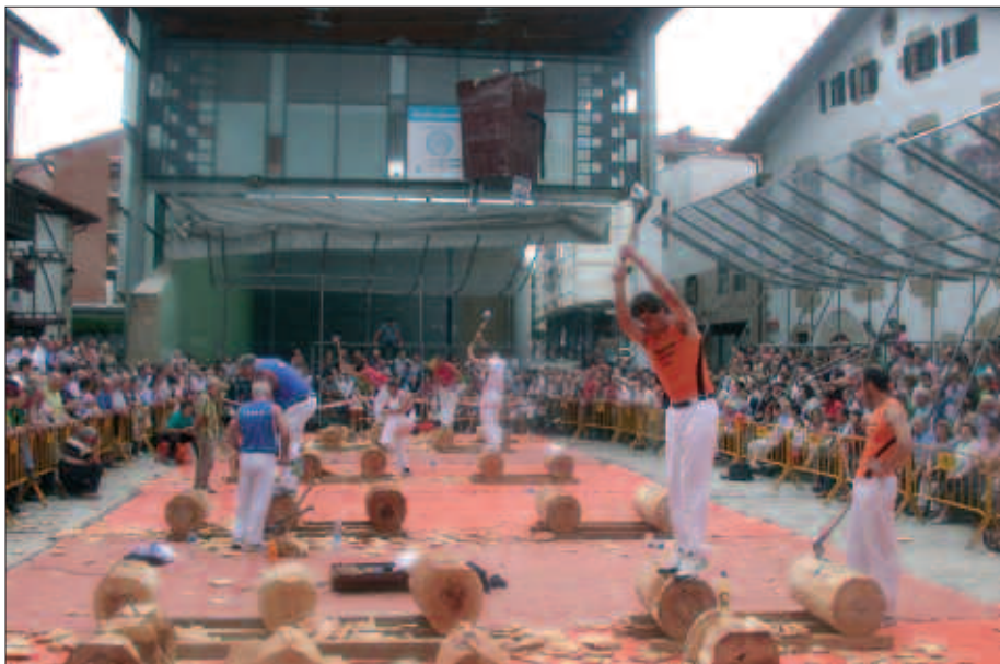
JENDETZA IBILI DA EKITALDI GUZTIETAN, BEREZIKI, ASTEBURUAN.

Arratsaldeko bostetan taberna inguruetan bildu izan ohi den jendetza, Santixabel jaietako goizaldeko ordu berean kalean zebilen parrandazale kopuruarekin alderatzen duenik izan da. Gauzez ibili baita jendea bertso saio, batukada edota musika emanaldi desberdinetatik gertu. Baita egunez ere. Ikusi besterik ez, Haurren Eguneko ekitaldiak, frontoian, Dema Plazan, jaietako ekitaldi desberdinak ospatzeko berreskuratu den udaletxe aurreko plazan edota Udarregi ikastolakoan izan duten arrakasta.