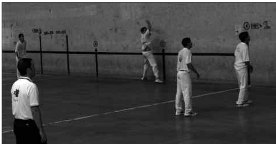
KIROL TALDEEK EGINDAKO LANA ZORIONDU NAHI DU UDALAK.

Denboraldi hasierako duda-mudak gainditu ondoren, herriko neska mutilek futboleko aritzeko aukera izan dute. Futbolariak gauzak txukunago egiten