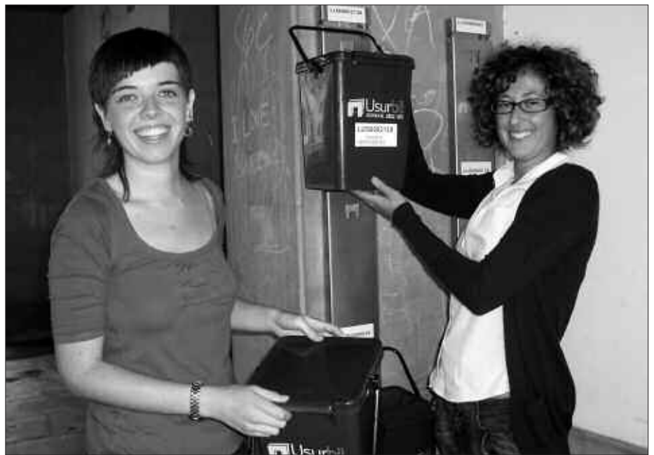
ATEZ ATEKO INFORMATZAILEAK, KUBOAK ESKUETAN DITUZTELA.

I. P. Azterketak bi helburu ditu. Batetik jarraipena egitea, konpostatzen ari diren gehienak berriak dira eta apur bat galduta daude. Ondo ari diren jakin nahi dute, arazoren bat edo beste sortu