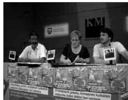
AURREKO ASTEAN EGIN ZUTEN PRENTSAURREKOAN IRAGARRI ZEN ZUBIETAKO FESTA.

Dena ez da lana izango. Sinadurak biltzen egindako lana eskertzeko, festa