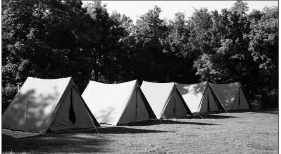
INOIZ BAINO HAUR ETA GAZTE GEHIAGO ANIMATU DIRA AURTENGO KANPALDIETARA.

Larunbatean, uztailearen 11n, A gripea zuela baieztatu zuten Errioxako osasun arduradunek. Albistea jaso eta