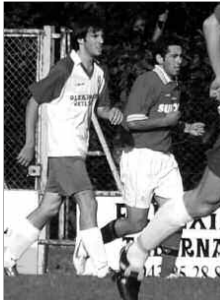
10 EUROREN TRUKE EDONOR IZAN DAITEKE USURBIL FT TALDEKO BAZKIDE.

Bazkideei, egindako ahalegina eskertzeko, Usurbil FTko zuzendaritzak jarduera ezberdinak antolatuko ditu denboraldian zehar: ume eta helduen jokoak Haranen edota zozketak.