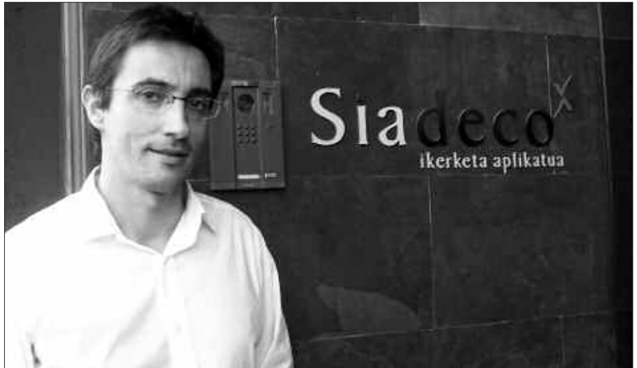
SIADeco ARDURATU DA MERKATARITZAREN DIAGNOSTIKOA EGITEAZ.

J. A. Eskaintza eta eskaria aztertzea. Eskaintza aztertzeke, Usurbilgo 100 establezimendutako arduradun eta langileak elkarrizketatu ditugu. Euren iritziak, beharrak eta proposamenak eza-gutzea izan da urratsetako bat. Eskaria aztertzeke berriz, zoriz aukeratutako Usurbilgo 400 etxebizitzetako herritarrekin lagin batekin lan egin da. Horri esker usurbildarren erosketa ohiturak zein diren ezagutu dira. Ikerlan horrek esango digu zein diren herriko komertzioaren indar gune eta hutsuneak,