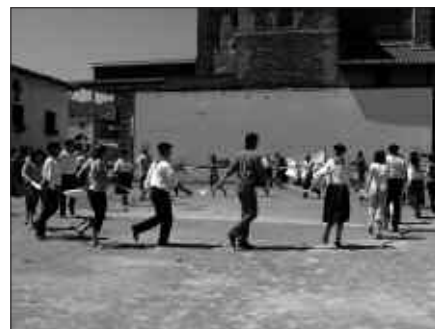
UZTAILAREN 24TIK 31RA LUZATUKO DIRA SANTIO JAIK ZUBIETAN. JARRAIAN, JAIEN LEKUKOA URDAIAGAKOEI EMANGO DIETE.

U ztailaren 24an, Santio bezperan murgilduko da Zubietako jai giroan. Herri afaria eta Kupelaren emanaldiak, astebete iraungo duten Santio jaiak hasiera emango diete.