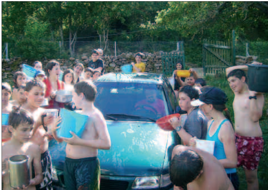
ZIORTZAKO KANPALDIAN EDERKI IBILI DHI DIRA. ARGAZKIA IAZKOA DA.

Errioxako osasun arduradunek uneoro gomendatu diete Ziortzakoek kanpaldiarekin jarraitzeko, egoera kon-