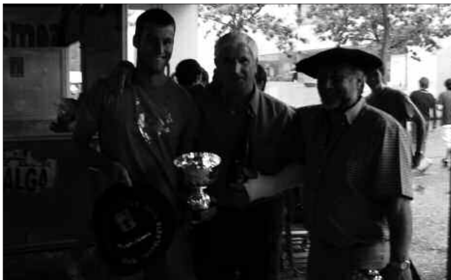
IRUDIAN, JAIETAKO MUS TXAPELKETAKO GARAILEAK ETA AGIRRETXE FUTBOLARIA.

Batzuentzat zein besteentzat, festen ebaluazio bilera antolatu da. Hitzordua, datorren asteartean, uztaileak 21, 19:00etatik aurrera Udaletxean. Ekitaldi irekia izango da, beraz, aipatu bezala edonork parte har dezake, igaro berri diren Santixabelak ardatz izango dituen bilkuran.