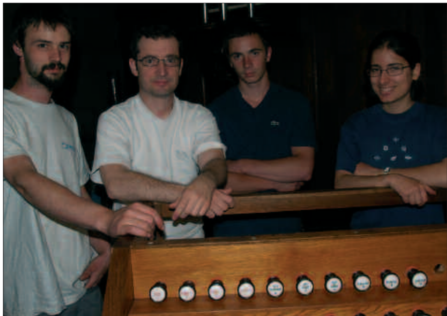
ORGANOAREN KONPONKETA LANAK EZ DIRA AMAITU. ARGAZKIAN, LANEAN DIHARDUTEN LANGILEAK.

J. L. A. Milaka pieza dira, instrumentu mekaniko bat den heinean eta horrek lan handia suposatzen du. 2.600 hodi