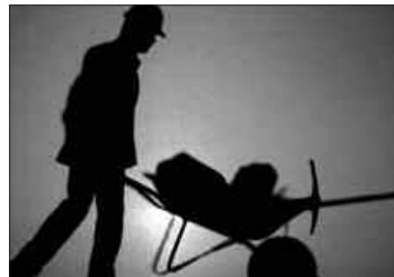
BI IGELTSERO OFIZIAL, IGELTSERO LAGUNTZAILE BAT ETA INGURUGIRO TEKNIKARI BAT BEHAR DITU UDALAK.

- Langabezia laguntzarik edo prestaziorik jasotzen ez dutenak.