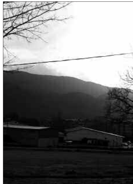
ZERRENDAK OSATZEKO DEIALDIA EGIN ZEN BAINA ZOZKETA-PROZESUA ETENDA DAGO.

Zozketa hauteskundeetan erabiltzea leporatu ziguten orduan. Zozketa, irre-