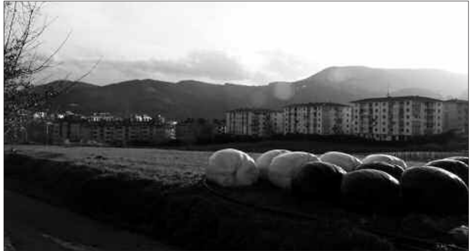
OLARRIONDO-UGARTONDOKO PROMOZIOAK GELDI DAUDE GAUR EGUN.

N. Promotoreen zailtasun ekonomiko ondoriotz eten omen dira negoziazioak. Etxebizitzaren premia handia da, ordea. Krisi egoera honen aurrean,