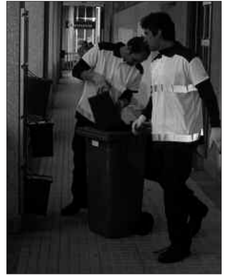
ATEZ ATEKO EREDUARI BEGIRA DAUDE INGURUKO MANKOMUNITATEAK.

Atez ateko bilketarekin, Usurbilek, 2016rako aurreikuspenak betetzen ditu 2009an. Ondorioz, ez luke helburu horiek erdiesteko Gipuzkoak aurreikusten duen erraustegiaren beharrik izango.