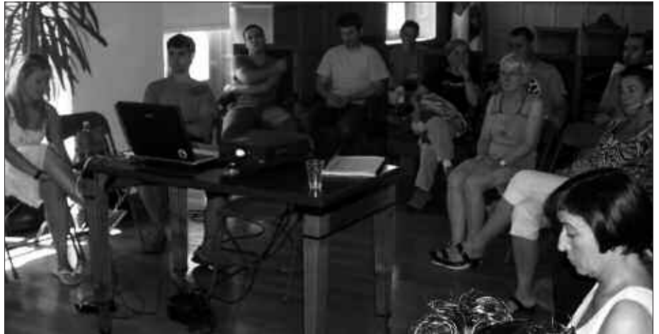
UDALBATZA ARETOAN SALTOKIETAKO ARDURADUNAK, SIADECOREN AZALPENAK JARRAITZEN.

Establezimenduetako arduradunei egindako elkarriketetan ia guztiak euren lanarekin aurrera jarraitzeko asmoa ager-