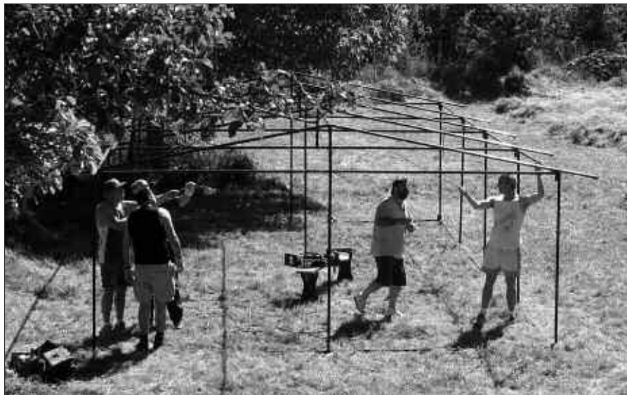
ASTE BURU HONETAN BILDUKO DITUZTE KANPALDIKO GAUZAK.