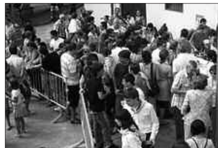
ABUZTU BUKAERAN, JAI-GIROA IZANGO DA ATXEGALDEN. EGITARAUA BEHIN BEHINEKOA DA.

A uzoko festen biran, Sanestebanak igarota hurrengo geltokia Atxegalden izango dugu. Auzo giroa indartu eta jaietan murgiltzeko aitzakia ugari egongo da. Hona hemen, Jai Batzordekoek helarazitako behin behineko egitaraua.