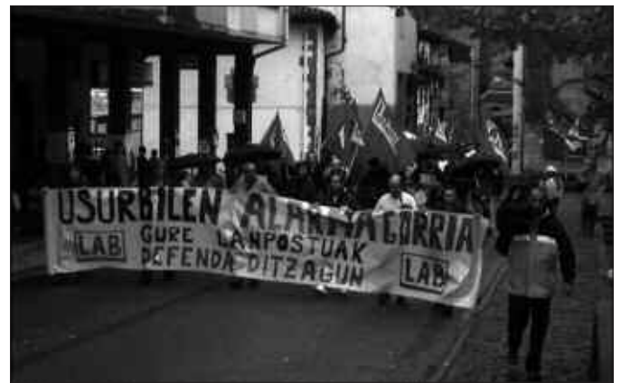
AZKEN EGUNETAN LANGILEAK KALERA ATERA DIRA. MOBILIZAZIO UGARI EGIN DITUZTE INGEMARREKOEK. LAB SINDIKATUAK, HERRI MAILAKO MANIFESTAZIOA DEITU ZUEN PASA DEN OSTIRALEAN.