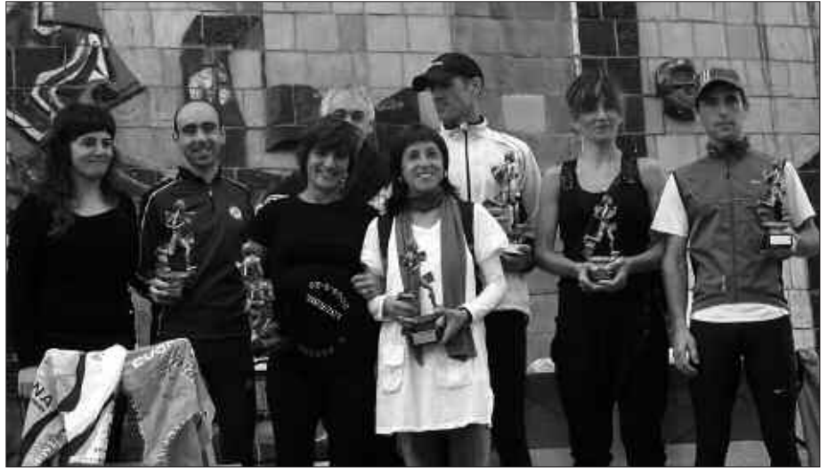
BAXURDE KROSSEKO PARTEHARTZAILEEK PROBATIK GEHIEN BALDRATZEN DUTEN ALDERDIA, SARI POTOLOEKIN BATERA, IBILBIDEA BERA IZAN OHI DA.

Kaxkoa, Santuenea, Zubieta eta Kalezar lotu zituen 10,5 kilometrotako ibilbidean zehar, lasterkari gazteekin batera helduen parte hartzea aipatu behar. Tartean ziren meriturik falta ez zuten 70 bat urte zituztenak. Edota ezkontzako despedidara joan aurretik txerriz mozorrotuta, lasterka egitera ausartutakoren bat. Helmugara tanta-