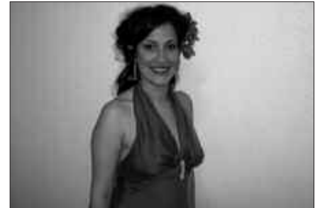
LARUNBATEAN ESKAINIKO DUEN KANTALDIA 19:00ETAN HASIKO DA.