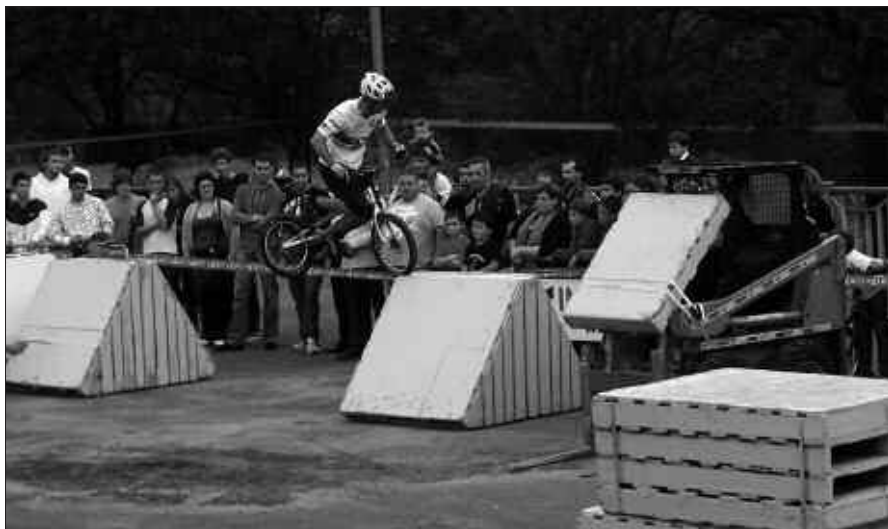
SANTUENEKO FESTETAN UMEEN EGUNA IZAN ZEN LARUNBATEAN, BAINA EGURALDIA MEDIO EZIN IZAN ZITUZTEN PUZBARRIAK JARRI. PUZBARRIAK DATORREN LARUNBATEAN HILAK 26, JARRIKO DIRA ESKUBALDIKO GUNEAN EGURALDIAK UZTEN BADU BEHINTZAT.

Argazki gehiago noaua.com webgunean daude ikusgai, Argazkitegia atalean.