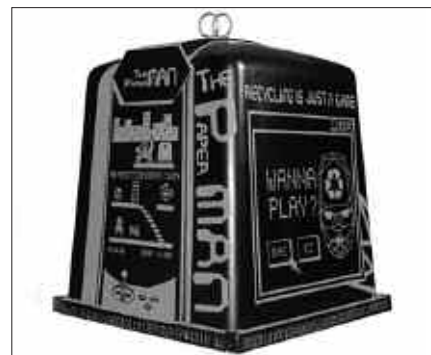
REZIKLARTE ERAKUSKETAN, KONTAINERRAK ARTELAN BILAKATU DIRA.

Erakusketa honetako egile gehienak Arte Ederretako ikasleak dira. Euskal Herrikoetz gain, badira Kataluniatik, Cadiztik eta Galiziatik aurkeztutako lanak ere. Artistek, kontainerrak euren gustuen arabera margotzeko aukera izan zuten. Erakusketa Donostian jarri zen ikusgai lehen aldiz eta, sei egunez, 26 kontainerrekin egindako artelanak eman dira ezagutzera. “Reziklarte” erakusketa San Markos Mankomunitateko gainontzeko herrietara iritsiko da. Oiarzun, Hernani, Lezo, Astigarraga... Azaroaren 17an gure herrira iritsiko da