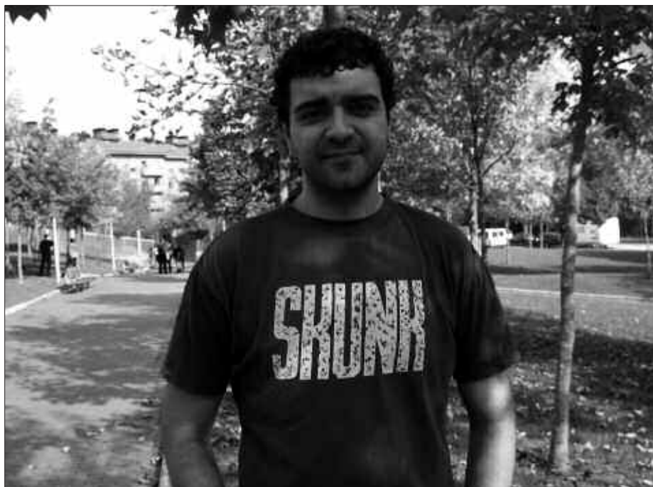
PAKO AGUDOK ESAN DIGUNEZ, "NIK USTE EUSKADIN LEHENENGOETAKOA IZAN NINTZELA, BAIEZTATUTAKO HIRUGARREN KASUA EDO".

P. A. Ordurako protokoloa aldatzen ari zen. Bazekiten A gripea indartsua izango zela. Ondorioz gaur egun ezin diote mundu guztiari