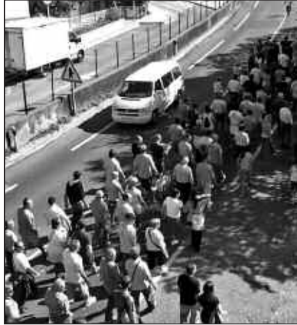
HILABETEKO GREBA MUGAGABEAN, MOBILIZAZIO UGARI EGIN DITUZTE INGEMARREKO LANGILEEK.

Ingemarreko langileek eskerrak eman nahi dizkiote Usurbilgo herriari eta Usurbilgo udalari. Ingemarreko greba mugagabea hilabetez luzatu zen. Egun horietan guztietan, “herritarrak interesatuta azaldu dira, mobilizazioetan hartu dute parte eta babestuak sentitu gara”. Alkatetzaren lana ere nabarmendu nahi izan dute. Alkatea Ingemarreko zuzendariarekin bildu zen, batez ere konponbidea lehenbailehen bideratu zedin. Ingemar atariko kabina ere, udalak jarri zuen langileen esku, greba eramangarriagoa egin zedin. Elkartasun keinu gehiago ere izan ziren mobilizazio egun horietan. Esate baterako, greban izan zirenean, tabernariak ogitartekoak eman zizkieten. Herritarrak oso ondo portatu direla