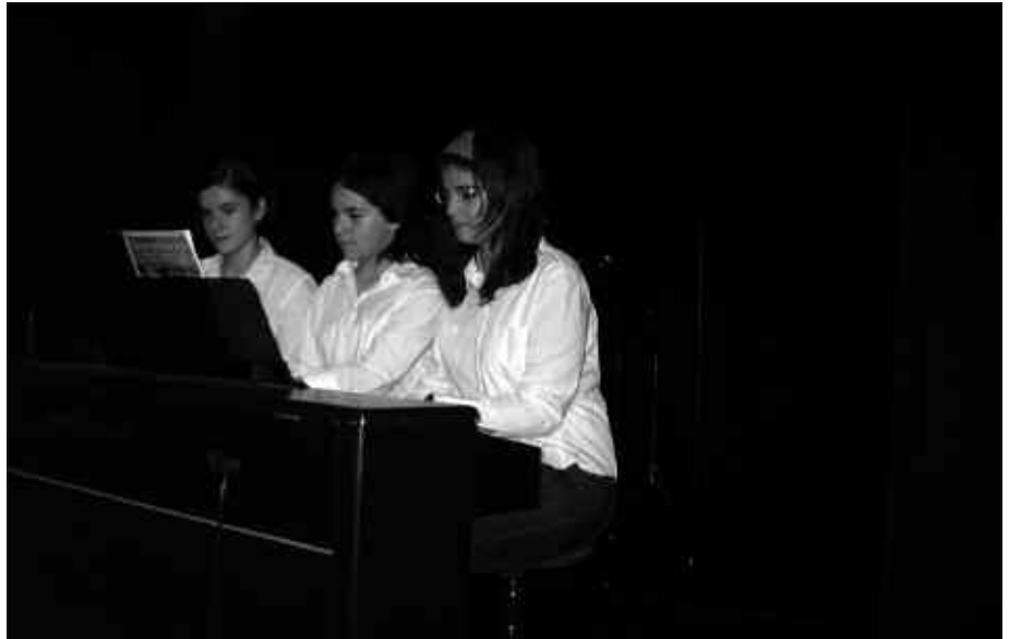
ZUMARTEKO TALDEEN KONZERTUAREKIN HASIKO DIRA OSPAKIZUNAK.