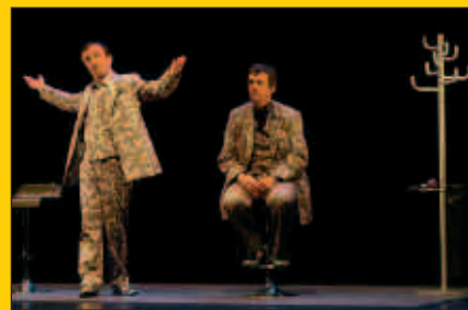
Kulturaldiaren eskutik, Ez dok Hiru antzerki taldea