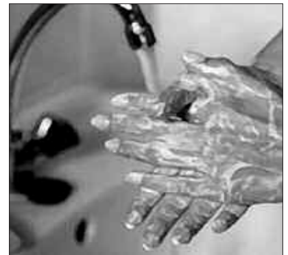
ESKUAK SARRI GARBITZEKO GOMENDIOA OSO BALIOGARRI DA.

A gripeak izan duen eboluzioa ikusita, protokoloan aldaketak txertatu behar izan dituzte azken hilabeteotan. Gomendioei dagokienez, honakoak dira pasa den iraila hasieratik Eusko Jaurlaritzako web orrialdean A gripearri eskaintako atalean argitaratuak dauden aholkuak. Betiko gripearekin hartu beharreko neurriak proposatzen dituzte. Honakoak: