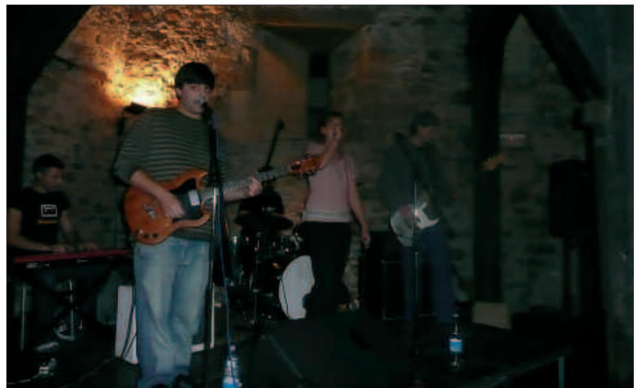
BRASILDAR KUTSUKO DOINUAK LANTZEN DITU ZURA TALDEAK. OSTIRALEAN SUTEGIN ARITUKO DIRA.