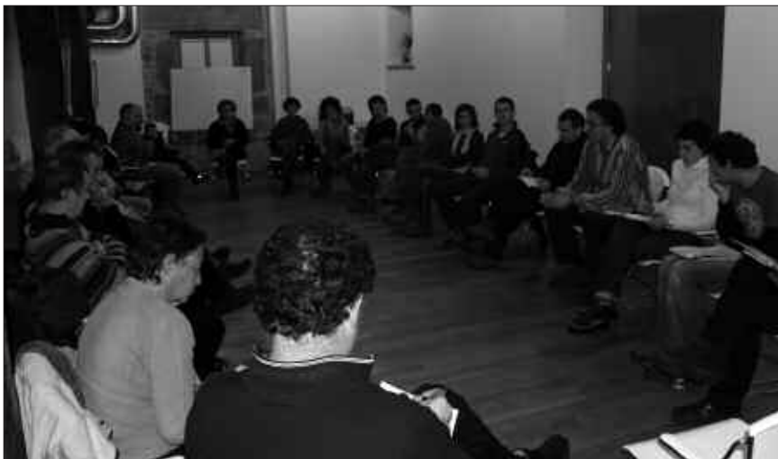
ASTELEHENEAN ELKARTU ZIREN ARTZABALEN; DATORRENEAN BERRIZ ELKARTUKO DIRA.

H erriko produktuak bultzatzeko kontsumo kooperatiba bat sortzeko asmoa du Udalak. Eredua ordea, herritarrekin batera erabaki nahi du gobernu taldeak. Horretarako, eta egitasmoa bera aurkezteko Udalak aste hasierarako bilkura deitu zuen Artzabalgo zahar egoitzan. Bilkura aretoan herritar taldea bildu zen, egin asmo dagoenaren informazioa jasotzeko eta herritarren ekarpenak proposatzeko. Lan talde bat ere osatu da, eta jada, bigarren bilkurarako hitzordua finkatu zuten. Hurrengo bilkura, datorren astelehenean, azaroak 16, 18:30ean Artzabalgo zahar egoitzako bilkura aretoan.