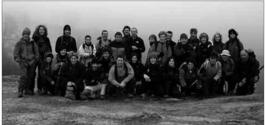
MENDIZALEEN BILGUNE DA ANDATZA TALDEA. ABENDU PARTEAN, MENDI ASTEA ANTOLATU DHI DUTE. DUELA BI URTEKO IRTEERA BATEAN ATERATAKO ARGAZKIA.

A. R. Talde barruan geroz eta gutxiago gaude lanerako, eta irteeratarako ere geroz eta jende gutxiago dator. Batetik taldean lanerako jende gehiagoren pre-