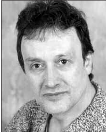
BERE LAGUNEK HERRI AFARIA ANTOLATU DUTE LARUNBAT HONETARAKO.