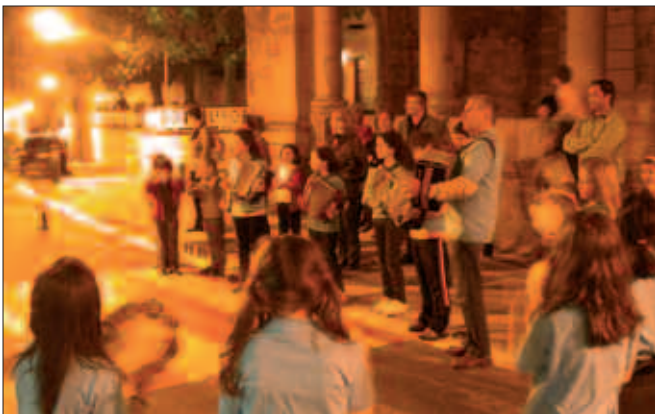
ZUMARTE MUSIKA ESKOLAKO TRIKITILARIAK ETA PANDEROJOLEAK, SANTA ZEZILIKO KALEJIRAN.