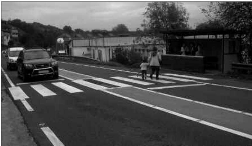
OHITURA FALTA IZANGO DA, BAINA BATZUK ABIADA BIZIAN PASATZEN DIRA DRAINDIK.

Antzeko kontrolak ere maiz egiten dituzte Aginagan; han ere, gehieneko abiadura 50ean ezarrita dago.