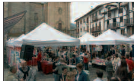
POSTUAK ETA TAILERRAK JARRIKO DIRA DEMA PLAZAN.

Azokarekin batera, igande honetan Dema plazan hurrei zuzendutako tailerrak jarriko dira martxan. Hala nola, informazio puntura hurbiltzen diren herritarrei erosketa-poltsa berrerabilgarria emango zaie opari moduan.