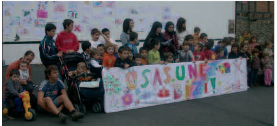
ZUBIETAR HAUR ETA GAZTETXOAK, PASA DEN LARUNBATEAN EGIN ZUTEN AGERRALDIAN.

Hitz potoloak esan dizkigute: birziklatu eta konpostatu bezalakoak. Eta ikasi dugu zer diren. Orain badakigu usteltzen diren hondakinekin lurrerako ongarrira egin daitekeela. Eta badakigu paperetik berriz paper erabilgarria sortzen dela, eta