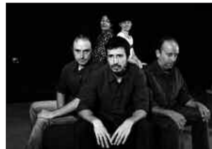
ABENDUAREN SEAN, ANTZERKI SAIO HAU ESKAINIKO DUTE SUTEGIN.