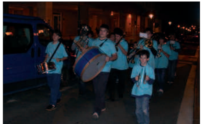
ZUMARTEKO TXARANGAKOAK ERE KALEJIRAN IBILI ZIREN, INAUTERIETAKO DOINUEKIN HERRIA ALAITUZ.