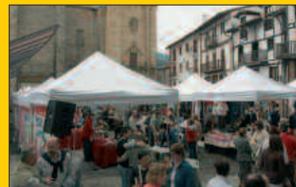
Reziklarte ondoren, Merka2 San Markos azoka