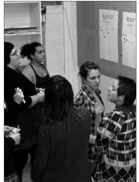
UDARREGI IKASTOLAN, HEZIKETAREN ALORRA LANDU ZEN BILKURA BATEAN.

A. S. Udala da herritarrarengandik gertuen dagoen Administrazioa eta berari dagokio, neurri handi batean, emakumeen aurkako indarkeriako ara-