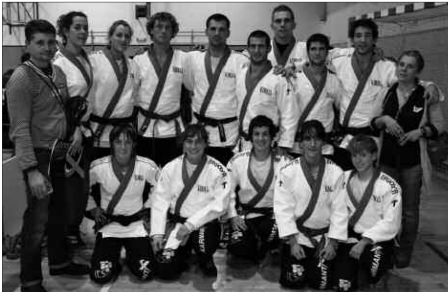
LIGAKO LEHEN JARDUNALDIAN PARTE HARTU ZUTEN ORDEZKARIAK.

Ligan, klubeko kideekin dabilen talde bakarrenetako izango da Usurbilgoa. Gainontzeko taldeak, jatorrian klubekoak ez diren judoekin ari dira lehian. Zentzu horretan, harro egoteko moduan dira Usurbil Judo Taldeko kideak.