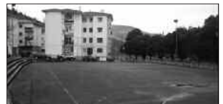
SANTUENEAK ERAIKIN ESTALI BATEN PREMIA DU ASPALDITIK.

Hasierako proposamenak aurkeztu eta auzotarren lehentasunak eta iritziaz ezagutzeko bilera bat egin dute aste honetan, Santueneko Kultur Elkartearen lokalean.