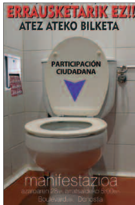
MANIFESTAZIOA IRAGARTZEKO EGIN DUTEN KARTELA.

Honen aurrean, manifestazio deialdia egin zuten. Larunbat honetan, Donostian, arratsaldeko 17:00etan Bulebarrean. Herri plataformen esanetan, "errausketaren inposatzearen alde itsuki jarraitzen duten bitartean, gu errausketarik gabeko hondakinen bilketa eta kudeaketa defendatzen jarraituko dugu, gure osasuna zein ingurugiroarentzat egokiagoa dena. Hau guztiagatik, eta errausketarik gabeko politika partehartzaile eta anitzaren alde, manifestazioa burutuko dugu".