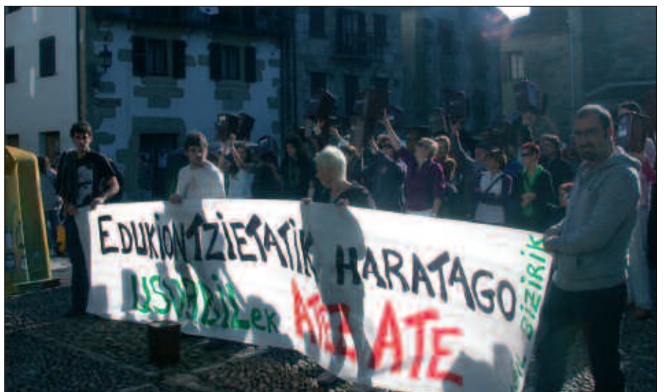
EDUKIONTZIEN ALDEAN, KUBO MARROIA ALDARRIKATU ZUTEN.

R eziklate erakusketa aprobetxatuz, Usurbil Bizirik taldeak atez ateko bilketa sistema aldarrikatu zuen beste behin ere. Igandean, erakusketa-aren azken egunean, kubo marroia aldarrikatzeko ekimena antolatu zuten. Herritarrek bat egin zuten deialdiarekin eta kuboa eskuetan azaldu ziren Dema plazan. Ekitaldiak iraun zuen bitartean, larunbat honetan Donostian egingo den manifestaziorako deia egin zen megafonia bidez.