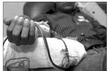
PATRI JATETXEAN EGINGO DA ODOL EMAILEEN BAZKARIA.

Bazkari txartelak 35 eurotan jarri dira salgai. Bertaratu nahi dutenek, ahal bada, azaroaren bukaerarako jar