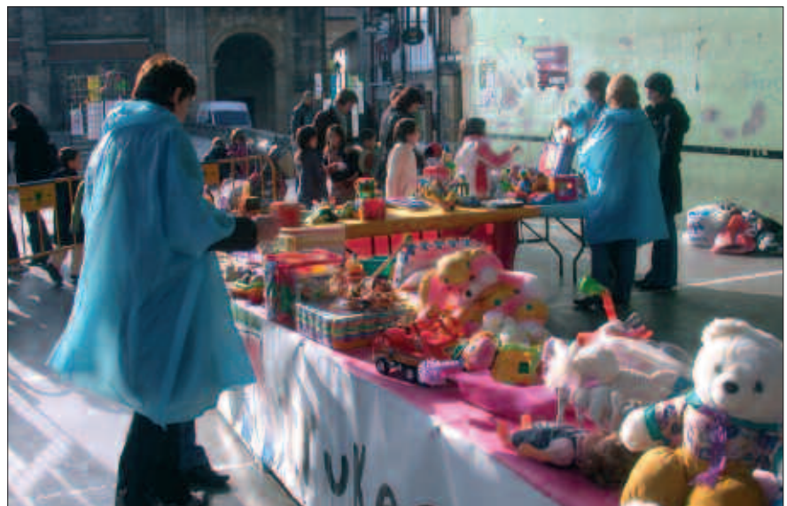
JOSTAILU AZOKA MODUKOA ANTOLATU ZUEN HITZ AHOK AURREKO ASTEBURUAN. TRUKEA ETA BERRERABILPENA SUSTATZEKO MODU POLITA.