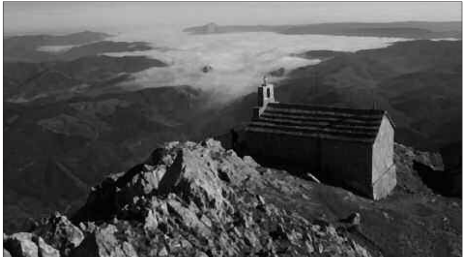
ANDATZAKOAK AIZKORRIRA ABIATUKO DIRA LARUNBATEAN.