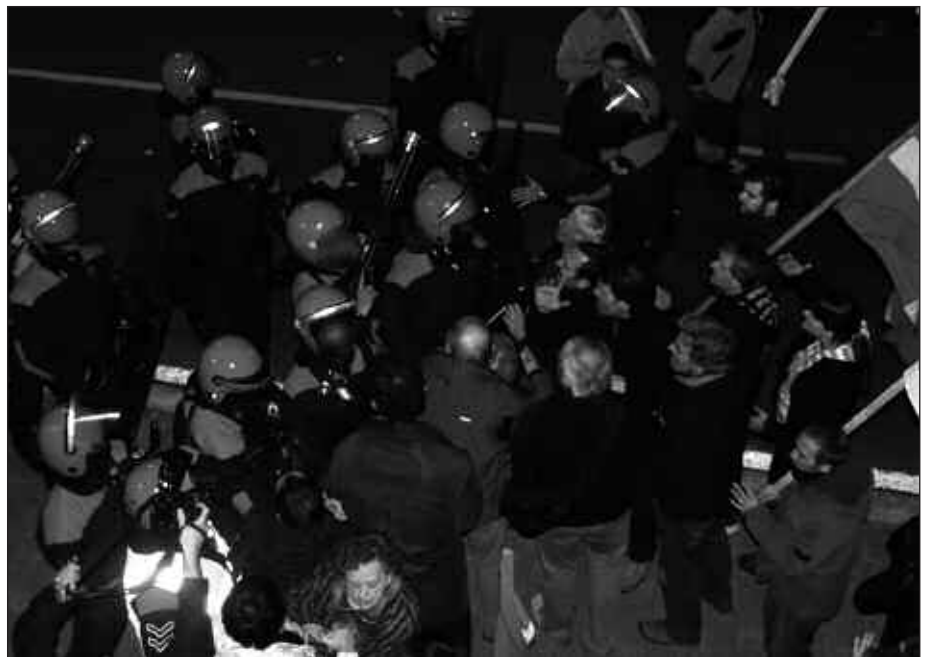
ONGI ETORRIA BAI BAINA OMENALDIRIK EZIN ZELA EGIN ESANEZ EKITALDIA ETEN ZUEN ERTZAINZAK.