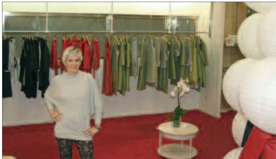
GUSTUKO DUEN OFIZIOAN BIDEA ZABALDU NAHI DU USURBILGO DISEINUGILEAK.

M. I. Prestatu dudana lehen bilduma, ezkontzetarako izan da, dotorezia pun- tuarekin. Asteburuetarako aproposa, egunerokotasunerako ez. Oraingoz atera dudana linea hori litzateke. Zortea