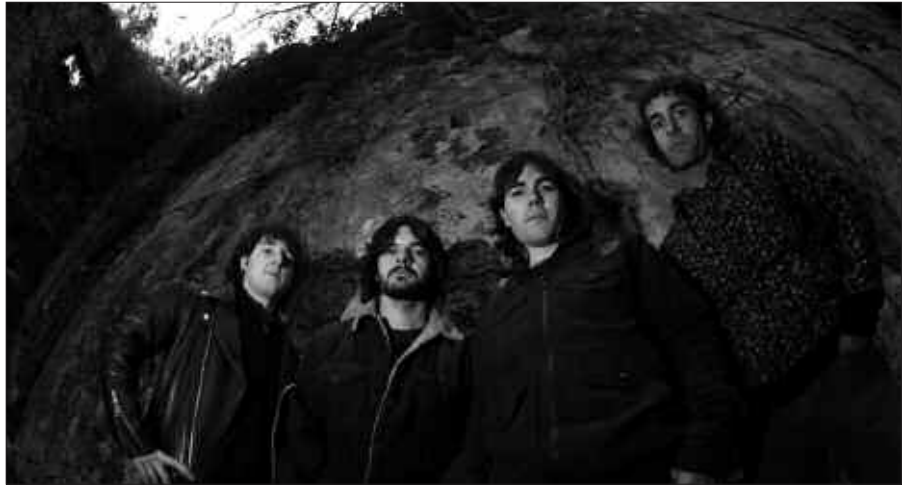
USURBILGO MUSIKA TALDEA POZARRREN DA FINALERA IRISTEAGATIK.

Finala Bilborock aretoan jokatzekoa zen abenduaren 16an (ale honen edizioa ixterakoan, finaleko emaitzaren berririk ez genuen).