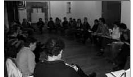
DUELA ASTE BATZUK HASI ZIREN KOOPERATIBA OSATZE-LANETAN.