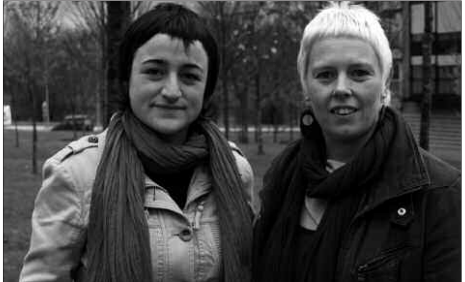
EZKER ABERTZALEA HAUSNARKETA PROZESUAN ARI DA ASTEOTAN.

Gaur egun aldaketa politikoa gauzatzeko baldintzak badaude, baina baliatu behar ditugu, eta ezin ditugu usteltzen utzi. Gatazka politiko eta armatu hau gehiegi iraunarazten ari da, eta ezker abertzalearentzat lehentasuna gatazka konpontzea da. Iruditzen zaigu, guztion lehentasuna izan beharko lukeela gaur egun nagusi diren konfrontazio armatuak gainditzea. Gatazka honek eragiten dituen alde guztietako ondorio larriak gainditzeko. Eta konfrontazio armatu, blokeo eta itxaropen ezaren orde, elkarrizketa, akordioa eta Euskal