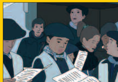
Gabonetako ekitaldiak, gehigarri berezian bilduak