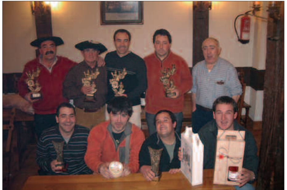
ARGAZKIAN, DUELA BI URTEKO FINALEAN SARITUTAKOAK.