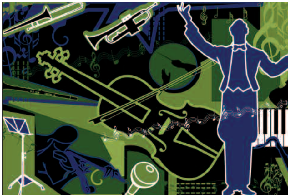
IZENA EMATEKO EPEA ABENDUAREN 18AN AMAITUKO DA.