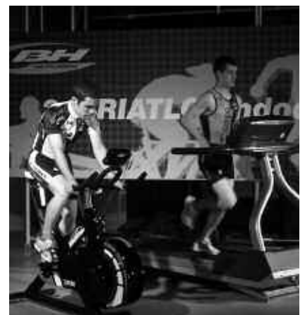
USURBILGOEK VILLABONAKOEN AURKA LEHIATU BEHARKO DUTE.

Egun hartako ahalegina errepikatu beharko dute larunbat honetan ere; Añorga bi kilometro arituko da korrikan, Udabe kilometro bat arraunean eta Otaegi bost kilometro bizikleta gainean. Lehia saioa, EITBk Donostiako Miramonen duen estudioetan burutuko da. Euskadi Irratiak zuzenean eskainiko du, arratsaldeko 16:00etatik aurrera. Final handia abenduaren 26an jokatuko da.