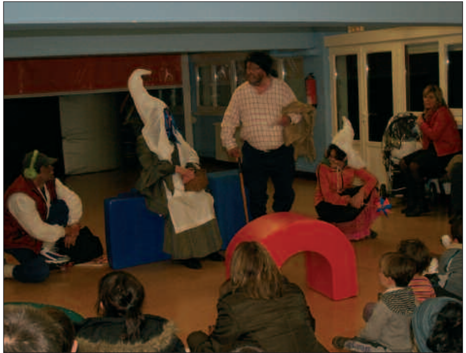
KALEZARREN, HAUR ESKOLAN IZAN ZIREN AURREKO ASTELEHENEAN LORE ETA IKATZ, OLENTZERO ETA MARI DOMINGI.

Ekitaldi berean iragarri zutenek, Sutegin abenduaren 23an 17:30ean festa handia burutuko dute eta bertan parte hartzeko gonbita luzatu zuten.