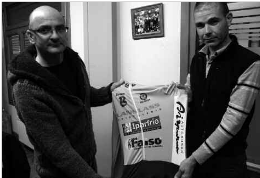
URTARRILAREN 25ERA BITARTE ESKURA DAITEKEZ TALDEAREN MALLOTA ETA KASKOAK.

diziplinetarako irekia dago. Txirrindulari izan nahi duenari, aukera eman nahi diogu. Neskak ere animatu daitezela. Hor badago neska bat sartuko litzatekeena, baina bakarra da. Neskek parte har dezatela. Probatu eta gustuko ez duenak ez du inolako obligaziorik. Datorrena, gustura etor dadila.