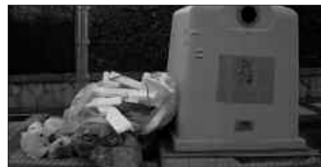
PLATAFORMAKOEK ZALANTZAN JARTZEN DUTE UDALAK EGINDAKO INKESTA TELEFONIKOAREN FIDAGARRITASUNA.

Atez atekoaren aurka herritar asko dardela diote Plataformakoek NOAUA!ra igorritako idatzian: “ziurtasun osoa dugu