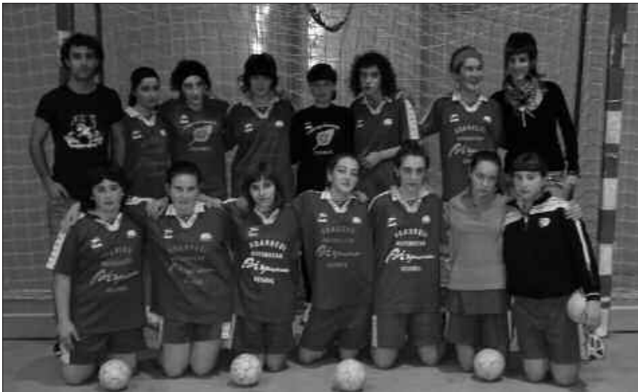
NESEN TALDEAK ERE HARTU ZUEN PARTE INFANTIL MAILAKO TXAPELKETA HONETAN.

Antolatzaileek eskerrak eman nahi dizkiete laguntza eman dutenei: arbitro lanetan, partiden antolaketan, bazkaria prestatu eta zerbitzatzen aritu zirenei, udal-kirol patronatuari, Saizar sagardotegiari, Euskadiko kutxari, Kutxari, Juan txo harategiari eta arkumearen erri-fak erosi zituztenei.