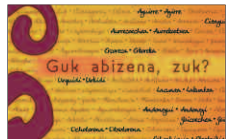
BAKE EPAITEGIRA JOANDA EUSKARATU DAITEKE ABIZENA.

Horrekin batera, bake epaitegian bertan zenbait agiri aurkeztu beharko dira. Batetik, nortasun agiria erantzun fotokopia. Adinez nagusia ez denak, gurasoena beharko du. Bestetik, epaitegian bertan eskatu ahalko den hitzez hitzeko jaiotza ziurtagiria. Errola agiria, udaletxean eskuratu beharrekoa. Baita familia liburuaren fotokopia, ezkontuta dagoenak edo seme-alabak dituenak. Hamasei urtetik gorako seme edo alabarik duenak, aipatu gaztearen nortasun agiria