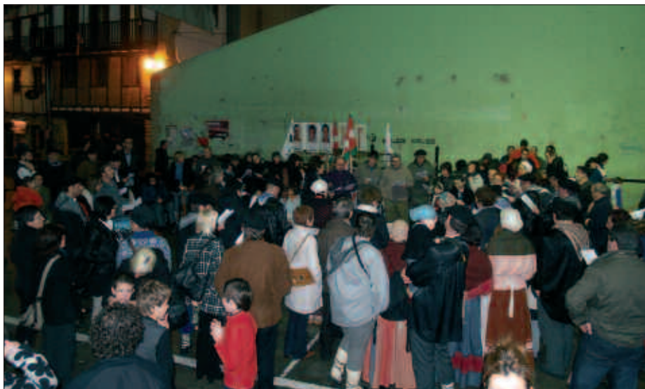
USURBILLEN NAHI DITUGU ELKARTEAK ETA PARROKIAK ANTOLATUTA, GABON KANTAK ABESTERA IRTENDAKO BI HERRITAR TALDEEK BATERA AMAITU ZUTEN KALEJIRA, ILUNTZEAN PILOTALEKUAN.

Kantatzera irtendako herriko bi taldeok aginagar eta zubietarren lekukoa hartu zuten. Goiztiarrenak,