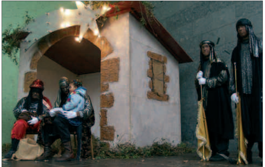
ERREGEEN AGURRAREKIN AMAITU ZEN KABALGATA PILOTALEKUAN.

G iro busti eta hotzari aurre egin behar izan zioten hiru erregeek, urtarrilaren 5ean Urdaigatik kaxkora osatu zuten ibilbidean, baina horregatik urteroko kabalgatari ez zioten hutsik egin. Melchor, Gaspar eta Baltasar gure artean izan ziren, baita haur eta guraso andana ere, bereziki iluntzean frontoi inguruan. Gaztetxo eta heldu bat baino gehiago erregeak agurtu nahian, eta gainerakoak, errege egun bezperan hain ohikoak izan eta kabalgatan jaurti ohi diren gozoki harrapaketan aritu ziren. Urtero bezala, erregeak joanda amaitu ziren, haur eta gaztetxoei zuzenduta eguberrietarako herrian antolatutako ekitaldiak.