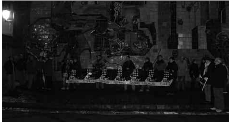
EGUNKARIA BEZALAKO ELKARLANERAKO TRESNAK INDARTU BEHAR DIRELA USTE DU TORREALDAIK.

J.M.T. Oso esker onekoak gara, etorri zaigun, eman zaigun laguntza guztiagatik. Guk erein eta merezi baino gehiago jaso dugula uste dut. Horretan segitzeko mezua zabaldu nahi dut, hemen ez baita bukatu. Jendeak izan dezake iritzi publikoak egunkariaren alde dagoenez, hau egina egotearen ustea. Baina guk hori ez dugu horrela bizi, kezka handiz baidak. Tentsio hori mantendu behar da. Egunen batean, arrakastaz, justizia eginez absoluzio batekin amaituko balitz, orduan denon artean ospatzeko modua egingo genuke. Denei eskerrak emateko modu bat izan nahi dugu,