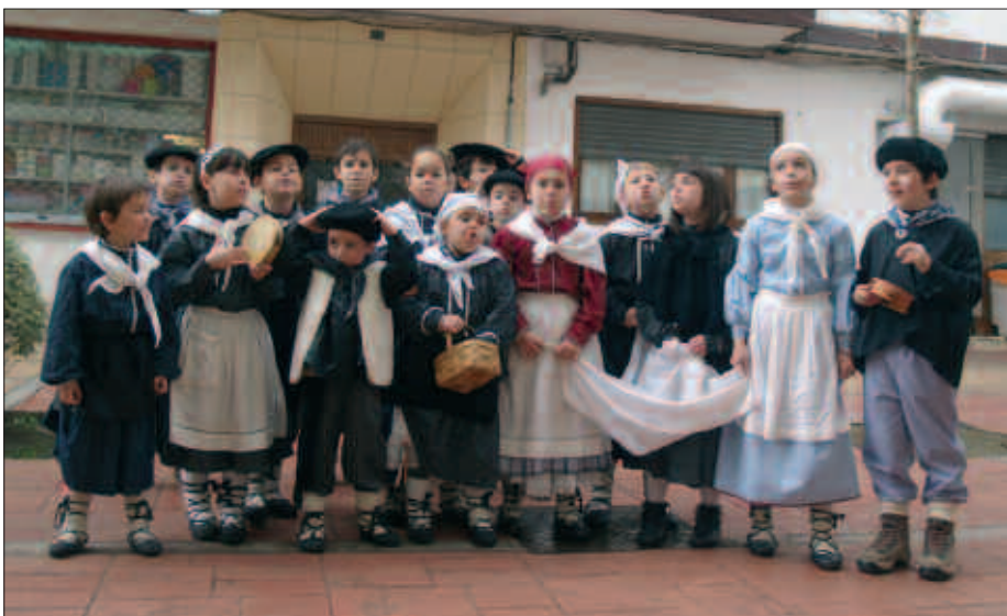
ABENDUAREN 24AN HERRIKO ZENBAIT TALDEK GABON KANTAK ABESTERA IRTETEKO DEIALDIAK EGINAK ZITUZTEN. BAINA AIPATU EKITALDIEZ GAIN, EUREN KASA KANTATZERAN ANIMATU ZIREN ARGAZKIAN AGERI DIRENAK ERE.