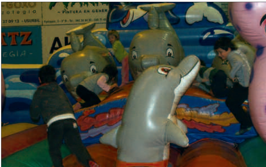
KIROLDEGIAN JARRITAKO JOLAS PARKEAK ARRAKASTA HANDIA IZAN ZUEN.

marratzen, korrika aurrera eta atzera... Denborapasarako aitzakia ugari aurkitu zituzten Oiardo Kiroldegira hurbildu zirenek, pasa den urtarrilaren 2tik 4ra artean. Egunpasa joandako bat baino gehiago zegoen tartean. Gaztetxo eta haien gurasoek oporraldiari amaiera emateko aukera ezin hobea izan zuten.