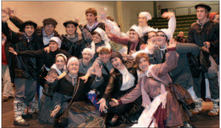
IRABAZI ZUTELA JAKITEAN, POZARREN JARRI ZEN KANTARI KOADRILA HAU.