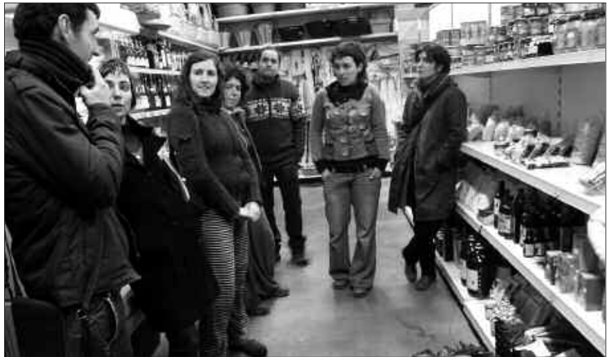
AURRERANTZEAN, ASTELEHENERO, ESKATUTAKO BARAZKIAK JASOKO DITUZTE KOOPERATIBAN.

Produktu ekologikoz betetako lehen otarrak ailegatu ziren pasa den urtarrilaren 11n Alkartasuna kooperatibara. Herrian produktuon inguruan sortu den herritar taldeak bultzatutako ekimen honetan aldez aurretik izena emana zuten herritarrek, gustura hartu zituzten gai kimikorik gabe ekoiztutako garaiko barazkiak. Aurrerantzean, astelehenero kooperatiban bertan jasoko dituzte eskatutako barazkiak. Barazki banaketa egin ondoren, Artzabalen bildu zen produktu ekologikoak bultzatzeko osatu den taldea. Oraingoz, hilabeteko lehen asteleheneroan biltzen jarraitzeko asmoa dute.