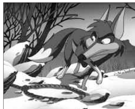
BARRIOLA AZERIARI BURUZKO PELIKULA 5-12 URTEKOEI ZUZENDUTA DAGO BEREZIKI.