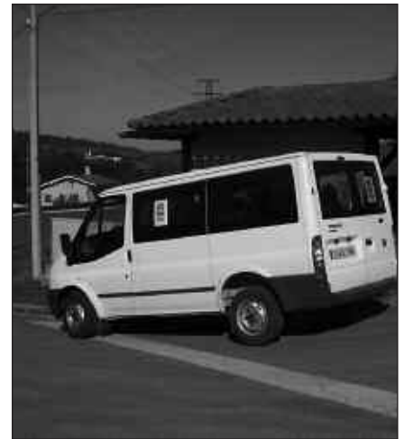
FURGONETA BERRIA LASTER IZANGO DA MARTXAN.

Erabiltzaile kopuruari dagokionez, bus-taxiaren erabilera sendotu egin da azken hilabeteetan. Behemendiren eskutik jaso ditugu bus-taxi zerbitzuari buruzko estatistikak. Datuak ondo ulertzeko, zerbitzua abuztuan eten egin zen eta uztailean goizetik aritu zen bakarrik.