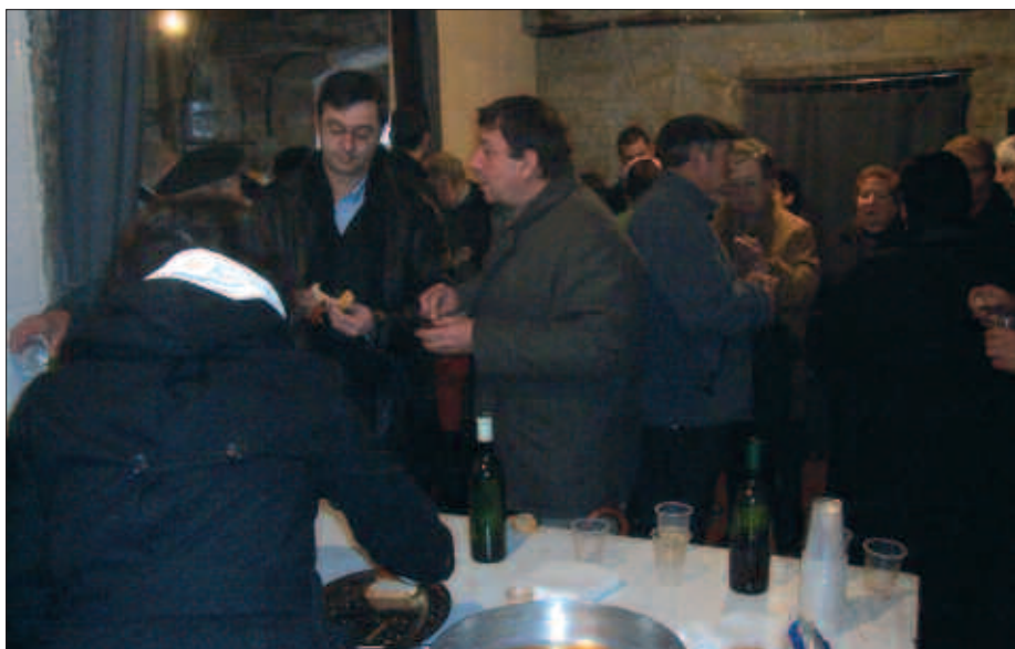
JAI BATZORDEKOEK AUZOKO FESTA ANTOLATZEKO ERABILI OHI DUTEN GUNEA, PASA DEN ABENDUAREN 26AN ATERPE LANAK ERE EGIN ZITUEN.

Bezperatik lanean jardun zuten Jai Batzordeko kideek, eguberri egun ostean Urdaigara igotzen zirenek hamaiketako ederra dasta zezaten. Eta ohiturari eutsiz, urteroko hitzorduak ez zuen hutsik egin. Abenduaren 26an goizeko hamaiketako mezatara hurbildu ziren herritarrak, ondoren, Jai Batzordekoen biltokiko aterpera sartu eta salda beroa edan edota txorizo nahiz haragi egosi pintxoak jan ahal izan zuten. Giro hotzari aurre egiteko errezeta hoberena.