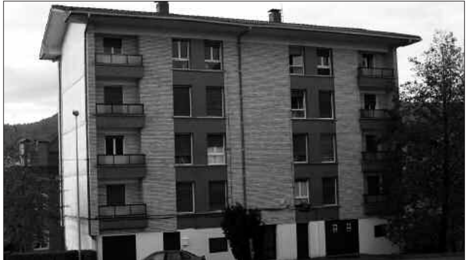
MAIXU ETXeko SEI ETXEBIZITZEN BALDINTZAK ONARTU ZITUEN UDALBATZAK, ABENDU AMAIERAKO OSOKO BILKURAN.

Usurbilgo Udalak eta San Markoko Mankomunitatearen arteko hondakin kudeaketari buruzko hitzarmenean zen- bait aldaketa txertatzea proposatu zuen governu taldeak, abendu amaierako osoko ohiko bilkuran. Bereziki bi pun- tutan jasotzen dira, hitzarmenean txer- tatu nahi diren aldaketak. Batetik, Erakunde, Merkataritza eta Industriako Hondakin Asimilagarrien atez ateko gaikako bilketa Udalak bere aginpide- tzat onartzea eskatzen da. Bestetik, aipatu sistema zabaltzeko beharrezko kanpainetako aginpideak zehaztea. Helburua, gaikako bilketa bultzatzea litzateke. Gehiengoz onartu ziren alda- ketok, governu taldearekin batera, Aralarko zinegotzien babesarekin. Aurka bozkatu zuten aldiz, EAJ-PNV eta Alkarbide udal taldeko ordezkariak.