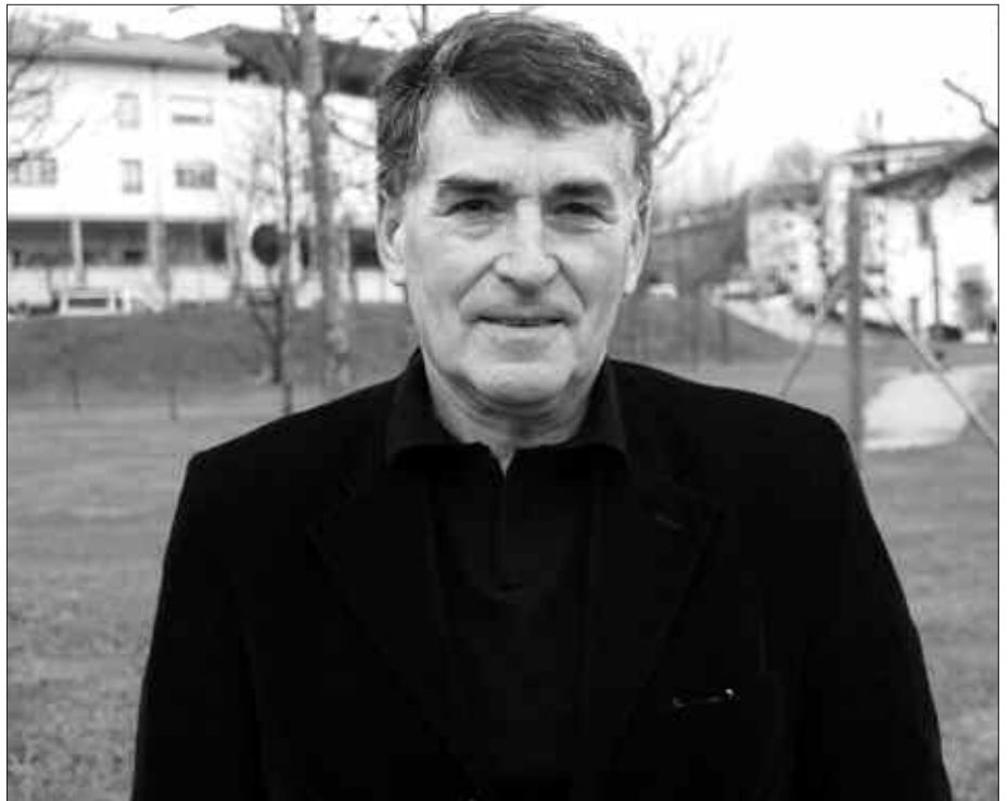
URTARRILAREN 12, 25, 26 ETA 27AN MADRILGO AUZITEGI NAZIONALERA JOATEKO DEITU DITUZTE EGUNKARIA AUZIKO AZUIPERATUAK.

J.M.T. Bi egun oso desberdinak izan ziren. Lehen egunean, gu bostok deklaratu genuen, gure bertsioa emateko aukera izan genuen. Bizitako atxiloketa, inkomunikazioa, torturak kontatu ahal izan ditugu. Egunkariaren egia historikoa kontatu genuen. Gure kontakizuna ez zuten eten, alde horretatik pozik geratu ginen. Bigarren egunean, lekuko