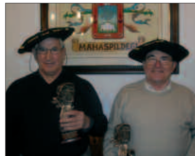
TXAPELKETAKO IRABAZLEAK ANDATZPE ELKARTEKOAK IZAN DIRA.