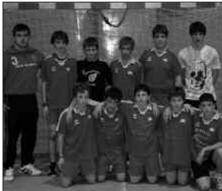
GIRO EDERREAN PASA ZUTEN EGUNA. IRUDIARI, USURBILGO TALDEA.

Antolatzaileak pozik ageri dira, ekime-nak izan duen harrerarekin, astearte izan arren, Kiroldegia jendez bete baitzen. Infantil mailako seina neska eta mutil taldeek parte hartu zuten, tartean, Gipuzkoa zein Euskal Herriko beste txo-koetatik etorritako kirol taldeek. Hain zuzen, antolatzaileek beste probintzietako kirolariekin jokatzeko aukera eskaini nahi baitzieten herriko eskubaloi jokalariz gaztetxoiei. Lagun arteko sailkapen buruan, Nafarroako selekzioak amaitu zuen. Bigarren Zumaiako Pulpo taldeak. Hirugarren eta seigarren postuetan usur-bildarrak; neskak mutilen aurretik.