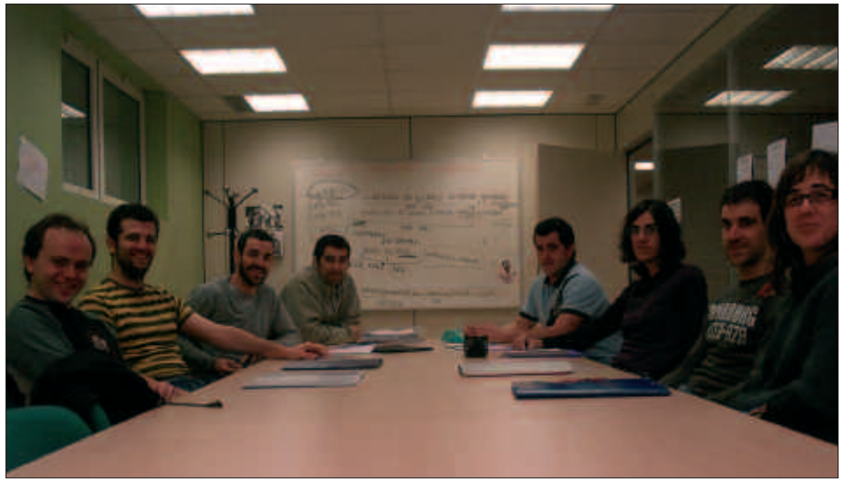
“KOADERNOA, BOLIGRAFOA ETA GOGO PIXKA BAT BESTERIK EZ DIRA BEHAR”, HALA DIOTE BERTSO ESKOLAKO KIDEEK.

N. Euskal Herriko Bertsolari Txapelketa jarraituko zenuten. Zer irudituzaituzue?