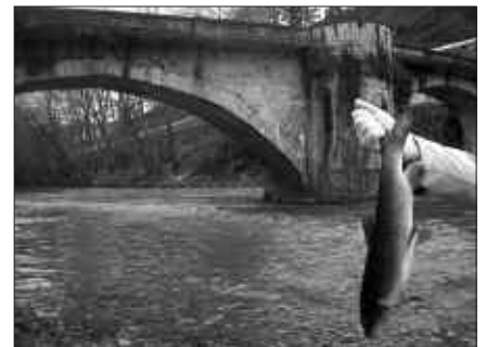
EGUZKIKOEN ATERATAKO ARGAZKIAN, BARBOA HILIK ALIRIKO ZUBI ONDOAN.

istripuarekin. Produktu arriskutsuak garraiatzen zituen kamioi batek beste baten kontra jo eta, horren ondorioz, 10.000 litro lixiba isuri ziren”. Horietatik asko Akan errekarara joan ziren, Urumea bailarara. Beste batzuk, berriz, Ziako errekarara, Ori bailarara. Bazirudien isuri kutsakorraren eragin nabarmenena Urumean gertatuko zela, baina, antza denez, Orian ere uste baino kalte handiagoa izan da.