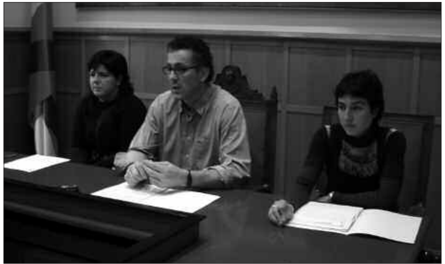
URTARRILAREN 20KO PRENTSAURREKOAN EMAN ZEN HERRI KONTSULTARAKO EGUTEGIAREN BERRI.

Gogoratu zuen, osasun publikoa eta ingurugiroa babesteko asmoak gidatu duela beti udalaren ekintza. Eta horri jarraiki, udala ez dagoela "zaborraren erdian eta honen errauspean bizitzeko prest".