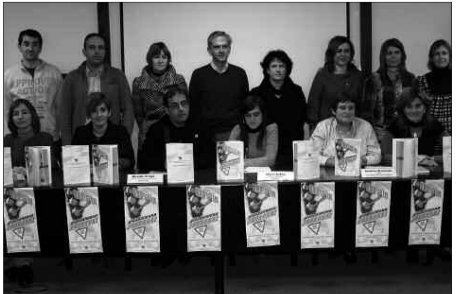
BURUNTZALDEKO UDAL ORDEZKARIAK ETA ESKOLETAKO ORDEZKARIAK, KANPAINAREN AURKEZPEN EKITALDIAN.

Buruntzaldeko hamaika auto-eskolek bat egin dute egitasmoarekin: besteak beste, Usurbilgo Solozabal auto eskolak. Guneotan, azterketa teorikoa prestatzeko euskarazko materiala dago, udalek diruz lagunduta auto eskolek burutu duten inbertsioari esker. Bide horretan jarraitzeko beha-