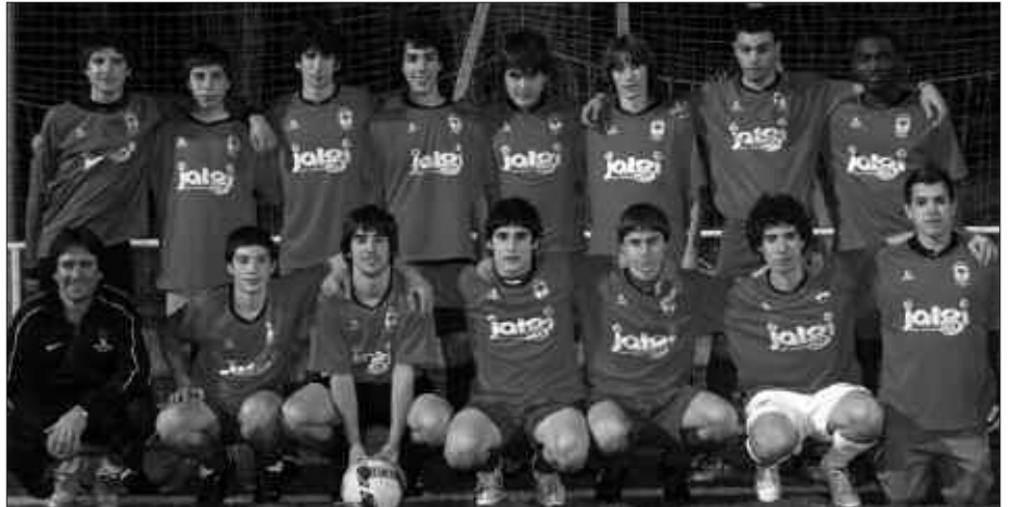
MOTIBAZIOA ETA LAGUN ARTEKO GIRO EDERRA DIRA JUBENIL MAILAKO TALDEAREN EZAUGARRI NAGUSIAK.

N. Nola amaitu nahi zenukete denboraldia?