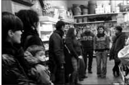
LARUNBAT HONETAN IRTEERA ANTOLATU DUTE, AIARA JOANGO DIRA.

Larunbat honetarako, urtarrilaren 30erako irteera antolatu dute produktu ekologikoen inguruan sortu den taldeko kideek. Aiara joatea proposatzen dute, bertako mermelada ekoizle baten lantokia ezagutzera. Hitzordua, goizeko 10:00etan jarri dute, Alkartasuna nekazal kooperatibatik