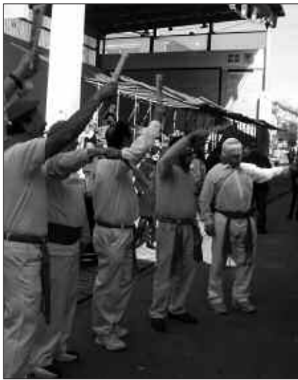
GAZTE ZEIN HELDU, JENDE ASKO MOZORROTZEN DA INAUTERIETAN. ZIRKOA DA PROPOSATU DEN GAIA.

Zeintzuk agertuko dira otsailaren 13ko kaleko zirkora? Ohi bezala, ikus-tekoa izango da. Hitzordua jarria dago, 18:30etan. Haur, gazte, heldu... denok mozorrotu eta zirkora ondo pasatzera!