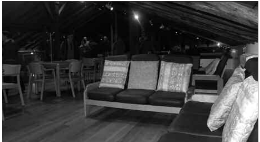
IRTEERA ETA IKASTARO UGARI PRESTATU DITUZTE 2010ERAKO.

Azaroak 13: Irun-Arizkun-Hondarribia irteera.