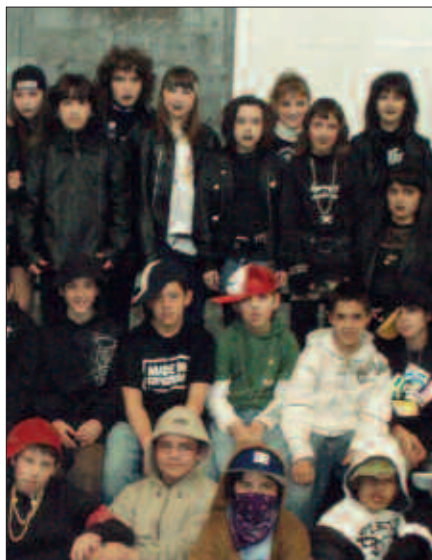
UDARREGIKO IKASLEAK, IAZKO INAUTERIAN EGINDAKO ARGAZKIAN.

- “Euskal Herrian sustraitutako eskola eraiki, erronkari ekin eta gure