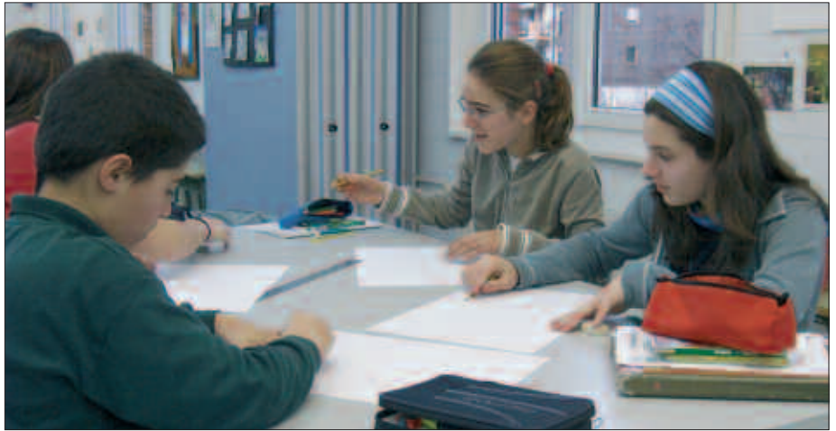
□ 16 URTE ARTEKO IKASLE BERRIAK OTSAILAREN 1 ETIK 12RA

Era berean, LH3. mailatik aurrera gaztelaniaren irakaskuntza formalaren hasiera izango dute, eta DBHn, hautaz-