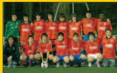
Gipuzkoako Kopa, jubenil taldearen helburua