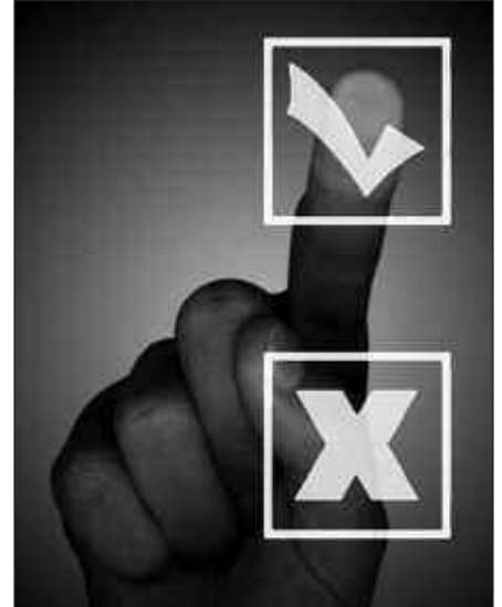
HERRI KONTSULTARAKO KANPAINA ASTE HONETAN HASI DA OFIZIALKI.

Herritarrek ezagutzen dute aurreko bilketa sistema nolakoa zen. Ezaguna zaie ere sistema berria, atez ateko bilketa. Orain, euren iritzia emateko aukera dute. Otsailaren 27an eta 28an antolatu den herri kontsultan, iritzi hori bideratzeko aukera izango dute. Orriotan, indar politikoen iritziak aurkituko dituzue. Hurrengo astean, herri mugimenduen.