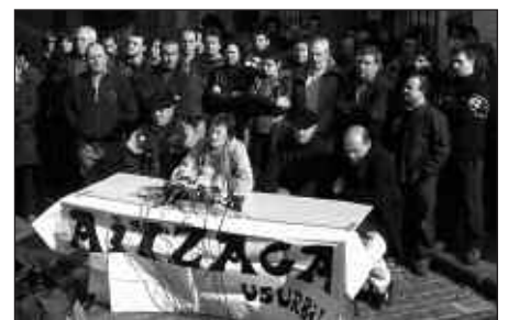
2006KO OTSAILAREN 11N ITXIARAZI ZUTEN AITZAGA.

Abertzale eta ezkertiarren bilgune izateko zabaldu zituen ateak Aitzagak, 1994. urtean. Orduetik, ehunka ekitaldi