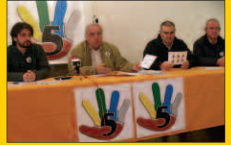
Hamaikabat eta Herri Plataforma, 5 edukiontzien alde