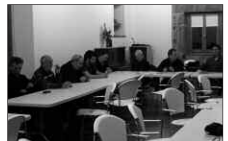
OTSAILAREN 5EAN ARTZABALGO EGOITZAN BURUTU ZEN BILKURA.

Igande honetarako, ekitaldia iragarri dute Mikel Laboa plazan. Idatziz NOAUA!ra igorri duten oharrak dioenez, “Atez Ateko Bilketaren alde zaudeten eragile guztioi deialdi bat luzatzen dizuegu: otsailaren 14an igandea Mikel Laboa plazan eguerdiko