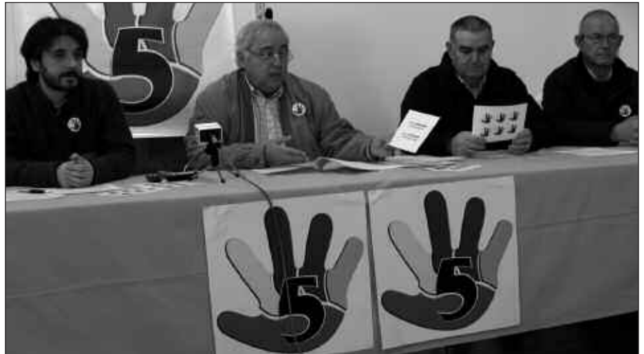
IRUDIAN, USURBILGO HAMAİKABAT ETA BOST EDUKIONTZIEN ALDEKO HERRI PLATAFORMAK ESKAINITAKO PRENTSAURREKOA ARTZABALEN.

Autokonpostajea bultzatzen jarraitu eta gerora hondakin bihurtuko diren gaiak sorreran gutxitzearen alde agertu ziren Usurbilgo Hamaikabat eta herri plataforma.