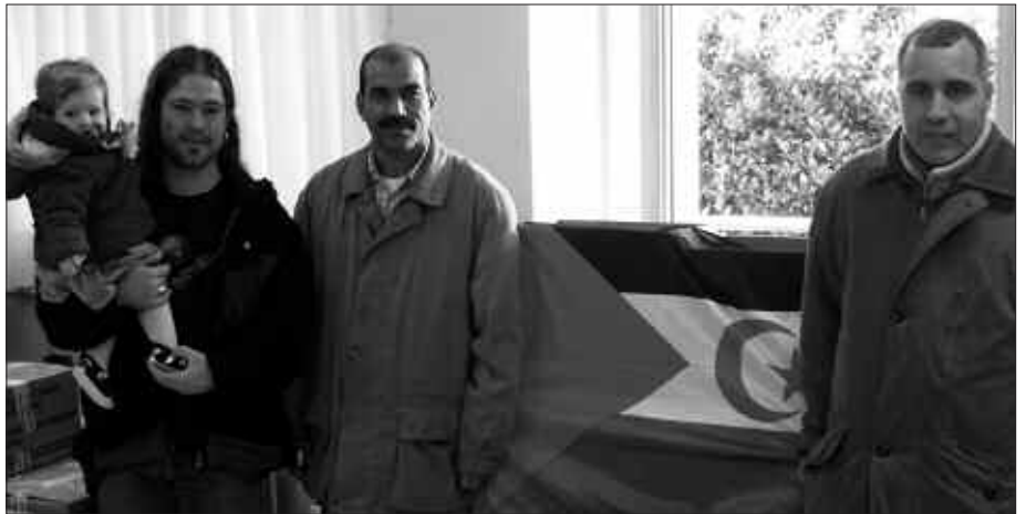
GURE INGURUAN JASOTAKO LAGUNTZA, OTSAILAREN 20AN ABIATUKO DA GASTEIZTIK SAHARA ALDERA.

Bilketa kopurua iazko bera izan edota gorabeherarik egongo ote den zalantza zuten, Lasarte-Orian osatua den taldeko