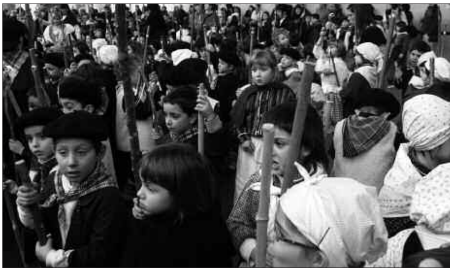
SANTA AGEDA BEZPERAN, BAZKALOSTEAN KOPLAK ABESTEN IRTEN OHI DIRA URTERO UDARREGI IKASTOLAKO IKASLE ETA IRAKASLEAK.

Denek pilotalekuan amaitu zuten ibilbidea. Frontoian zain zituzten, guraso eta herritarrak, makil kolpeak eta nola abesten zuten entzuteko prest. Aipatzekoa, koplaren artean, bazirela ikasleek beraiek sortutakoak ere. Santa Ageda bezperako usadio zaharrak bizirik dirau Usurbilen.