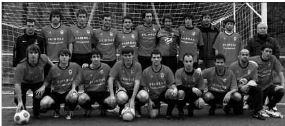
PREFERENTE MAILAKO TALDEAK GOGOTSU JARRAITZEN DU LANEAN.

I. M. Oso pozik gaude jokalarien konpromisoarekin, beti baitatoz entrenatzen. Oso ondo entrenatzen dute, erritmo onean. Partidan gauzak ez dira ateratzen, batzutan guregatik eta bestetan, arbitro-