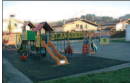
ZUBIETAKO ESKOLA TXIKIKO JOLAS-GUNEA.

Z. E. T. Gurasook, eskolak duen lekufaltarekin arduratuta, Hezkuntza Sailari etorkizunerako bideragarritasun proiektua aurkeztu genion baina ez dugu baiezko erantzunik jaso. Beraz, gaur-