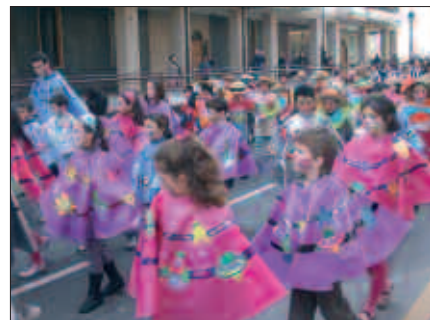
OTSAILAREN 12AN OSTIRALAREKIN IBILIKO DIRA KALEJIRAN UDARREGI IKASTOLAKO IKASLEAK.

11:15 Ikuskizuna Oiarde Kiroldegian. HH, LH eta DBHko ikasleen parte hartzea. Egiptoarrak, bakeroak, sorginak, futbol jokalaria-riak... Guztiak, "Ud-Arregi" zirko-ko kideekin batera kiroldegian bil-duko dira.