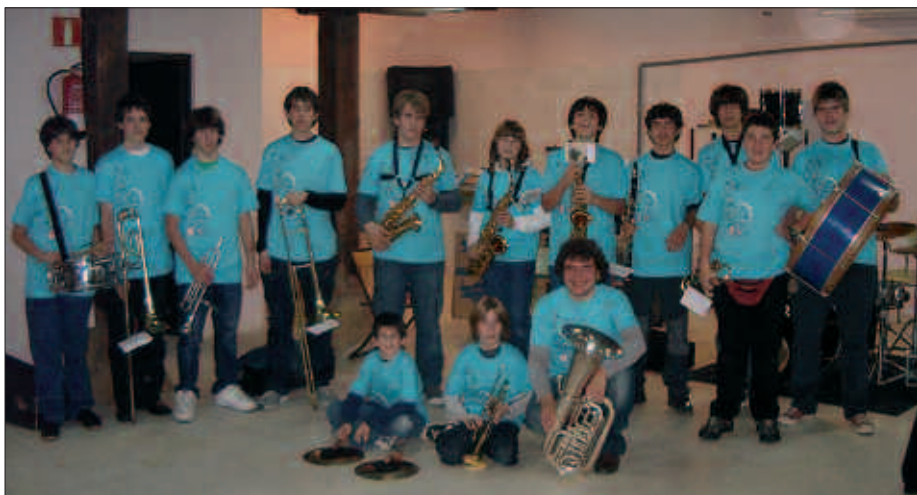
SANTA ZEZILIAKO KALEJIRAN ESKAINI ZUTEN LEHEN SAIDA. LARUNBAT HONETAKO INAUTERI FESTAN, EGUERDI PARTEAN ARITUKO DIRA KALEAK ALAITZEN.

Antolaketa batzordetik, zirkoa da proposatu den gaia, joko asko eman deza-keena.