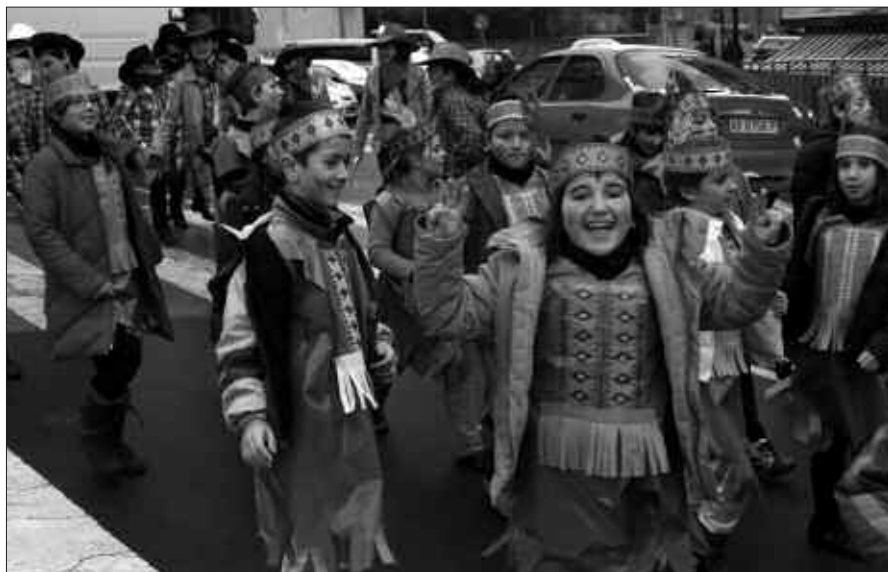
OSTIRALEAN KALEJIRAN IBILI ZIREN UDARREGIKO IKASLEAK.

B akeroak, sorginak, futbolariak, mimoak... edota irudiko indiarrek Kaxkoko kaleak hartu zituzten joan den otsailaren 12an. Udarregi ikastolako irakasle eta ikasleen kalejirarekin ailegatu baitziren inauteriak Usurbila. Eta kaletik, egun batez zirko erraldoian bihurtu zen Oiarde Kiroldegira lekuz aldatu zen festa giroa. Bertan, tradizionala den ikuskizuna eskaini zuten Haur, Lehen eta Bigarren Hezkuntzako ikasleek. Mailaz maila, mozorro klasikoak dantza erakustaldi berritzaileenekin nahastu ziren, eskubaloiko pistan. Artean, harmailak gurasoz beteta zeuden, argazki edota bideo kamera eskutan une onenak jasotzen.