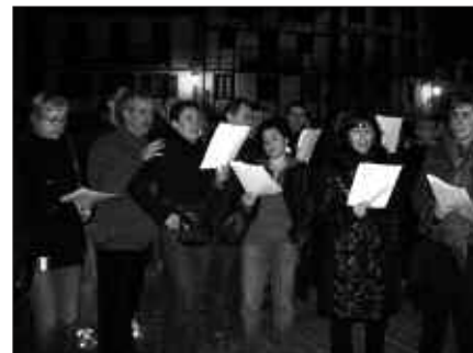
FRONTOITIK ABIATUKO DA KANTU TALDEA.

Kalez kale, tabernaz taberna, errepaso ederra emango diote beste behin, euskal kantutegiari. Herritar