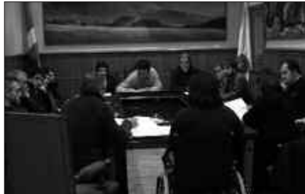
PASA DEN OSTEGUNEAN EZ-DHIKO BILKURA EGIN ZUTEN.

Hainbat inbertsio finantzatzeko 1.200.000 euroko mailegua kontratatzea onartu zuen udalbatzak, otsailaren 11ko ezohiko osoko bilkuran. Abstentziora jo zuen Aralarrek. Alkarbidek eta EAJ-PNV-k aurka bozkatu zuten. Ezker abertzaleak eta PSE-EE-k proposamenaren alde bozkatu zuten.