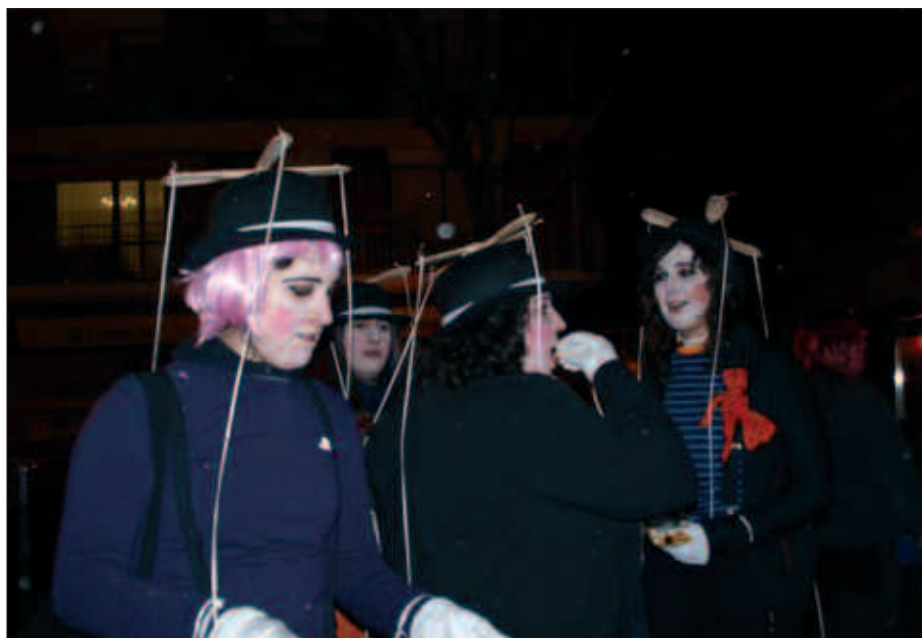
OSO MOZORRO ORIGINALAK IKUS AHAL IZAN ZIREN PASA DEN LARUNBATEKO INAUTERI FESTAN. JAI-GIROA ORDU TXIKIAK ARTE LUZATU ZEN.

Z irkoak bizitu zituen Kaxkoko kaleak otsailaren 13an ospatu zen Inauteri festan. Bizitu eta berotu, hotz galanta egin baitzuen, nahiz lagun koadrilentzat eguraldia festarako oztipoa ez izan. Iluntzean jendetsua izan zen, Ordiziako Burrunbazale txarangaren eskutik ospatu zen kalejira. Kaxko inguruak zeharkatu zituen, taberna paretan geldialdiak eginez. Haiekin batera, pailazoak, zirko animalia desberdinak edota animalia hezleak dantzan. Zumarte musika eskolako ikasleak partaide dituen ZuMartxan txarangaren kalejirak girotu zuen eguerdi parte, hauek ere noski, mozorrotuta. Bazkalaurretik hasitako inauteri festa eta parrandarako gogo gaueko ordu txikiak arte ez zen agortu. Inauterietako argazkiak, noaua.com web gunean ikusgai daude.