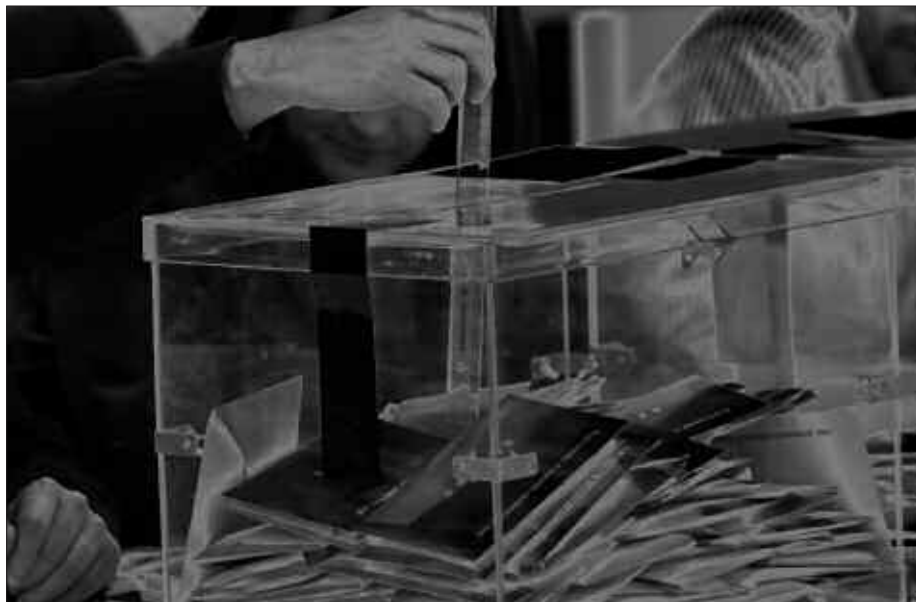
HAUTESKUNDE LEGEAN OINARRITU DUTE HERRI KONTSULTA MARTXAN JARTZEKO PROZEDURA.

Urtarrila amaierako osoko ohiko bilkuran udalbatzak herri galdeketa inguruko prozedura onartu zuen gehiengo osoz. “Berme guztiak jasotzen saiatu gara”, adierazi du udal idazkariak.