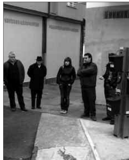
UROLA KOSTAKO UDAL ORDEZKARIAK, USURBILGO ATEZ ATEKOA EZAGUTZEN.

Errekondok gogoan izan zituen bestalde, atez ateko bilketa martxan jartzeko prozesua hasia duten Gipuzkoako beste