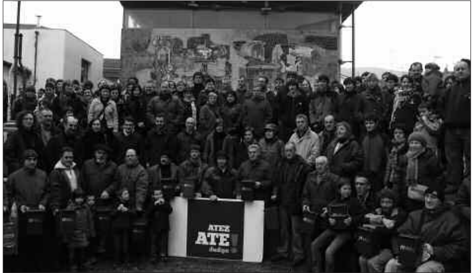
ATEZ ATEKO BILKETA SISTEMAREN ALDE HERRIKO TALDE ETA ELKARTE ASKO AZALDU DIRA; BAITA HAINBAT ERAGILE ERE.

Aurreko astean hasi zen ofizialki herri kontsultaren inguruko kanpaina.