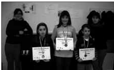
ANDOAINGO PIANO JAIALDIAN DOMINAK LORTU ZITUZTEN IKASLE HAUEK. OSO GUSTORA DAUDE EGINDAKO LANAREKIN.