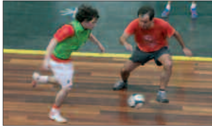
APIRILA BITARTE, ASTEBURURO JOKATUKO DIRA KANPORAKETA PARTIDAK.

Txapelketa apirilaren 24ra arte luzatuko da. Aste Santuan izan ezik, ostiral eta larunbatero beraz, areto futbol txapelketako neurketak pilota-lekuan.