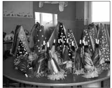
4 URTEKO UMEEK TXAPELAK ETA TURUTAK EGIN ZITUZTEN INAUTERIETARAKO.

Eta turutak berriz, margo bigui- nekin margotu genituen koloretan. Beno, hurrengorarte. Aio!