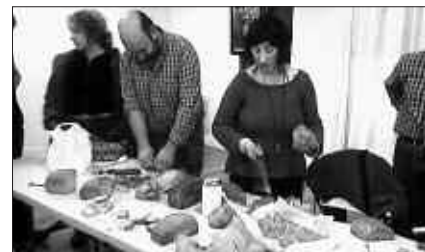
MARTXOKO BILKURAN, OGIA ETA TXERRIKIAK DASTATU ZITUZTEN.

Bilgunean parte hartzen ari diren produktu ekologikoen ekoizle kopurua ugartzen doa. Barazkiekin hasi ziren urtarrilean. Martxoaren 1ean burutu zuten bileran, Usurbiltzen taldeko kideek ogia eta txerriki gordinak dastatu zituzten, irudian ageri den moduan. Apirileko bilkurarako, sagardoa eta gazta ekartzekotan dira. Eta arrautzen lehen banaketa burutuko dute.