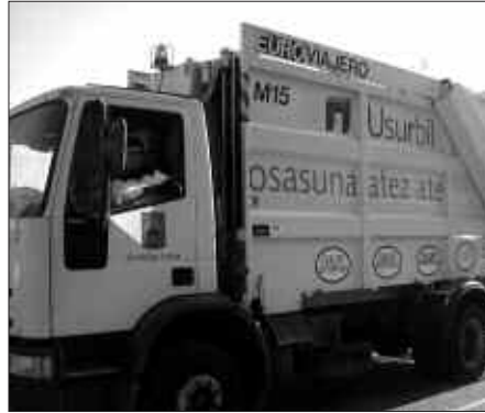
USURBILGO HONDAKIN BILKETA EGIN NAHI DUTE OIARTZUN ETA HERNANIKO UDALEK.

Larunbatean, bezperan lau udalerritan eskaini diren hitzaldiak bateratu eta guztiak, mahai inguru batekin batera, Hernanin eskainiko dira. Jardunaldiotarako gure artera etorritako aditu guztiak Sandiusterrin bilduko dira, "Hondakinen Atez Ateko bilketatik Zero Zaborreruntz" izenburupeko saioan.