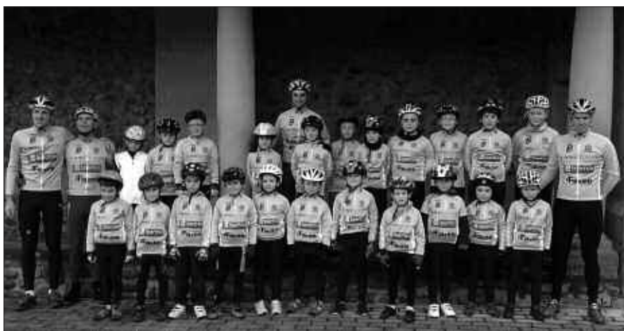
ZUBIETAN EGIN ZEN IKASTURTE HASIERAKO ARGAZKIA. IRUDIAN, BURUNTZAZPIKO ESKOLAKO GAZTETXOAK ETA ENTRENATZAILEAK.

Martxoaren 13an, infantil eta Mjubenil mailako txirrindulari lasterketa izan zen Zumartegi industrialdean. "Urbil" saria egon zen jokoan. Egun horretan bertan, Buruntzazpi Txirrindularitza Eskolako taldearen aurkezpena egin zen. Irudian dituzue denboraldi honetako txirrindulari eta entrenatzaileak. Gogoan izan talde honetan Lasarte-Oria zein Usurbilgo gazteak biltzen direla.