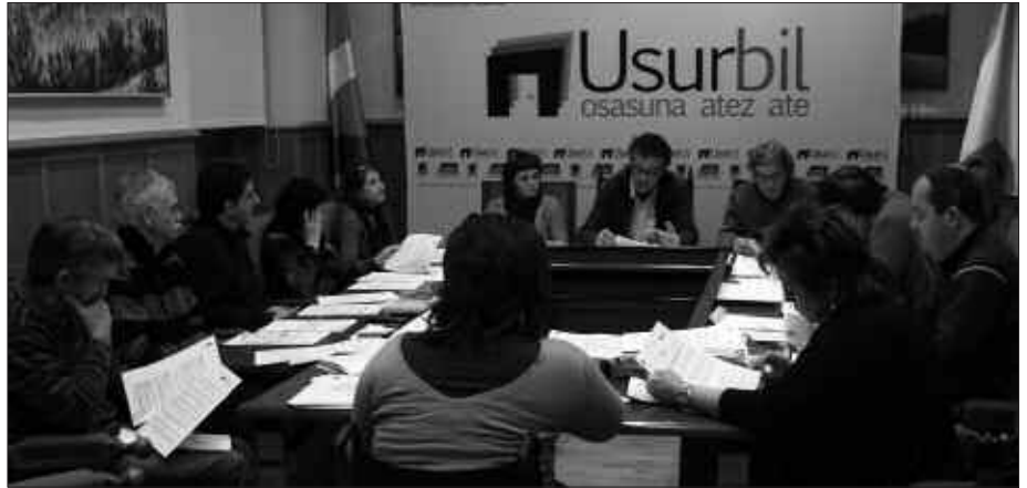
PASA DEN ASTEARTEAN AZTERTU ZEN 2010EKO UDAL AURREKONTU PROPOSAMENA.