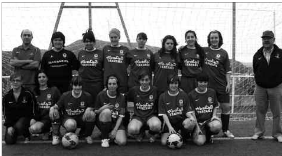
NESKEN TALDEA KOPA JOKATZEN ARI DA EGUNOTAN.