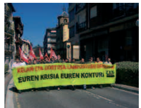
BURUNTZALDE OSOA ZEHARKATUKO DU OSTIRALEKO MARTXAK.

Langileei zuzendutako ekimen hau Usurbilgo Mikel Laboa plazatik abiatuko da, goizeko 9:00etan. Lasarte-Oriara 10:30ean iritsiko da eta handik Urnietarako bidea hartuko dute. Urnietan hamaiketako egin ondoren Hernanira joko dute ondoren. 12:30ak aldera amaituko da LAB sindikatuak deitu duen martxa.