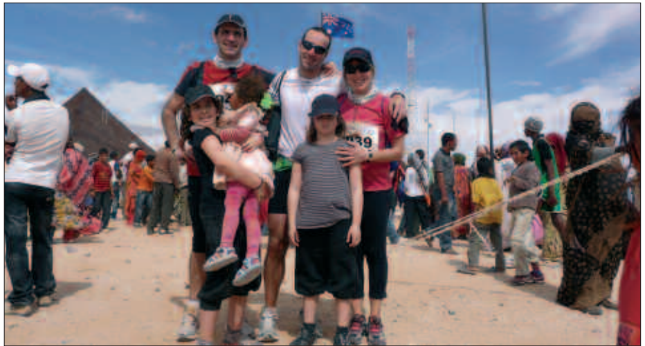
ASTEBETEZ IZAN DIRA SAHARAN.

I. D. Hemengoarekin zerikusirik ez du. Desertuan korrika aritu behar zara, hondar gainean. Hondarra beti ere ez da berdina, leku batzuetan gogorra da, baina bestetan biguna. Zenbat eta lasterketa luzeagoa izan, orduan eta zailtasun edo gogortasun maila handiagoa du lasterketak. Denok abiapuntu desberdina genuen. Lasai hasi ginen, besteak aurrean. Hasieran nora ote zoazen galdetzen diozu zeure buruari. Jendea aurretik doalako, bestela lur eremua berdina denez, ez dakizu nondik zoazen.