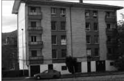
UDARREGI IKASTOLA ONDOAN DAUDE MAIXU ETXEKO ETXEBIZITZAK.

B ost herritarrek aurkeztutako alegazioei erantzun, eta merkataritzako lokalak etxebizitza bihurtzeko udal ordenantza behin betirako onartu zuen udalbatzak, martxoaren 16an burutu zen ezohiko osoko bilkuran. Alde bozkatu zuten Ezker abertzaleak, Aralarrek eta PSE-EE-ko udal ordezkariak. Aurka aldiz, EAJ-PNV eta Alkarbide udal taldekoek.