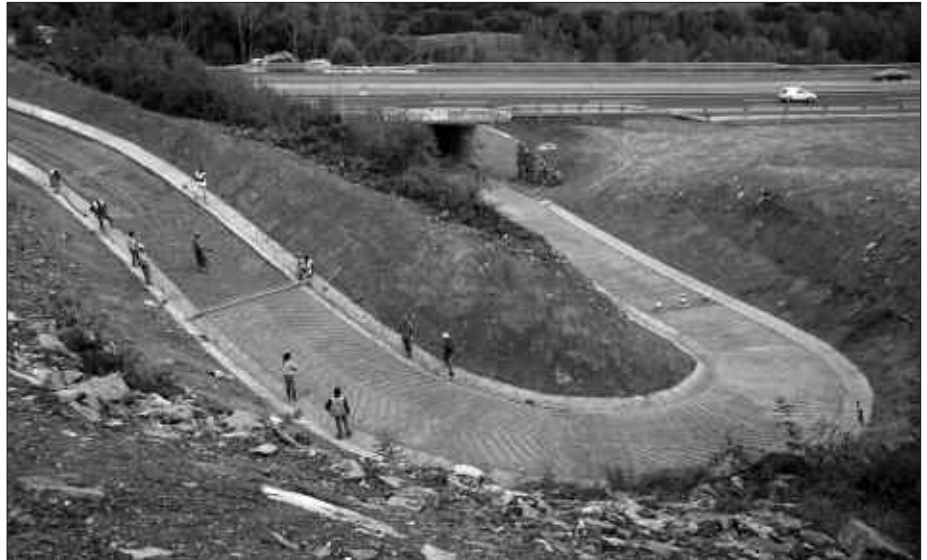
HERRI BIDEEN KONPONKETA-LANAK AMAITZEAR DIRA, UDABERRI HONETAN.

Elkarrizketek emaitza gisa, urte hartako abenduan dokumentu idatzi bat sinatzea ekarri zuten. Alkateak adierazten duenez, "herri bideak garbitu eta zainduko zituztela hitz eman arren, Udalak idatzizko konpromisoa nahi zuen". Zenbait konpromiso hartzen ditu obra zuzendaritzak; hala nola, desjabetutako bideak eta Aginagakoak baino ez dituztela erabiliko, beste bidearik beharko balute jakinaraziko dutela