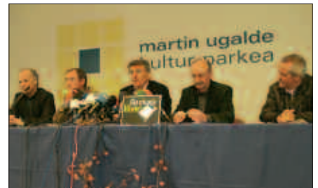
AUZIPETUAK, ASTEARTEAN EGINDAKO AGERRALDIAN.

Zazpi urteotako bidean babesa adieraz dieten guztiak eskertu nahi izan zituzten bost auziperatu ohiek pasa den