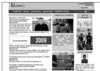
WWW.NOAUA.COM WEBGUNEAN HAINBAT BERRIKUNTZA EGIN DIRA.

2010erako egitasmoen artean, astekariaren diseinu aldaketa burutu nahi da. Baina lehenik eta behin, astekariaren gaineko hausnarketa bat egin nahi da. NOAUA!ren inguruko iritziak bilduko dira eta bazkideek hausnarketan