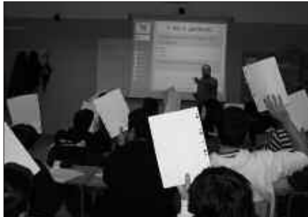
BURUNTZALDEKO LANBIDE HEZIKETAKO IKASLEEK EUSKARAZ LAN EGIN NAHI DUTE.

Baina, usteak erdiak ustel. Hasteko esan behar da, gizakion arteko benetako ezberdintasunak ez daudela azalaren edota ilearen kolorean, hizkuntza eta kulturetan baizik, azken hauek islatzen dutelarik komunitate batek urteetan garatu duen munduaren ikuskera, eta,