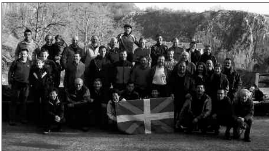
URTERO, OSTEGUN SANTUAREKIN OSATZEN DUTE ANDATZA ETA ARANTZAZU ARTEKO BIDEA.