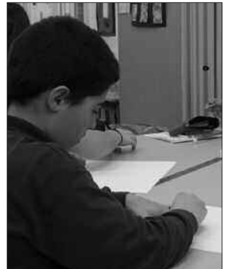
UDALEKUAK UDARREGIN BERTAN ESKAINIKO DIRA ETA IREKIAK IZANGO DIRA.

Ikastolatik jakinarazten dutenez, monitorea etxean hartzen duenak doan parte hartu ahal izango du udalekuetan