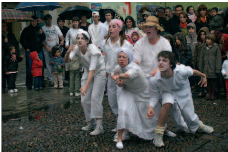
ARGAZKIAN, IAZKO KALE ANTZERKI EGUNeko SAID BAT.

Euskal Herriko txoko desberdinetatik etorritako antzezleek 9 obra ezberdin