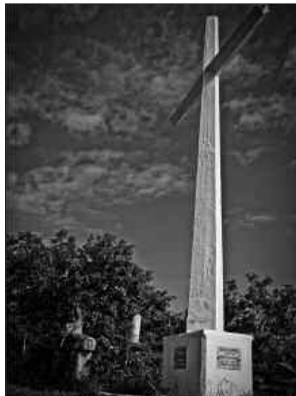
MENDI IBILALDIA KUKUARRITIK IGAROKO DA.

Irteera: Andatza Mendizale Elkartearen egoitza aurretik irtengo da ibilaldia (Udaletxe plaza).