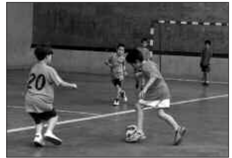
MAIATZEAN HASIKO DA USURBIL CUP, BAINA ALDEZ AURRETIK IZENA EMAN BEHAR DA.

Jokalarien artean elkar laguntza eta elkarbizitza bultzatu, irabazi eta galtzea zer den ikasi eta jokalariei bakoitzaren autonomia ere landu nahi da. Tentsio, exigentzia edota antsia eragin dezaketen jarrera desegokiak baztertu eta kiroltasuna, jokalariei zuzendutako mezu baikorrak, eta lasaitasuna bultzatu nahi dute partidetan. Sor litezkeen gatazketan bitartekari edota oreka lanak burutzeko antolatzaileek ezinbestekotzat jotzen dute kasuan kasuko entrenatzaile eta gurasoen laguntza. Antolatzaileak ere noski, halako jarrerak zaintzeko lanetan jardungo dute, txapelketak iraun artean.