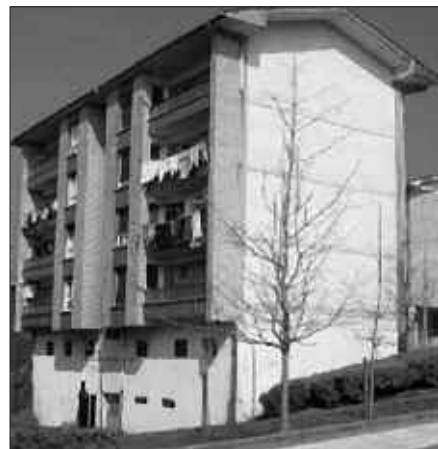
UDARREGI ETA AGERIALDEKO IKASTOLEN ARTEAN DAGO MAIXU ETXEA.

Lehiaketan parte hartzeari dagokionean, etxebizitza babestuetara aurkezteko ohiko baldintzak bete behar dira: etxebizitzarik ez izatea, diru-sarrera jakin bat... Beharragatik bada, etxebizitza duten herritarrek ere aurkez litezke lehiaketara, baina alokairuko etxebizitza egokitzuz gero, berea errentan jarri beharko dute.