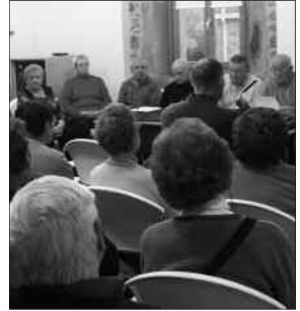
ETXEAN SUAREN ARRISKUAZ HITZ EGINGO DA ASTE HONETAKO HITZALDIAN.

G omendioak, informazioa eta batez ere, osasuna hizpide izango dute Gure Pakea elkarteak eta Kutxak apirilera antolatu dituzten hiru hitzaldietan. Denetariko gaiak jorratuko dituzte; saio batean, komunikazioa eta laguntasunak duten garrantzia, bestean suaren prebentzioari buruz jardungo dute edota gorputz zainketen gaia ere jorratuko dute. Hitzaldiak ordu eta leku berean izango dira, 17:30ean Artzabalgo egoitzako areto nagusian.